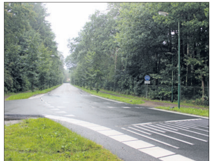
Het verbindingsdeel tussen de Gezichtslaam en de Professor Bronkhorstlaan is later aangelegd.

bouwactiviteiten in Midden-Nederland. Van heinde en verre stromen kooplustige Nederlanders naar dit villadorp: 'slechts één uur sporen verwijderd van Rotterdam, Den Haag, Arnhem en Den Bosch en slechts driekwart uur van Amsterdam. Dit is de ideale woonplaats voor zakenmensen, die zich na een dag van hard werken willen verpozen in deze prachtige streek, waaraan moeder Natuur zoveel kostbare gaven heeft geschonken'. Het betreft de nieuwe villaparken Ridderoord, met de Gezichtslaam als centrum, geflankeerd door de nieuwe Van der Helstlaan, de Hobbemalaan en de Albert Cuyplaan, het villapark Drakensteijn met de Laurillardlaan en de Beetslaan en het Oosterpark met de Beethoven-, Mozart-, Sweelinck-, Haydn, Schubert- en Wagnerlaan. Alle lanen zijn uitgefreesd in de jonge productiebossen, waarvan de bomen veertig jaar eerder waren