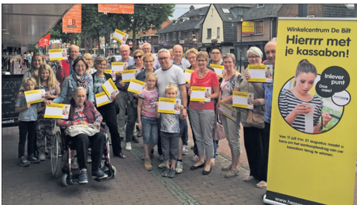
Aangezien er een gedeelte inmiddels op vakantie is staan niet alle prijswinnaars op de foto.

kelcentrum worden ingeleverd bij Albert Heijn, Bouwman Boeken, Eye Wish Opticiens, Keurslagerij Van Loo of The Readshop. Het is ook mogelijk om kassabonnen in te leveren via www.hessenweg-looydijk.nl .