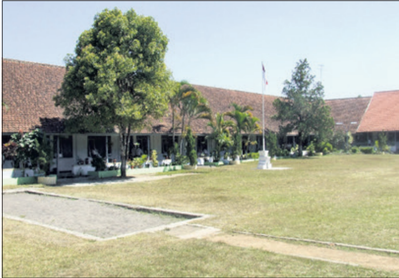
Het oude gedeelte van de school. Rechts is een vleugel aangebouwd.

Het leek een gemakkelijke opgave. De stad Moentilan (Muntilan) in Midden-Java werd eenvoudig gevonden, maar de veronderstelling dat iedereen het voormalige jappenkamp wel zou kennen was te optimistisch gedacht. Indonesië heeft een jonge bevolking en het gaat over een tijd uit een ver verleden. Het enige aanknopingspunt was dat het kamp een voormalige katholieke kweekschool was.