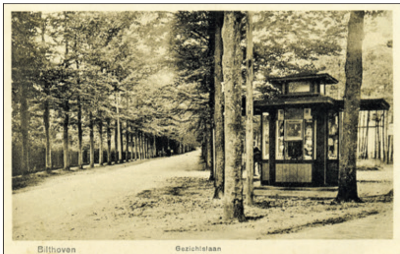
Op de kaart uit 1928 staat een kiosk die behoorde bij Hotel de Leyen. De kiosk staat op een soort eilandje. De weg links is de Gezichtslaam. Tot 1966 heeft het bouwsel midden op de aansluiting Gezichtslaam-Soestdijkseweg gestaan. Korte tijd bood het onderdak aan wachtende buspassagiers. Het gebouwje werd in 1966 gesloopt.

In 2010 zijn er nieuwe fietspaden aan het noordelijkst deel van de Gezichtslaam in Bilthoven aangelegd, waardoor de veiligheid voor weggebruikers en de overstek voor dassen aan de Gezichtslaam en de prof. Bronkhorstlaan sterk verbeterd is. De Stichting Utrechts Landschap lette daarbij speciaal op het behoud van de groene kwaliteit. Een subsidie van