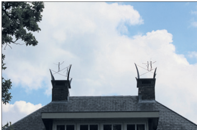
De huidige bewoners vonden destijds, dat de schoorstenen een soort 'bekroning' verdienden. Dit is het ontwerp van een viertal evenwichtskunstenaars, die balanceren op een viertal horizontale 'touwens'. Het zijn dus eigenlijk vier koorddansers.