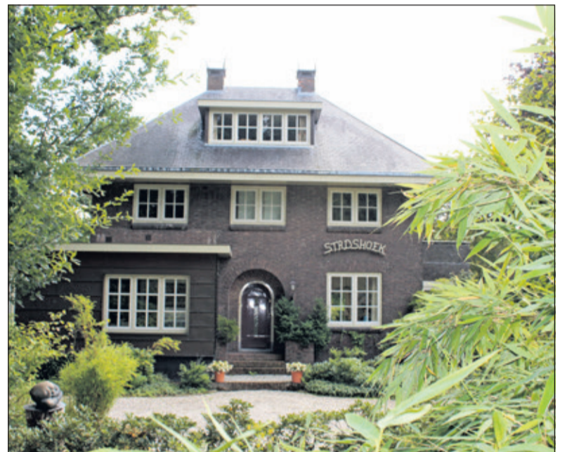
Volgens de huidige bewoner is de naam Stadshoek ongetwijfeld gekozen, omdat dit huis het laatste huis is van de gemeente Utrecht, voor je de gemeente De Bilt in fietst. De noord- en oostzijde van fort Blauwkapel grenzen nl. aan de gemeente de Bilt. De huidige bewoner van Stadshoek is ook actief bij het organiseren van grootschalige activiteiten op het fort en geeft daar in een historisch uniform rondleidingen.

Bronnen: Tijdschrift St. Maarten Bestemmingsplan Groenekan 2009 (Historische vereniging Maartensdijk), verzameling G. Blankenstein, Anne Holvast, Koos Kolenbrander, van de gemeente De Bilt.