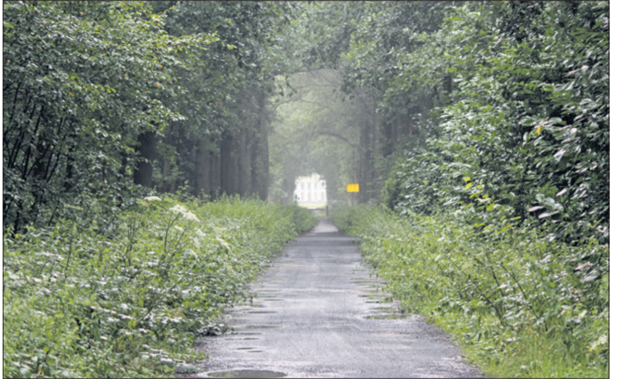
Ook na een regenbui blijft de zichtas op/vanaf Eycenstein via de Oude Gezichtslaam zichtbaar.

Ook de bossen ten noorden van de N234 (bekend onder de naam Eijckensteinse Bossen) dreigden dus in een villapark te veranderen. Langs de Gezichtslaam werden bouwpercelen al kadastraal vastgelegd. Jhr. W.H. de Beaufort, grondbezitter en medeoprichter van de informele actiegroep Provinciaal Utrechts Comité voor Natuurbehoud, dringt naar aanleiding van de dreiging bij de commissaris der koningin in de