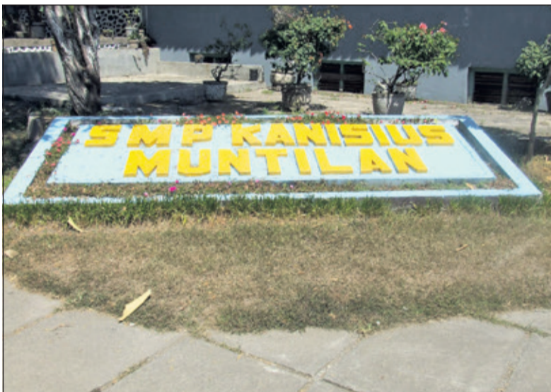
Het voormalige kamp is nu de school SMP Kanisius..