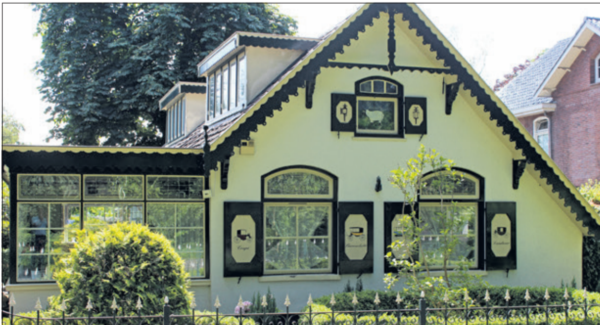
De winkel is verbouwd tot huiskamer, er zijn rijtuigen op de luiken geschilderd en er is een sierlijk hek geplaatst.