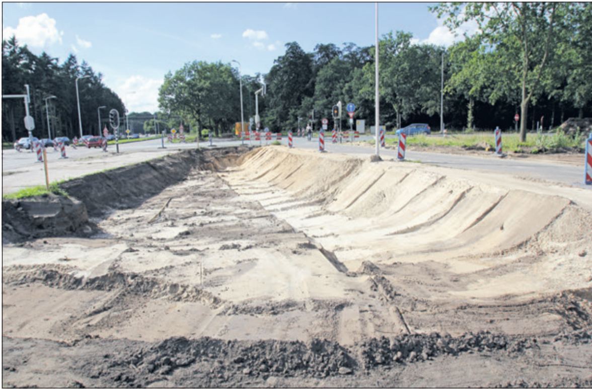
Stand van zaken op vrijdag 5 augustus.

Tot 19 september voert de provincie Utrecht wegwerkzaamheden uit rond het kruispunt Vollenhoven (N237) in De Bilt. Door het kruispunt anders in te richten en een fietstunnel aan te leggen, verbeteren de doorstroming en de verkeersveiligheid. Om de werkzaamheden te kunnen uitvoeren, moet de weg periodiek worden afgesloten.