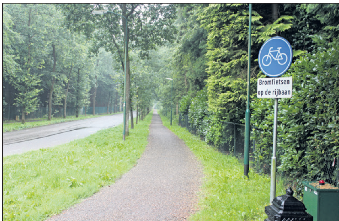
In 2010 zijn er nieuwe fietspaden aan het beide zijden van het noordelijkst deel van de Gezichtslaam aangelegd.

provincie Utrecht aan op de oprichting van een rechtspersoon die bedreigde natuurterreinen veilig kan stellen. Vervolgacties leidden tot de voorbereiding van een stichting om de bescherming van het natuurschoon in de provincie Utrecht te bevorderen. Er worden statuten ontworpen op basis van de grondregels van de Vereniging Natuurmonumenten en het is deze vereniging die op 9 maart 1927 de Stichting Het Utrechts Landschap (HUL) opricht.