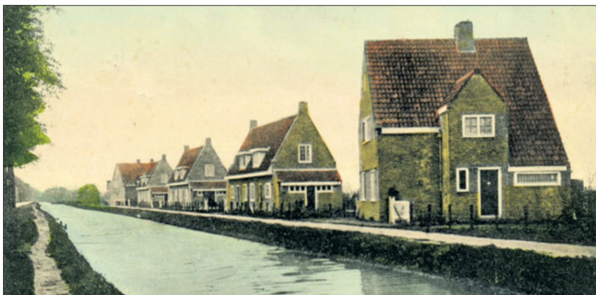
Groenekan werd uitgebreid langs de Maartensdijkse Vaart, waar het Rode Dorp verrees.

daan' dat zich ten noorden van de Groenekanseweg ontwikkelde een belangrijke rol. Het landgoed ontwikkelde zich in de loop van de 17e eeuw tot een wandelpark voor de stad Utrecht. Tussen 1892 en 1920 werd de aanleg van de landschapstuin op Voordaan afgerond.