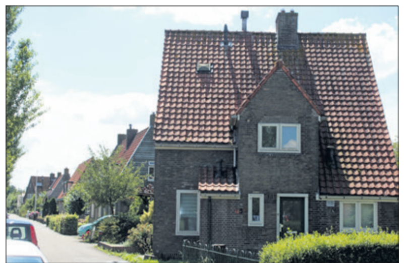
94 jaar later, maar (de dakpannen) nog even rood.

dijk, had in die periode een vrij goede ligging. De buurtschap stond direct in verbinding met de kernen De Bilt en Zeist. In de kern speelde in die periode het landgoed 'Voor-