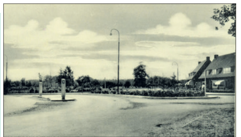
Deze opname uit 1938 toont de bocht vanaf de Hertenaan naar de Eerste Brandenburgerweg. Rechts ligt de Oude Brandenburgerweg. De huizen rechts liggen aan de Duivenlaan. Onder het wolkendek ligt nog agrarisch gebied.