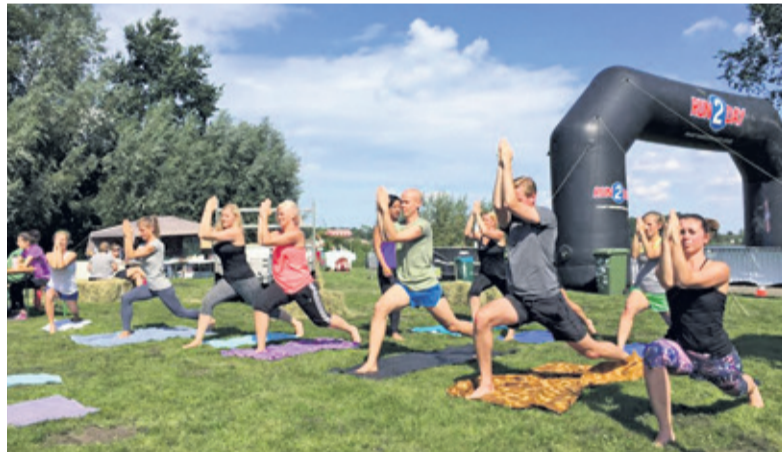
Op het sportfestival in Maarsseveen zijn tevens diverse workouts te volgen.

Vorig jaar was het sportfestival bij de Maarsseveense Plassen een groot succes. Het sportaanbod van het sportfestival is flink vergroot. Het koningsnummer is de Aquathlon, deze bestaat uit 5 km hardlopen, gevolgd door 500 meter zwemmen om tot slot te finishen op de biologische braderie. Verder kunnen deelnemers zich inschrijven voor de 5k, de 10k en de 15k. Naast de recreatieve hardloophwedstrijden kunnen deelnemers zich dit jaar ook inschrijven voor verschillende workouts zoals, bootcamp, yoga aan het water en pilates. Voor de kinderen is er dit jaar een speciale Kids Obstacle Run, met een mooie finish. Ook voor sportieve ouders met sportieve kinderen worden er dit jaar workouts georganiseerd. Verder is er voor de kleine sportertjes een springkussen en een schminkhoek.