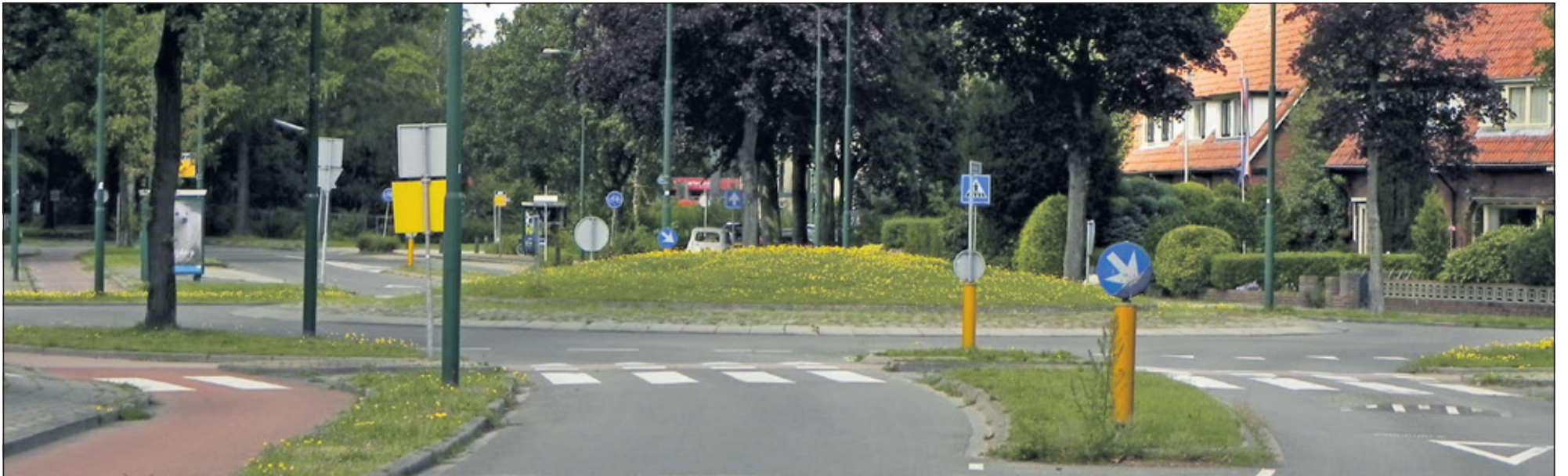
De huidige situatie toont aan hoe wij inmiddels verstedelijkt zijn.