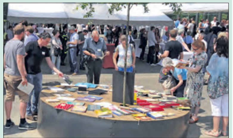
Gezellige drukte op het schoolplein.