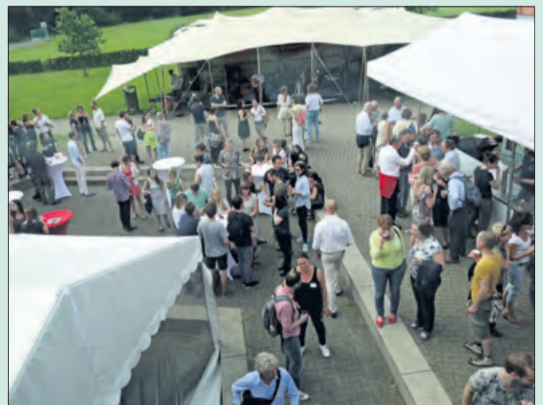
Oud leerlingen van de Werkplaats ontmoeten elkaar buiten.