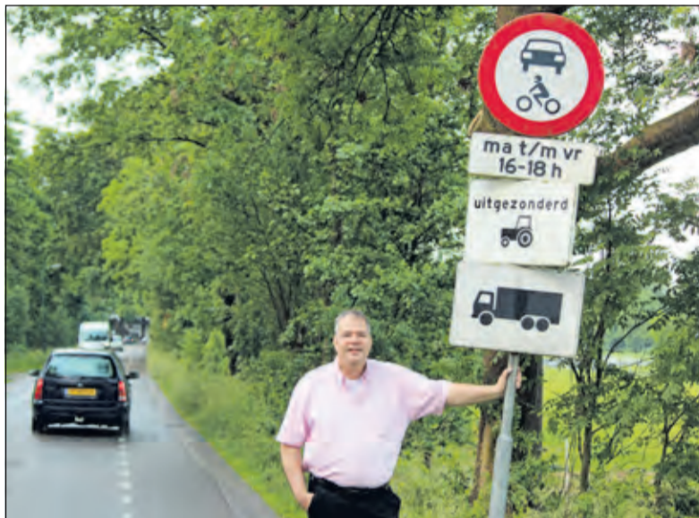
Beter de Bilt maakt zich hard voor handhaving van de geslotenverklaring in Westbroek.

Schlamilch: 'Er bestaat al 5 jaar een brief van het College van Procureurs-generaals, die stelt dat boa's hierop wél mogen handhaven indien dit wordt gedaan in het kader van de openbare orde. Ook schrijven de Procureurs-generaal daarin expliciet, dat onder openbare orde ook sluipverkeer moet worden verstaan. Omdat deze brief ook in de Staatscourant heeft gestaan (18