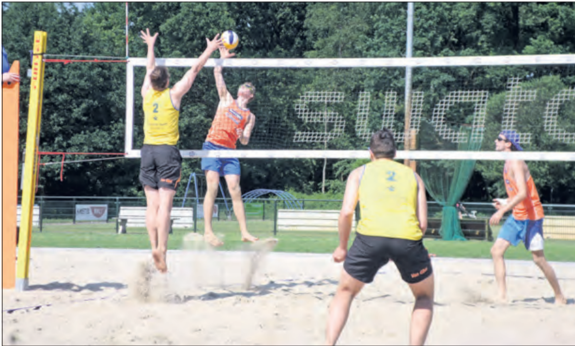
Winnaars 1e Divisie in Actie.

Afgelopen weekend was het een druk weekend voor Irene Beach. Enerzijds was er een de jaarmarkt met de volleybal-bus en daarnaast was er zowel op zaterdag als op zondag een divisie-toernooi.