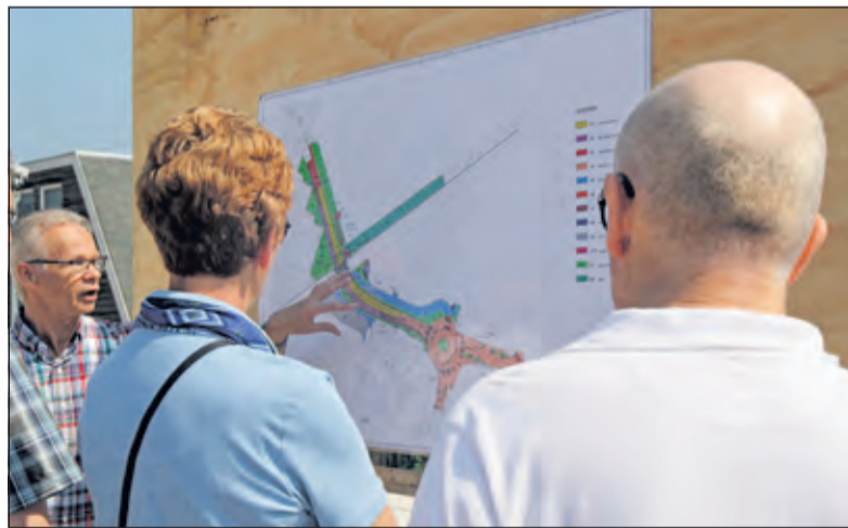
Uitleg over de bypass naar winkel en woonwijk.

Mede door het prachtige weer was er grote belangstelling op deze kijk-spoorovergang-dag. Iedereen vond het indrukwekkend, om