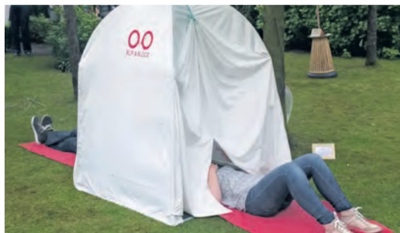
Daten op je rug met visueel contact via de spiegel in de tent.