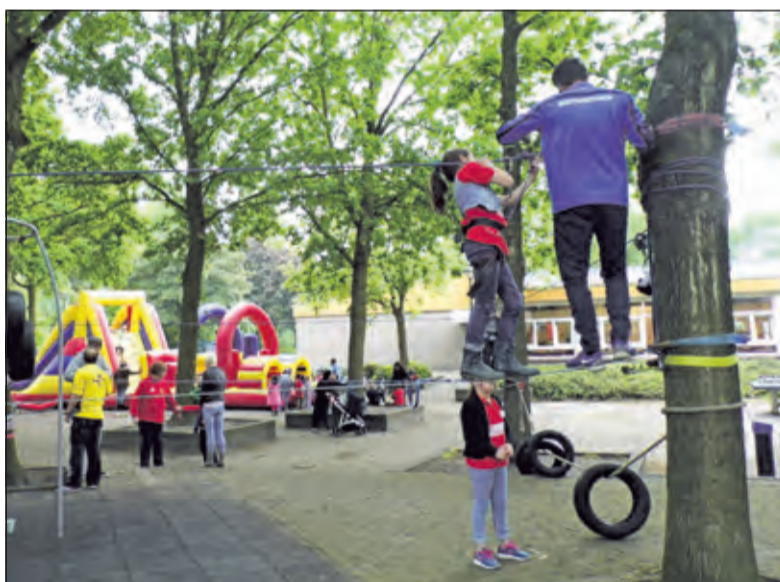
Stoer parcours tussen de bomen op het schoolplein.