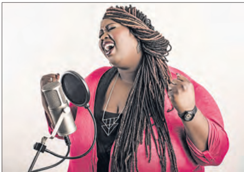
Festival Bombarie staat voor vier dagen kunst maken en beleven.

Voor lezers van De Vierklank is een beperkt aantal vrijkaarten beschikbaar. Stuur een mail naar info@vierklank.nl om hiervoor in aanmerking te komen.