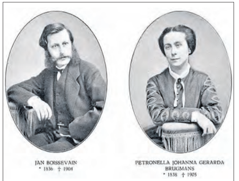
De voorouders van het echtpaar zijn de oud eigenaren van Jagtlust.

Het diamanten huwelijksfeest vierden ze op 4 juni in restaurant De Biltse Hoek.