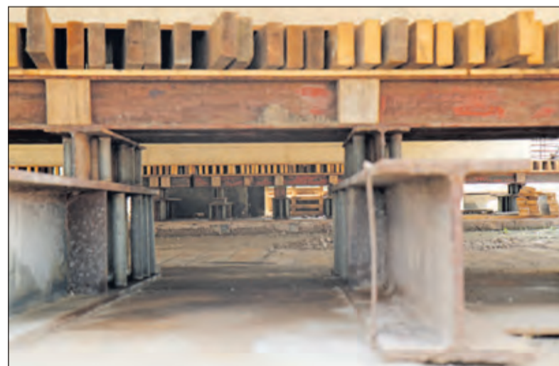
De onderkant van het brugdeel voor de treinen; dit wordt later op zijn plek gereden en gedraaid (foto Wim Westland).

te zien wat er is gedaan en nog te doen staat: het zal nog een hele klus worden alles op z'n plaats te krijgen. Er was koffie en thee naast limonade; een verfrissing en een verademing, want boven op het brugdeel was het wel erg warm. [HvdB]