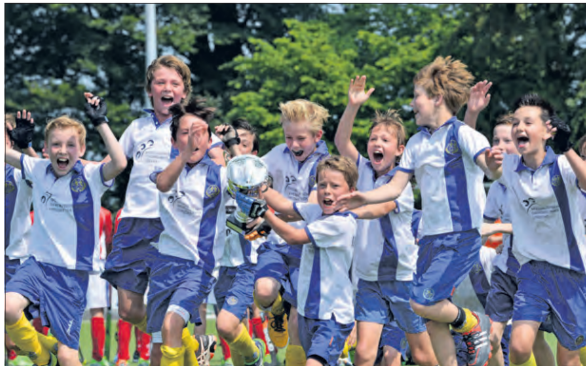
Uitbundige vreugde bij de districtskampioenen.