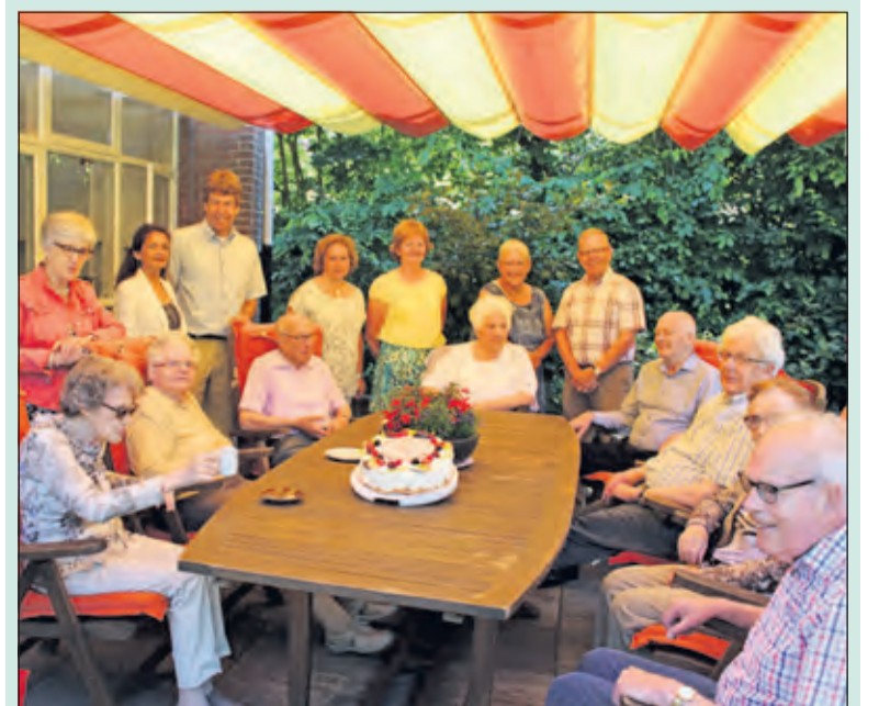
Clënten, medewerkers en vrijwilligers vieren de mooie uitslag met een heerlijke taart.

Het hele team van Beth Shamar is erg blij met de waardering die cliënten en mantelzorgers gaven. De score 8,8 bevestigde dat het voortdurende streven naar excellentie in een gecombineerde sfeer van professionaliteit en gemoedelijkheid in een prachtige omgeving bijzonder gewaardeerd wordt. ‘Tegelijkertijd is dit ook een bewijs dat het nog steeds mogelijk is om kleinschalige zorg & begeleiding aan te bieden in Nederland’, aldus het gehele team van Beth Shamar. [HvdB]