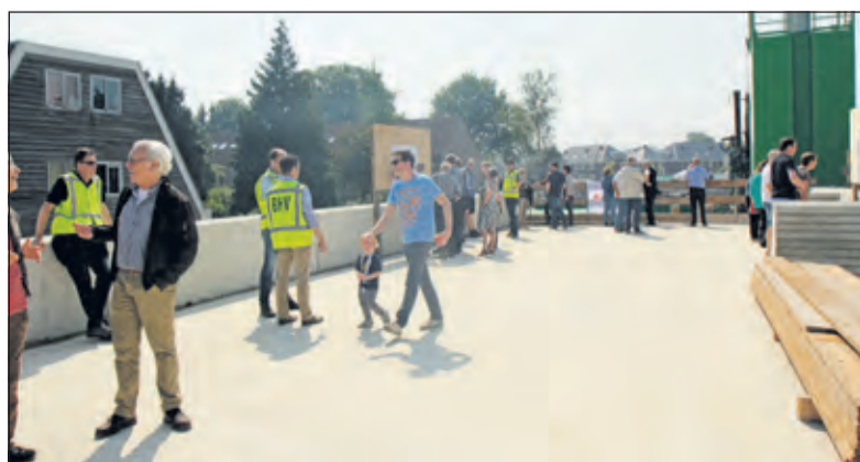
Grote belangstelling; vooral de vraag: 'Hoe nu verder?'.