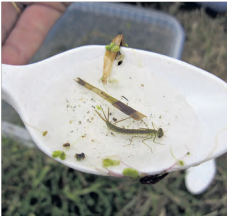
Een van de slootjesbewoners: De larve van een waterjuffer!