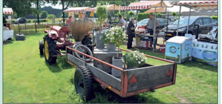
Vele stands prezen hun biologische producten aan op het terrein van Landwinkel De Groenekan. De Open Dag werd erg goed bezocht en genoten tijdens het mooie weer van het uitgebreide aanbod.