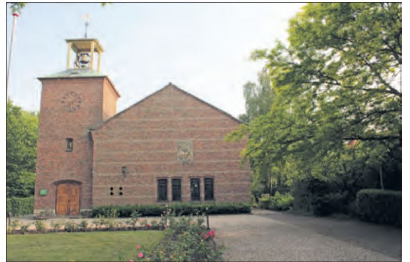
Op 25 november 1953 werd de kerk in Groenekan in gebruik genomen.. De doopboeken, trouwboeken en lidmatenregisters van de kerk gaan terug tot 1640. Het orgel dateert uit 1865.