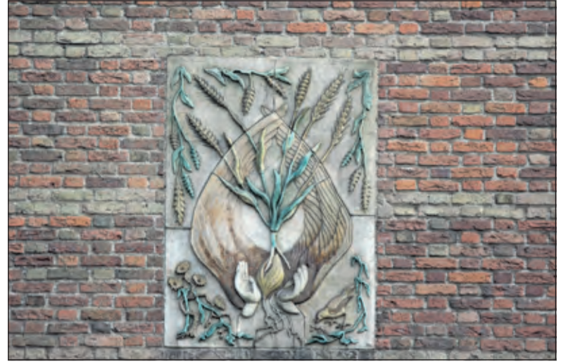
De aardewerk plaquette aan de voorgevel beeldt de gelijkenis uit van de Zaaier uit Mattheus.

Op zaterdag 11 juni 2016 worden in de kerk in Blauwkapel en vervolgens in de kerk in Groenekan bijeenkomsten georganiseerd, waarbij de bijzondere overdracht van het archief van de hervormde gemeente Blauwkapel-Groenekan aan het Regionaal Historisch Centrum Vecht en Venen centraal staat. Deze overdracht is gevat in een bij de kerk (en het archief) passend programma met een overdenking en orgelmuziek. Het Utrechtse klokkenluidersgilde zal de klok van Blauwkapel luiden. De consultant van de Hervormde gemeente Blauwkapel-Groenekan, ds. Baan draagt tijdens de bijeenkomst in het kerkje Blauwkapel het oudste