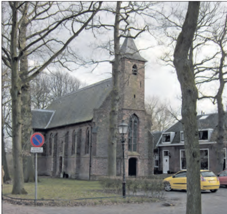
Archiefphoto uit 2005 van de kerk in Blauwkapel.