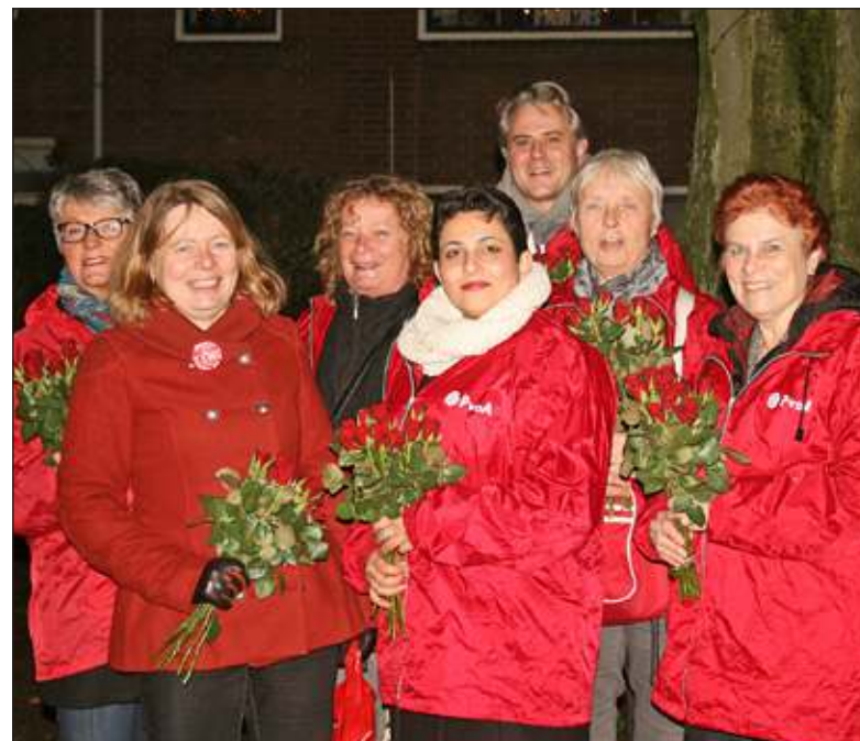
Als de PvdA op pad gaat, zijn de rozen erbij.

Vaak verloopt de samenwerking tussen buurtbewoners en gemeentelijk instellingen op een prettige wijze. Maar soms ook blijkt dat er niet aan de verwachtingen van de inwoners wordt voldaan. In de omgeving van het H.F. Witte sport- en zalencentrum deed men enthousiast mee aan een experiment om hondenbezitters te gebruiken als extra ogen en oren van de politie. In deze buurt deden veel hondenbezitters mee. Met een flink aantal