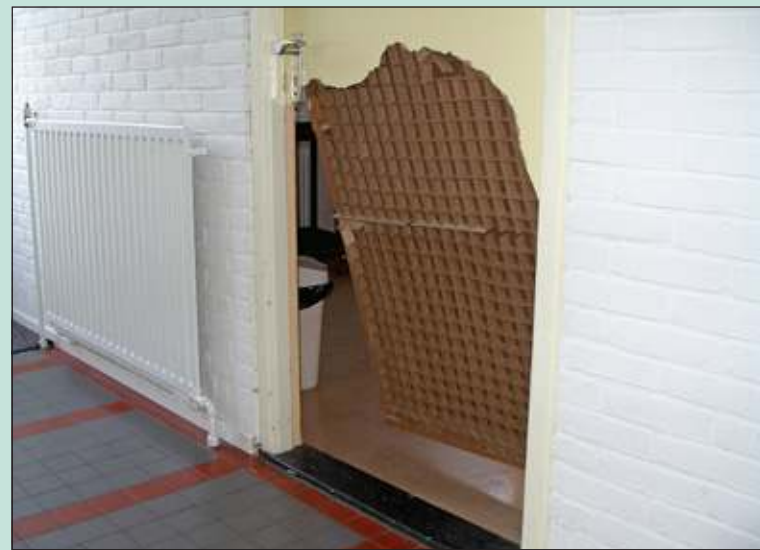
De materiële schade is het grootst.

Via de achterdeur zijn ze binnen gekomen en waar nodig hebben zij zich met geweld toegang tot de ruimten verschaft. Daarnaast zijn ook kasten geforceerd: meegenomen zijn een beamer, een radio en wat kleingeld. Doordat de inbrekers veel kapot hebben gemaakt is die schade de grootste kostenpost. De vrijwilligers binnen de kerk moeten gelijk in het nieuwe jaar veel werk verrichten om alles weer bruikbaar te maken.