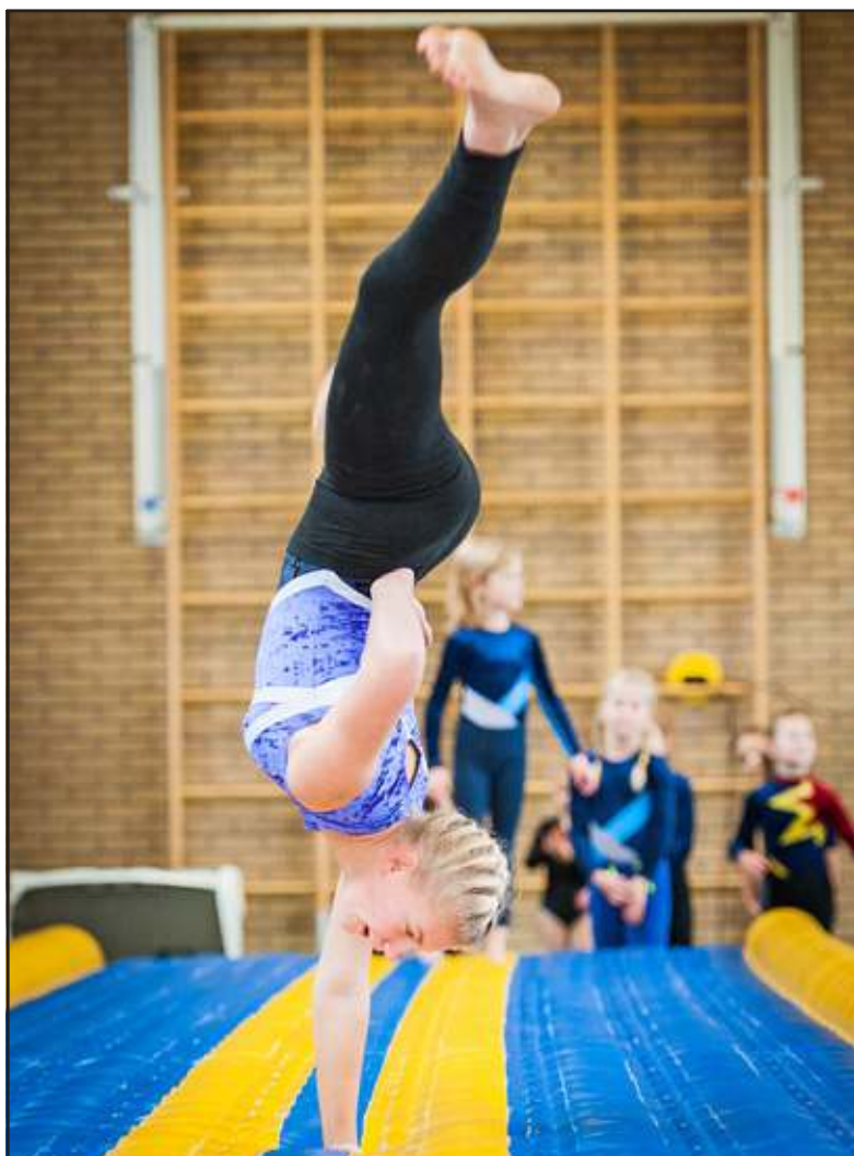
Op de tumblebaan kan je meer dan je denkt.

De doeken bleken een enorme aantrekkingskracht te hebben op kinderen en ook jonge kinderen bleken