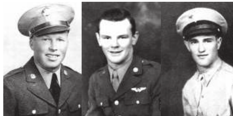
De drie omgekomen bemanningsleden van de B-17

aan, tegenover de boerderij van De Kruijff (ook toen al een JOP). Wat later die avond kwamen de Duitsers de lijken met een handkar ophalen. Ze hadden een kleed over de lichamen heen gelegd, maar we zagen de neuzen van laarzen uitsteken. Eén Duitser liep voorop, het geweer geschouderd. Ze verdwenen in de richting van de Utrechtseweg (nu de Koningin Wilhelminaweg). 'Dinsdagmiddag na Pinksteren zaten we aardappels te rooien op een stukje weiland van Westeneng achter de Oranjelaan. We konden het vliegtuigwrak zien liggen. De Duitsers waren het aan het slopen, toen het wrak tot ons groot leedvermaak opnieuw in brand vloog.'