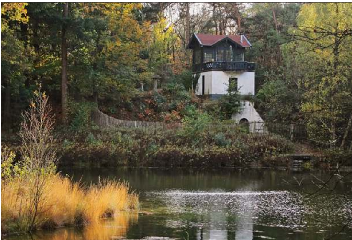
Een foto van het bosmeertje in landgoed Heidestein in Zeist.

Maandag 13 januari heeft de fotoclub het thema 'eigen werk' op het programma staan.