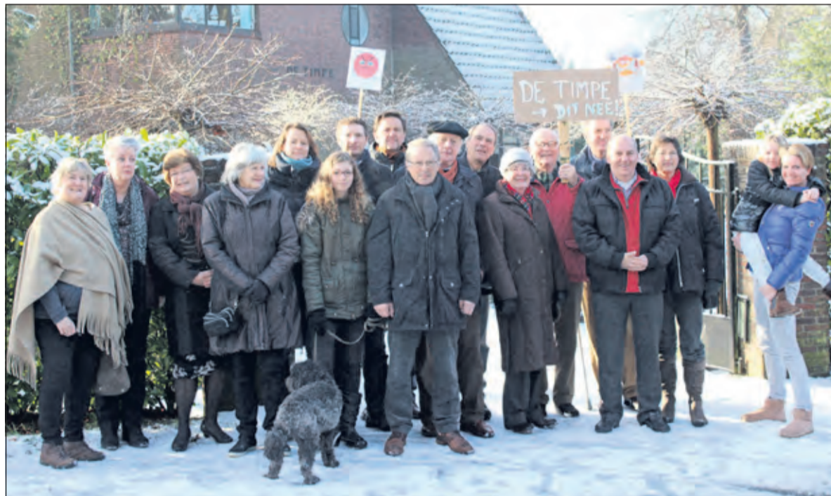
Schouder aan schouder in januari 2015: vertegenwoordigers van de samenwerkende belangengroepen naast verontruste buurtbewoners.

en aanzienlijke parkeerproblemen. Met gevaarlijke situaties met name in de ochtendspits voor de 3500 fietsende scholieren die daar voorbijkomen. De Raad van State heeft nu uitgesproken dat in het bestemmingsplan een bepaling opgenomen dient te worden dat de congrescapaciteit in het plangebied De Timpe beperkt tot maximaal 1800m 2 .