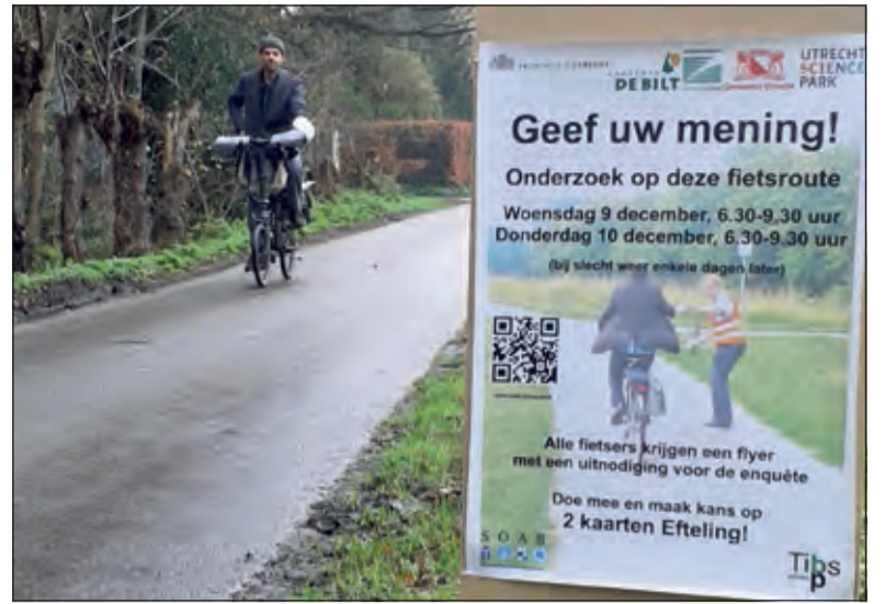
Grote posters langs de fietsroute attenderen voorbijgangers op het onderzoek.

Bij slecht weer schuift het onderzoek enkele dagen naar achteren. Ook fietsers die de route op andere dagen dan 9 en 10 december gebruiken, kunnen de enquête invullen. Op het web is deze te vinden onder soab.nl/usp-zeist