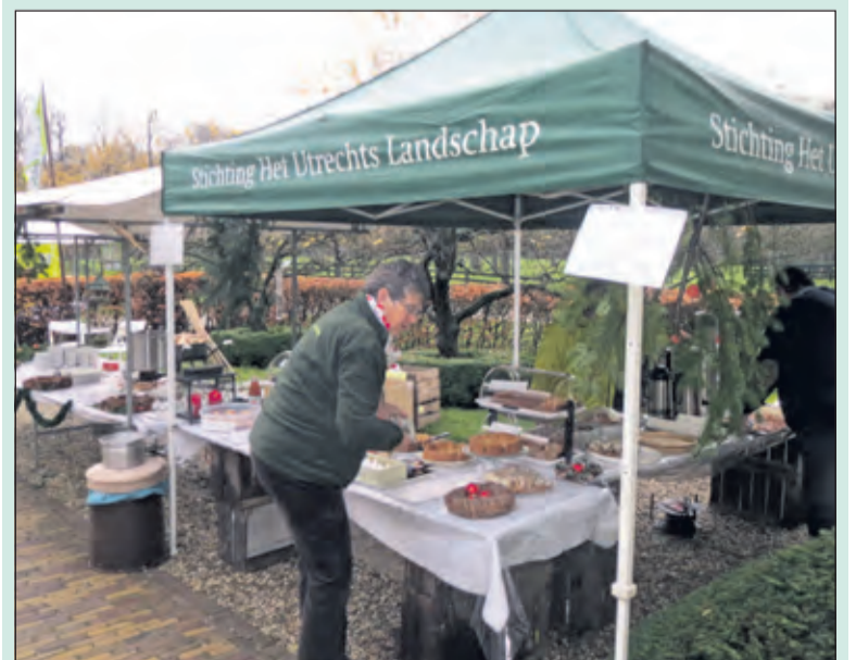
Stichting het Utrechts Landschap is aanwezig op de kerstmarkt.

Landgoed Oostbroek ligt verscholen achter het Wilhelmina Kinder Ziekenhuis in De Uithof, Bunnikseweg 45a te De Bilt.