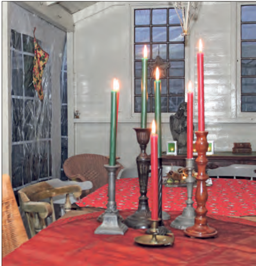
Ook in 2014 hield Theetuin Bilthoven een Kerstinloop.

Het winkeltje staat vol met kerst hebbedingetjes o.a. oude kerstversieringen, curiosa en brocante. Ook zijn er weer heerlijke lekkernijen waaronder vele aparte jams. Er staan leuke vogeltaartjes alsmede kerststukken en –kransen en wolpakketten met patroon. Er koffie en/of thee met home made gebak en vegetarische bonensoep. Toegang gratis.