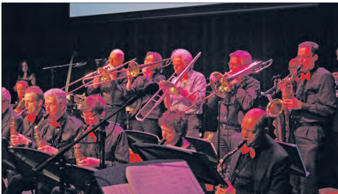
Zaterdag 12 december is er een dubbelconcert van de Bigband Biltse Muziekschool (foto) en de Indigo Big Band uit Nieuwegein.

Aanmelden voor de workshop via de ticketshop van het KunstenHuis.