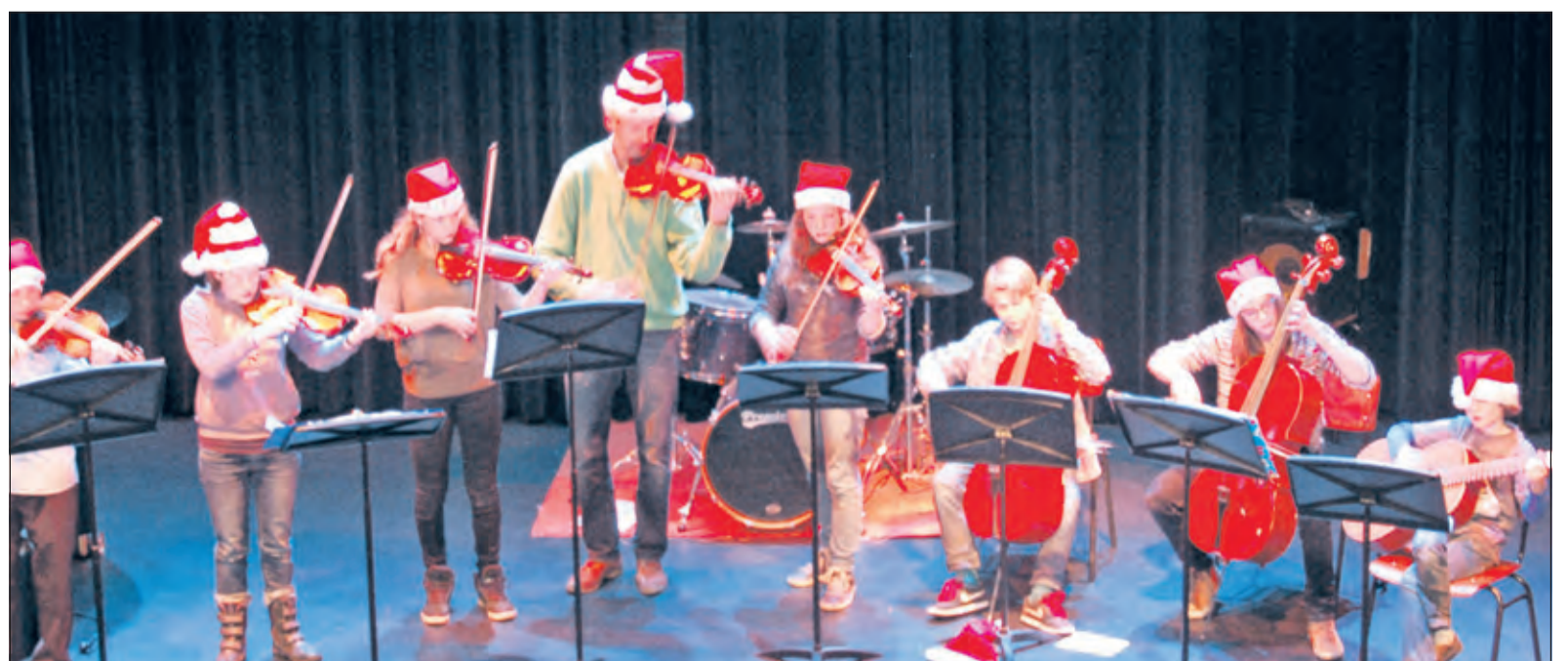
Kerstconcert in stijl.

De aanvang is om 19.30 uur; kinderen t/m 17 jaar hebben gratis toegang. Kaarten en info via www.kunstenhuis.nl of 030 2283026 (ma-do 15.00-19.00u).