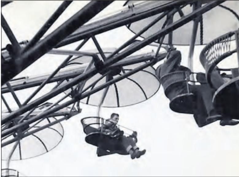
De eerste foto van Marijke van der Lubbe: 'Mensen op de kermis'.

Fotoclub Bilthoven bestond dit jaar 35 jaar: de vereniging is opgericht op 5 juni 1980. De ongeveer 60 leden tellende club, komt iedere 2e en 4e maandag van de maand bij elkaar. Naast de gewone programmaonderdelen is er ieder jaar een Fotosafari en een Expositie.