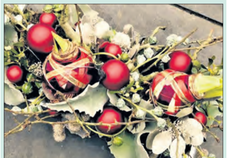
Met wat handige tips knutsel je de mooiste kerststukken.

Aanmelden is niet noodzakelijk. Toegang voor Groei & Bloei leden gratis. Vindt u het leuk om zelf aan de slag te gaan. Gebloemd verzorgt in samenwerking met Kwekerij van Vulpen uit Groenekan en Flower Moment uit Baarn tussen 7 en 22 december verschillende workshops in de sfeervolle winterse kas van de kwekerij tussen de Groenekanse kerstbomen!