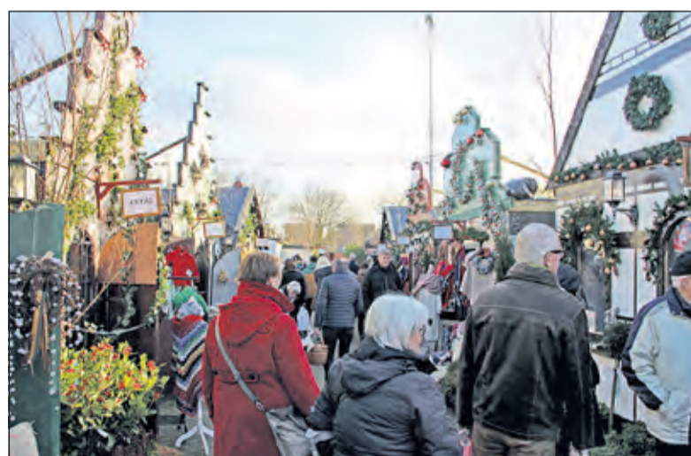
Ook zonder sneeuw kom je helemaal in kerststemming.

De intentie van de Warme Witte Winter Weken is om de bezoekers, vaak gezinnen, families of groepen,