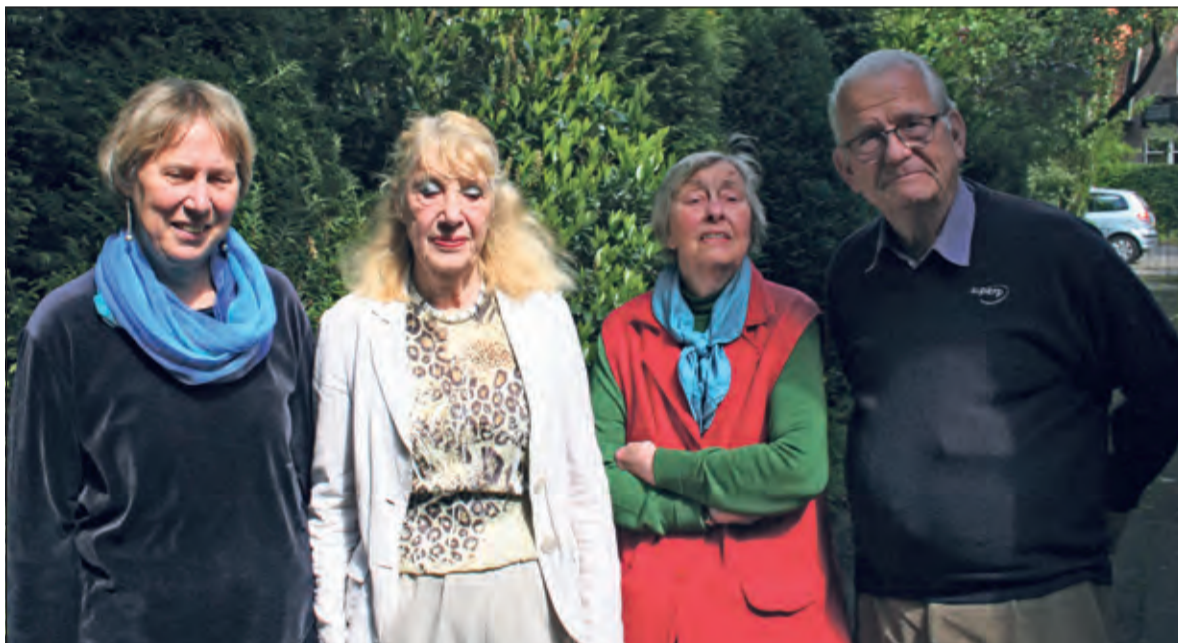
De vier kunstenaars brengen na 25 jaar opnieuw kunst in WVT.

Zij zullen in de Vijverzaal een mooie oude en nieuwe ontwikkeling tonen, met dan aan van Tuyl, die vele ideeën onder de mensen bracht en de kunstenaar regelmatig te hulp schoot bij financiële kwesties bij aankopen, maar ook voorzag in lesmogelijkheden o.a. op de WVT.