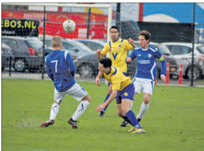
SVM strijdt voor wat het waard is.

Op het mooie sportcomplex van VOP (Voor Ons Plezier) in Amersfoort werd de Maartensdijkse trots al na 8 minuten wakker geschud door een prachtig afstandsschot van een VOP-speler.