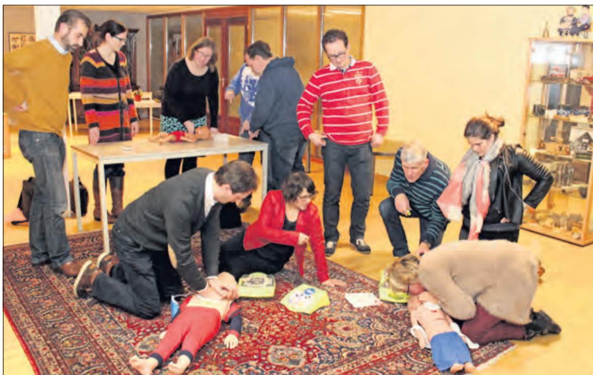
Medewerkers van Van der Neut moet het geleerde in praktijk laten zien.