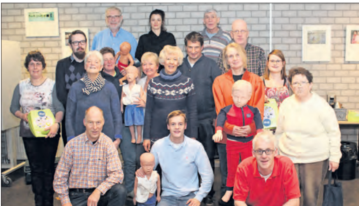
Gemeente De Bilt heeft er vorige week een fors aantal mensen bij gekregen die eerste hulp 'aan kinderen' kunnen verlenen.

en kinderen. Extra aandacht werd besteed aan het herkennen van mogelijke kindermishandeling. Een gecommitteerde van het Oranje Kruis nam het examen af. Alle cursisten, die op deze avond examen deden, slaagden voor het certificaat Eerste Hulp aan kinderen. De cursus werd gegeven door de docent van de EHBO-vereniging Jan Broers. [HvdB]