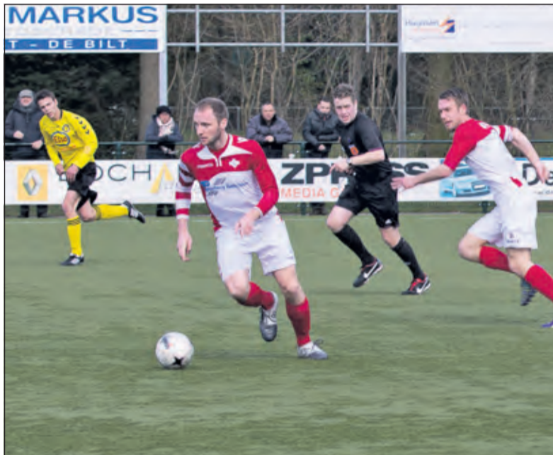
Om niet verder te zakken in het klassement moet FC de Bilt de komende tijd zijn beste beentje voorzetten. (foto Henk Willemsen).

Daarna speelde Woudenberg de wedstrijd heel degelijk uit. FC De Bilt knokte wat het waard was, maar het lukte niet. Het laatste kwartier ging FC De Bilt één-op-één spelen en ontstonden er bij beide doelen kansen. Na een mooie diepe bal van Erwin Korthals liep Tom Karst heel goed door en wist uit een moeilijke positie de bal goed in te koppen; helaas net niet laag, hoog of hard genoeg om de keeper te passeren. Na iets meer dan 90 minuten floot de scheidsrechter de wedstrijd ten einde. Woudenberg was over het geheel genomen de terecht winnaar. Om de zesde plaats te handhaven of misschien nog een plaatsje te stijgen, moeten in de komende vijf wedstrijden voldoende punten worden gepakt. Zaterdag 11 april, in de thuiswedstrijd tegen Veense Boys, is daarvoor de eerste mogelijkheid.