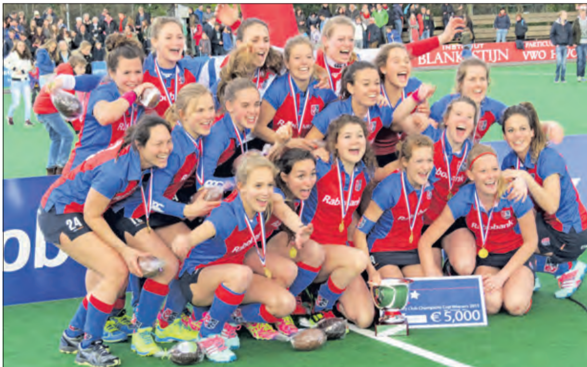
Het team van SCHC met de gewonnen Europacup.

toernooi werd voor de 42ste keer gehouden en vindt plaats onder verantwoordelijkheid van de European Hockey Federation (EHF). De EHF bepaalt jaarlijks waar dit prestigieuze toernooi plaatsvindt. Gastclub SCHC slaagde er met heel veel vrijwilligers in een geslaagd toernooi met volle tribunes te organiseren. Het damesteam van SCHC nam voor het eerst in haar geschiedenis deel aan de EHCCC. De club mocht het toernooi organiseren en werd ook nog winnaar.