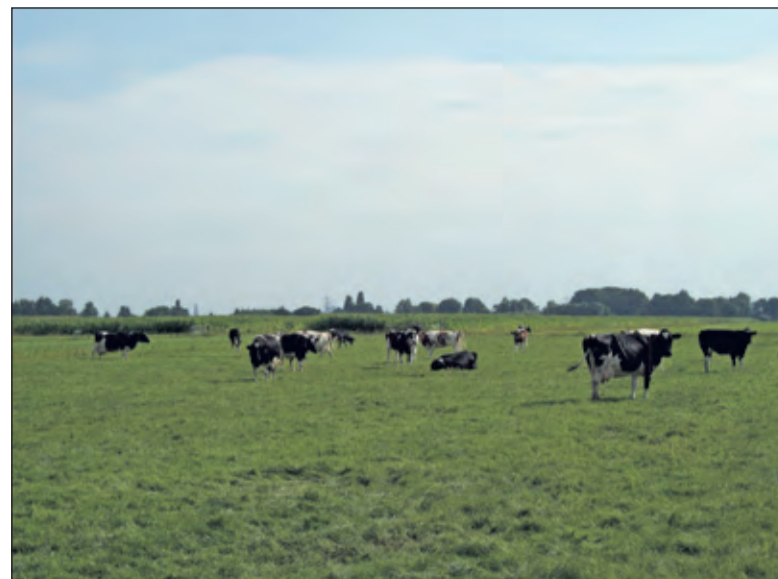
De thematische fietstocht voert o.a. langs koeien en er valt van alles te ontdekken over landbouw en agrarisch natuurbeheer.