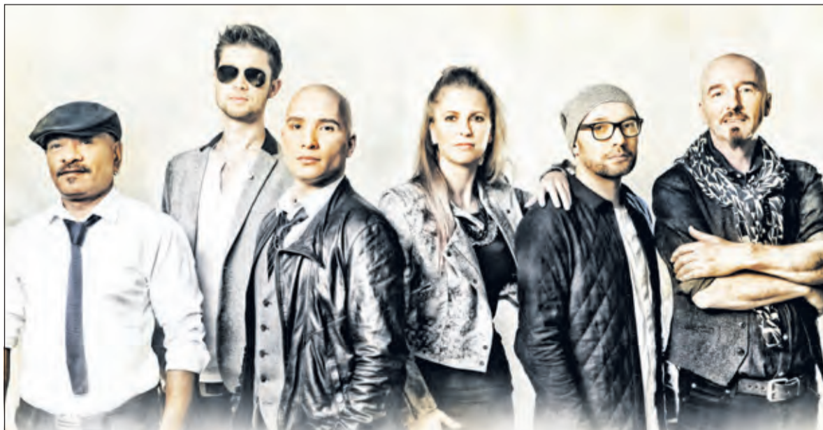
Grooveline vervangt Beethoven op de Biltse Beat reünie