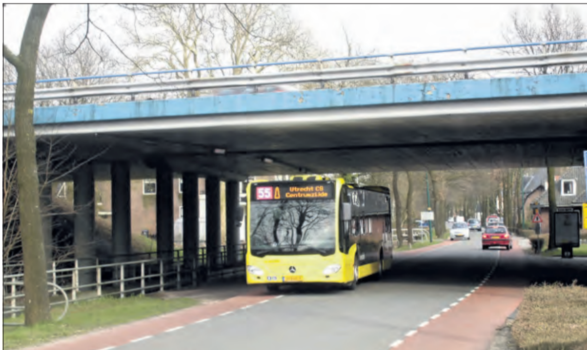
Bus 55 onder het viaduct in Maartensdijk. Zal een tijdelijke verlaging van het viaduct met ca. 1 meter ook geen moeilijkheden gaan opleveren voor deze bus?

De mogelijke verbreding van de A27, waarover nog geen definitief besluit is genomen, heeft al voor veel reuring binnen en buiten deze gemeente gezorgd. In dit scala van mogelijke problemen werpt ook de noodzakelijk gedachte aan tijdelijke verlaging van bestaande viaducten al haar schaduw vooruit.