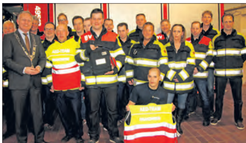
De Maartensdijkse brandweer: initiatiefnemer bij AED-taken.