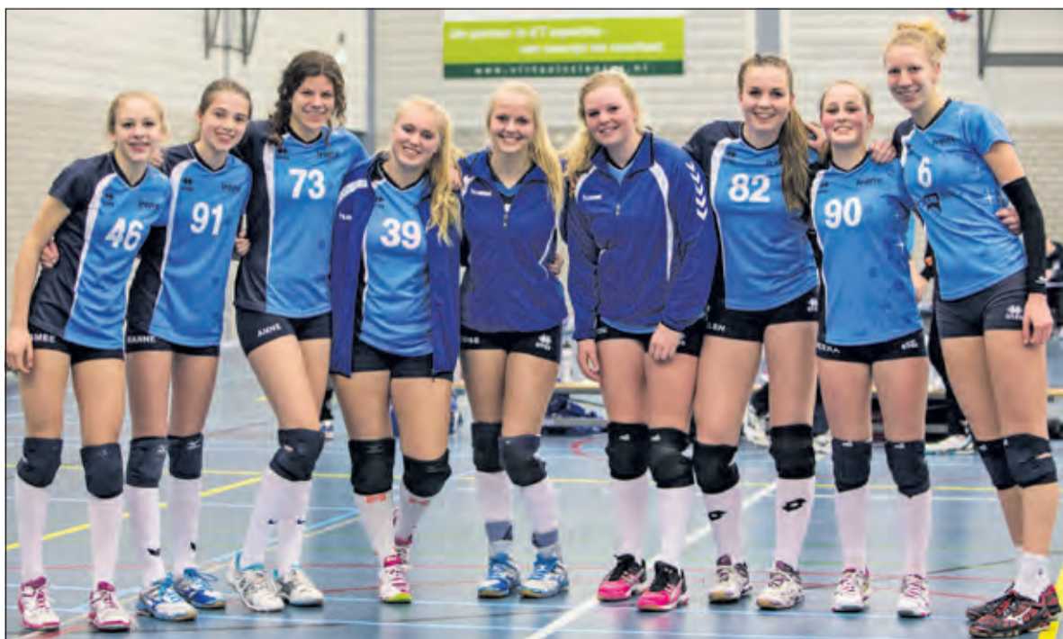
Irene meisjes 1 heeft uitzicht op twee titels.

In de Topklasse gaat de strijd om het kampioenschap ook tussen Irene en Kalinko. Hier valt de beslissing naar alle waarschijnlijkheid al op zaterdag 11 april als Irene de wedstrijd in de Kees Boeke sporthal wint van Zaanstad.