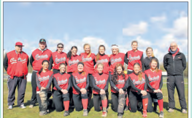
De competitie van Centrals Dames 1 start zaterdag 11 april tegen Roef! Sportwethouder Madeleine Bakker zal om 14.00 uur op Sportpark Weltevreden de eerste bal werpen.