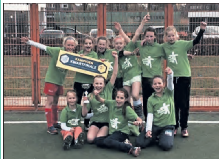
Biltse meiden spelen volgende maand de halve finale in het Cruyff courts toernooi.

De meiden van groep 7 en 8 van de Groen van Prinstererschool in De Bilt hebben de halve finale van het Cruyff Courts toernooi bereikt. Tijdens de kwartfinale in Gorinchem lieten ze De Vlindervallei uit Amersfoort en De Tamboerijn uit Gorinchem ruimschoots achter zich. Met 9 doelpunten voor en slechts 1 tegen was de winnaarsbeker overtuigend voor de Groen van Prinstererschool.