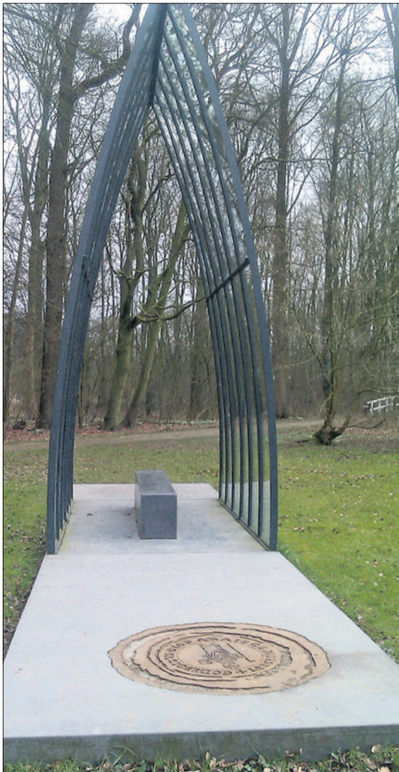
Het Godebald-monument op Oostbroek.

Vanwege de gebleken connectie tussen De Bilt en Mijdrecht (via Godebald) vindt er, in het verlengde van de infoavond in De Bilt van januari jl., een tweede infoavond in Mijdrecht plaats op vrijdagavond 10 maart a.s. om 20.00 uur in de Oudheidkamer van de Historische Vereniging De Proosdijlanden, Croonstadtdaan 4a. Aanmelding voor deze reis kan nog tot 12 maart via gmlandman@gmail.com / 06 30308712.