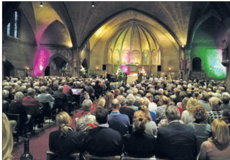
Met de opbrengst van het Rotary kerstconcert worden lokale initiatieven gesteund.

in een volle Gregoriuskerk een fantastische zondagmiddag te beleven en daarna allerlei leuke en positieve projecten te kunnen ondersteunen? Zet dus zondag 10 december maar vast in uw agenda, vorige keer waren de kaartjes snel weg.'