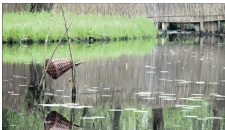
De eendenkooi tussen Hollandsche Rading en Tienhoven is een bezoeke waard.

Vrijwillige klussen gaan klaren wordt als verbindend ervaren de actie NLdoet laat zien hoe dat moet dat blijkt nu alweer vele jaren