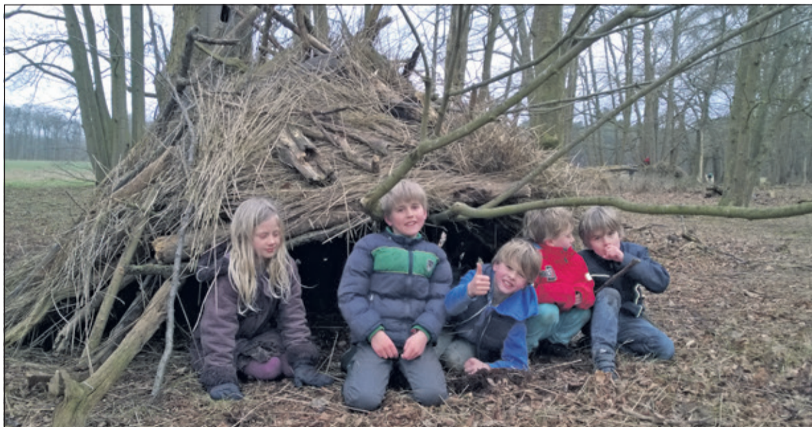
Hutten bouwen, wie vindt dat niet prachtig. Maar hoe bouw je nu een hut waar je in kunt overleven als het regent en ook nog koud is?

tot 16.30 uur. Plaats: Paviljoen Beerschoten, De Holle Bilt 6, De Bilt. Aanmelden per email kan tot 12 maart naar kindernatuuractiviteiten@gmail.com .