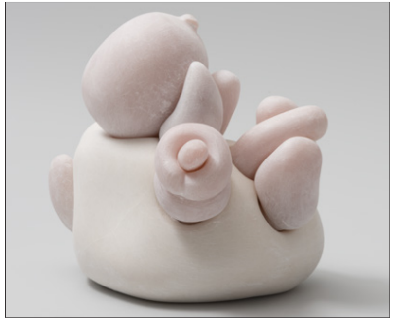
Pure Love van Hans Hovy.