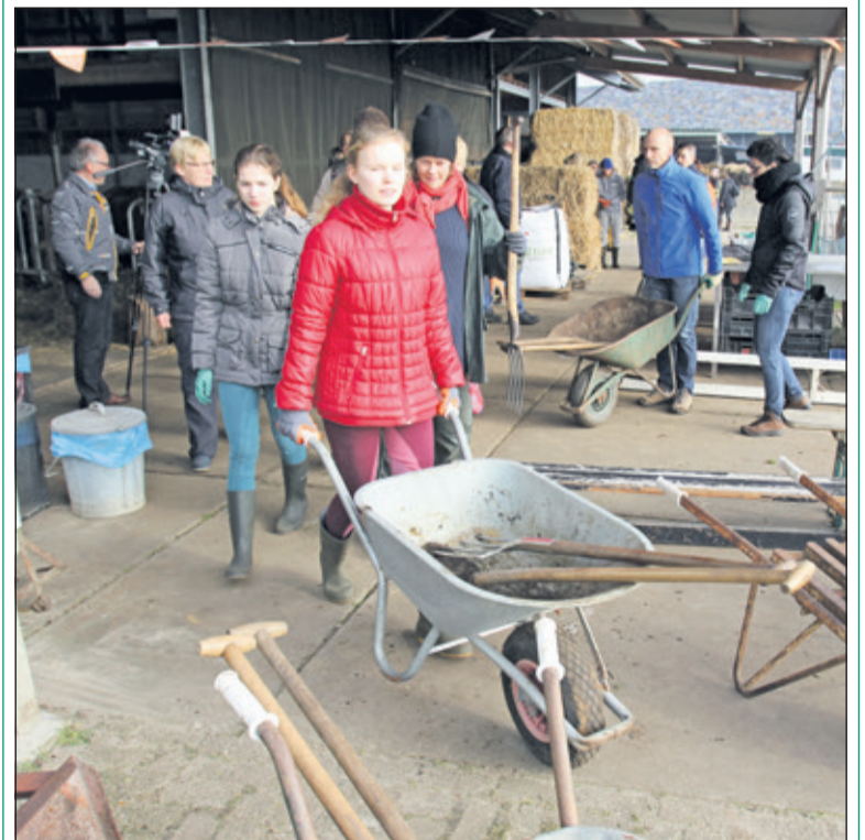
Vorig jaar hielpen leerlingen van het speciaal onderwijs het team ambtenaren op Nieuw Bureveld.