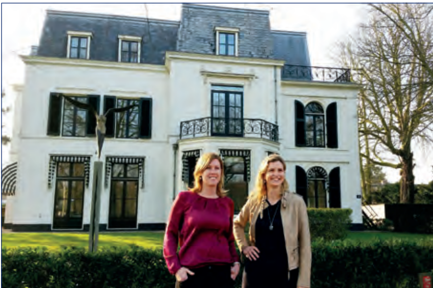
Just say YES Advocaten!

Een mix van vaste en flexibele arbeidskrachten is goed voor de slagkracht en de veerkracht van uw bedrijf. Vaste arbeidskrachten zorgen voor continuïteit. Flexibele arbeidsrelaties bieden u de mogelijkheid om in te spelen op fluctuerende marktomstandigheden. Welke ingrediënten zijn er om tot de optimale mix te komen?