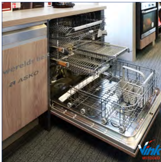
De afwasmachine met 3 etages kan bergen kopjes aan.

Pr. Christinastraat 3 in Westbroek gaat een veel groter bedrijf schuil dan je in eerste instantie zou denken.