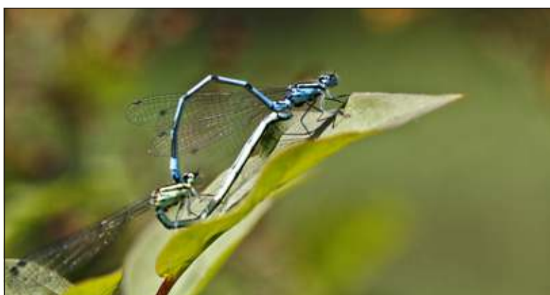
Love is in de air, Azuur juffers.