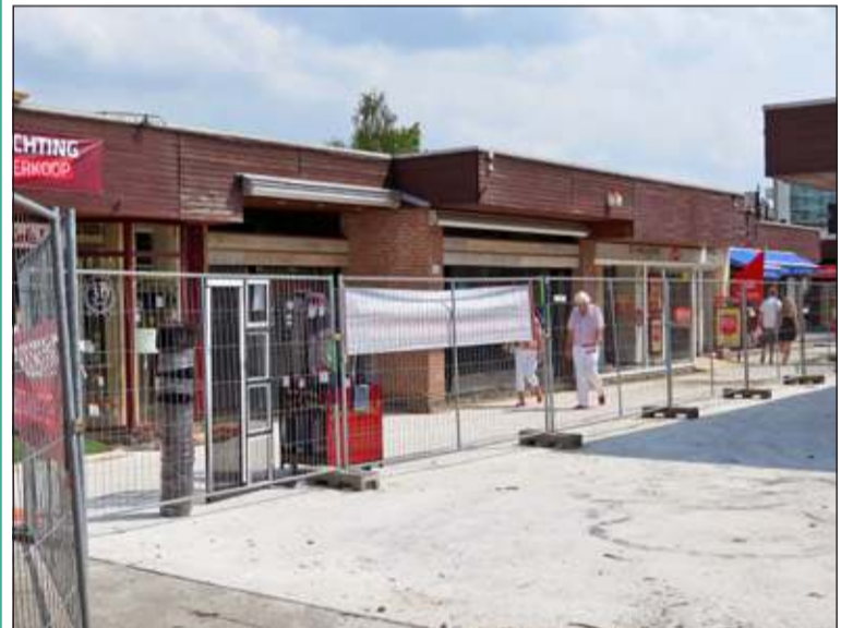
Het slopen van de verharding en het verwijderen van de overkappingen vindt plaats in de periode van 28 juli tot en met 15 augustus van 7.00 uur 's ochtends tot 's avonds 22.00 uur. De winkels blijven bereikbaar. [GG]

Het project wordt in nauwe afstemming met de winkeliers, de omwonenden en de gemeente uitgevoerd. De winkelunits en het grootste deel van de parkeergarage blijven gedurende de werkzaamheden bereikbaar. Planning is dat de herontwikkeling van het eerste gedeelte van het Kronkelstraatje medio november is afgerond. Er wordt getracht de totale overlast te beperken. Aansluitend op de afronding van het eerste deel van het Kronkelstraatje zal de herontwikkeling verdergaan. Details hierover worden naar verwachting eind van het jaar bekendgemaakt.