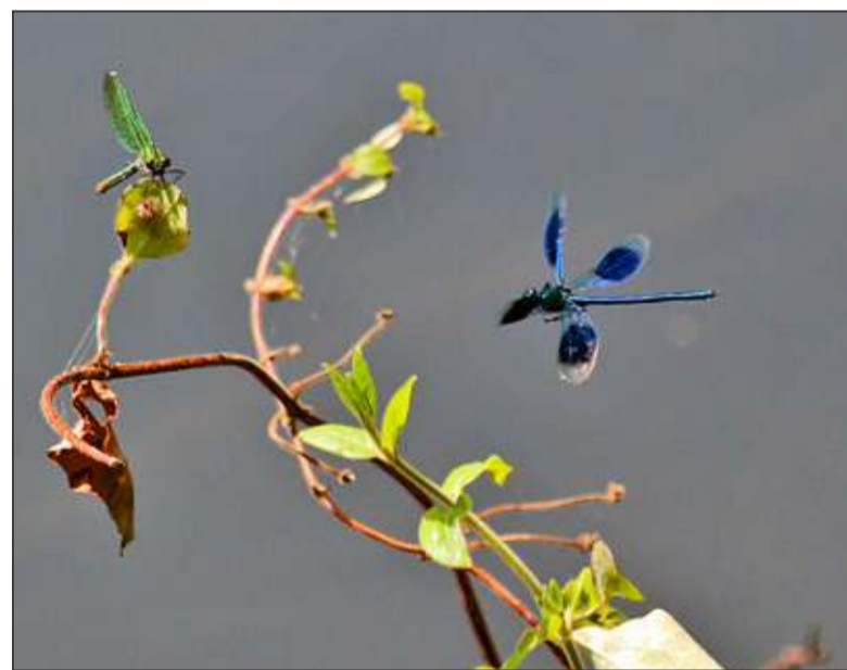
Weide beekjuffer (blauw is het mannetje, groen het vrouwtje).

De term 'libellen' wekt soms enige verwarring. De orde der libellen (orde Odonata) bestaat namelijk uit twee onderorden: de juffers en de 'echte' libellen. De 'echte' libellen worden meestal echter kortweg libellen genoemd. Op libellenet.nl kun je bij twijfel altijd enige 'orde' scheppen.