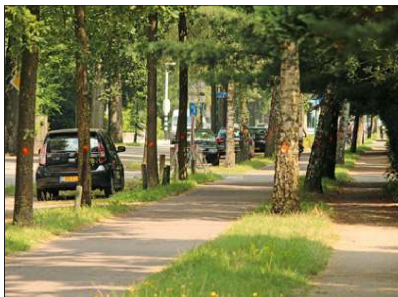
De aankomende kaalslag valt niet te missen.

Fietsers worden omgeleid via Overboslaan en Nachtegaallaan. Bewoners en bedrijven krijgen deze week persoonlijk nader bericht van de gemeente. Naar verwachting worden de werkzaamheden in november van dit jaar afgerond met de oplevering van het nieuwe fietspad.