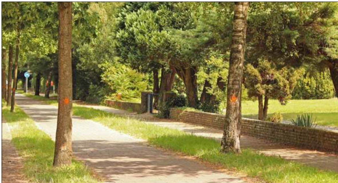
Alle bomen met een stip moeten wijken voor het nieuwe fietspad.

De gemeente De Bilt voert de komende maanden in samenwerking met waterbedrijf Vitens werkzaamheden uit aan de Soestdijkseweg Zuid in Bilthoven. Er wordt een nieuwe hoofdwaterleiding aangelegd en een nieuw fietspad. Om te voorkomen dat de straat twee keer in korte tijd moet worden opgebroken, wordt het werk gecombineerd en is overlast voor bewoners en gebruikers beperkt.