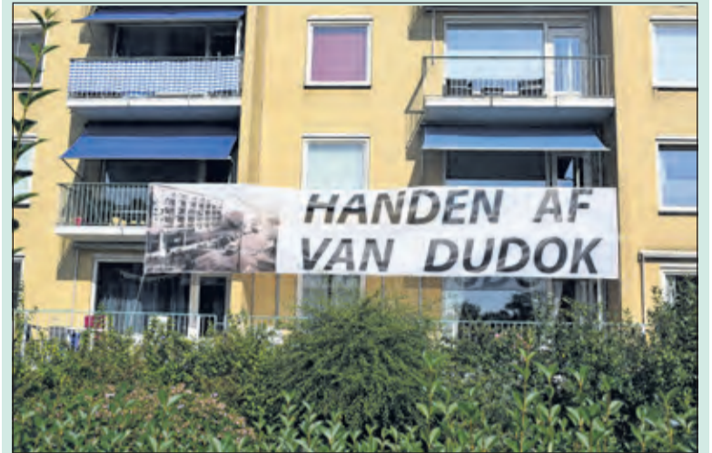
Bewoners van het Dudokcomplex in Bilthoven formuleren een duidelijk protest.

De bewoners van het Dudokcomplex aan de Bilthovense Julianalaan protesteerden jl. zaterdag opnieuw tegen de gedeeltelijke sloop van het complex. Zij zijn van mening dat het complex op de gemeentelijke monumentenlijst thuishoort. De gemeente heeft eerder dit verzoek afgewezen. Middels een groot spandoek op de flat protesteren zij nu tegen de voorgenomen sloop van een gedeelte van de complex. Eerder sprak ook het Cuypergenootschap, een landelijke monumentenorganisatie, zich uit voor behoud van het gehele complex.