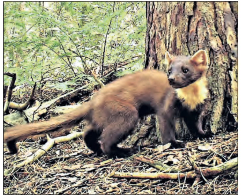
Een boommarter in Beukenburg.

De boommarter moet niet verward worden met de steenmarter. Die laatste veroorzaakt wel eens overlast op zolders of in auto's, maar is hier in de buurt nog erg zeldzaam. De onderzoekers zijn ook geïnteresseerd in hoeverre boommarters