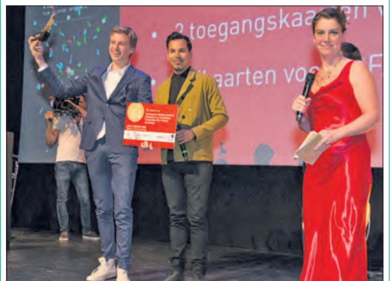
Het Nieuwe Lyceum werd maar liefst vijf keer genomineerd.