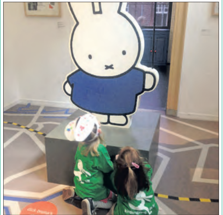
Peuters van Juliaantje in het Nijntjemuseum.

Vanuit het ontwikkelingsgericht werken, zijn de peuters de afgelopen drie weken bezig geweest met het thema Nijntje. Op de peutergroepen wordt er gewerkt aan diverse thema's vanuit het Uk en Puk programma. Uk staat voor het kind, en Puk is een grote gele knuffelpop die al deze thema's mee beleefd. Dus Puk ging uiteraard mee naar Nijntje. Zo hebben de kinderen kennis gemaakt met cultuur vanuit hun eigen belevingswereld! Al kruipend, zoekend, dansend en ruikend hebben de kinderen spelenderwijs veel geleerd van het Nijntjemuseum. De kinderen hebben er enorm veel plezier gehad!