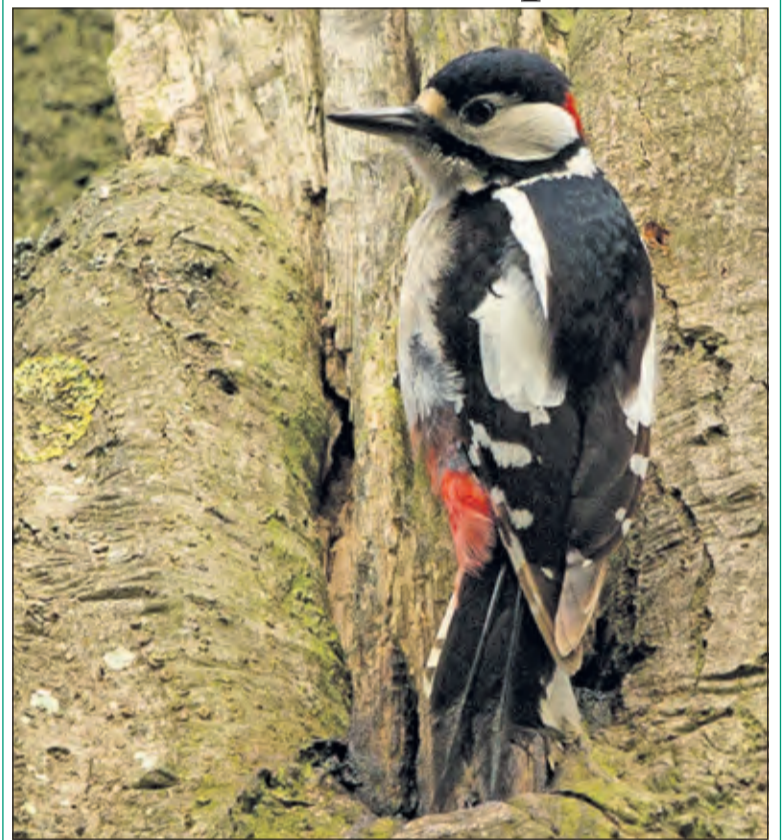
De meteorologische lente is nog niet begonnen of deze grote bonte specht is alweer actief bezig langs het Prinsenaantje in Maartensdijk. Tussen het hak- en breekwerk door vond hij toch nog even tijd om zichzelf te laten portretteren.