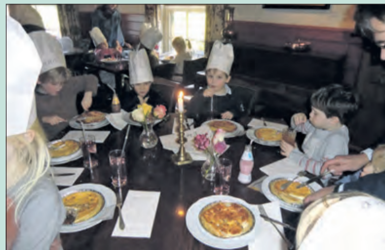
Kleuters van de van Dijksschool mochten een kijkje nemen in de keuken van restaurant de Lage Vuursche.