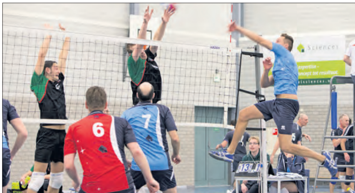
Met nog vijf wedstrijden te gaan en twee punten achterstand op de concurrenten, blijft het ongemeen spannend in de tweede divisie.