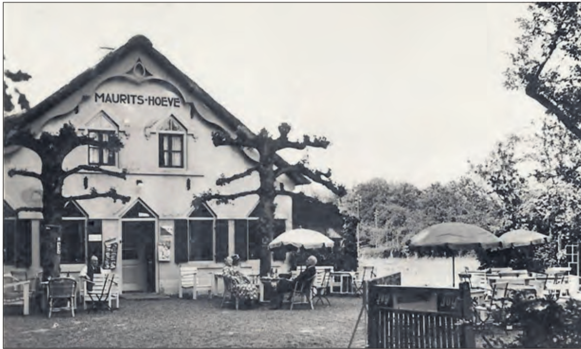
Een in eigen beheer door van Apeldoorn uitgegeven ansichtkaart van Theetuin Maurits Hoeve.