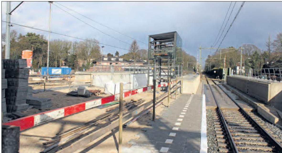
In het weekend werden de stalen liftconstructies en glaspanelen van de lift geplaatst en het bestaande perron op de nieuwe onderdoorgang aangesloten. [foto Henk van de Bunt].

de nacht plaats. Tijdens de werkzaamheden was reizen per trein vanaf Bilthoven beperkt mogelijk.