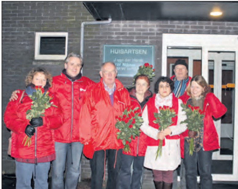
Het PvdA wijkteam maakt zich op voor bezoek aan Brandenburg West

Over het verkeer in de wijk werd veel geklaagd. Medeburgers nemen het vaak niet nauw met de verkeersregels, parkeren op plekken waar dat niet mag en gebruiken soms zelfs de fietstunnel met de auto. Elke maas in het net blijkt gebruikt te worden om sneller de bestemming te bereiken. Zo werd direct na het weghalen van het fietspaaltje aan het einde van de Noorderkroon, om tegen gladheid te kunnen strooien, dit fietspaaltje door auto's gebruikt. De bewoners willen dat zo'n paaltje daarom veel sneller wordt teruggeplaatst. Ook het zebrapad in de bocht aan de Melkweg wordt als zeer gevaarlijk beschouwd, zeker omdat de huidige bouwactiviteiten