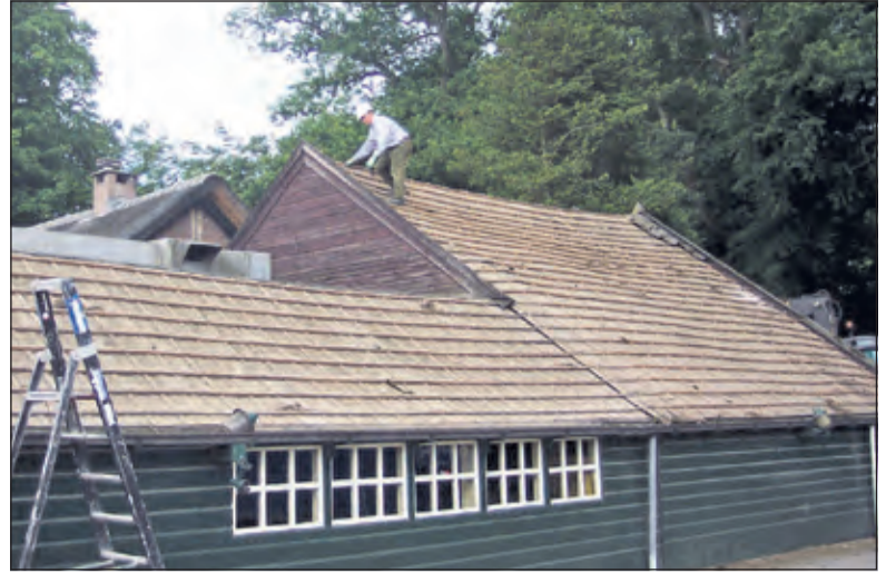
In 2008 werd het achterhuis van De Mauritshoeve gerenoveerd. Medewerkers van de aannemer halen de pannen van het dak.