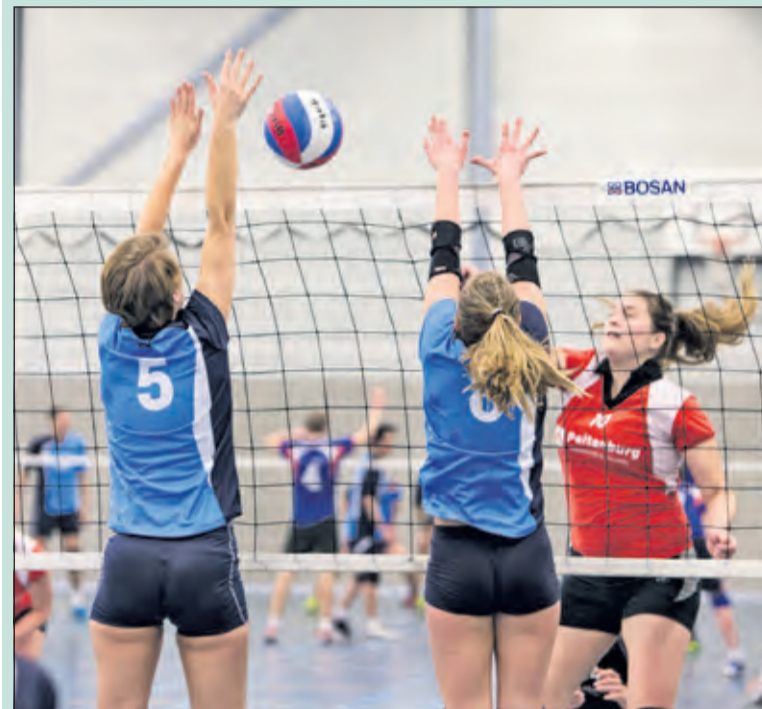
Ondanks het harde werk dat de dames uit Bilthoven hebben verricht, verloor Irene met 1-3.

Na een aantal vrije weekenden, moest het eerste damesteam van Irene volleybal er afgelopen zaterdag weer tegenaan. Dit keer tegen Dames 1 van DOSC uit Den Dolder. Nadat DOSC bijna tien punten uitliep in de eerste set, viel die niet meer te redden (25-16). Hiermee ging het eerste punt aan Irene voorbij. De tweede set waren de rollen omgekeerd en wonnen de meiden van Irene met 25-19. Het succes duurde helaas niet lang voort, want de laatste twee sets eindigden in respectievelijk 25-22 en 25-19 in het voordeel van DOSC.