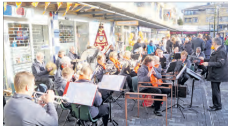
Eerder speelde Harmonie Kunst en Genoegen ook op het Maartensplein in Maartensdijk.

Op 7 mei (de dag vóór Moederdag) en 14 mei (dag vóór Pinksteren) zijn de eerste optredens in dit gebied.