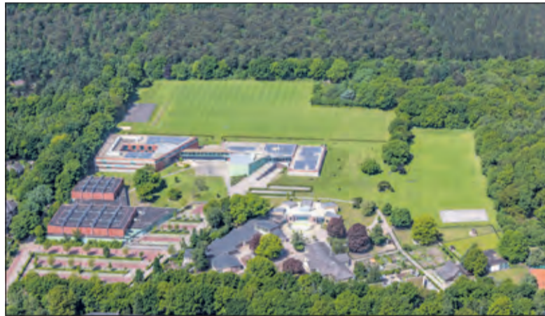
De Werkplaats vanuit de lucht.

De organisatoren beloven met een fantastisch en gevarieerd programma van deze dag een bijzondere reünie maken. Het thema van de reünie is: ‘Wij in de Wereld’. Dit thema krijgt vorm in de opening van de dag, waarin de ervaringen van oud- maar ook huidige werkers met hun vluchtelingenverleden, verbinding maken met de manier waarop De Werkplaats daar nu aandacht aan schenkt. Tevens is dit jaar de start van de oud-werkers vereniging ‘WP Oud-Werkgemeenschap’. De aanwezigen kunnen zich hier ter plekke voor aanmelden.