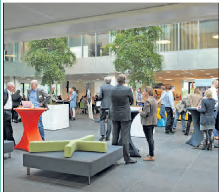
De interne beursvloer van de Rabobank.

11 Maatschappelijke organisaties presenteerden zich aan de medewerkers van Rabobank. De maatschappelijke organisaties bieden een halve dag vrijwilligerswerk en medewerkers van Rabobank kunnen zich inschrijven op de diverse projecten. Een greep uit het vrijwilligerswerk; de brug schoonmaken bij Kasteel Amerongen, taarten bakken met bewoners van het Leendert Meeshuis, een High Tea nuttigen met cliënten van Altrecht, en diverse opknop- en tuinwerkzaamheden bij de Ezel sociëteit. Het vrijwilligerswerk wordt uitgevoerd tijdens de Aandeel in Elkaar week, die plaatsvindt van 13-16 juni aanstaande. Deze week wordt mede georganiseerd door Samen voor De Bilt en Samen voor Zeist.