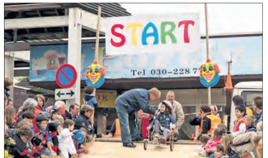
Op 11 juni gaat de Biltse Zeepkistenrace weer van start.