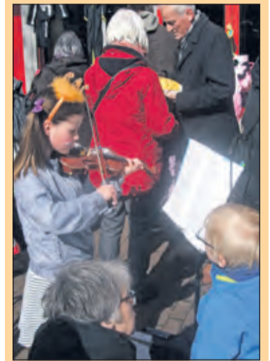
De Bilt - De jonge straatmuzikant.