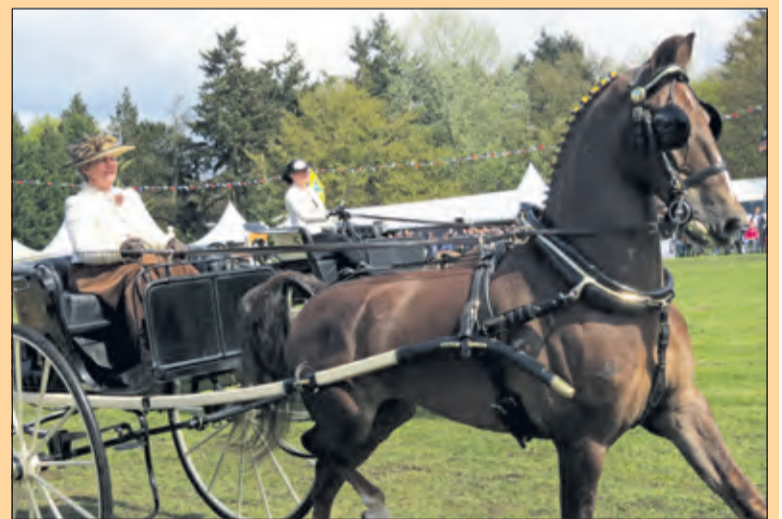
Bilthoven - Het Oranjeconcours dat traditioneel aan de andere kant van de weg plaatsvond trok veel publiek.