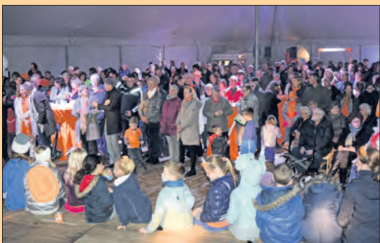
Westbroek - Op Koningsdag was de tent in weer tot de nok gevuld.