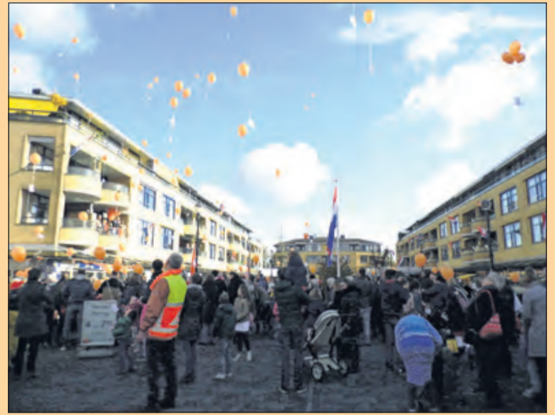
Maartensdijk - Grote drukte op het Maartensplein tijdens de aubade. Na het oplaten van de ballonnen startte de kindervrijmarkt.