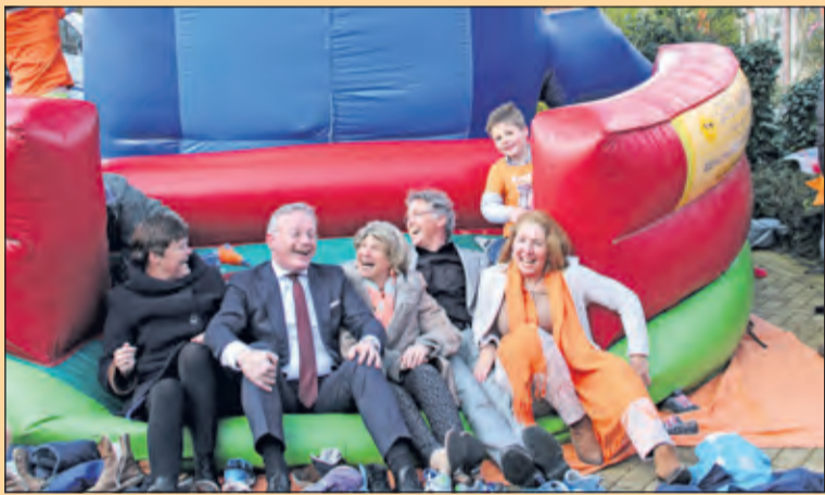
Hollandsche Rading - Gelezen in Nota Jong De Bilt: 'Bij het uitwerken van de speerpunten van het jeugdbeleid probeert het College zo goed mogelijk aan te sluiten op de leefwereld van het kind'.