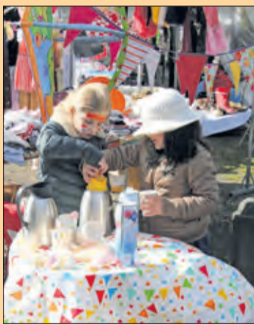
Lage Vuursche - Koffie, thee, (aanmaak-)limonade en spekkies: alles was te koop.