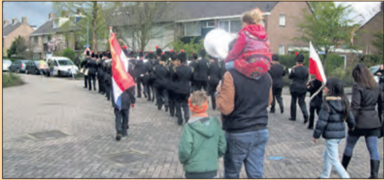
De Bilt - Allemaal met de muziek mee.

De weersverwachtingen waren niet al te best voor Koningsdag, maar uiteindelijk viel het alles mee. Bijna alle festiviteiten vonden normaal doorgang. Middels een foto-impressie leveren we een beeld van deze feestdag.