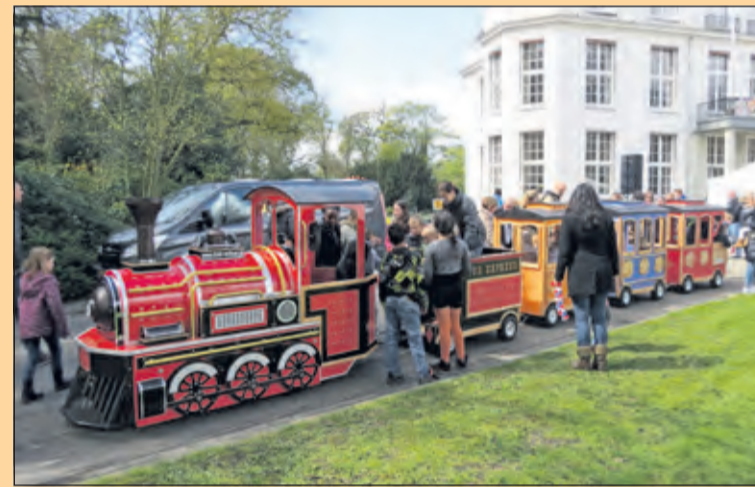
Bilthoven - Het gemeentehuis was op Koningsdag ook per spoor bereikbaar. Het spellenfestival veranderde het gazon rond Jagtlust weer in een paradijs voor kinderen.