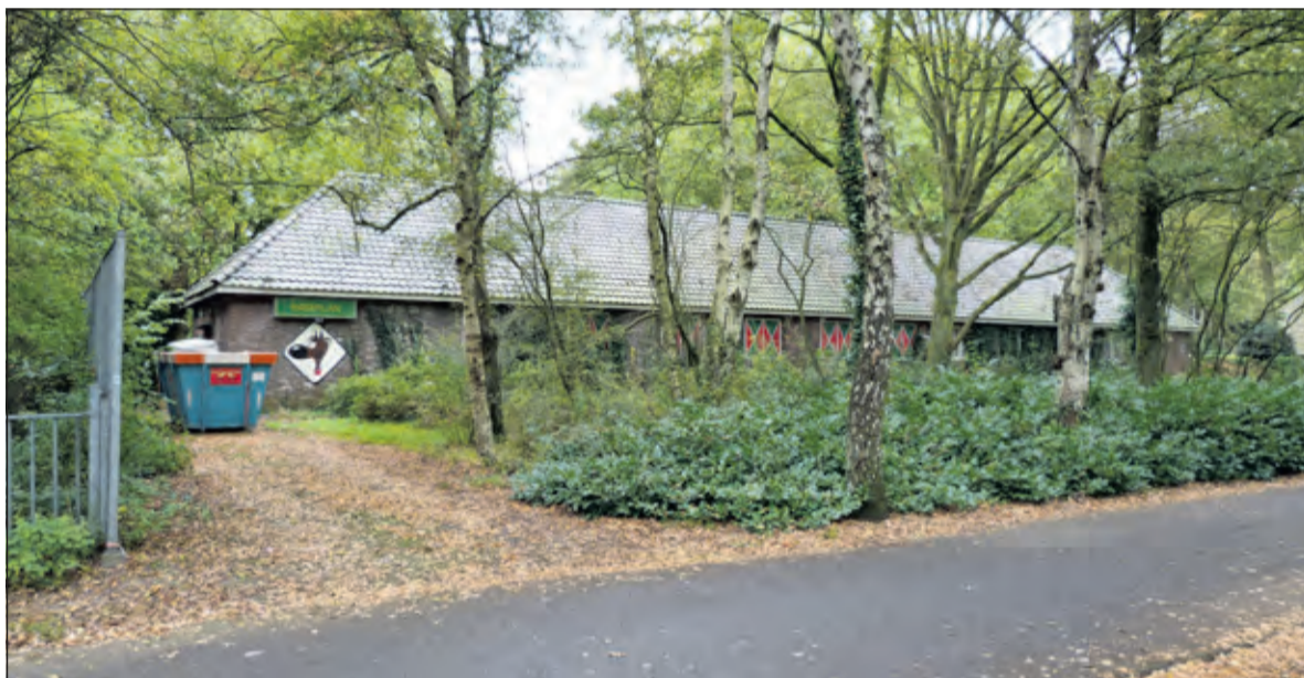
De voormalige discotheek Rataplan aan de Jan Steenlaan in Bilthoven.

Over de vleermuismigratie is op 11 mei van 19.30 tot 21.00 uur een inloopbijeenkomst op de locatie van Rataplan georganiseerd. Iedereen is daarbij van harte welkom.