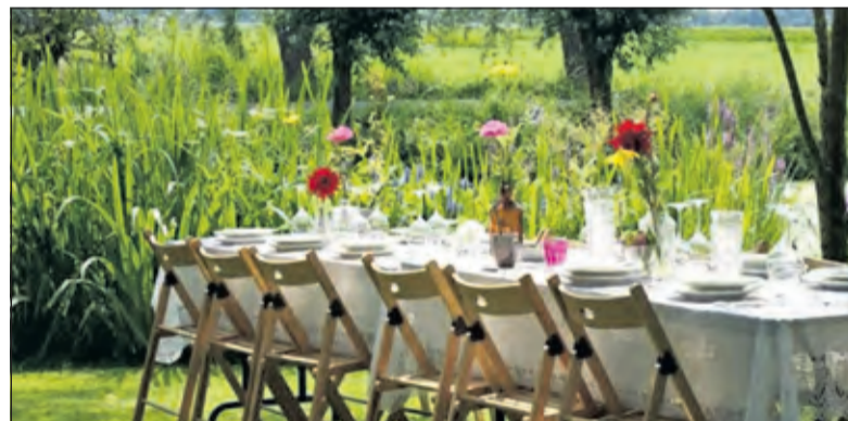
Culinair hopen door Groenekan is populair.

Ieder koppel bereidt een gerecht voor. Er zijn vier gerechten en ruim van tevoren krijgt ieder stel te horen welk gerecht zij geacht worden te bereiden. De koppels gaan iedere keer in een andere samenstelling naar de drie andere locaties. Omdat alles zich in Groenekan afspeelt, wordt de wisseling van locatie met de fiets of lopend afgelegd. Is dit niet mogelijk, dan kan natuurlijk