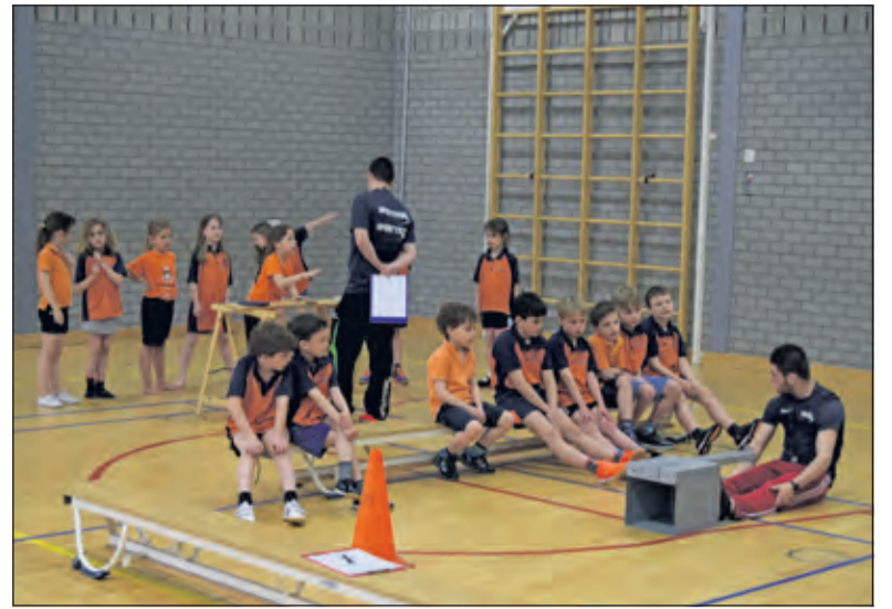
Alle kinderen worden aan de testen onderworpen.