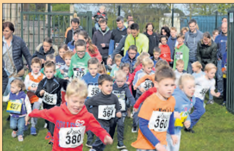
Westbroek - De minioren fanatiek van start tijdens de Polderloop.