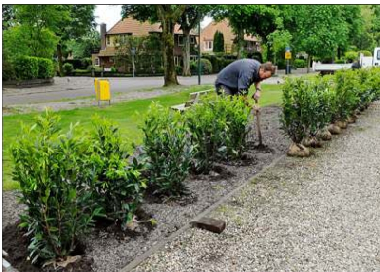
Het resultaat van goed overleg tussen bewoners en de gemeente.