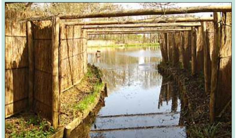
De eendenkooi kent nog veel authentieke details zoals de kooiplas, het kooibos, de vanginstallatie en het kooikershuisje.

Op zondag 8 juni (1e Pinksterdag), maandag 9 juni (2e Pinksterdag), zaterdag 28 juni en zondag 29 juni 2014 zijn gidsen van Natuurmonumenten van ca. 12.00 uur tot ca. 15.00 uur op de Kanaaldijk aanwezig voor rondleidingen in de eendenkooi en geven zij informatie over het herstel van het dichtbij gelegen trilveengebied. De rondleidingen duren ca. 45 minuten. Vooraf aanmelden is niet nodig en deelname is gratis. Een vrijwillige bijdrage voor de restauratiekosten van de eendenkooi wordt op prijs gesteld. Bij regenachtig weer zijn er geen rondleidingen.