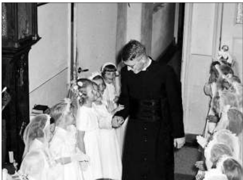
Na de wijding tot priester ging hij naar Amsterdam om voor het eerst de heilige Mis op te dragen, ook een groep bruidjes was daarbij aanwezig.