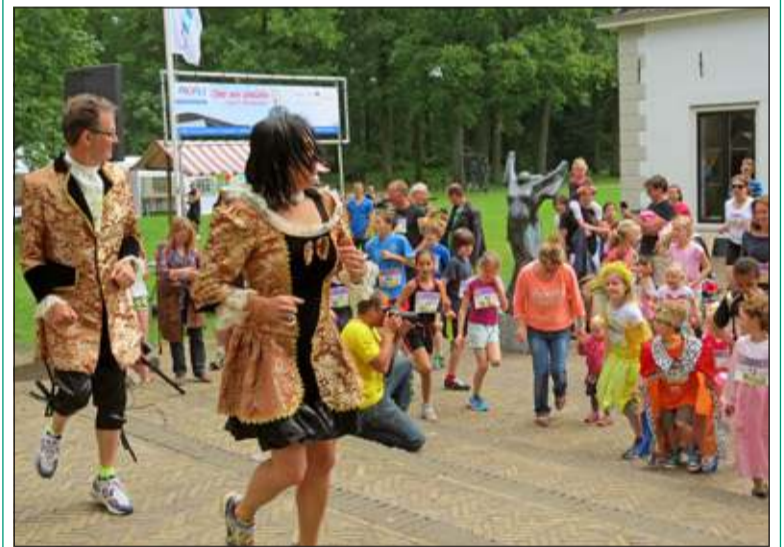
Aan de eerste Mathildeloop ging een warming-up vooraf. Veel van de ruim zestig deelnemers, die een of twee kilometer aflegden, waren verkleed als keizerin, prins, prinses of ridder.