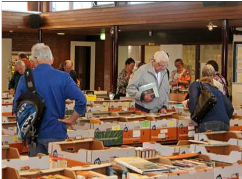
Zelfs een halfuur voor sluitingstijd – toen deze foto werd gemaakt – was er nog volop belangstelling.