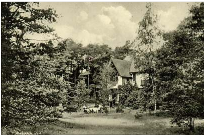
Uit de verzameling van Rienk Miedema komt deze foto van het Boschhuis uit 1935.

De lezing is op 17 juni a.s. om 20.00 uur in de Bilthovense Boekhandel, Julianalaan 1 in Bilthoven. Entree is vijf euro, reserveren is gewenst en kan telefonisch onder nummer 030 2281014 of e-mail info@bilthovenseboekhandel.nl.