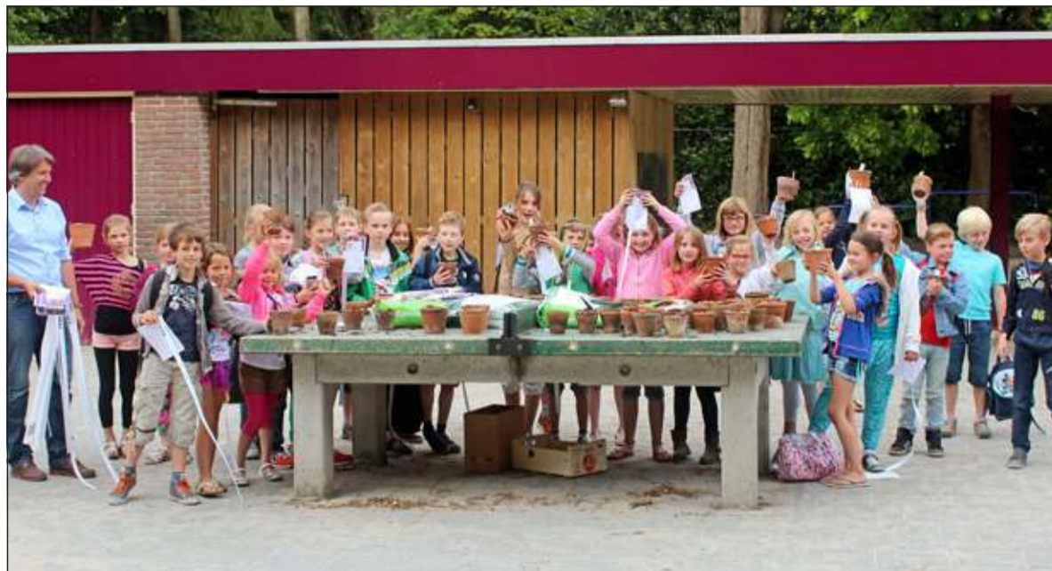
Maandag kregen leerlingen groepsgewijs een potje met zonnebloempitjes mee naar huis voor de Bosbergschool-GroenRijk-wedstrijd.