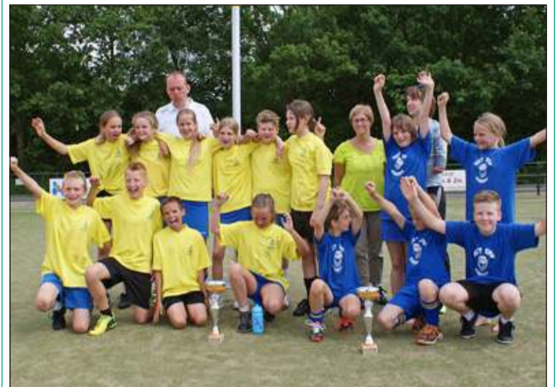
De Westbroekse winnaars, die op 14 juni aan het Nederlands Kampioenschap deelnemen, tezamen met groep 5/6 van Het Erf uit Veenendaal.