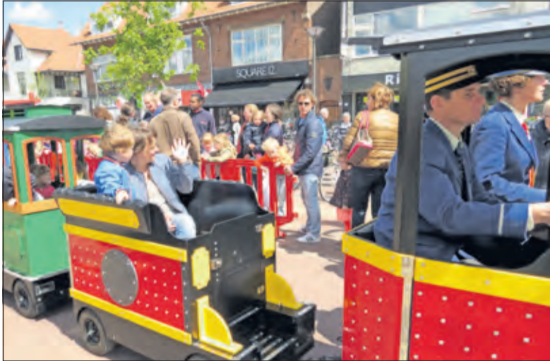
In een stationsgebied hoort natuurlijk een trein.