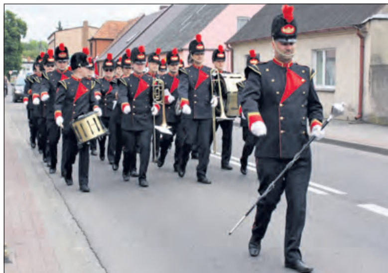
Koninklijke Biltse Harmonie in Mieścisko.