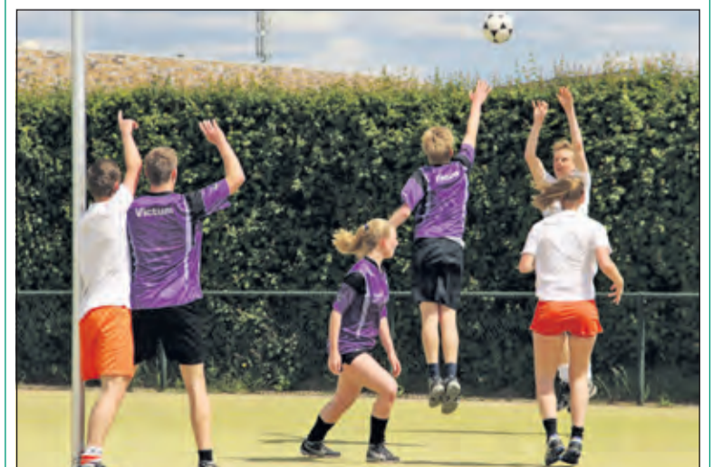
TZ zorgde voor de nodige spanning.

Na de korfwisseling startte TZ sterk, de 7-4 bracht de ploeg weer in winnende positie. Maar het pakte geheel anders uit. Victum speelde met meer branie en flair, als je het korfbalend niet redt dan moet je het op basis van inzet doen. Omdat TZ in deze fase een te laag schotpercentage had en teveel rebounds verloor, kantelde de wedstrijd in het voordeel van de ploeg uit Houten. De A's van Tweemaal Zes kwamen er eigenlijk niet meer aan te pas. De 13-10 uitslag bracht beide ploegen op gelijke hoogte in de competitiestand, nu was het wachten op de uitslag van de derde degradatiekandidaat. Na een uurtje billenknippen kwam het goede nieuws: Merwede had verloren, waardoor zowel Victum als Tweemaal Zes ook volgend seizoen op landelijk niveau spelen. (Henry Valk)