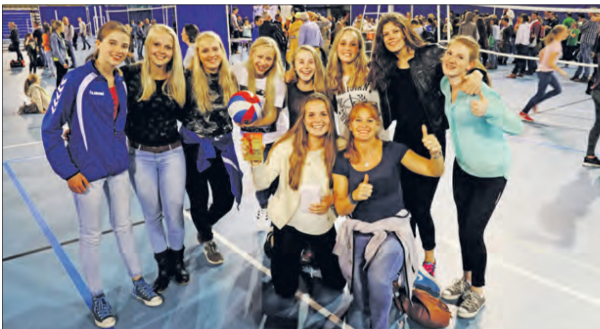
De volleybal meiden mogen als vierde van Nederland trots zijn op hun prestaties.

over kwaliteiten te bezitten waar Irene niet tegen bestand is. Na een gelijkopgaande eerste set, die uiteindelijk naar Lycurgus gaat, is de koek op voor de Biltse meiden. Irene verliest met 2-0 en wordt daarmee vierde van Nederland; geen podiumplaats maar toch een enorme prestatie.