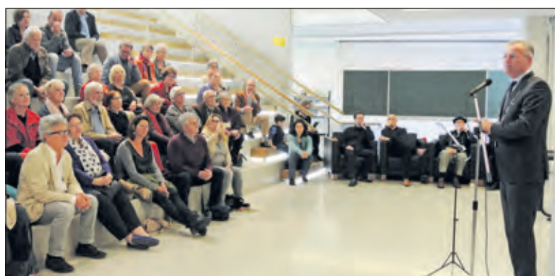
Burgemeester Arjen Gerritsen: 'Kunst is verbindend, het geeft inspiratie, maar ook troost'.

den meestal zo'n veertig kunstenaars mee met de route, maar dit jaar deden liefst zestig kunstenaars mee, op 22 verschillende locaties. De kunstenaars houden zich bezig met diverse kunstuitingen. Zo waren er 30 en 31 mei schilderijen te bekijken, maar ook keramiek, glas, tassen, sculpturen, gedichten, sieraden en fotografie. De kunstenaars komen voornamelijk uit de gemeente De Bilt en eentje uit Lage Vuursche.