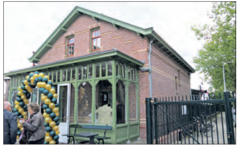
De stationschefwoning staat er weer stralend bij.

Vergeleken met de oude situatie zijn er aanpassingen gedaan die eigentijds gebruik mogelijk maken. ‘Toen we begonnen werd verteld dat er een loods was waar de onderdelen van de woning waren opgeslagen. Belangrijk aspect was het metselwerk. De bouwvergunning werd probleemloos afgegeven maar de Welstandscommissie stelde als voorwaarde dat het huis achter een hek moest komen te staan. Dat heeft ertoe geleid dat de bouwvergunning is afgegeven als bestaande bouw. ‘Bij nieuwbouw moet je aan heel veel eisen voldoen. Dit is daarom een van de weinige nieuwbouwprojecten in Nederland waar een bouwvergunning voor bestaande bouw is afgegeven.’