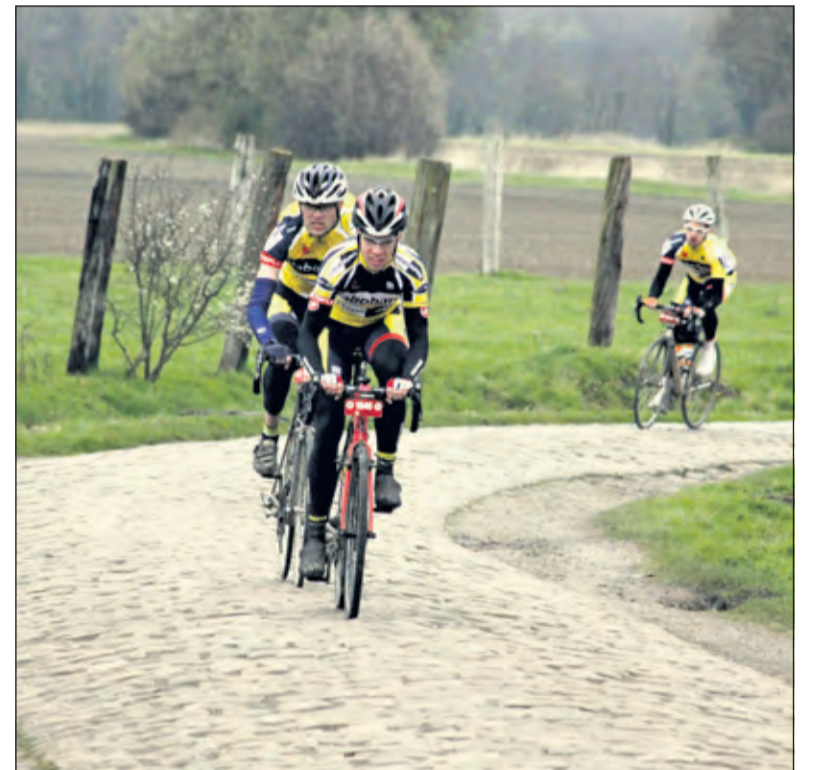
Zo hard mogelijk over de kasseien.

Iedereen is zaterdag 6 juni van harte welkom in de P+R De Uithof om de deelnemers aan te moedigen, vanaf 12.00 uur. De klimtijdrit begint vanaf 15.00 uur. Voor meer info: www.domrenner.nl/klimtijdrit