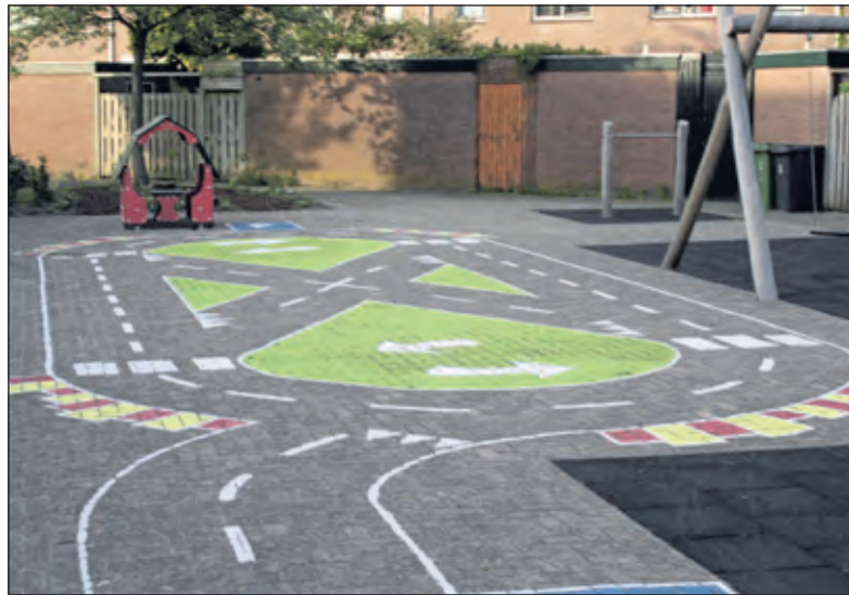
Overzicht van het nieuw ingerichte plein

Toen iedereen het over het plan eens was, brak voor Imke een volgende fase aan. Hoe nu verder? 'Na o.a. advies van de wijkraad De Leijen