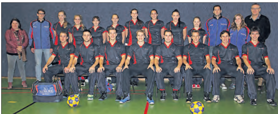
Nova 1 Promoveert naar 2de klasse.

dan ook een wedstrijd waarvoor bij Nova niets op het spel stond. Ook voor Koveni was er niets meer te behalen. Nova wist ook de laatste wedstrijd te winnen met 13-8.