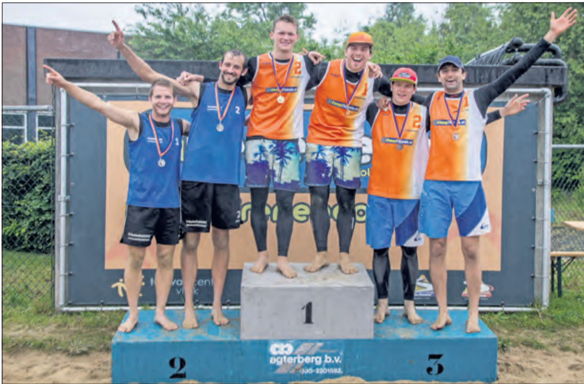
Winnaars 1ste divisie mannen.

winnen in drie sets van Hagens/van Wijk en bereiken de derde plaats. Het Irenebeach team Bruinier/Burgers eindigde op de 5e plaats.