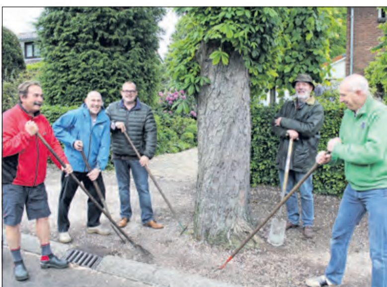
Het grind om de boom is door de bewoners aan de Spoorlaan verwijderd.

Ook andere projecten worden uitgevoerd en ontwikkeld, allemaal bedoeld om het wonen in Hollandsche Rading nog aangener te maken. 'Samen voor Hollandsche Rading' houdt op vrijdag 5 juni van 17.00 tot 19.00 uur een dorpsavond bij het dorpshuis. Daar kunnen de inwoners onder het genot van een hapje en een drankje nader kennis maken met het gebiedsplan, ideeën opdoen, meedenken en meedoen aan 'Samen voor Hollandsche Rading'.