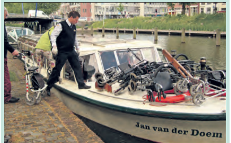
Woensdag 20 mei gingen 46 gasten en 11 vrijwilligers van de afdeling Maartensdijk van de Zonnebloem een dagje varen vanaf de Utrechtse Nieuwe Kade. Nadat alles en iedereen geïnstalleerd was ging de boot richting Rhijnauwen. Na een oponthoud bij de Kromme Rijn (er lag een werkschuit dwars in de gracht), kwam de boot aan bij theehuis Rhijnauwen. (Sofia Gijzen)