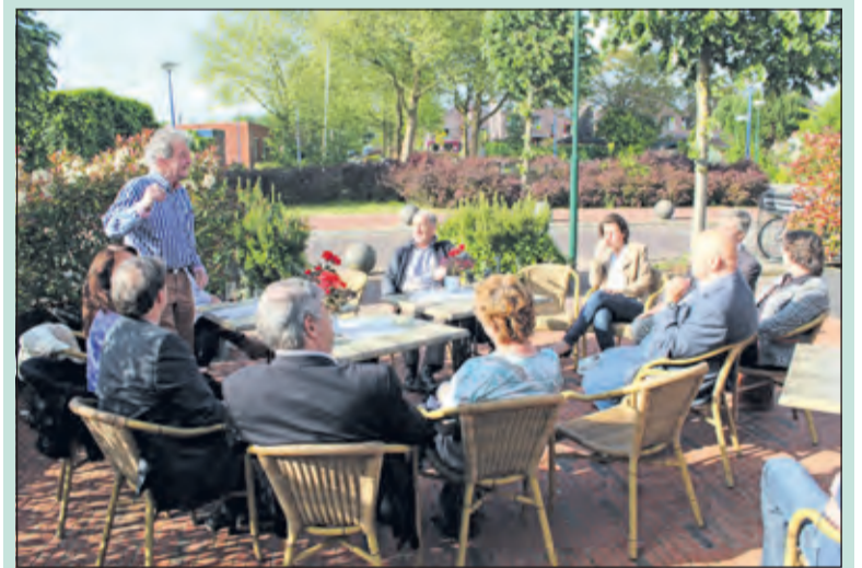
De partij hield donderdagavond 28 mei een presentatie bij Café van Miltenburg in Bilthoven, waarbij naast de voltallige fractie van Beter De Bilt ook vertegenwoordigers van andere partijen aanwezig waren.

Beter De Bilt heeft een half jaar gewerkt aan een eigen toekomstvisie voor de gemeente De Bilt. Dit is de eerste keer in de geschiedenis van de gemeente De Bilt dat een politieke partij een alternatieve visie heeft geschreven. Beter de Bilt meent met deze nota de kwaliteit van het politieke debat te stimuleren. Op 18 juni worden de definitieve standpunten in het debat bekend gemaakt. [HvdB].