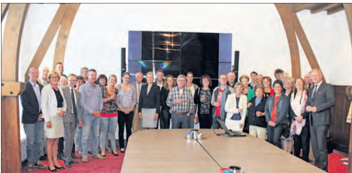
In de oude raadszaal werd gezamenlijk een film over de herdenking in Westbroek bekeken.

begeleiding op Koningsdag, Dodenherdenking en 5 mei-bijeenkomsten. Daarbij werd traditiegetrouw een glas oranjebitter geheven. [HvdB]