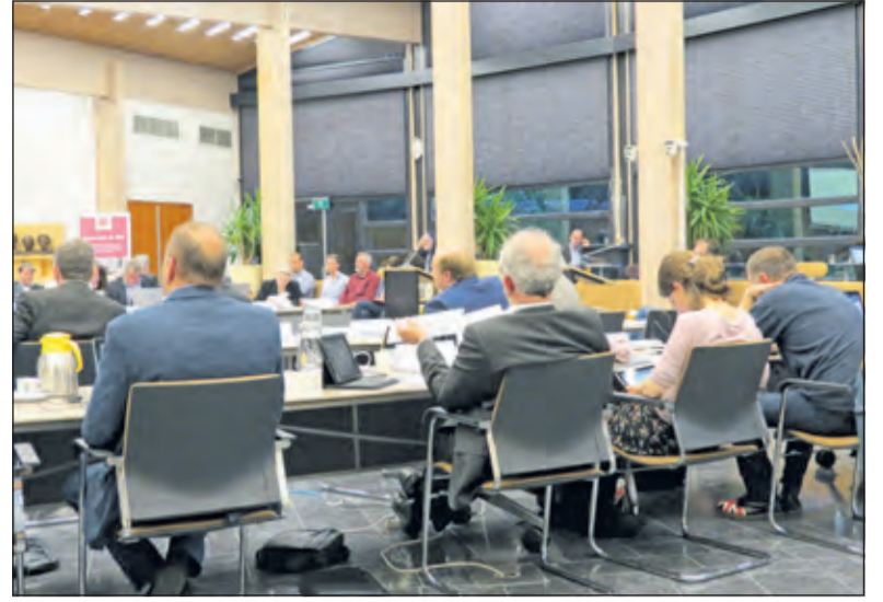
De raadsvergadering eindigde weer na het middernachtelijk uur.