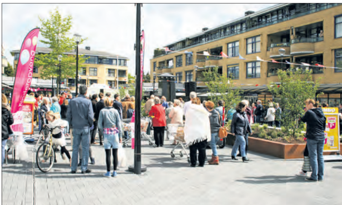
Gezellige drukte op het Maertensplein.

ook het publiek is trots dat het plein er zo mooi bij ligt.