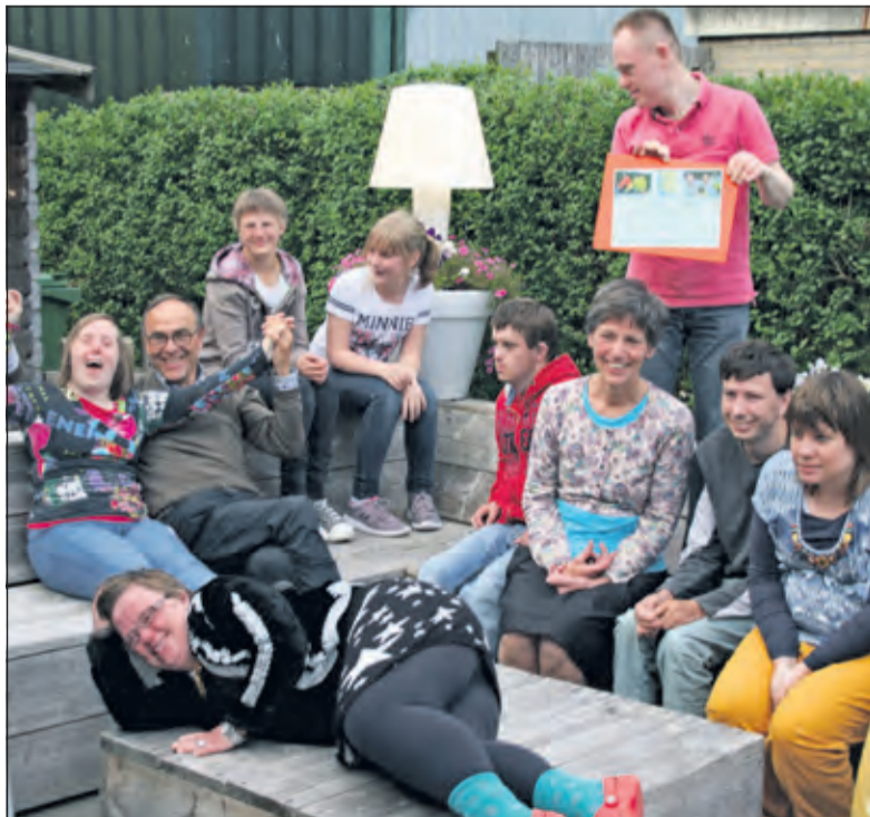
De bewoners zijn blij met het opgehaalde bedrag voor een nieuwe tuinkas.

Dinsdag 26 mei werd het bij elkaar gefietste bedrag bekendgemaakt in het Thomashuis in Maartensdijk: de twee fietsers hadden een totaalbedrag van 2.282,02 euro opgehaald voor een tuinkas, met dank aan alle 80 sponsors.