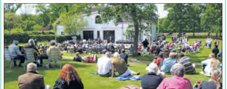
Het zomerconcert op Beerschoten is bij mooi weer een extra feestje.