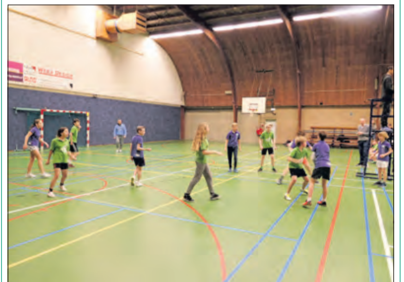
Via lijnbal proeft de jeugd al iets van volleybal.

houden ook in dat je samenwerkt en dat uitdraagt.’