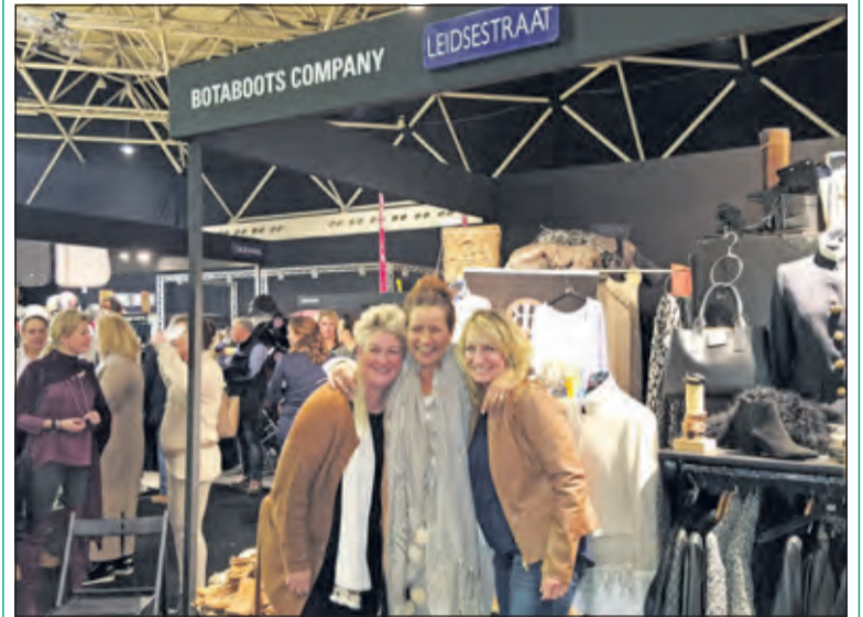
Het team van Botaboorts is altijd in een opperbest humeur.

Je kan bijna geen gerenommeerd paarden evenement verzinnen of Botaboots is van de partij. Afgelopen week waren ze aanwezig tijdens Jumping Amsterdam waar vanaf donderdag de paden in het strodorp druk belopen werden door het paardenminnend publiek. Bij BotaBoots is de beleving in de stand net zo prettig als in de Maartensdijkse showroom. Ook tijdens topdrukte weten de dames een warm welkom te bieden en iedereen volledige aandacht te schenken. Louise Vermeer wist ook tijdens Jumping weer een plek voor ontmoeting boordevol gezelligheid te creëren. Zondagavond was de stand weer leeg en met aangevulde voorraadkasten vertrekken de dames deze week naar de hengstenkeuring in Den Bosch voor het volgende 4-daagse evenement.