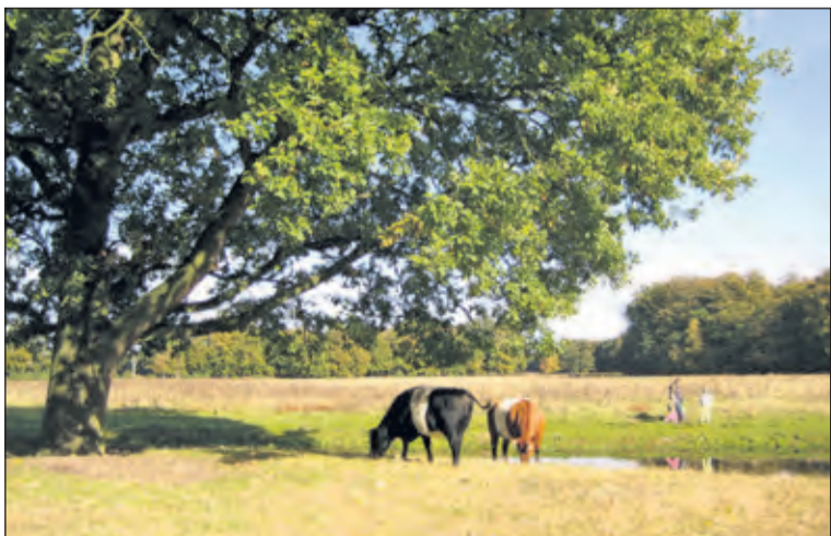
Houdringe bestaat voornamelijk uit bos en open grasland.

Utrechts Landschap organiseert op zondag 5 februari een wandelcursie over Landgoed Houdringe. Er staan dikke eiken en beuken met een doorsnede van meer dan een meter. Deze bomen zijn ruim 225 jaar oud. Huize Houdringe is in 1779 gebouwd. Rondom het huis is de tuin deels in de Engelse landschapstijl en deels in de Franse barokstijl aangelegd. Start vanuit Paviljoen Beerschoten (Holle Bilt 6, De Bilt) voorbij de parkeerplaats van de Biltsche Hoek linksaf. De wandeling duurt ongeveer 1,5 uur. Vertrektijd 14.00 uur. Vooraf aanmelden is niet nodig en deelname is gratis.