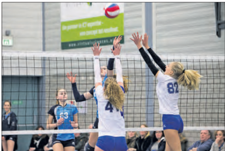
Een 4-0 zege tegen de voornaamste concurrent, daarmee onderstreept de hemelsblauwe brigade haar titel aspiraties met een heel dikke stift.