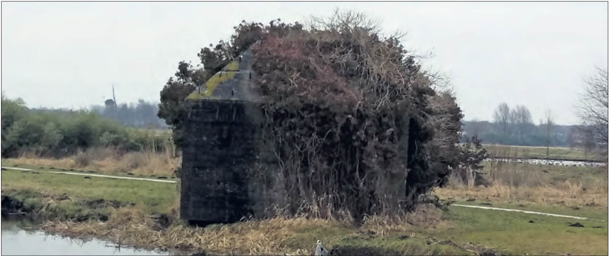
Een groepsschuilplaats in het recreatiegebied Ruigenhoek met op de achtergrond de molen Geesina.

De startlocatie is het clubhuis van de hockeyvereniging SCHC, Kees Boekelaan 1, Bilthoven. Er kan worden ingeschreven vanaf 8.00 uur. Om 9.00 uur starten de 40 km-lopers. Tussen 9.00 en 10.00 uur beginnen de 20 km-lopers hun wandeling. De finish sluit om 17.30 uur. Willy: 'We verwachten een ruime belangstelling. Veel hangt natuurlijk af van het weer. Er is geen limiet voor het aantal deelnemers. Wie komt en betaalt kan de tocht lopen. Iedereen, die van rust, natuur en mooie uitzichten houdt kan die dag volop aan z'n trekken komen. Verdere informatie is te vinden op www.ws78.nl '.