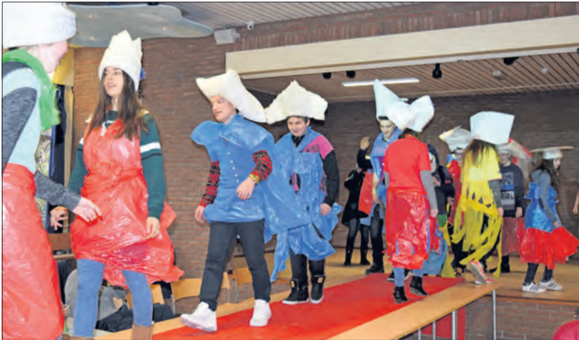
Derdeklassers geven een show op de catwalk.

diverse kunstwerken. Zij vertelt: ‘Vanuit mijn vele jaren praktijkervaring laat ik de leerlingen ontdekken wat hun eigen manier van werken is en waar hun kwaliteit ligt. Zo leer ik hen om, vanuit het materiaal, een hoofddekseel te maken. Zij leren kijken en voelen wat er gebeurt als zij met het materiaal aan de gang gaan. Tijdens de workshop laat ik de leerlingen ontdekken dat er niet één manier is, maar dat zij hun eigen aanpak kunnen volgen en dat dat even goed is als alle andere’. Sinds vorig jaar februari zwaait een nieuw bestuur de scepter bij de Bilthovense Oranje Nassauschool (vanaf 1 augustus aanstaande Aeres Mavo). Karel Bakker en Karin Kortenhorst hebben nog geen idee of de workshops volgend jaar doorgaan. Maar als dat wel zo is, komen zij graag terug om een volgende lichting derdeklassers met mode te laten kennismaken.