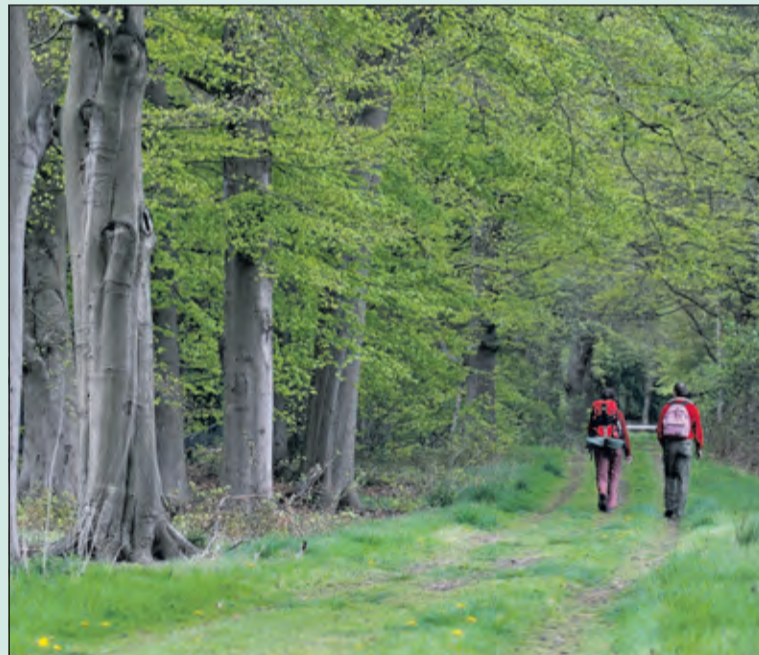
De ridderoordse bossen vormen de grondslag voor het Utrechts Landschap.