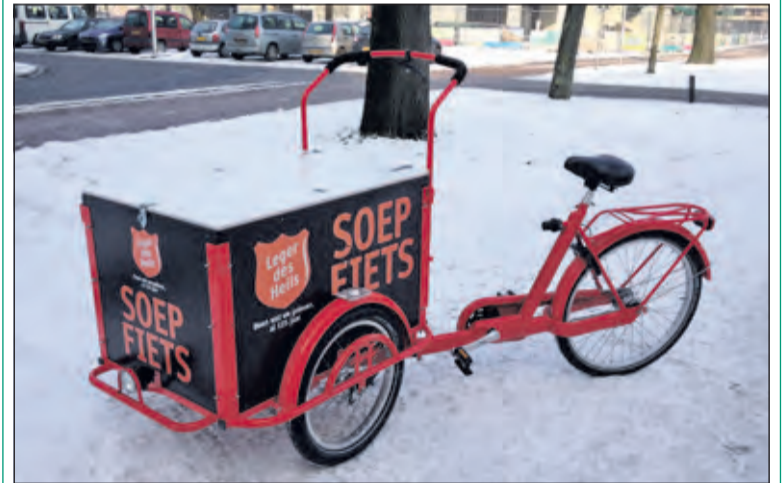
Op maandagavond rijdt de soepfiets van het Leger des Heils rond.