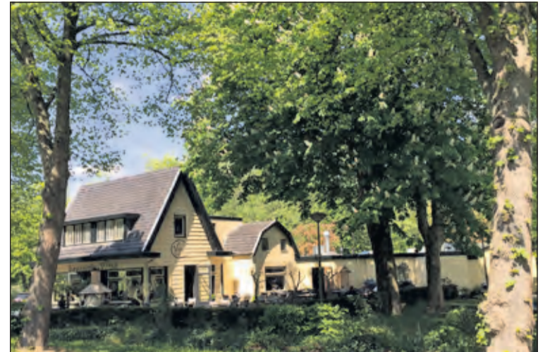
Brasserie Vink langs de Utrechtseweg in De Bilt.

februari reserveert (ovv Nieuwjaarsactie) krijgt u een lekker glas bubbels.