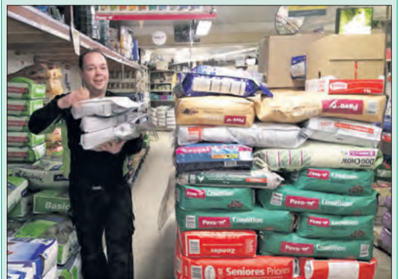
Firma van der Neut levert een uitgebreid assortiment diervoer.

In aansluiting op ons assortiment voor huisdieren hebben wij ook voer afgestemd op pluimvee en diverse soorten vogels zoals; sierduiven en parkieten. Bent u op zoek naar voer voor uw paard dan hebben wij ook een ruime keuze hierin. Tevens hebben wij een ruim assortiment voor zowel de (veelseisende) doe-het-zelver alsmede de professionele vakman. Al met al een breed assortiment, deskundig advies en service die net iets verder gaat. Daar gaat het bij ons om. Tevens beschikken wij over ruime gratis parkeerplekken. Dus graag tot ziens bij ons in de winkel.