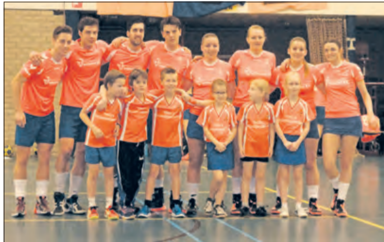
DOS presenteert zich, samen met de E1.

Alleen in de korfzone wilde men het af en toe te mooi doen, maar daar was het de wedstrijd ook naar. Een ruime 24-7 overwinning gaf voldoende duidelijk het krachtsverschil weer tussen de koploper en