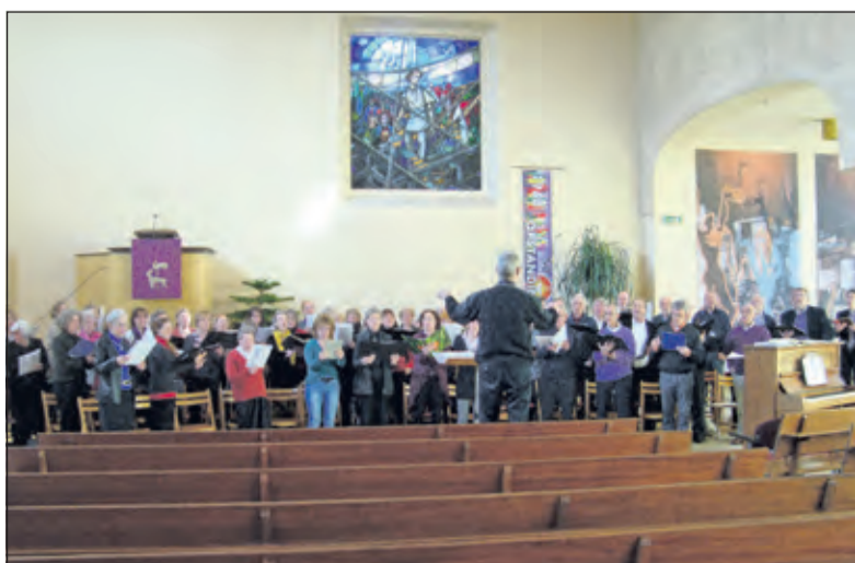
Liefhebbers van J.S. Bach worden uitgenodigd voor het projectkoor.