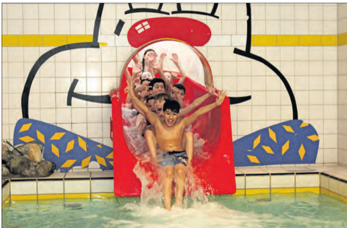
Nieuw zwembad Brandenburg was een politieke glijbaan.