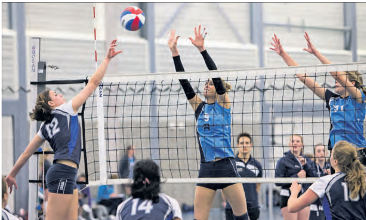
Irene Dames 1 blijkt erg stabiel met weer een 4-0 winst.