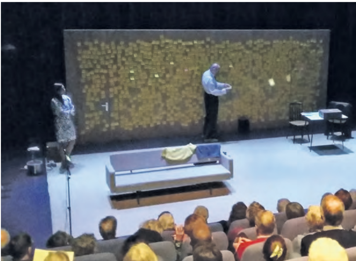
De voorstelling 'Hoe mooi alles' in een uitverkochte theaterzaal van het Lichtruim.