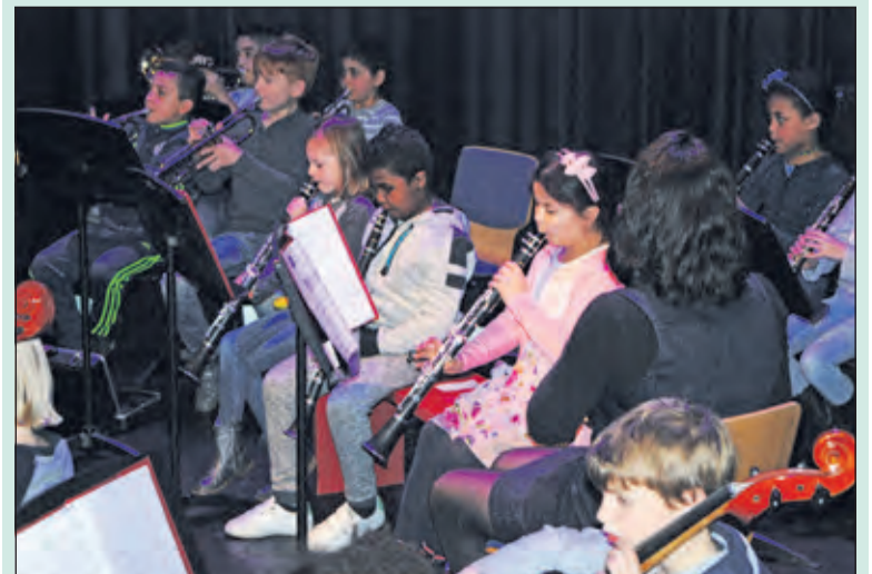
Woensdag 25 januari gaven de leerlingen van basisschool Wereldwijs samen met de cliënten van Reinaerde een winterconcert als onderdeel van het KunstOrkest in Het Lichtruim en Bilthoven. [HvdB]