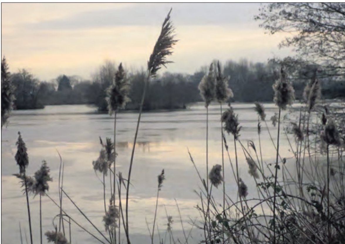
Er wordt volop genoten van dit mooie gebied én van de lokale flora en fauna.

een prima natuur- en cultuurhistorische ervaring die met een uitgebreide gut burgerlijke stampot met worst smakelijk en in stijl werd afgesloten. (Frank Klok)