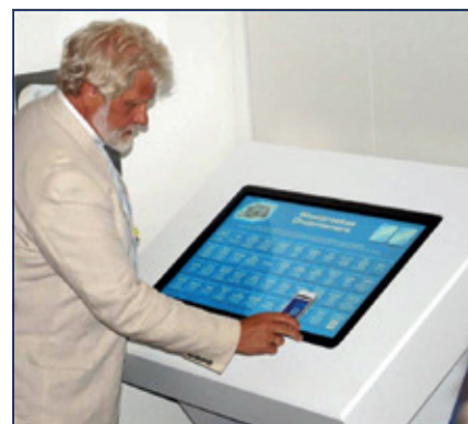
Ondernemers uit Westbroek presenteren zich digitaal op het ondernemersportaal.