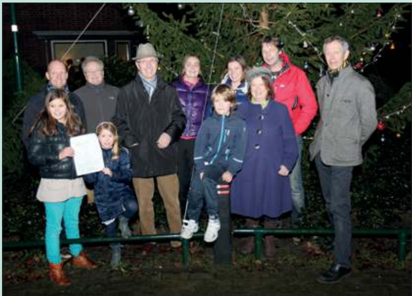
De boom ter hoogte van Waterweg 9 in De Bilt werd uiteindelijk winnaar van deze jaarlijks terugkerende actie van Wijk- en Dorpsgericht Werken. De cheque voor de mooiste boom wordt op donderdag 27 december uitgereikt aan de contactpersoon van de Waterweg.

In de week voorafgaand aan kerst brachten wethouder Bert Kamminga en de wijkcontactambtenaren een bezoek aan een aantal van deze kerstbomen. Zij werden hartelijk ontvangen door de buurtbewoners. Een groot deel van de buurten en straten heeft vorige jaren ook al deelgenomen, maar dit jaar waren er maar liefst acht nieuwe aanvragen. Wethouder Kamminga bezocht met name de bomen van de nieuwe deelnemers. Op alle locaties werd hij warm onthaald. Letterlijk met een warme drank (chocolademelk of glühwein), maar figuurlijk door de vele buurtbewoners die bij de boom in hun buurt bijeen kwamen en zo alvast met elkaar in de stemming kwamen voor de feestdagen.