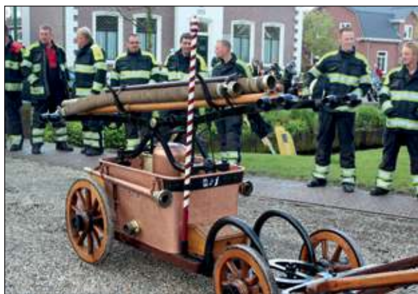
April: De antieke handspuit van de Westbroekse brandweer.

Op 5 februari gaat de ijsbaan in De Bilt open en begint de ijspret. Vier dagen lang heet De Bilt Speikerreik en vie-