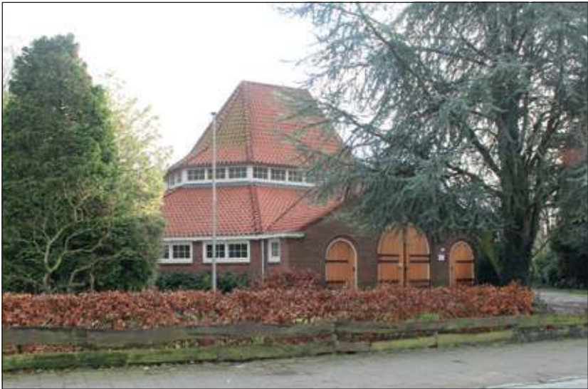
Sinds enige tijd worden er plannen ontwikkeld betreffende het sluiten en mogelijk slopen van kerkgebouwen in Bilthoven. Dat betreft niet alleen de Julianakerk maar ook de Noorderkerk en de Zuiderkapel.

Het Biltse College van Burgemeester en Wethouders informeerde de gemeenteraad via het mededelingenblad van 27 september 2012 over het her-starten van de monumentenprocedure betreffende de kerkgebouwen van de Algemene Kerkenraad van de Protestantse Gemeente Bilthoven en de Laurenskerk. In het laatste mededelingenblad van 2012 meldde het College de voortgang.