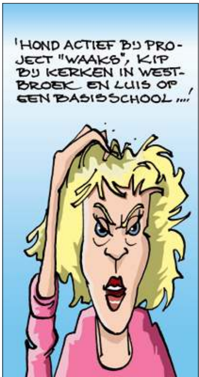
Oktober: En op 4 oktober was het dierendag...