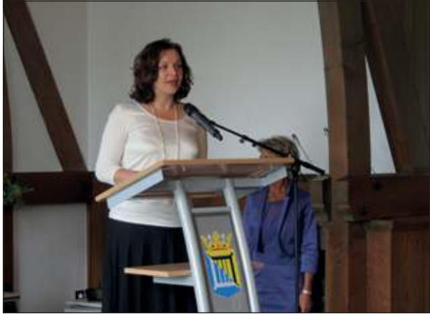
Juli: Minister Edith Schippers van VWS houdt op Jagtlust een toespraak bij de totstandkoming van USP Bilthoven.