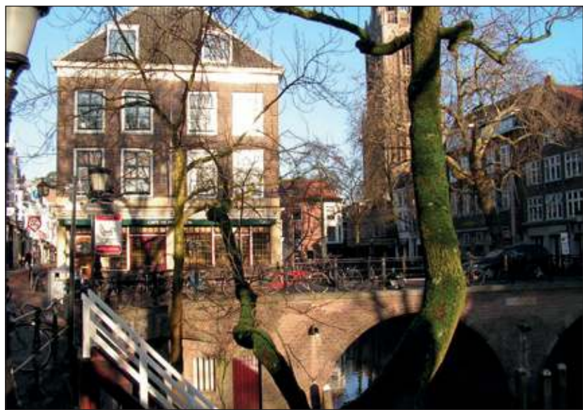
Dezelfde situatie in december 2012.