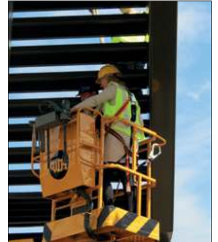
Juni: Minister Melanie Schultz van Haegen verricht de openingshandeling voor de tunnelbouw bij station Bilthoven.

de Biltse raad. Het Gemeentelijk Servicecentrum Maartensdijk wordt gesloten. In de bijlage Brugklas in Zicht vertellen aanstaande brugpiepers over hun toekomstverwachtingen. In de Nootjes worden 2 rood/wit gestreepte strandstoeltjes te koop aangeboden.