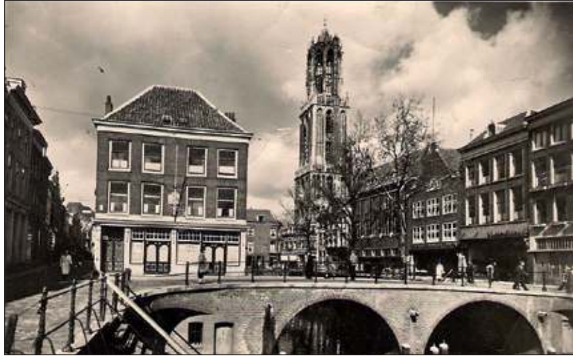
Gezicht op de Utrechtse Dom. Links in kijkt in de Lijnmarkt. In het midden Café Het Gildenhuis. Rechts het huis waar de schrijver zijn jeugd doorbracht.