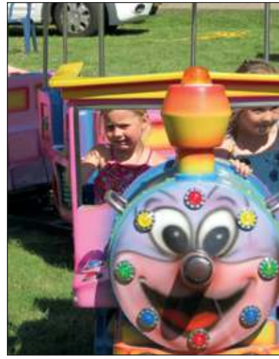
Augustus: Op het Houthakkersfeest in Lage Vuursche vermaken kinderen zich in een rondrijdende trein.