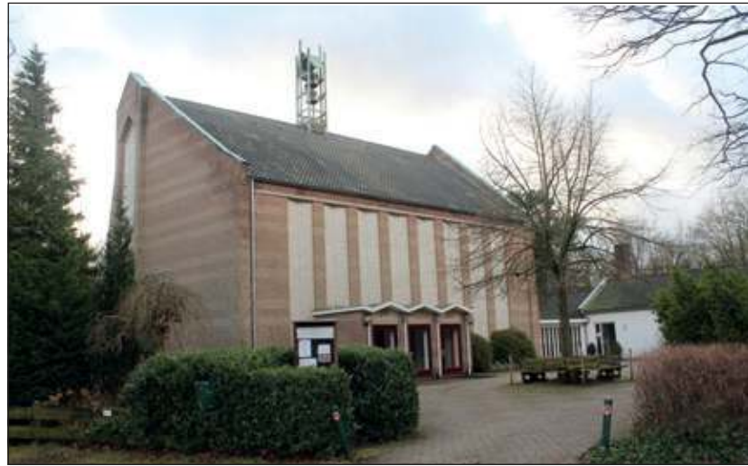
De Noorderkerk, gebouwd in 1954, kreeg ontheffing voor de bouwhoogte van de toren inclusief de klokkenstoel van 19,37 meter hoog. De grootste klok heeft een diameter van 78 cm en weegt 300 kg. De tweede klok heeft een diameter van 69,8 cm en weegt 215 kg.

derkerk en de Zuiderkapel gevraagd naar hun zienswijze over een voorgenomen aanwijzing tot monument. Daarover heeft het College zowel positieve als negatieve reacties ontvangen, waarbij vooral wordt gewezen op de gevolgen van de fusie van de kerkelijke gemeentes in Bilthoven.