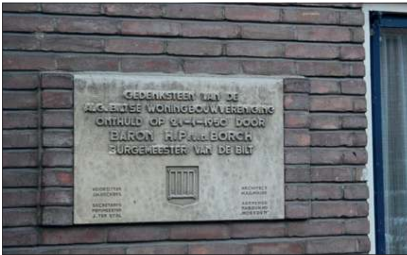
De gedenksteen van de Alg. Biltse Woningbouwvereniging.

De bewonerscommissie van het Burgemeester van Heemstrakwartier is in 1988 opgericht. Zij is destijds ontstaan om de centraal gelegen speelplaats voor de ondergang te behoeden. Na een aantal jaren is er een buurtbeheer gekomen waarbij met instanties als de gemeente, de woonstichting SSW, het buurtwerk en de politie wordt overlegd. Bij het gemeentebestuur van de laatste jaren is het wijk- en buurtgericht werken steeds centraler komen te staan. De bestaansreden van de commissie is hierdoor volop aanwezig. Het huidige bestuur vindt dan ook dat er alle reden is een bescheiden feestje te vieren, waarop zoveel mogelijk huidige bewoners aanwezig zullen zijn. Ook hoopt zij dat naast een aantal genodigden ook vroegere bewoners de weg naar 't Hoekie aan de Prof. Dr. T.M.C. Asserweg 2 zullen weten te vinden.