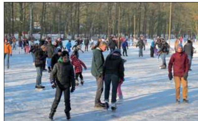
Februari: Honderden schaatsliefhebbers genieten van het natuurijs.

De resultaten van de vierde burgerpeiling worden bekendgemaakt. Inwoners blijken redelijk tevreden. Op 17 en 18 maart is het voor de vierde keer Gluren bij de Buren. Op 23 adressen staan de