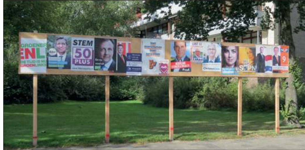
September: Er viel weer heel veel te kiezen.