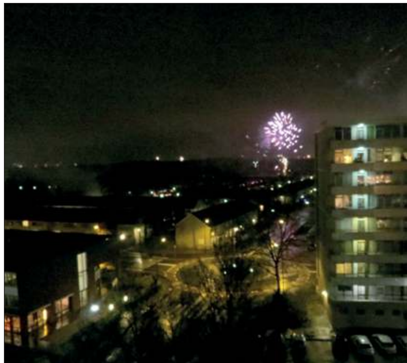
Om 2013 te vieren werd veel siervuurwerk afgestoken.