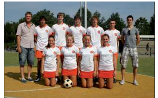
Maart: Het team TZ A1 met begeleiders.

Tweede Paasdag om 12.00 uur gaan bij boer Blaauwendraad in Westbroek 55 bontgeklepte koeien na vijf maanden op stal, uitgelaten de vrije natuur in. Leerlingen van de Julianaschool nemen de loopbus in gebruik. Bomen op het perron van station Bilthoven worden gekapt, resten nog de spoorbomen. De personeelsvereniging Brandweer Westbroek presenteert de antieke gerestaureerde handspuit van de brandweer Westbroek. Alle dorpen hebben een uitgebreid programma voor Koninginnedag. Het groen van De Vierklank kleurt oranje. Burge-