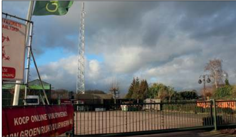
Overleg over zendmast Hollandsche Rading leidt tot nader communicatie-onderzoek.

Het overleg heeft geen concrete andere locatie opgeleverd waar de mast zonder bezwaren kan worden geplaatst en de omwonenden hebben naar aanleiding van het overleg van het College een brief ontvangen. De mast is intussen gerealiseerd. Het College constateert dat voor het verlenen van de vergunning de juiste juridische procedure is doorlopen met een tweetal publicatiemomenten