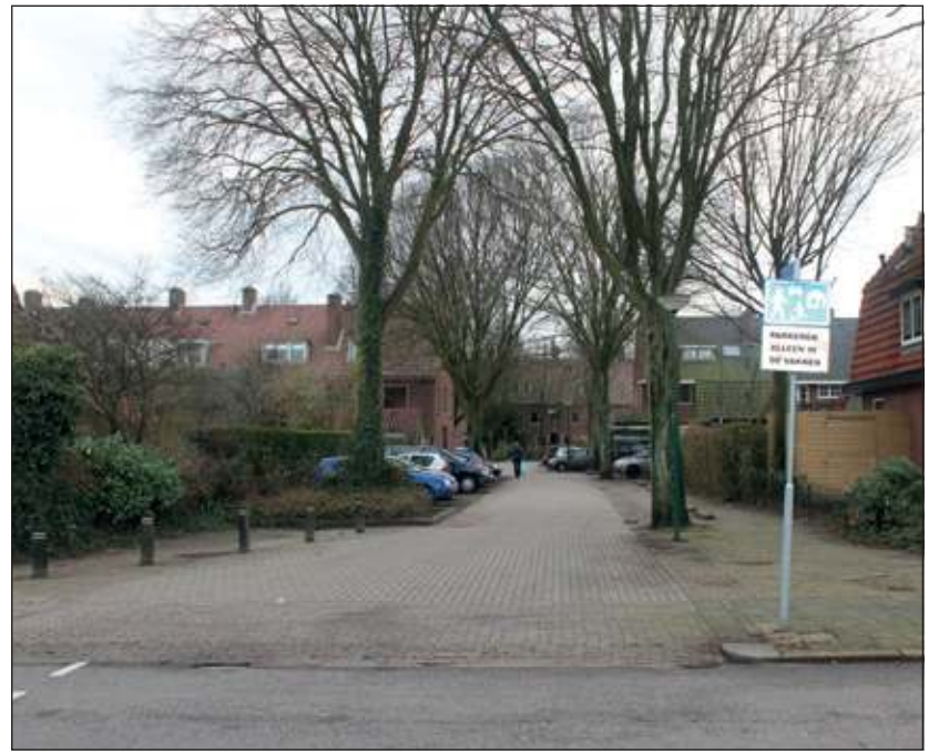
Het van Heemstrakwartier kent meerdere toegangswegen. Volgens de bewonerscommissie is die aan de Looydijk het meest 'in trek'. Daar staat ook het mededelingenbord, een onmisbare schakel in de hechte bewonersvereniging.

Een team van PvdA-leden bezocht begin december 2012 in de bittere kou het Burgemeester van Heemstrakwartier. 'Het blijkt prettig wonen te zijn in het Heemstrakwartier en er is zicht op structurele verbetering van de woonsituatie door de renovatie van de huurwoningen' was hun conclusie. In totaal werden zo'n veertig gesprekken gevoerd met bewoners. Bewoners van het Burgemeester van