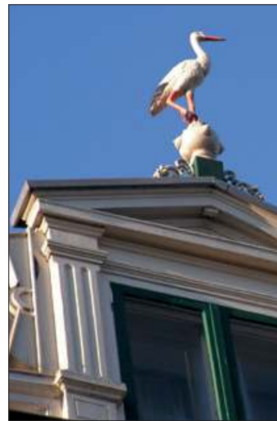
De lepelaar staat er nog steeds.