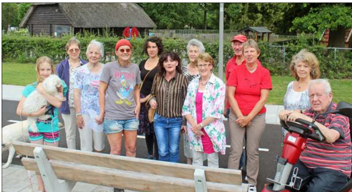
Omwonenden van en bij de Schaapskooi zijn verontrust over de veiligheid en het dierenwelzijn daar ter plaatse.

in de Biltse gemeenteraad zijn op voorhand benaderd, evenals de lokale pers en woonstichting SSW met vragen als: 'Kan de gemeente, als eigenaar van het complex, adequate maatregelen nemen om het vandalisme tegen te gaan en het dierenwelzijn zeker te stellen? Bijvoorbeeld door zorg te dragen te zorgen voor hogere stabielere