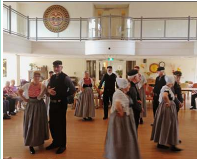
Bewoners en medewerkers van De Bremhorst genieten van het optreden van Pieremachochel.

Ondanks de hitte en veelal dikke kleding gingen de volkdansers er helemaal voor. Met heel veel dans en humor lieten ze een geweldig optreden zien. Ook de bewoners en medewerkers werden uitgedaagd voor een dansje waardoor een heerlijke middag ontstond.