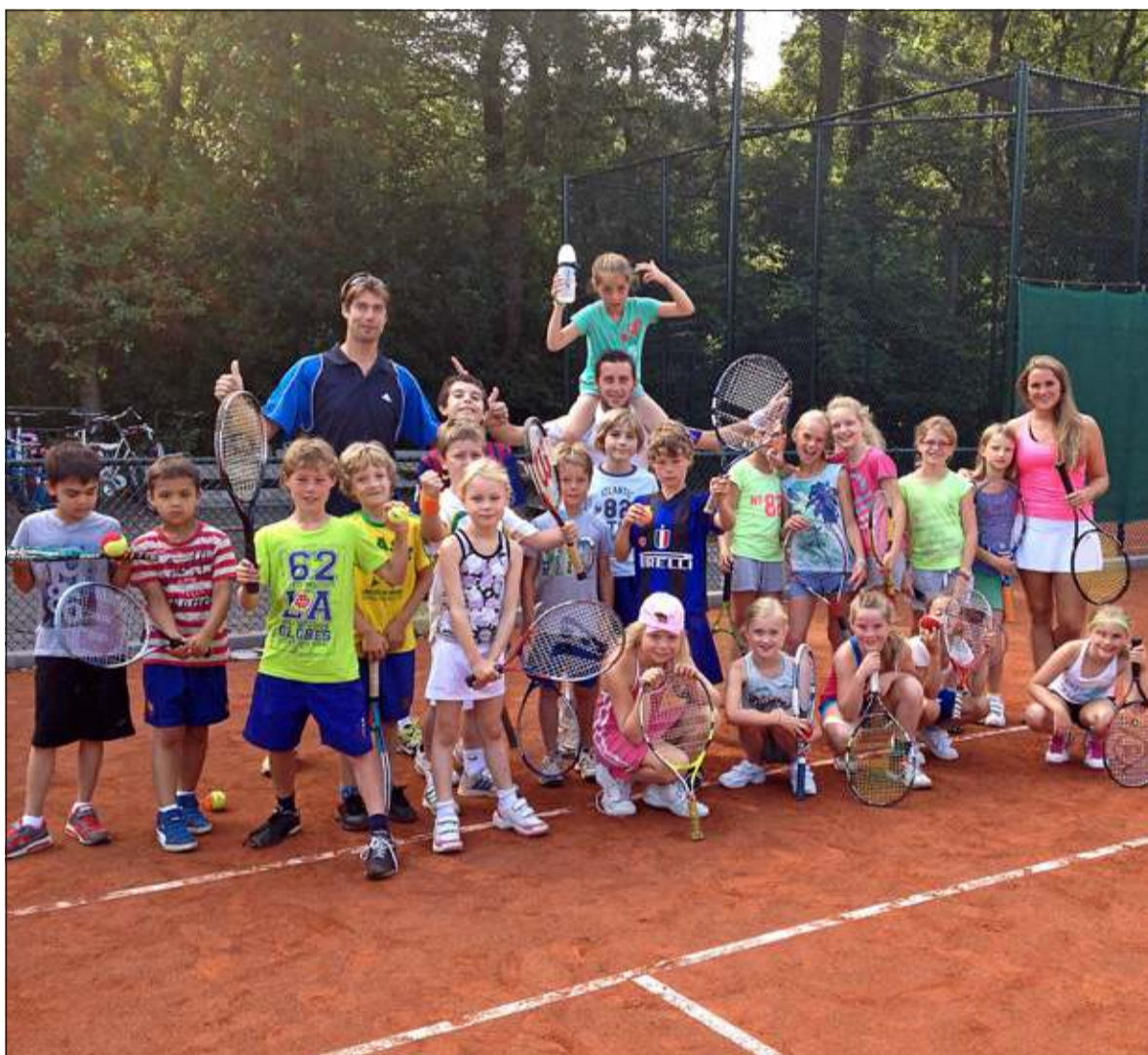
De tennisweek bij TC Voordaan was dit jaar reuze populair.