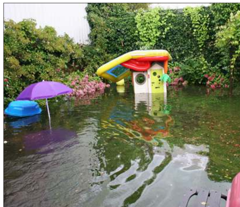
Wat eerste een tuin was, veranderde in korte tijd in een waterpark.