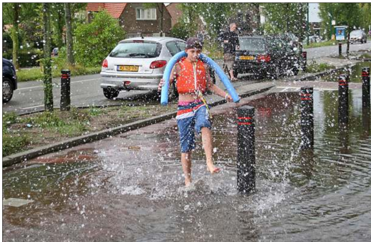
Het ondergelopen fietspad nodigde uit tot lol, maar veroorzaakte bij aanliggende percelen voor enorme wateroverlast.

De brandweer werd overspoeld door telefoontjes van wanhopige mensen waarvan het huis was ondergelopen. Die moesten geduld hebben, want de plekken waar levenbedreigende situaties ontstonden door bijvoorbeeld instortingsgevaar, gingen toch echt voor.