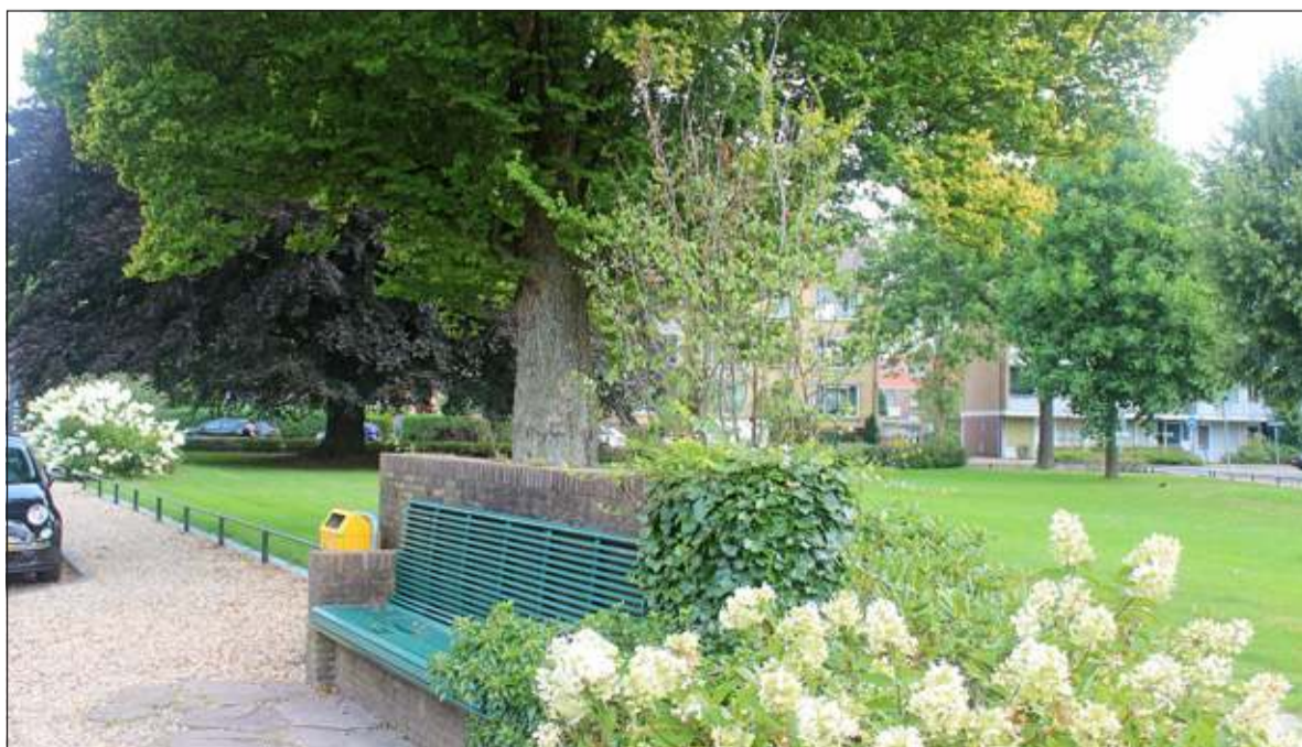
Een naamloze bank, een goudiep en een rode beuk markeren het Dr. Letteplein..

De Bilt geleid kan worden; kosten noch moeite worden gespaard. Dat is zinvol en heel verstandig. We willen immers allemaal vlot en veilig en liefst stil, zonder roet, trillende raamspioningen en fijnstof De Bilt in en uit rijden. Máár: leefbaarheid hoort daarbij: een groene en aardige omgeving zoals het Dr. Letteplein, een mooi historisch stukje om trots op te zijn. Een groen stukje! Gaan wij straks wonen aan een randweg?