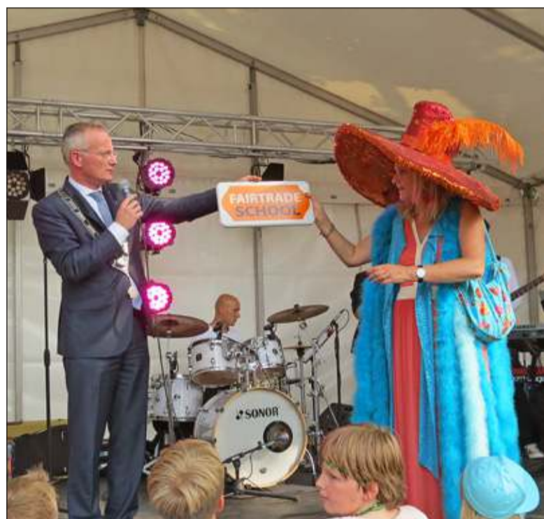
De burgemeester hoopt dat het bord Fairtrade School een hele mooie plek op de school krijgt.