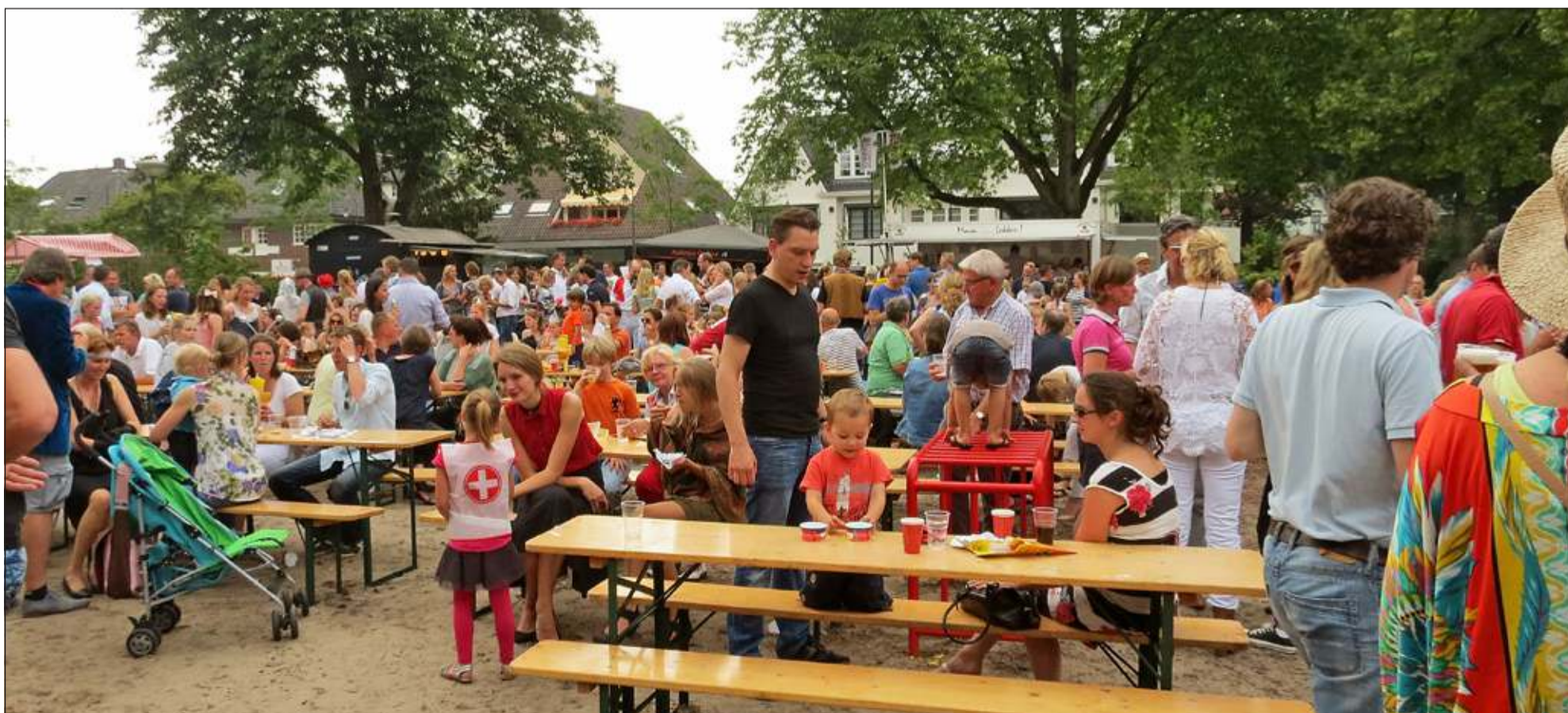
De uitreiking vond plaats tijdens een groots slotfeest van de Julianaschool dat als thema had: 'Back to the future'.