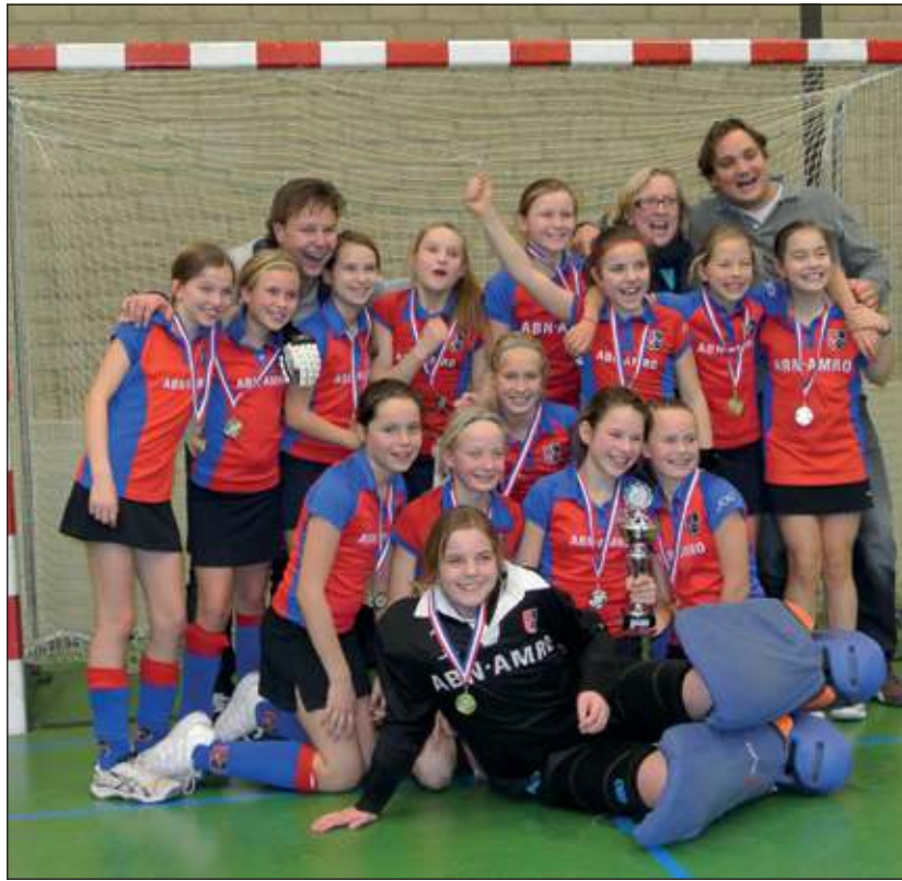
Landskampioenen zaal hockey uit Bilthoven.

SCHC scoorde vrijwel direct en de ruststand was 1-0. Er wordt nog wel een gelijkmaker door Rotterdam gemaakt, maar daarna was er geen houden meer aan: 2-1, 3-1, 4-1 en een strafbal bepaalden de eindstand 5-1 voor de Bilthovense girls en het landskampioenschap voor de Bilthovense kanjers. (Andrea Boekhorst)