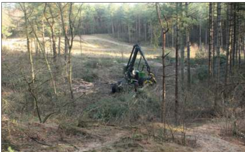
Inmiddels is gestart met het groter maken van zandafgraving De Kuil.

Het vellen van de bomen gebeurt met een zogeheten 'Harvester'. Deze geavanceerde houtoogstmachine kan nauwkeurig en precies werken. Hij velt en onttakt de bomen en zaagt de stam in stukken van gewenste lengte. De stammen worden opgestapeld in afwachting van transport naar de zagerijen. De paden in het werkgebied blijven toegankelijk, maar kunnen tijdelijk minder goed begaanbaar zijn - zeker bij regenachtig weer - doordat ze stuk gereden worden door het werkverkeer. De paden worden zo snel mogelijk hersteld, maar dit herstelwerk kan pas uitgevoerd worden als het werk afgerond is en de paden goed droog zijn. Vóór het broedseizoen 2013 - dus vóór 15 maart - zal de rust in het bos zijn weergekeerd. Het Goois Natuurreservaat werkt volgens de Gedragscode Zorgvuldig Bosbeheer. Dat betekent dat vóór aanvang van de werkzaamheden wordt bekeken of er bijvoorbeeld dassenburchten, mierenhopen of nesten van roofvogels aanwezig zijn in het werkgebied. En als die er zijn, worden er maatregelen genomen om deze te beschermen.