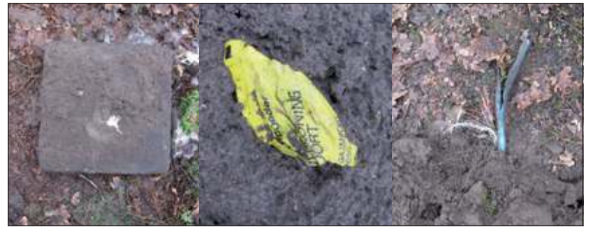
Een kleine selectie van de vervuiling van de grond met allerlei soorten afval.

Op een aantal stukken pad waar het hele jaar door plassen zijn, is geen aarde gestort. De Vierklank informeerde waarom niet. 'Vanwege beperkt budget is het niet mogelijk om alle paden te herstellen.' Tussen de opgehoogde grond troffen we bossen elektriciteitskabels, verpakkingsmateriaal, prikkeldraad, bakstenen, tegels, resten pvc-buis, plastic fles-