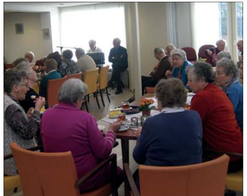
Volle bak bij Toutenburg.

Zij speelden op de synthesizer en zongen samen met de bewoners waarbij bleek dat de bewoners van Toutenburg toch eerder enthousiast zongen dan die van Dijkstate.