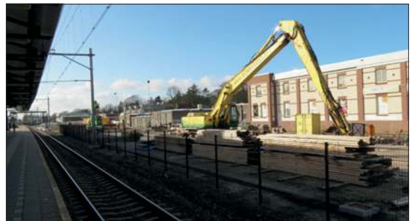
Nieuwe mogelijkheden voor een jarenlang verloederd gebied.