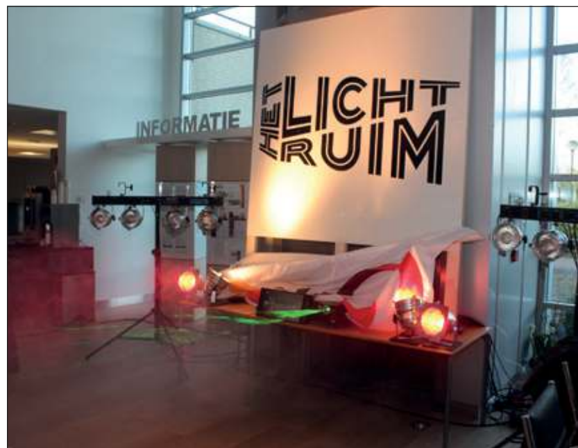
Met een spectaculaire laser- en lichtshow werd de naam 'HET LICHTRUIM' onthuld.

De bouw van het Lichtruim straalt ambitie uit. En aan ambitie ontbreekt het deze gemeente niet. Die ambitie is er al heel lang. Eind jaren vijftig werd hier namelijk het eerste overdekte winkelcentrum van Nederland gebouwd: de Planetenbaan, al snel gevolgd door de Grote en de Kleine Beer: een woonwijk was gevormd...'