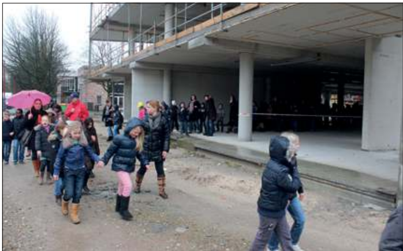
Leerlingen van basisschool Wereldwijs namen alvast een kijkje bij hun nieuwe onderkomen.

Woensdag 30 januari werd de nieuwe naam en het logo van het Cultureel en Educatief Centrum in Bilthoven onthuld. Op het kantoor van woonstichting SSW aan de Waterman in Bilthoven werd met een spectaculaire laser- en lichtshow de aanwezigheid bekend gemaakt.