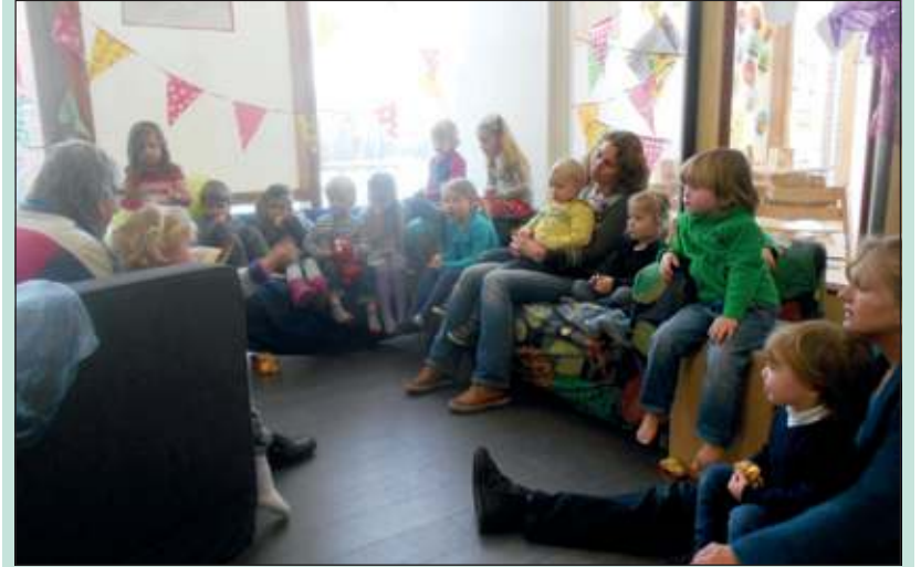
Op alle ochtenden van de 10 dagen durende voorleesweek komt er een opa of oma voorlezen. En de kinderen? Die vinden het geweldig!

Voorlezen aan kinderen is belangrijk. Het prikkelt de fantasie, ontwikkelt het taalgevoel en bezorgt hun veel plezier. Speciaal voor baby's, peuters en kleuters zijn er De Nationale Voorleesdagen. Deze dagen hebben als doel het voorlezen aan kinderen die zelf nog niet kunnen lezen, te bevorderen. Zo worden kleintjes grote lezers.