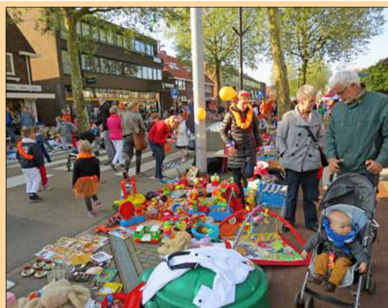
De Bilt - Gezellige drukte op de Hessenweg bij de kindervrijmarkt. [GG]