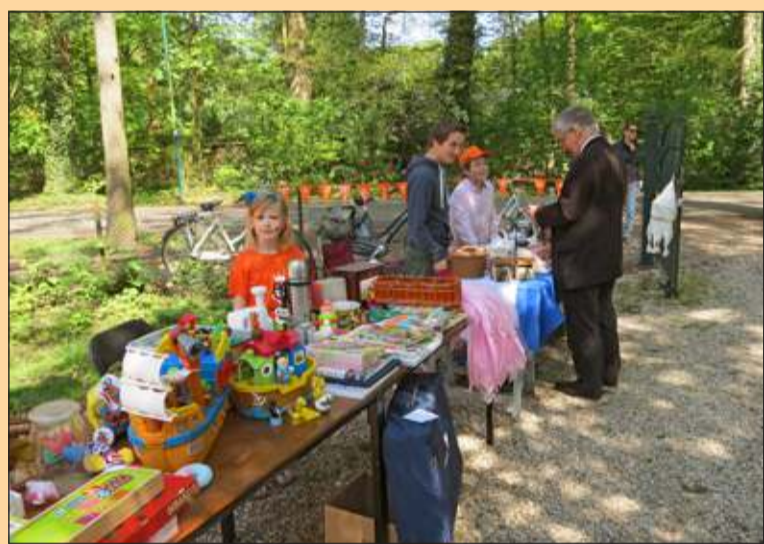
Lage Vuursche - Voor het eerst was er een kledjesmarkt voor kinderen op het kerkplein. [GG]