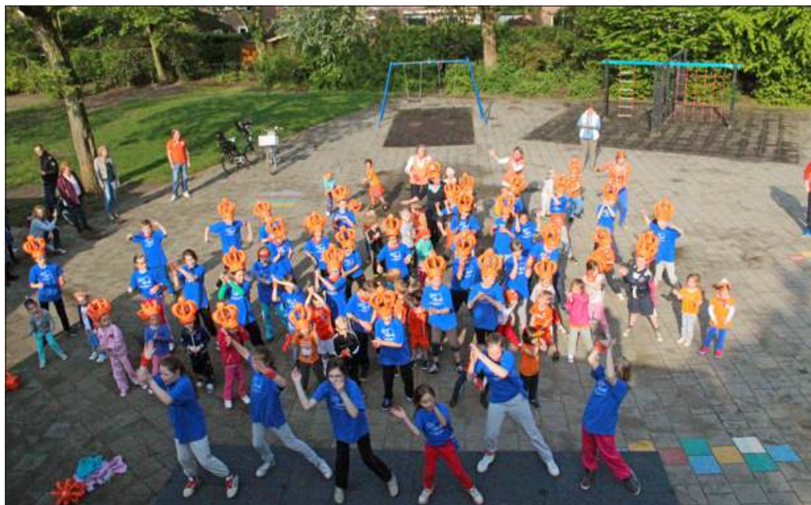
Ook in Maartensdijk op de Martin Luther Kingschool werd de Kanga gedaan.