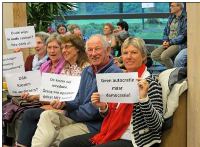
Op de publieke tribune maakten Beter De Bilt-kiezers hun ongenoegen duidelijk kenbaar.