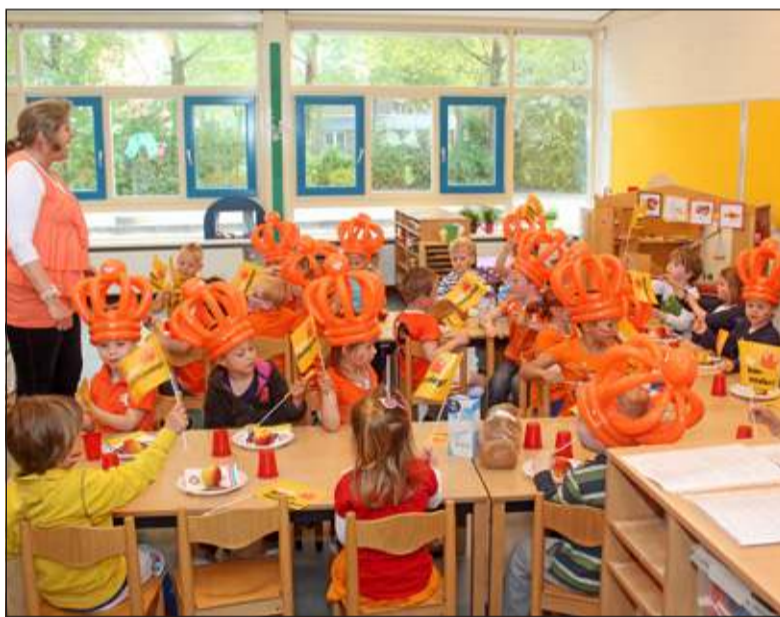
Ook bij groep 1/2 (De Uiltjes) van Juf Tanja en juf Els van de Martin Luther Kingschool in Maartensdijk was er een echt Oranje-ontbijt.

De Koningsspelen vonden dit jaar plaats op vrijdag 25 april, de laatste vrijdag voor Koningsdag. Voordat de leerlingen de Koningsportdag begonnen, ging men eerst klassikaal met de hele school aan tafel voor een goed en feestelijk ontbijt. Cruciaal om genoeg energie te krijgen om lekker te kunnen bewegen. Aan alle deelnemende scholen werd het ontbijt gratis aangeboden door Jumbo Supermarkten in samenwerking met enkele partners. Vrijdag 25 april startte de Koningsportdag officieel starten met 'Doe de Kanga'. Op het vrolijke en opzweepende nummer konden alle deelnemende leerlingen met elkaar de spieren opwarmen voor de Koningsportdag. Wanneer dit allemaal tegelijk gedaan werd, werd hier een wereldrecord mee gevestigd.