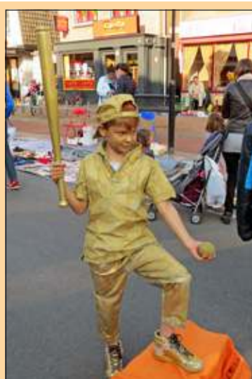
De Bilt - Een levend standbeeld staat roerloos op de kindervrijmarkt in De Bilt. [GG]