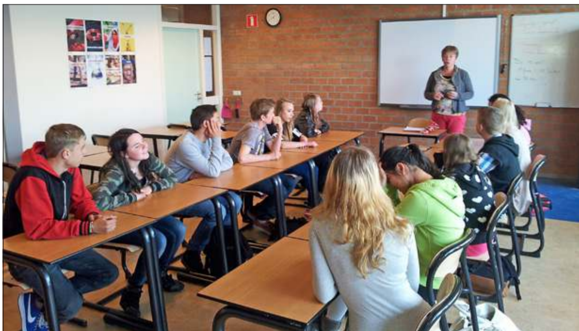
Gastdocenten brengen boekenwijsheid en vakkennis samen tot een aansprekend geheel.

kijken op een zeer waardevolle ervaring. Voor de leerlingen is het een leuke en praktische aanvulling op de lesstof uit de boeken. Belangrijk is dat tijdens de gastlessen de leerlingen bewuster gaan nadenken over de gevolgen van aankoopkeuzes. Het is de bedoeling dat het project volgend schooljaar weer zal plaatsvinden.