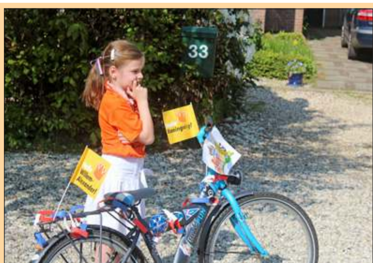
Groenekan - 'Wat zal ik doen?' [HvdB]

Hollandsche Rading - Midden april jl. droeg de aannemer het nieuwe Dorpshuis in Hollandsche Rading over aan de gemeente De Bilt. Vervolgens werden de inrichtingspuntjes op de i gezet.