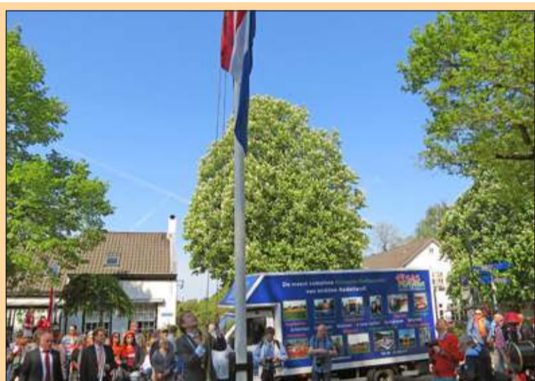
Lage Vuursche - De Baarnse burgemeester jhr. Mark Roëll hijst de vlag in het dorp Lage Vuursche. Leden van muziekvereniging Crescendo uit Baarn speelden daarna het Wilhelmus. De burgemeester sloot de plechtigheid af met 'Leve de Koning' en een driewerf hoera. [GG]