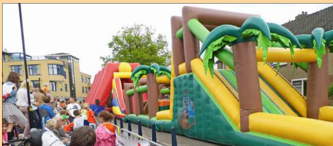
Maartensdijk - 's Middags kon de jeugd zich in teams volledig geven op de grote stormbaan. Het publiek kon alles goed zien. De groep bestuursleden van Oranjevereniging Willem-Alexander zijn al na aan het denken over volgend jaar. Gespeeld wordt al met de gedachte om weer een autocross te organiseren. [MD]