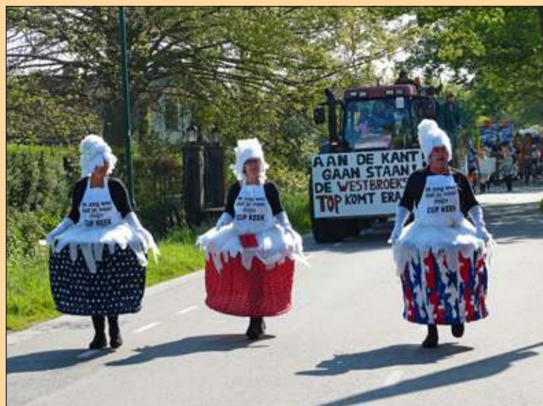
Westbroek - Wandelende Cup Keeks in de optocht [MN]

Zoals ieder jaar duurden de festiviteiten rond Koningsdag in Westbroek verschillende dagen. Het dorp was fraai versierd: de lantaarnpalen in de kern van het dorp droegen allemaal een feestelijke jurk. Er was een gevarieerd programma voor jong en oud. Met een kinderfeest, de Polderloop, een wandeltocht en een fietspuzzeltocht. Maar ook was er weer het traditionele touwtrekken en ringrijden voor tractoren. De taartenbakwedstrijd en aubade met het Westbroekse volkslied ontbraken evenmin. En daar verscheen zaterdag aan het begin van de middags zelfs een vliegtuigje waaruit parachutisten sprongen die precies op het feestterrein terecht kwamen. Natuurlijk was er de grote optocht met spectaculaire wagens en ook veel originele individuele deelnemers. Het komende afscheid van Cor de Gram was zelfs het thema op drie deelnemende wagens. De jeugd vertoonde haar kunsten tijdens 'Show your talent' in de grote feesttent. Het springkussen werd ook weer druk bezocht. De Oranjevereniging Westbroek heeft er weer een prachtig feest van gemaakt dat op 26 april luidruchtig werd afgesloten door 'Super Sundays'. [MN]