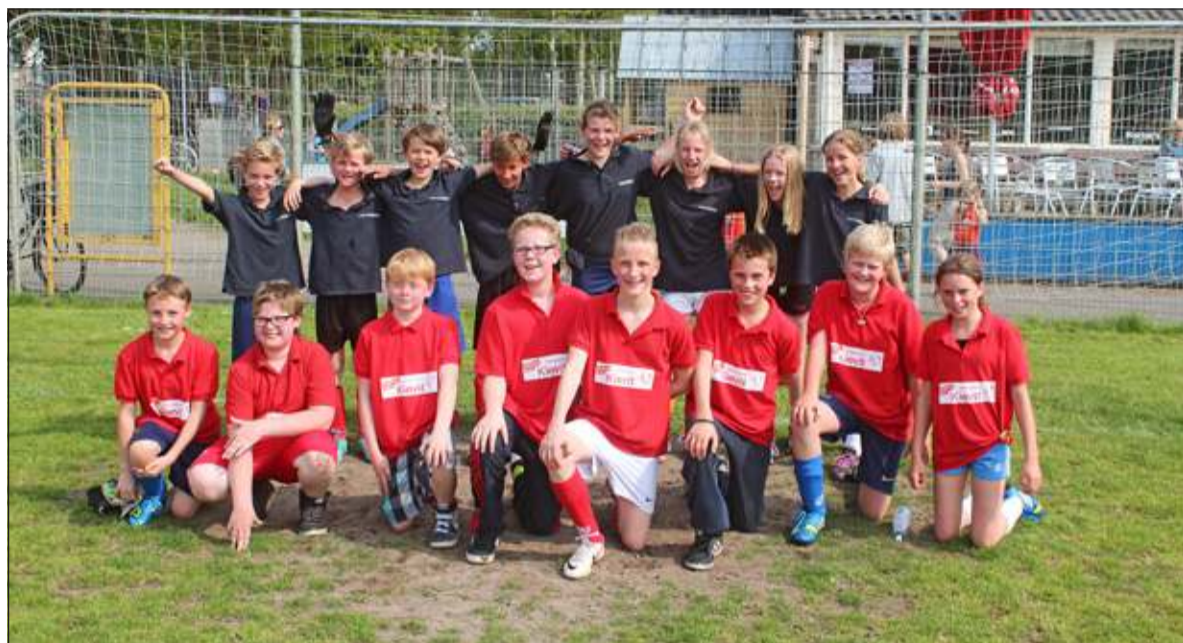
Gehurkt de Kievitschool (2de) en staand de Nijepoort (winnaar) van basisgroepen 8 na de finale.

Groep 3 – 1e de Kievit school 2e en 3e de Martin Luther King-school Groep 4 – 1e de Nijepoort, 2e 't Kompas (Westbroek) en 3e de Martin Luther King-school Groep 5 – 1e en 2e de Martin Luther King-school en 3e 't Kompas Groep 6 – 1e de Nijepoort, 2e de Kievitschool en 3e de Martin Luther King-school Groep 7 – 1e 't Kompas en 2e en 3e de Nijepoort. Groep 8 – 1e de Nijepoort, 2e de Kievitschool en 3e 't Kompas.