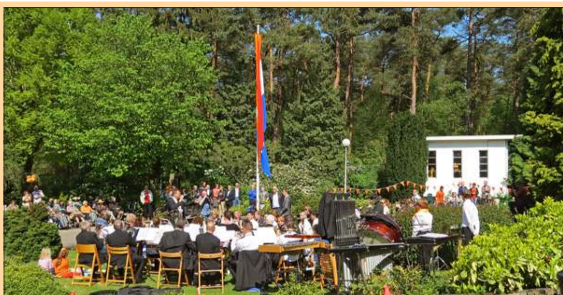
Lage Vuursche - De burgemeester en zijn echtgenote bezochten ook Verpleeghuis Sint Elisabeth waar muziekvereniging Crescendo voor de bewoners een concert verzorgde. [GG]