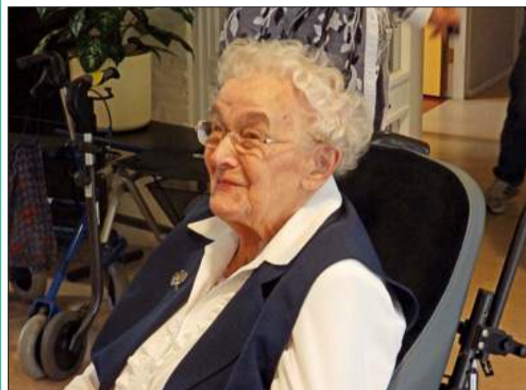
De 100-jarige Mevrouw van Verveveld heeft nog overal belangstelling voor.