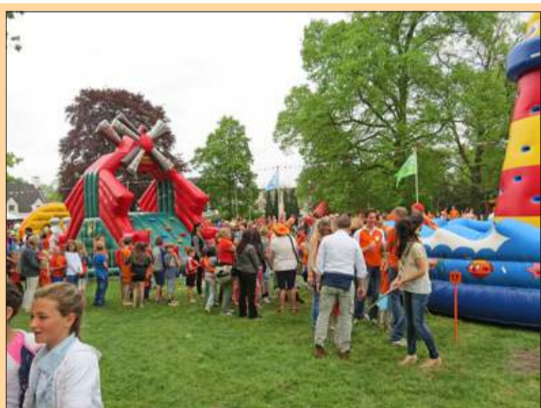
Bilthoven - Het spellenfestival op het gazon van Jagtlust bezorgde kinderen weer veel plezier. [GG]