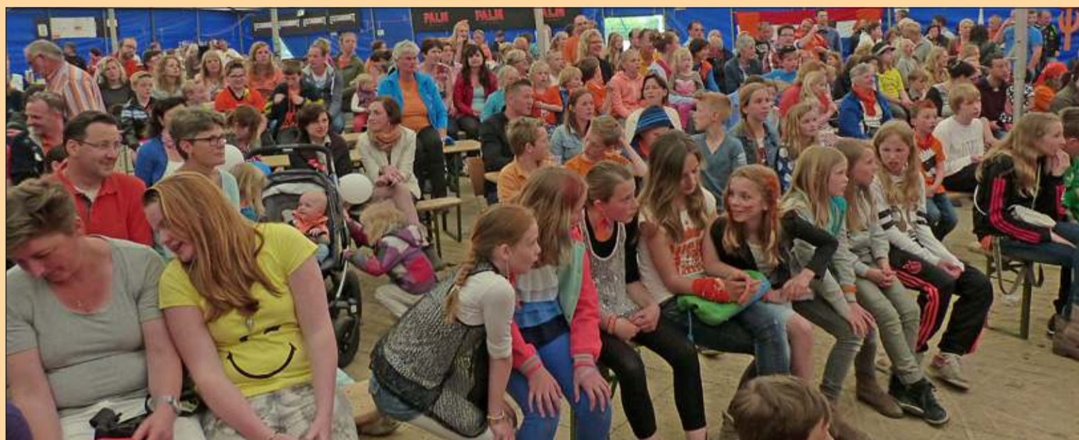
Westbroek - Veel belangstelling voor 'Show your talent'. [MN]