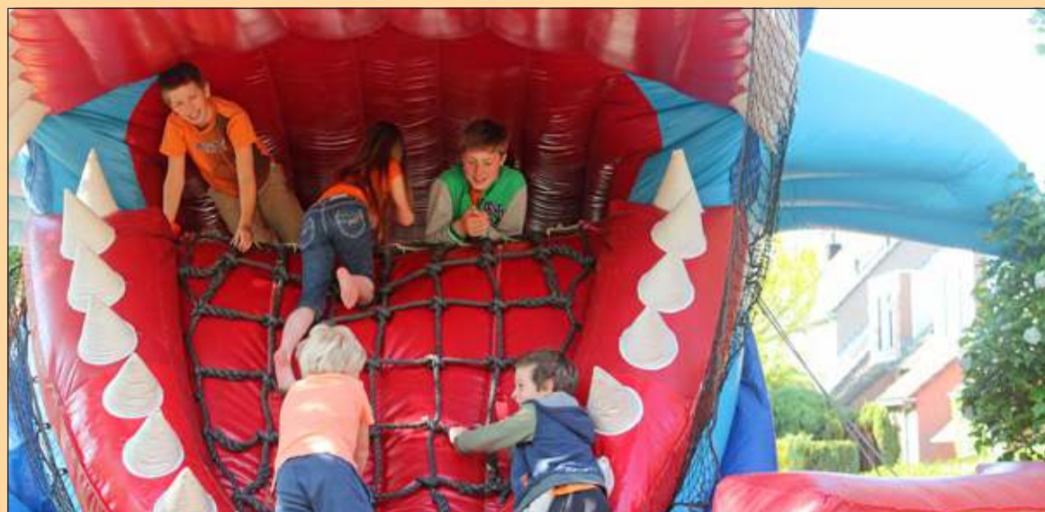
Hollandsche Rading - Een cryptische (ander) woord voor gebit is 'maalinrichting' en dat duidt dan weer op 'vermalen'. De kinderen, die van dit speeltuig gebruik maakten trokken zich er niets van aan en genoten 'uit één mond' (eenstemmig, unaniem)