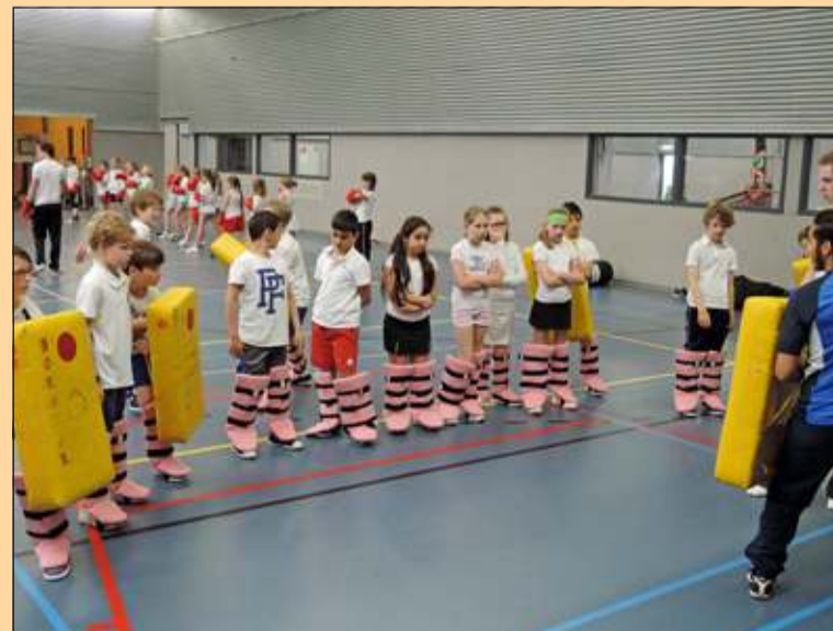
Tijdens de sportdag kwamen o.a. ook vechtsporten aan bod.