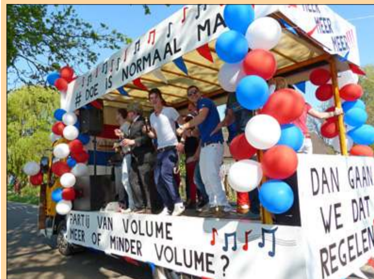
Westbroek - De PVV (Partij voor Volume) deed ook mee. [MN]