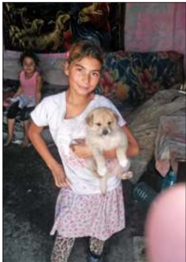
Gezinnen krijgen hulp op voorwaarde dat ze de kinderen naar school laten gaan.