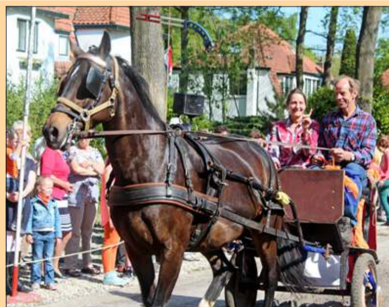
Groenekan - Op weg naar de prijsuitreiking. [HvdB]