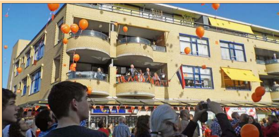
Maartensdijk - 's Morgens vroeg waren er gelijk al veel mensen op het Maertensplein in Maartensdijk. De handel op de vrijmarkt was al helemaal op gang gekomen. Burgemeester en wethouders heetten iedereen welkom, waarna leden van scoutinggroep Agger Martinie de vlag hesen en onder begeleiding van muziekvereniging Kunst en Genoegen luid door iedereen het Wilhelmus werd meegezongen. Daarna gingen alle ballonnen de lucht in. De start was prima. [MD]