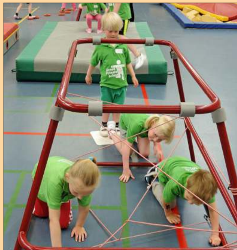
Voor de kleinsten was er een sportief traject uitgezet.