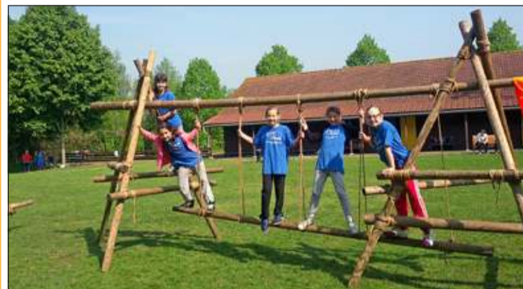
Vijf leerlingen van groep 6 van de MLK op de hindernisbaan.

Op vrijdag 25 april werden voor de tweede keer door allerlei basisscholen in Nederland de Koningsspelen gehouden. In Maartensdijk gingen de leerlingen van groep 5 t/m 8 van de Martin Luther Kingschool naar scouting AMG om daar verschillende spelletjes te spelen. Er werden behendigheidsspelletjes gespeeld, denkspelletjes en balspelletjes. Daarnaast deden de kinderen ook een aantal echte scoutingactiviteiten zoals klimmen over een zelfgebouwde hindernisbaan en vuur maken zonder lucifers.