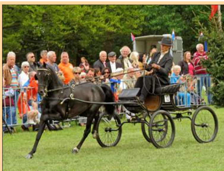
Bilthoven - Het Oranjeconcours aan de overkant van de weg leverde een prachtig schouwspel op. [GG]