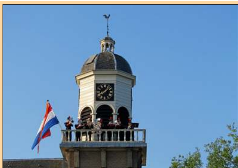
De Bilt - Na het luiden van de klokken speelde een koperensemble van de Koninklijke Biltse Harmonie op de trans van de Dorpskerk in De Bilt het Wilhelmus. Daarna werden oud-Hollandse liederen gespeeld. [GG]