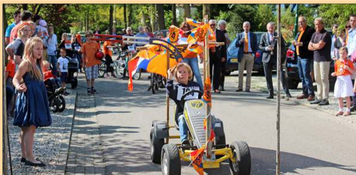
Groenekan - Het demissionaire College van De Bilt kijkt vol spanning toe bij deze skelterrecordpoging in Groenekan. [HvdB]