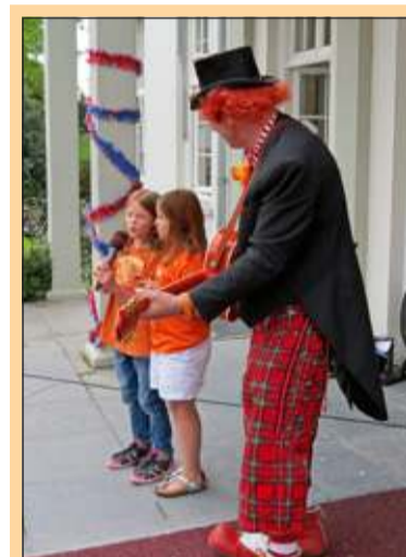
Bilthoven - Zingen met een echte clown op het bordes van gemeentehuis Jagtlust overkomt je niet elke dag. [GG]