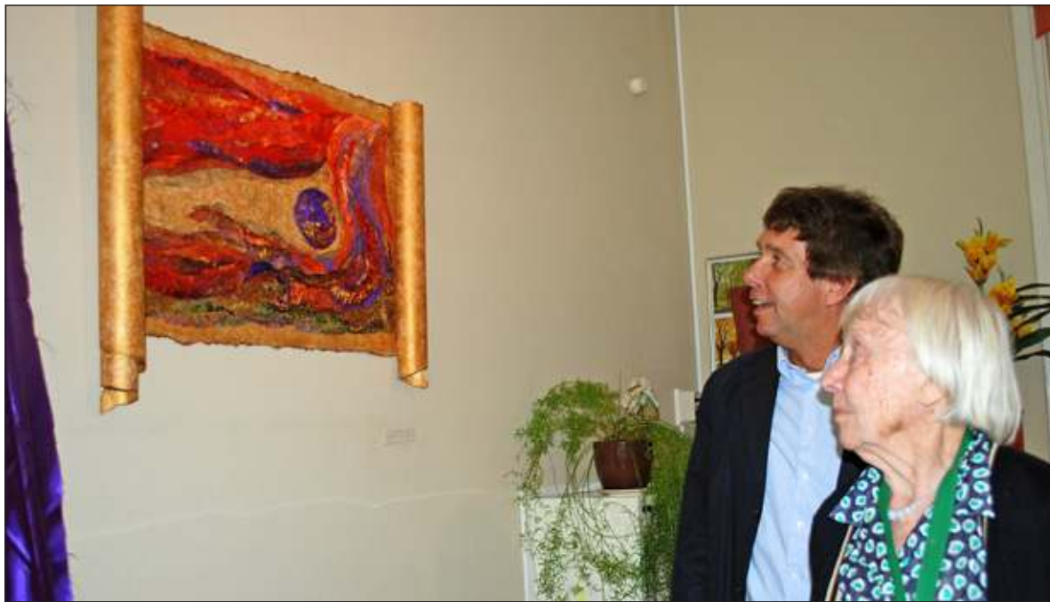
De kern van het kunstdoek: Een warme plek. De mens als kind in de moederschoot, gedragen en omarmd.

Moggré blijft optimistisch over de toekomst: 'De richting, die de landelijke overheid uit wil, staat haaks op onze visie en daarbij behorende richting. Ik weet vrijwel zeker dat de richting die wij kiezen ook de richting is, die al onze huidige maar ook toekomstige cliënten willen. Daarom hoop ik dat wij in de gelegenheid worden gesteld door de lokale overheden om ook in de toekomst onze vorm van zorg en begeleiding te mogen blijven verstreken aan mensen (en hun mantelzorgers) met dementie.