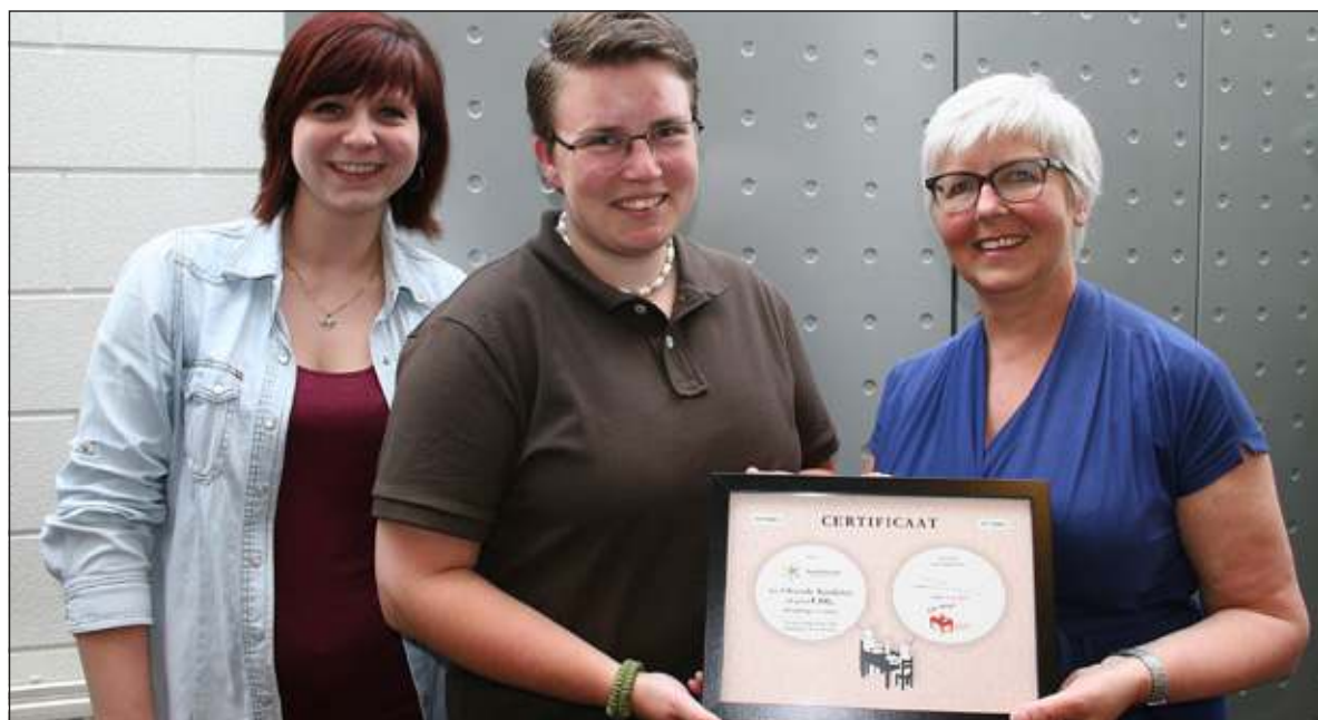
Parel Promotie ontvangt, als het ware, een sigaar uit eigen doos.

Bent u geïnteresseerd in Sociale Aandelen, neem dan contact op via www.eetmee.nl of telefonisch via 030-221 34 98. Stichting Eet Mee! informeert u graag verder over de mogelijkheden.