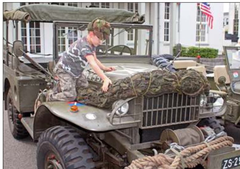
Opa had zijn kleinzoon opgedragen het voertuig te bewaken.

De Verordening leerlingenvervoer gemeente De Bilt 2014 wordt met algemene stemmen aangenomen. In verband met de invoering van de Wet passend onderwijs, heeft de VNG de modelverordening herzien en vervangen door een eenvoudiger nieuw model. In de nieuwe verordening wordt een groter beroep gedaan op zelfwerkzaamheid. Een amendement ingediend door Gija Schoor (PvdA) om voor bepaalde groepen de kosten van openbaar vervoer te vergoeden wordt verworpen. Een amendement ingediend door Johan Stekelenburg (SP) om meer ruimte te bieden aan de vrije schoolkeuze wordt eveneens verworpen. Vanetta Smit (D66) heeft moeite met het signatuurvervoer, vervoer van leerlingen van een bepaalde levensbeschouwing of richting. Zij vindt dat ouders die op grond daarvan kiezen voor een school buiten de regio zelf verantwoordelijk zijn voor het vervoer. Een motie van Johan Stekelenburg om uit te zoeken of vrijwilligers of