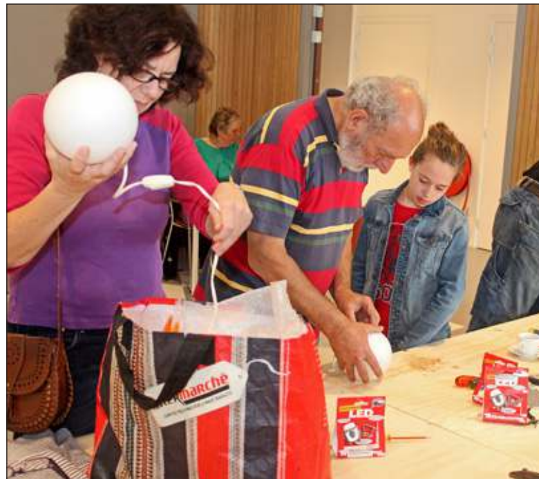
Van de meegebrachte spullen werden er 23 met succes gerepareerd.