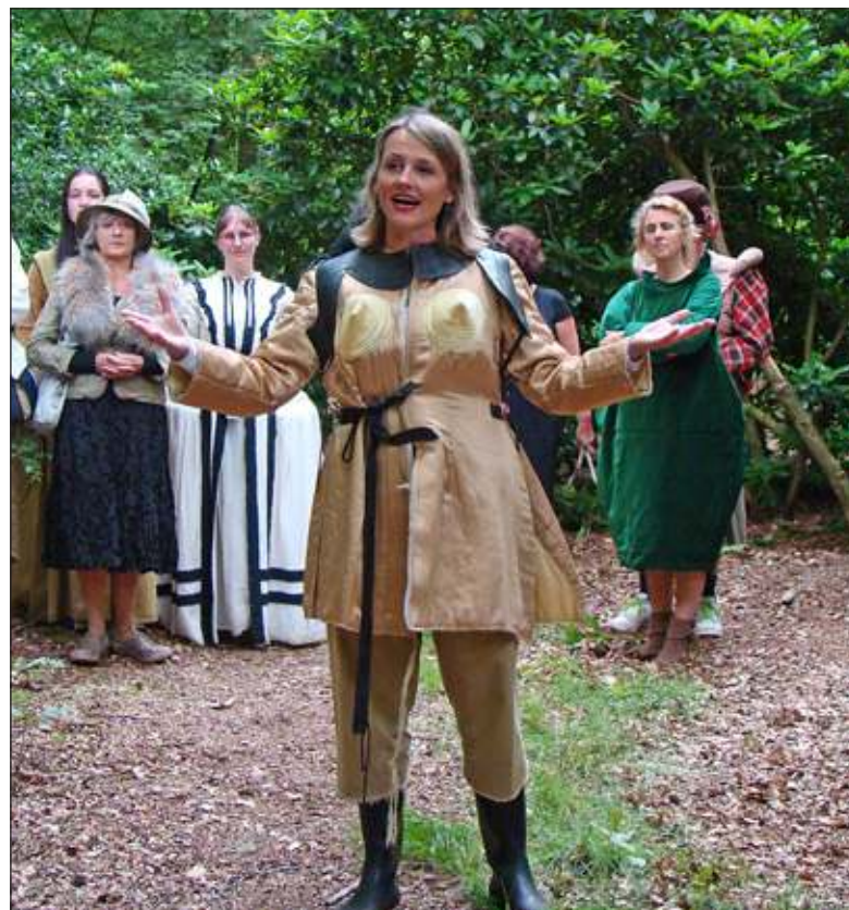
Op zaterdag 21 juni presenteerde een aantal spelers een verrassende en eigenzinnige compilatie van oude en nieuwe stukken van Theater in het Groen.