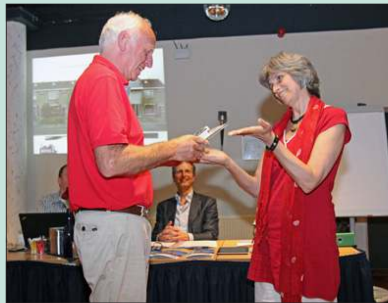
Tijdens de Algemene Ledenvergadering kregen alle leden een energiemeter overhandigd.

BENG! heeft inmiddels al tientallen leden en organiseerde op donderdag 26 juni in het H.F. Witte Centrum in De Bilt een goed bezochte Algemene Ledenvergadering, waar ook andere geïnteresseerden van harte welkom waren. [HvdB]