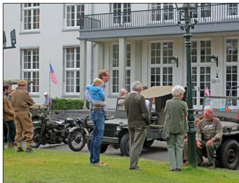
Belangstelling voor militair materieel is van alle tijden.

(en later vanuit Antwerpen) en de steeds oprukkende fronttroepen. De bijeenkomst werd afgesloten met een gezamenlijke maaltijd.