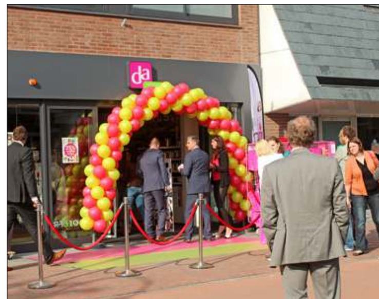
Donderdag 26 juni opende de nieuwe winkel van DA - Mooi aan de Julianalaan 16 in Biltoven. De totaal vernieuwde winkel combineert de voorheen los van elkaar opererende DA en Mooi Parfumerie in één pand. De opening ging gepaard met tal van activiteiten en acties. [HvdB]