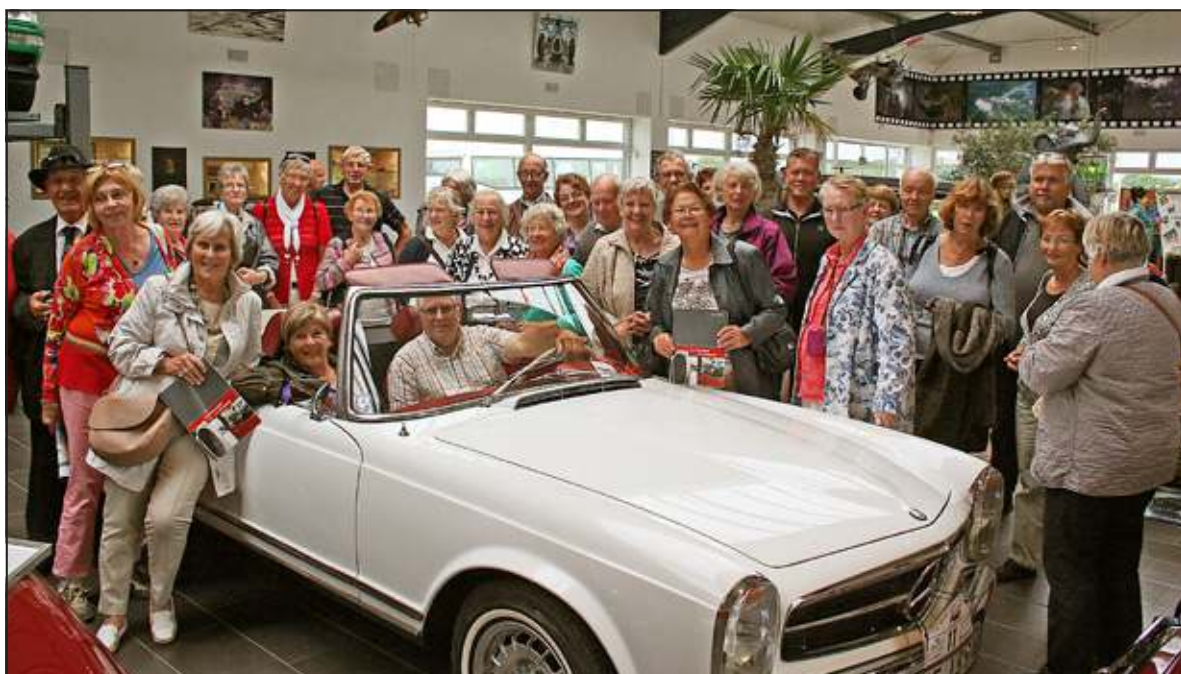
Er konden slechts twee deelnemers in de auto plaatsnemen.

Volgende activiteiten van de stichting Jumelage De Bilt-Coesfeld zijn een fietstocht in Coesfeld op zaterdag 26 juli en een tweedaagse fietstocht in De Bilt, op 13 en 14 september. Aanmelden voor deze activiteiten kan bij secretaris van de stedenband, Joke Nederhof, via e-mail nederhofj@gmail.com . Meer informatie over de stedenband staat op de website. www.jumelage-de-bilt-coesfeld.nl