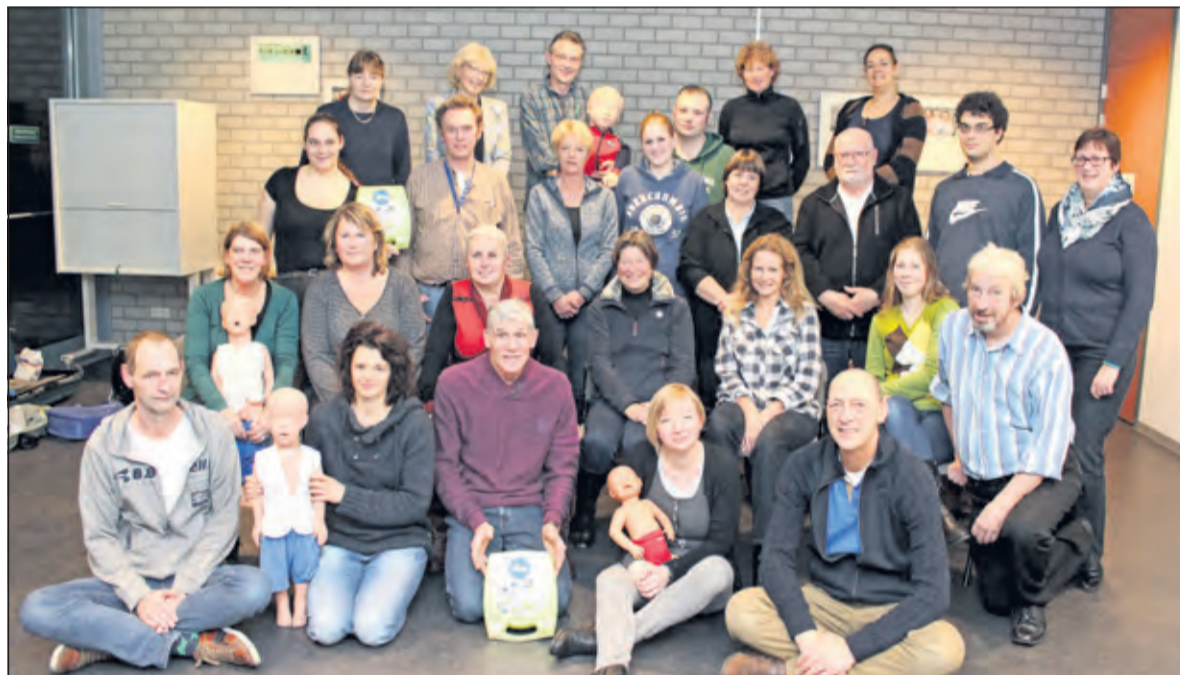
De gemeente heeft er weer een fors aantal mensen bij die eerste hulp kunnen verlenen.

Maandag 30 november deden leden van de EHBO vereniging De Bilt-Bilthoven in de Kees Boeke-sporthal in Bilthoven examen 'Eerste hulp aan kinderen'.