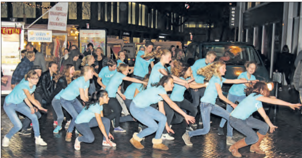
Op het Vredenburg in Utrecht voeren leerlingen van de Werkplaats een flashmob uit ten bate van het Helen Dowling Instituut Bilthoven (HDI).