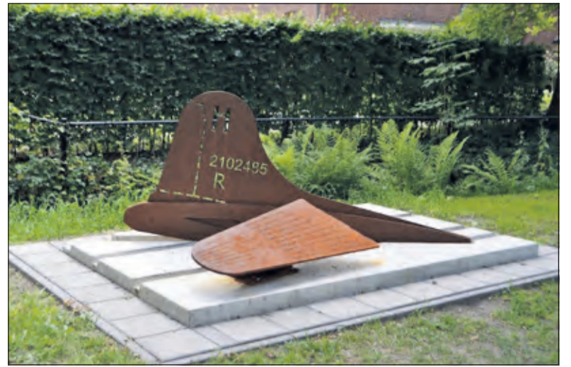
Het B17 monument in Groenekan was aanleiding voor het schrijven van een boek over de stille helden van Groenekan.