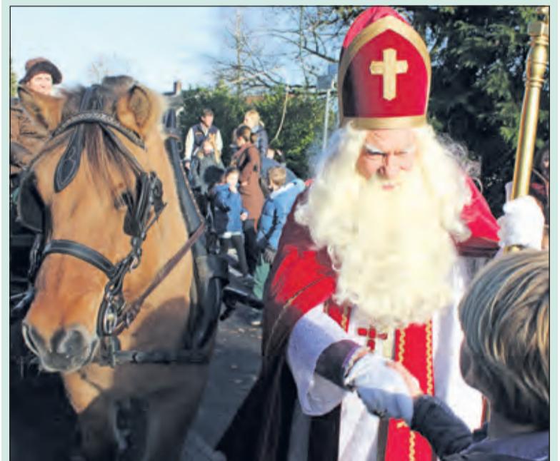
Sint heeft aandacht voor kinderen; zijn paard kijkt aandachtig toe.