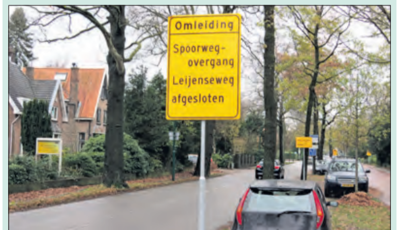
De omleidingsroute naar De Leijen zorgde voor een langdurige discussie.