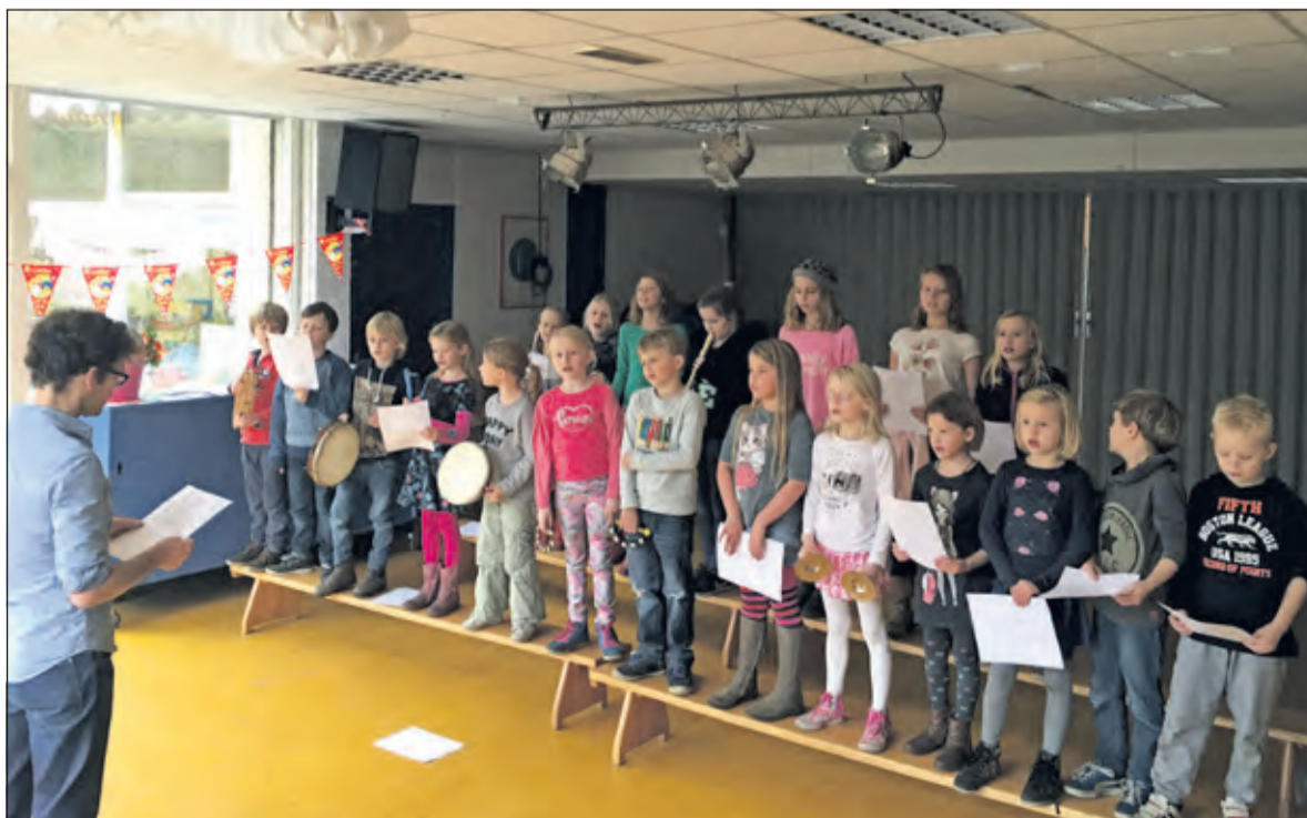
Leerlingen van Basisschool De Nijpoort oefenen voor de volkskerstzang 2016.

Opvang is een toenemende noodzaak gezien o.a. de vele uitgeprocedeerde vluchtelingen in Nederland. De zangavond begint om 19.30 uur.