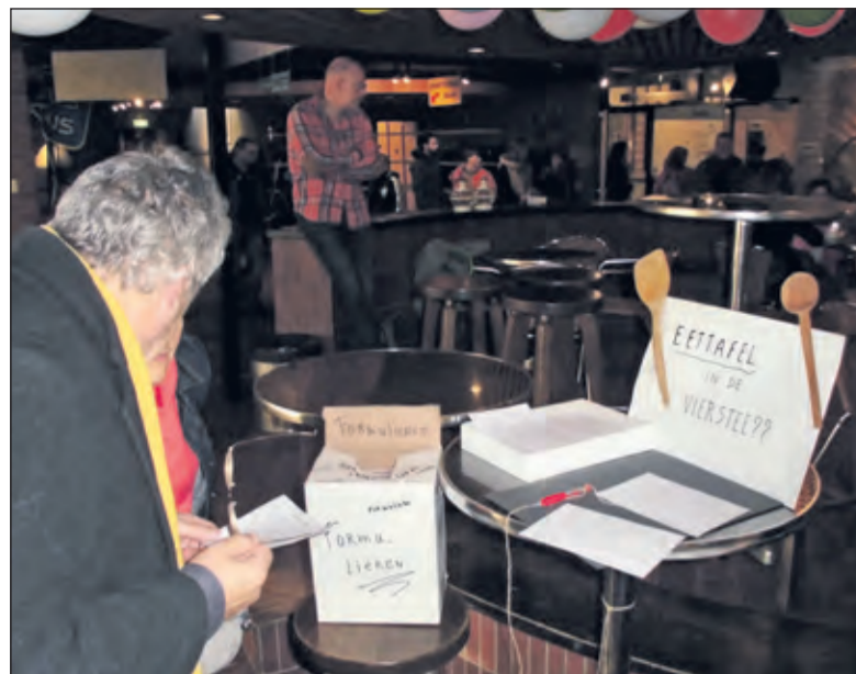
Comité eettafel Vierstee peilt de belangstelling voor gezamenlijk eten.