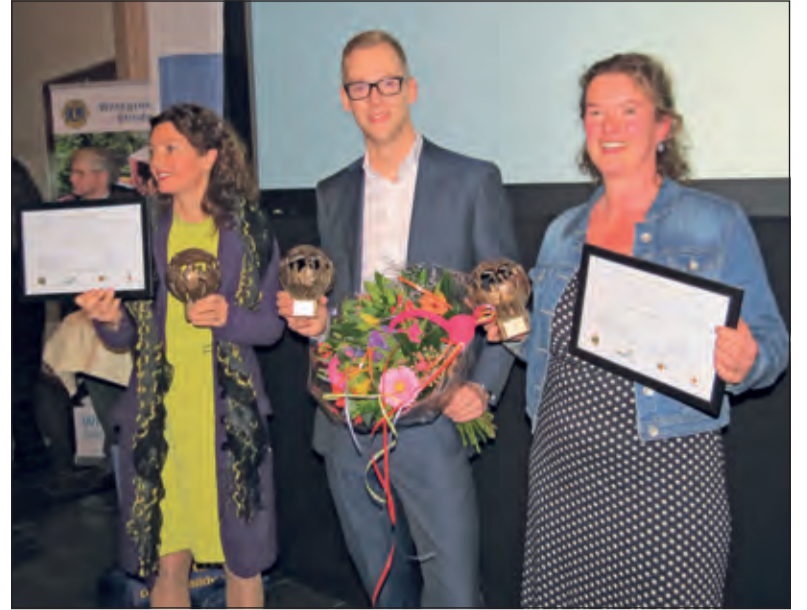
En de winnaars zijn.... Greenlink Nederland, Gilde Personeel en Landwinkel De Hooierij.