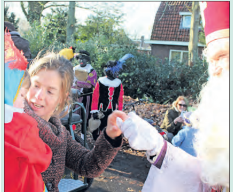
Sint stelt ook de kleintjes op hun gemak.

Sint Nicolaas kwam zaterdag 28 november ook naar Groenekan. Vooraf hadden de kinderen op vrijdag hun schoen gezet in Dorpshuis De Groene Daan, waar ook grote taaioppen klaar lagen om te versieren. De optocht startte op de Oranjelaan in Groenekan en na een heerlijke wandeling werd er opnieuw feest gevierd in de Groene Daan.