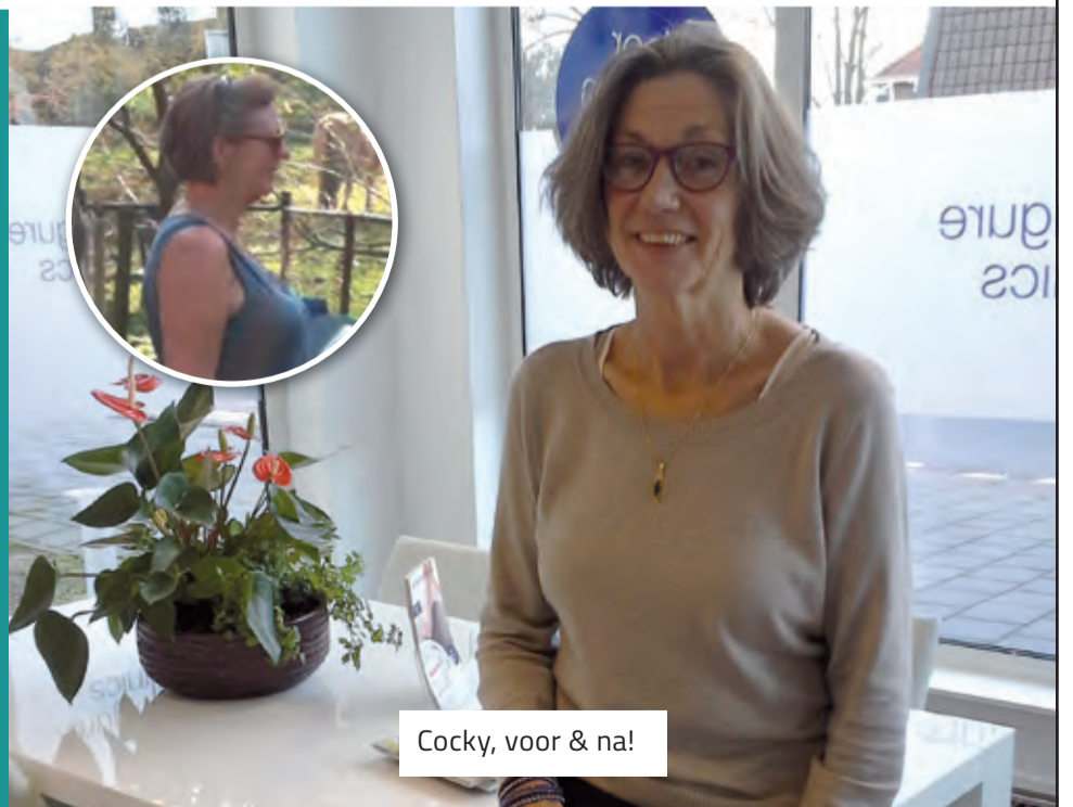
Cockie, voor & na!

* Geldig t/m 31/12/2015 en niet i.c.m. andere acties.