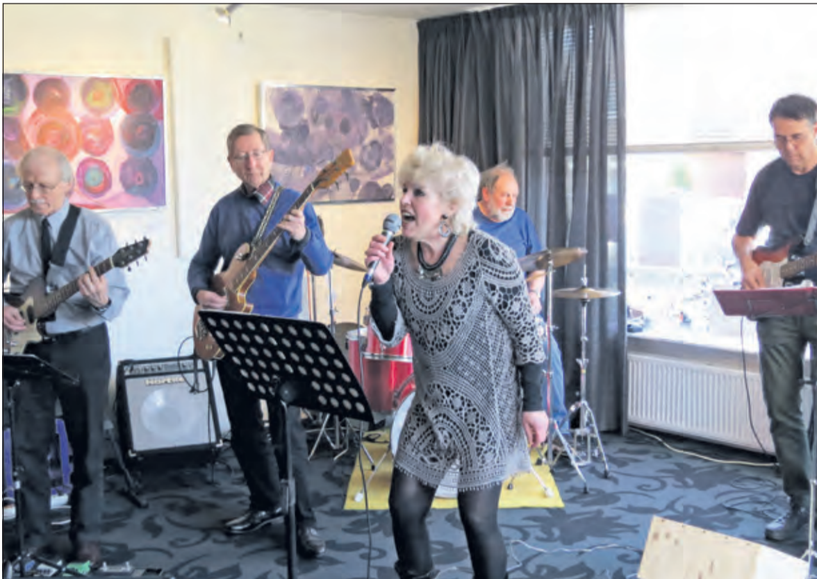
Een optreden tijdens de laatste Gluren bij de Buren in maart dit jaar.

Op 19 en 20 maart 2016 vindt de achtste editie van Gluren bij de Buren plaats. Het is een initiatief van de Stichting Kunst en Cultuur De Bilt. Tijdens dit evenement stellen particulieren hun huiskamer belangeloos beschikbaar voor een optreden door een artiest. De organisatie is op zoek naar nieuwe particuliere woningbezitters die amateurkunstenaars in hun huiskamer een podium willen geven.