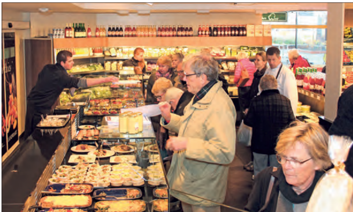
Bij Landwaart aan het Maertensplein te Maartensdijk kon afgelopen zaterdag al volop geproefd worden van het Kerst 2015-keuze diner. Alle kerstgerechten werden smakelijk gepresenteerd en iedereen kon het lekkers bekijken en proeven.