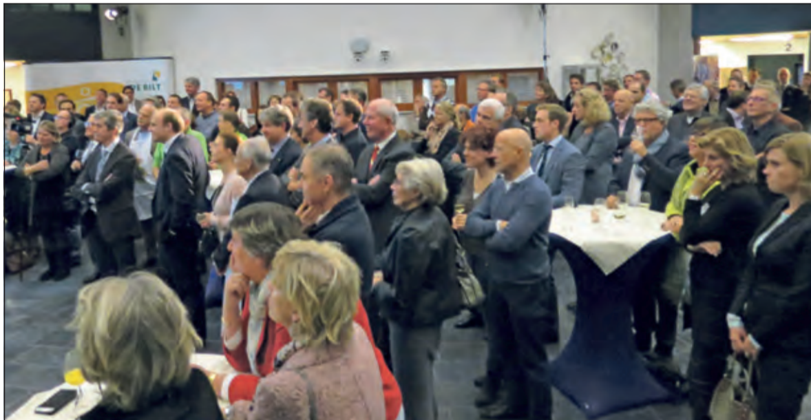
Het was een drukbezochte bijeenkomst.