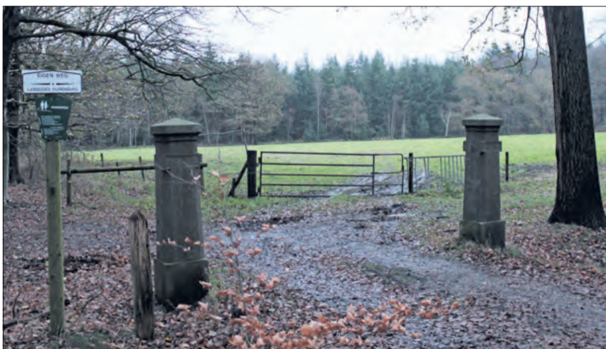
De toekomstige locatie op de hoek Embranchementsweg en Vuursche Steeg.