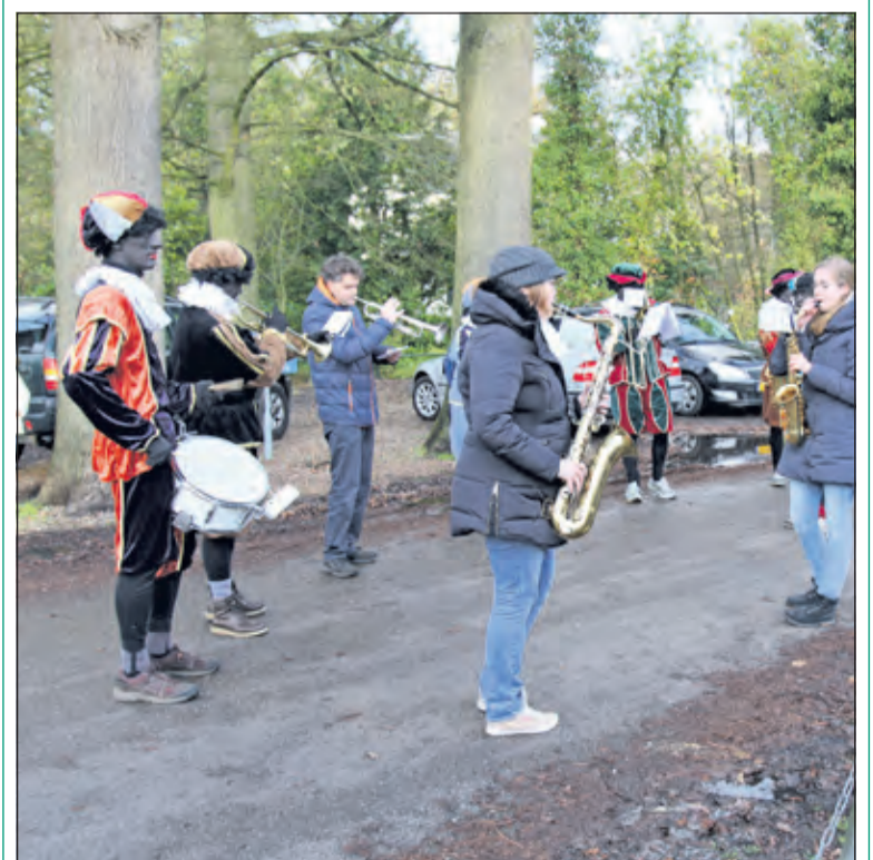
Het Pieten-orkest begeleidt de optocht op weg naar Sint Elisabeth.

Zaterdag 28 november kwamen Sinterklaas en zijn Pieten naar Lage Vuursche. Het feest begon met een bijeenkomst in het dorps huis 'De Furs'. Daarna ging het in optocht naar o.a. verpleeghuis St. Elisabeth aan de Koudelaan. Na terugkomst was er (opnieuw in De Furs) een bezoek van de Goedheiligman zelf.