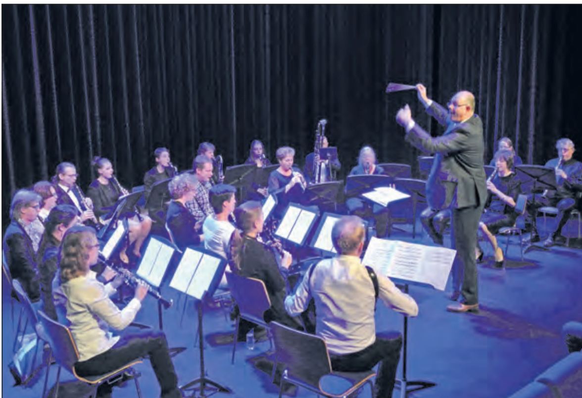
Het Klarinetensemble, aangevuld met een accordeonspeler.

Zaterdagavond speelden het Klarinetorkest en het Accordeonensemble van de KBH voor het eerst in de theaterzaal van het Lichtruim.