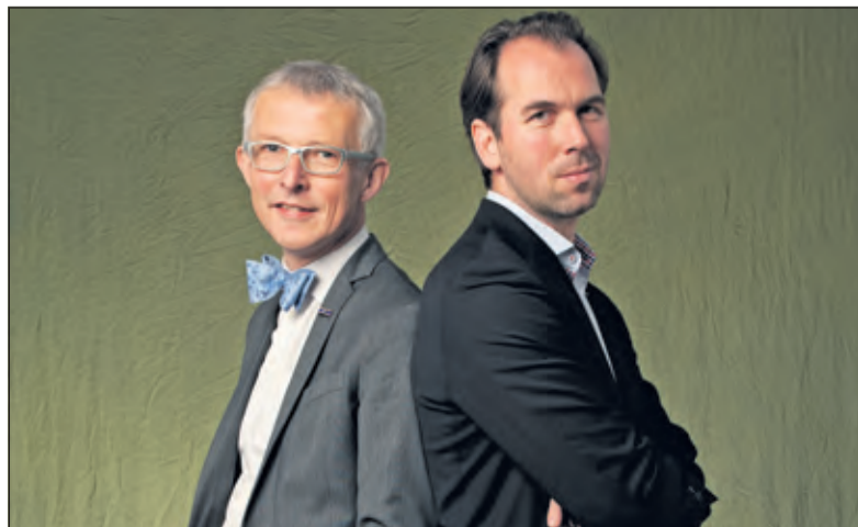
Westendorp en Bodegom stellen dat onze leefstijl gedictieerd wordt door de omgeving.

Over dit onderwerp is op 8 december om 20.00 uur een lezing in de Bilthovense Boekhandel. Aanmelden (zeer gewenst) kan bij de Bilthovense Boekhandel, Julianalaan 1 in Bilthoven (tel. 030 2281014) ook evt. e-mail info@bilthovenseboekhandel.nl