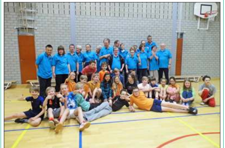
Sporters en leerlingen troffen elkaar vol enthousiasme in de gymzaal.

Afgelopen week werd de Open Les van Sportstichting Samen Verder gehouden in de sportzaal van de Julianaschool in Bilthoven. Omdat de school hard op weg is om een Fairtrade school te worden legden de leerlingen vooraf uit aan de sporters waar ze mee bezig zijn. Via het doorlopen van een stappenplan kan het certificaat Fairtrade worden verkregen. Truus te Pas van de Werkgroep Fairtrade begeleidt de school hierin. Daarna werd er intensief gesport: de leerlingen van klas 7a en de sporters trokken samen op. Bij mooie prestaties werd hard geapplaudiseerd. In de pauze verzorgden de leerlingen de catering. Ouders van leerlingen en sporters waren ook aanwezig. Eén van de ouders van de leerlingen: 'Een prachtig initiatief om zo met elkaar kennis te maken. Goed om te zien hoe enthousiast de sporters en begeleiders zijn'. [MD]