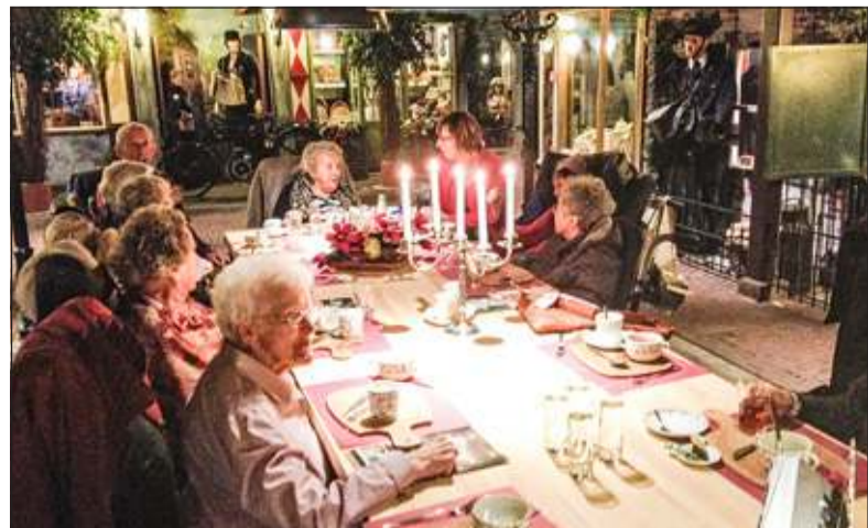
Het gezelschap werd vriendelijk ontvangen met koffie en gebak aan een prachtige gedekte tafel met kandelaars.

Met enkele bewoners van Woon- en zorgcentrum De Bremhorst werd het kaas- en botermuseum De Weistaar in Maarsbergen bezocht. De bezoekers waanden zich in vroegere tijden.