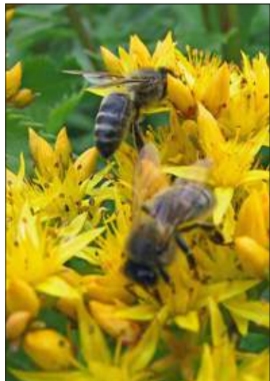
In de gemeente de Bilt wordt gewerkt aan een Bijenbloemenlint door de verschillende kernen.

Je zou het zo op het eerste gehoor niet zeggen, maar de bestuivers zijn nog steeds in nood. Al duizenden jaren leven en werken mensen met bijen, in het besef dat er zonder bijen veel minder voedselproductie zou zijn. Dat wisten ze al in de oudheid, maar het lijkt wel alsof dat besef in onze tijd verloren is gegaan, want inmiddels gaat de bijenpopulatie in de wereld door een veelheid aan oorzaken drastisch achteruit. Agrarische gebieden zijn voor bijen en insecten als groene woestijnen, zij kunnen er niet voldoende bloemen vinden. De stedelijke gebieden daarentegen zijn voor bijen inmiddels zelfs oases geworden met bloeiende bomen en bloementuinen. De omgekeerde wereld.