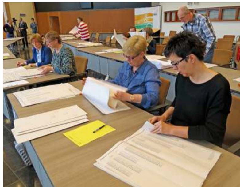
Op 26 maart werden de stembureaus De Groene Daan en Jagtlust herteld. Dit leidde niet tot verandering.