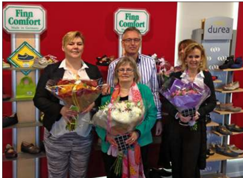
Bloemen voor het team dat ervoor zorgde dat de George In der Maur Beterlopenwinkel wederom tot Beste schoenenwinkel van 2013 uitgeroepen werd.

Elk jaar worden er awards uitgereikt aan de bedrijven die als beste werden beoordeeld. De George In der Maur Beterlopenwinkel is voor de vierde keer maal uitgeroepen tot 'Beste schoenenwinkel'. Van de 128 winkels die in de prijzen vielen, scoorde zij hoog op de factoren 'eerste indruk', 'service' en 'prijs-kwaliteit'. Net als bij de voorgaande edities van de awards, nodigt de George In der Maur Beterlopenwinkel iedereen uit om de overwinning te vieren met een lekkere Goudse stroopwafel bij een kopje koffie. Het personeel hoopt dat het niet alleen blijft bij een babbelletje, maar daagt u ook uit om eens aan de lijve te ondervinden waarom zij de titel 'Beste schoenenwinkel' ook in 2013 waard was.