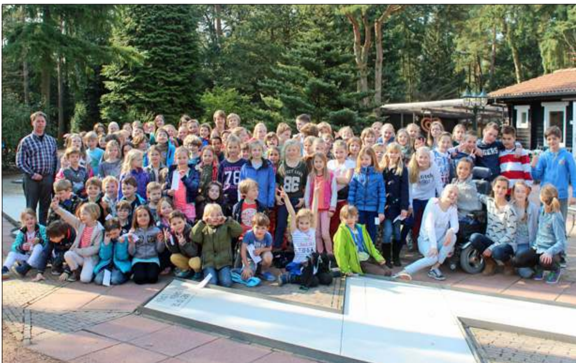
Voor de afslag van het jubileumseizoen waren alle leerlingen van de groepen 4A t/m 8B van de Theresiaschool uit Bilthoven vrijdag 28 maart uitgenodigd te komen midgetgolven. Op de foto de groepen 4B, 6A en 8A + 8B van de 280 basisschoolleerlingen, die in groepsverband de balletjes over het parcours van 18 holes met zo min mogelijk slagen aflegden.

teachtige weersomstandigheden al enige tijd geopend en zelfs tijdens de zachte wintermaanden waren er al op beperkte schaal speelmogelijkheden geweest.