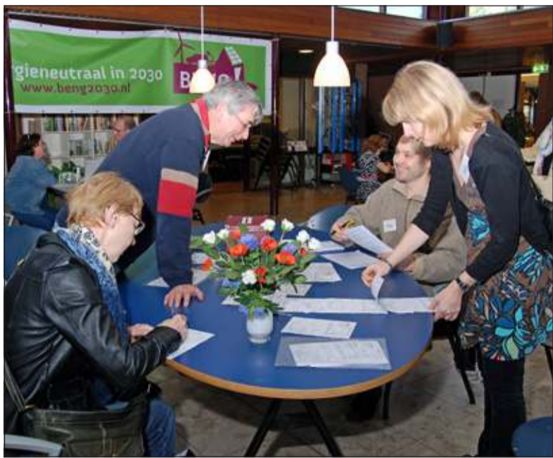
Gezelligheid bij de ontvangsttafel van het Repair Café Bilthoven; op de achtergrond geeft energie-coöperatie BENG! advies over energiebesparing.