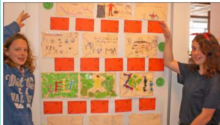
De creatieve zuil van zelfstandigheid.