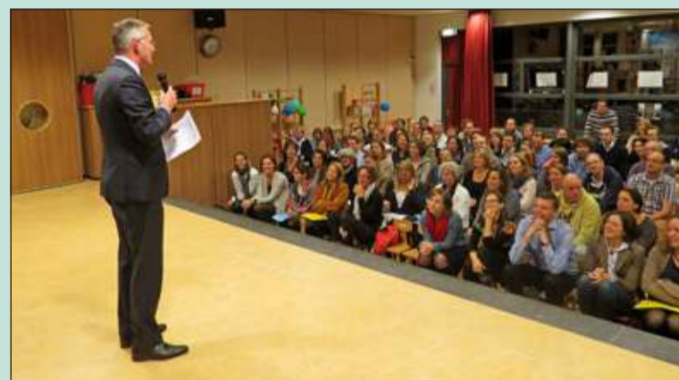
Ruim 120 ouders namen aan de thema-avond in de Juliaschool deel.