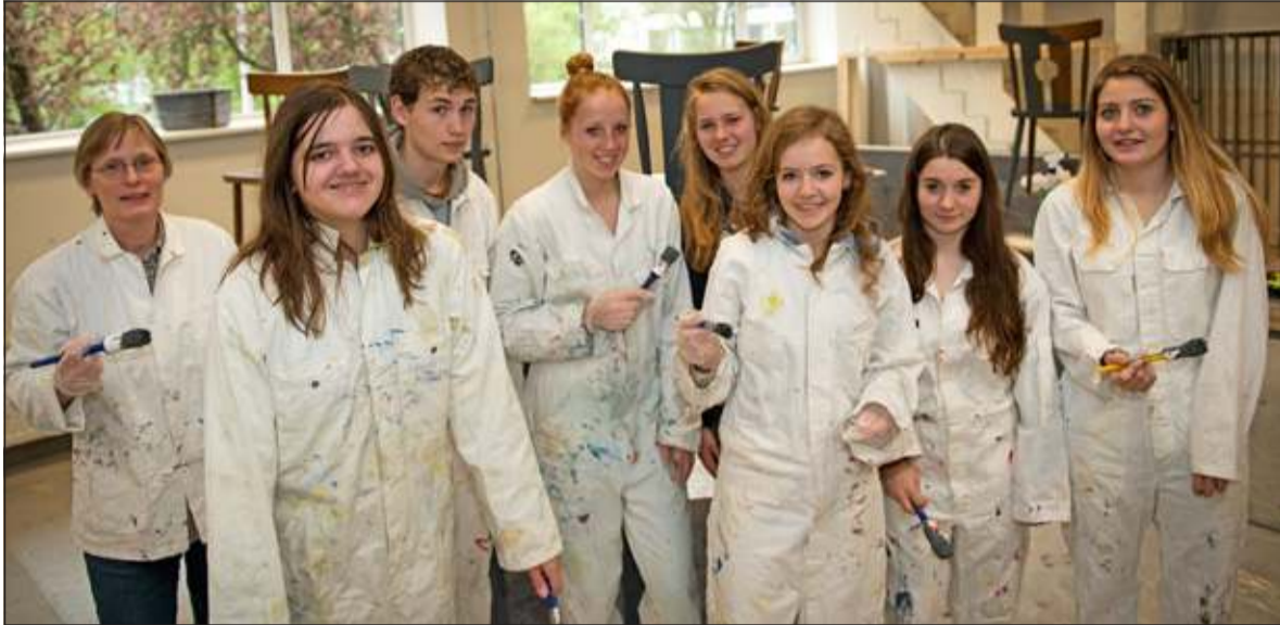
Leerlingen uit de 3e klas hanteerden de kwast voor het verven van decorstukken bij toneelgroep Starlight Boulevard.

De leerlingen uit de eerste klas van de Werkplaats Kindergemeenschap in Bilthoven zijn, na een periode waarin ze veel geleerd hebben over ontwikkelingslanden, deze week aan de slag gegaan met een project over Microkrediet.