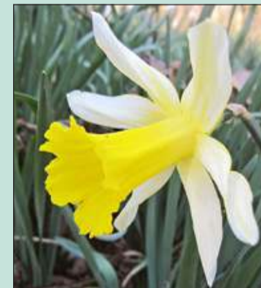
De vrolijke gele kopjes van de narcis zijn onlosmakelijk met de lente verbonden.

Deze vorm van wandelen is geschikt voor een groep van maximaal 12 volwassenen. Aanmelden kan via natuurbeleving@ivndebilt.nl . Honden kunnen helaas niet mee. Per seizoen zal één wandeling met dit thema gemaakt worden. Locatie: Landgoed Beukenburg (terrein van Het Utrechts Landschap). De start is op de Beukenburgerlaan bij de ingang vanaf de Groenekanweg in Groenekan op zondag 6 april om 13.00 uur. De organisatie is door IVN De Bilt e.o. en er zijn geen kosten aan verbonden.