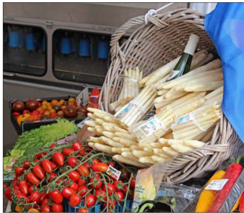
Donderdag 3 april kan bij Landwaart van 14.00 - 18.00 uur van het Limburgs goud geproefd worden.