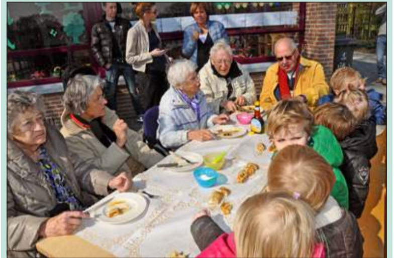
Heerlijk buiten in het zonnetje, met z'n allen lunchen aan lange tafels.

De leerlingen van De Bosbergschool in Hollandsche Rading, de peuters van het Kabouterbos en deelnemers van Onvergetelijk Leven namen het er vrijdag jl. even van tijdens de Nationale Pannenkoekendag. De vers gebakken pannenkoeken vonden dan ook gretig aftrek. Na afloop gingen de senioren dorpsbewoners nog even de klas in om in het kader van het nieuwe IPC thema: Het Generatiespel – Jong en Oud, te vertellen over hun jeugd en basisschoolervaringen. (Hilda Ritman)