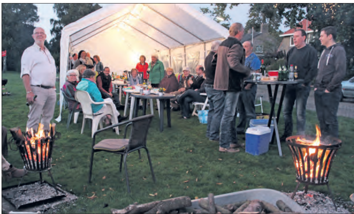
In het plantsoen bij het ronde rondje aan de Tolakkerweg in Hollandsche Rading vonden omwonenden zich voor het eerst in 58 jaar rond de straatbarbecue.]

Het beeld 'Meisje met Veulen' van Charles Weddepohl aan de Tolakkerweg in Hollandsche Rading staat er al vanaf 1954. Mevrouw Mieke Peek kwam drie jaar la-