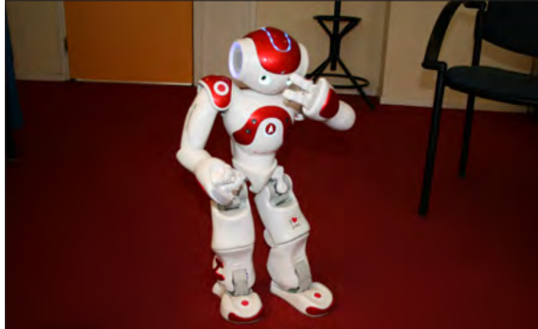
Zora is de nieuwe elektronische collega in De Bilthuysen.

Tien organisaties in de provincie Utrecht hebben nu een robot aangeschaft. Allemaal met hetzelfde doel: waar en hoe kunnen wij Zora inzetten? Jacobs: ‘Wij willen bijvoorbeeld heel graag een antwoord op de vraag wat Zora voor onze cliënten kan betekenen. Vooral ‘dwaalgedrag’ komt heel veel voor bij dementerende ouderen en daarom willen wij volgend jaar een onderzoeksproject starten. Bij dwaalgedrag ontstaat niet alleen overdag, maar ook ‘s nachts onrust