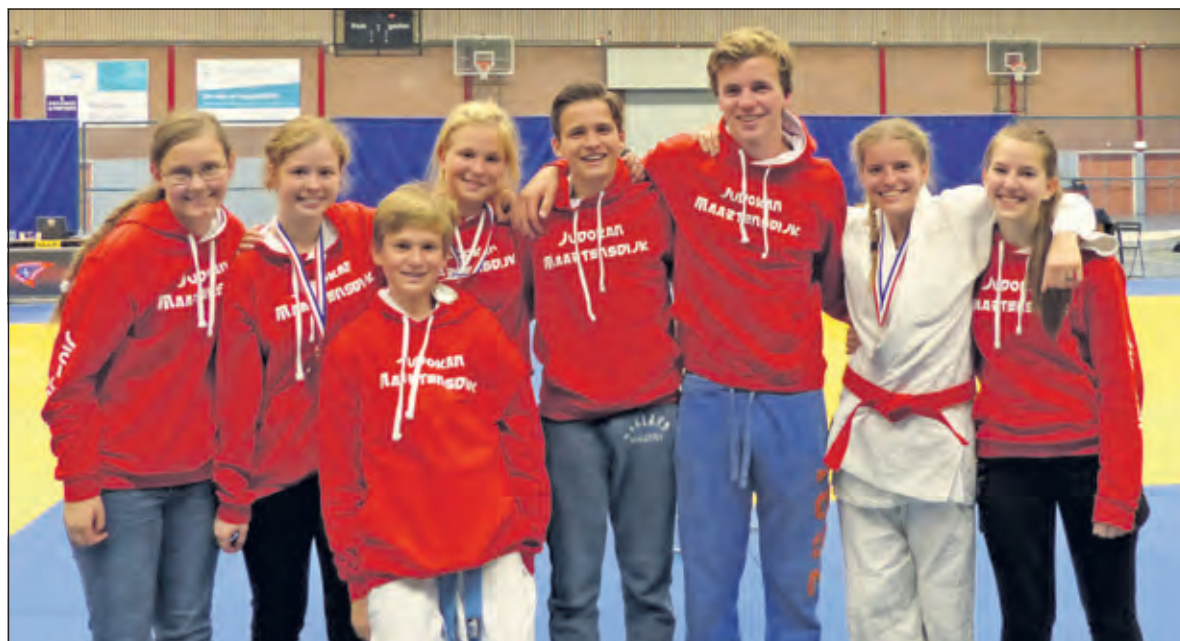
Drie zilveren medailles voor Judokan.