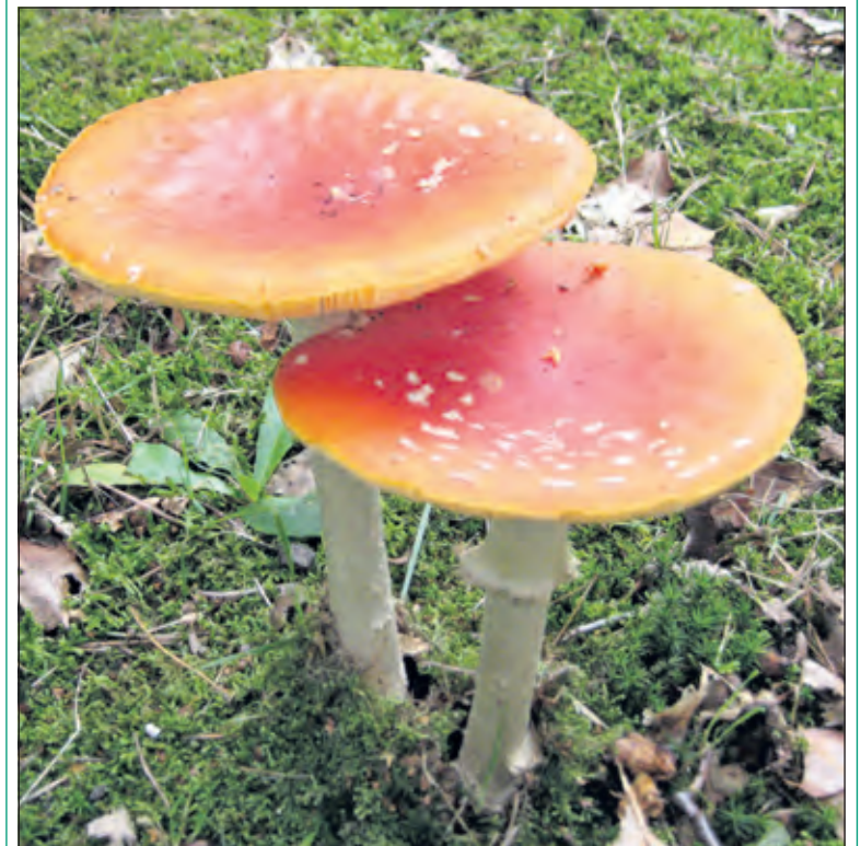
7 oktober - paddenstoelen zoeken en natekenen.

Utrechts landschap organiseert in samenwerking met het IVN De Bilt een leuke en leerzame middag voor kinderen van 6 t/m 10 jaar, bij paviljoen Beerschoten, de Holle Bilt 6 in De Bilt op 7 oktober. Met de kinderen wordt gezocht naar paddenstoelen en daarna gekeken of je erachter kan komen hoe de paddenstoel heet. Ze krijgen een eigen paddenstoelenboekje, waar ze de paddenstoelen in kunnen tekenen en alles wat ze hebben ontdekt kunnen opschrijven. Aanmelden kan via reesalthues@casema.nl .