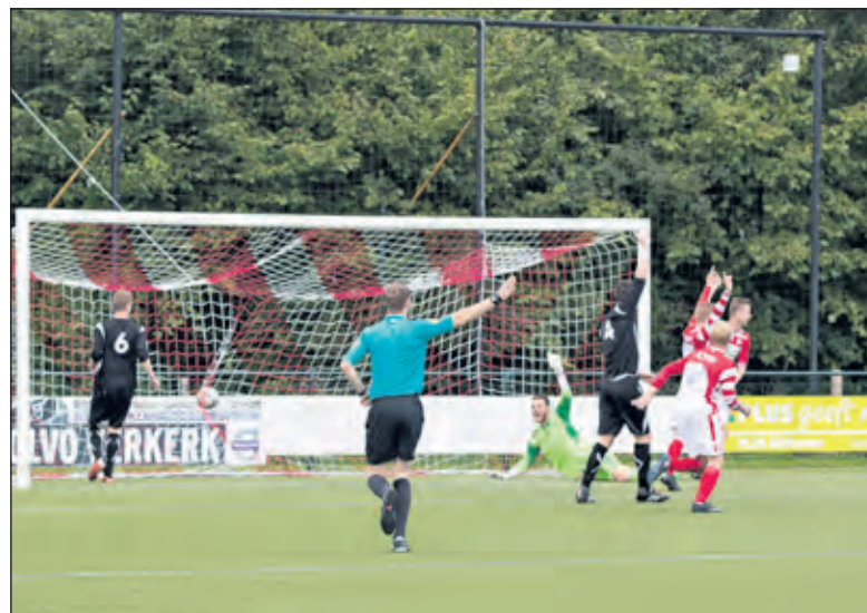
De Bilt scoort.

Om het plekje bij de bovenste ploegen te behouden is een overwinning volgende week bij Nieuwland van belang. De wedstrijd begint om 14.30 uur op sportpark Nieuwland in Amersfoort.