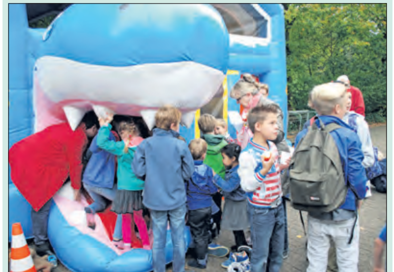
Donderdag 24 september werd de opening van BSO De Nijepoort gevierd.

Kinderopvang De Bilt heeft 24 september haar deuren geopend met een BSO ruimte in basisschool 't Nijepoortje. Het feest was voor alle kin- deren van BSO De Nijepoort en natuurlijk alle kinderen van de school. Er was een springkussen in de vorm van een haai. Stichting Mens orga- niseerde voor de kinderen een uitdagende bootcamp/survival en er was ook ander sport- en spel materiaal.