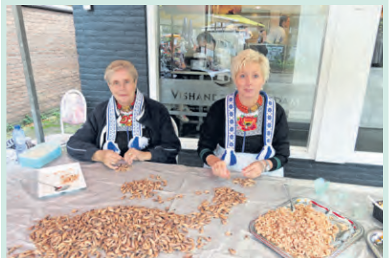
Oerhollandse inbreng op het Wereldfeest.