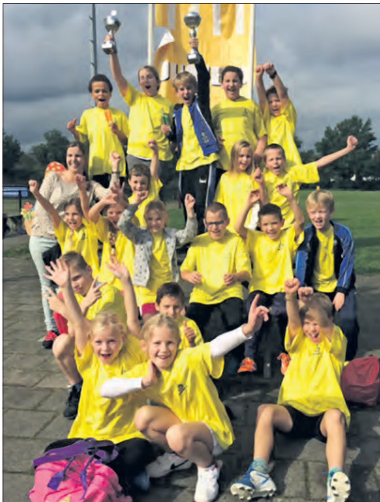
De Westbroekse winnaars uit groep 5 en 6.

Het schoolkorfbaltoernooi is een jaarlijks terugkerend evene- ment dat al vanaf 1968 wordt georgani- seerd. Beide winnaars mogen eind mei 2016 meedoen aan het Pro- vinciaal Schoolkorfbaltoernooi. Het is nog niet bekend waar dat gehouden wordt. Alle uitslagen, standen en foto's van de winnaars zijn na te kijken op de site van de club: www.tweemaalzes.nl