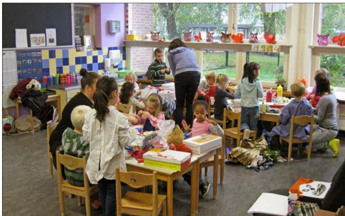
Leerlingen van De Rietakker bezig met het versieren van hun Schoenmaatjes-dozen.