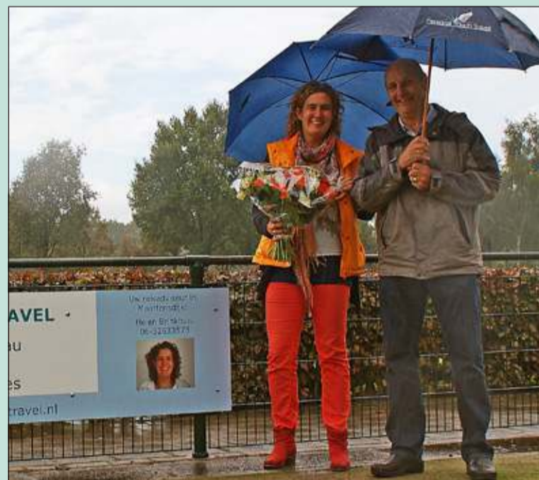
Tweemaal Zes presenteerde Personal Touch Travel als nieuwe sponsor. De reisorganisatie verbindt zich voor drie jaar aan de Maartensdijkse korfbalvereniging.