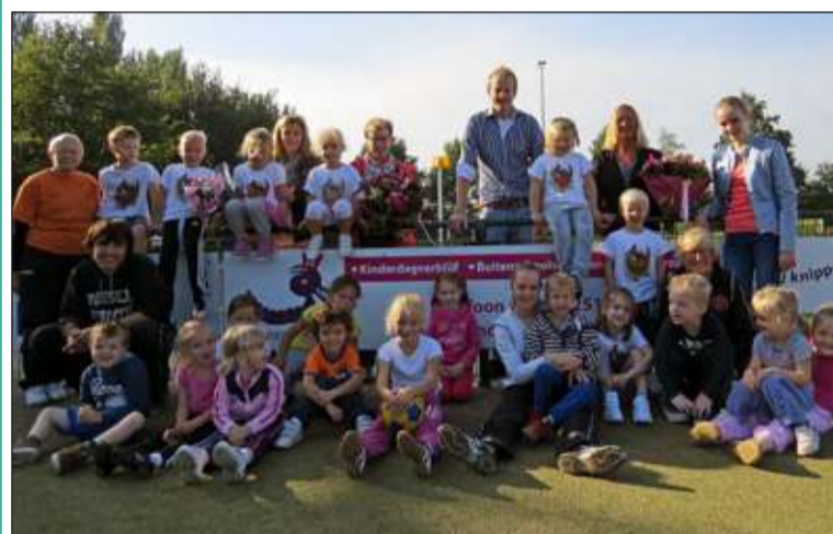
Kinderopvang De Bilt is sinds kort als sponsor aan Tweemaal Zes verbonden. De jongste TZ-leden mochten het sponsorbord onthullen.