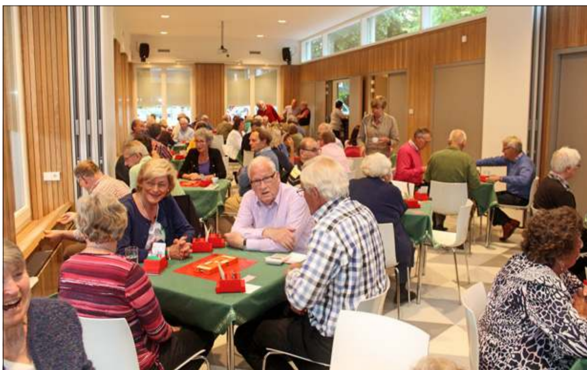
De akoestiek is niet optimaal, waardoor het met veel mensen in de zaal snel onrustig wordt.

De eerder geconstateerde akoestische problemen in het Dorpshuis in Hollandsche Rading zullen vooralsnog blijven bestaan. De gemeente De Bilt heeft om financiële redenen ervan afgezien nog dit jaar deze aan te pakken. Beheerscommissie en gebruikers zijn uiterst teleurgesteld over deze gang van zaken. De problemen zouden begin oktober zijn verholpen, maar de gemeente heeft daartoe nog niet besloten.