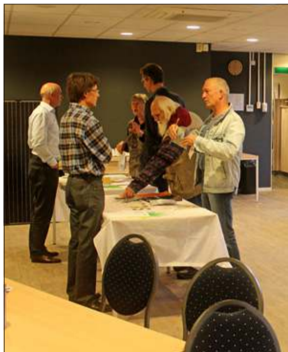
Experts van Beng! en Susteen adviseerden deze keer de inwoners van kern De Bilt.

In november 2014 zal een groot deel van Bilthoven een uitnodiging krijgen en in januari 2015 volgt de rest van de gemeente. In totaal krijgen 7000 woningeigenaren een brief. Het gaat om woningen die eigendom zijn van de bewoner, vóór 1976 gebouwd en geen appartement zijn.