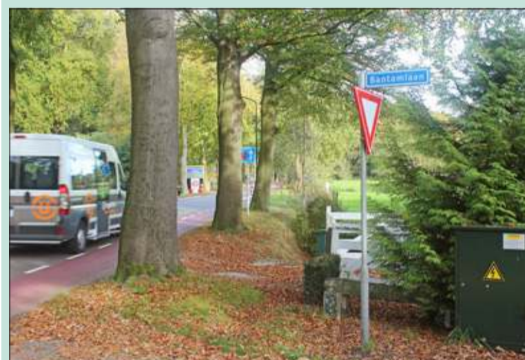
Onderzoek moet uitwijzen of een vrij-liggend fietspad langs de Dorpsweg in Maartensdijk tussen de Bantamlaan en de Gezichtslaan te realiseren is.

Er komt een studie naar de haalbaarheid van een vrij-liggend fietspad langs de Dorpsweg in Maartensdijk. Het onderzoek moet de omgeving, ecologie en de ruimtelijke inpassingsmogelijkheden tussen de Bantamlaan en de Gezichtslaan in beeld brengen. Ook worden de mogelijkheden verkend voor een fietsverbinding langs de Dorpsweg en Maartensdijkseweg richting Soest. Het Biltse college geeft met het onderzoek gehoor aan de wens van de gemeenteraad bij de bespreking van het gemeentelijk verkeer- en vervoerplan in april.