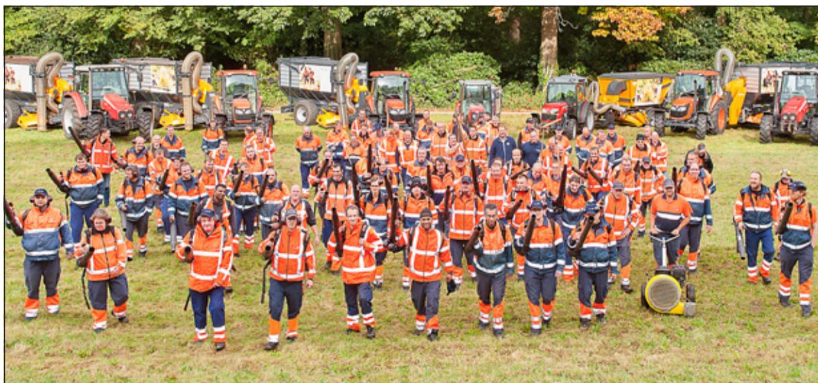
Het hele team inclusief de bladwagens

Biga Groep is de organisatie in Midden Nederland die voor vijf gemeenten de Wet sociale werkvoorziening uitvoert. Doelstelling van deze wet is het begeleiden van medewerkers met een afstand tot de arbeidsmarkt naar zo regulier mogelijk werk.