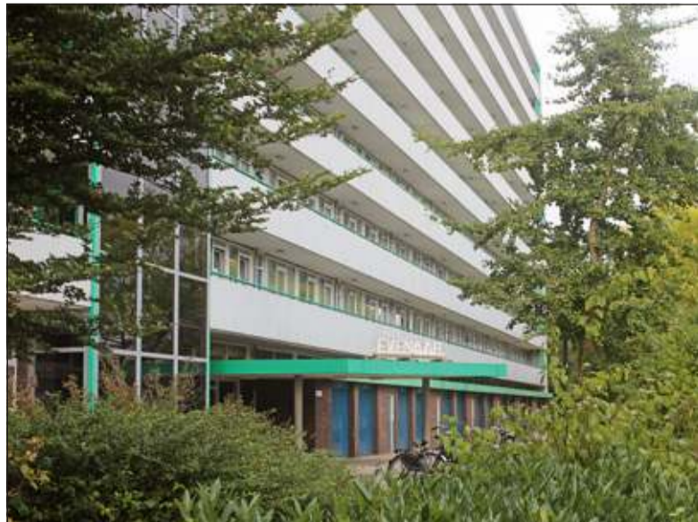
Uit een flat van flatgebouw de Evenaar is woensdag 1 oktober asbest verwijderd.