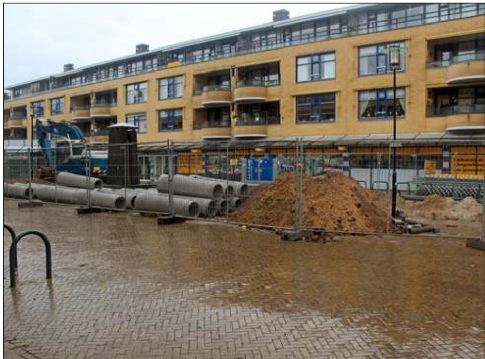
Van week 41 tot en met week 47 is dit het beeld van het Maertensplein