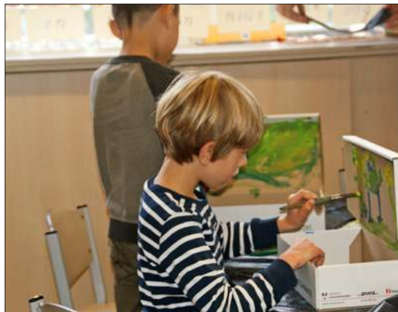
Inspiratie in opperste concentratie.

'Met deze ochtend doen we niet alleen aan de creatieve ontwikkeling van de leerlingen. Ze moeten ook