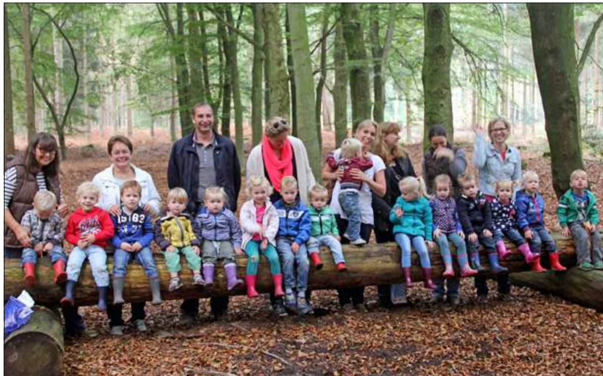
Met 15 peuters in het bos maken de leidsters dankbaar gebruik van hulpouders.