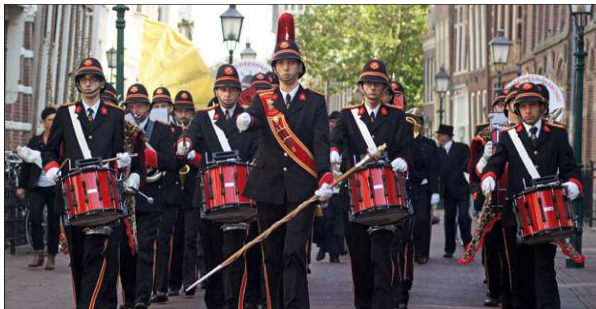
De Vrijwillige Brandweerharmonie trad zaterdag 4 oktober op bij de Hulpverlenersoptocht in Hoorn.

De Brandweerharmonie gaat nu zijn winterseizoen in met de Sinterklaas- en de Kerstoptredens en in het voorjaar een concert. Maar kijkt al uit naar volgend jaar want dan is de 5 jaarlijkse Taptoe in de eigen gemeente. (Hanny Otten)