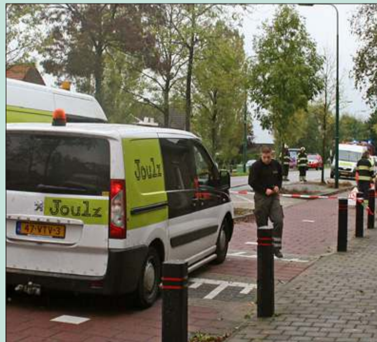
Kortsluiting in een stroomkabel had afsluiting van de Kon. Wilhelminaweg tot gevolg.

's Morgens rond 9.30 uur trad kortsluiting op in een van de stroomkabels. Doordat deze bovenop een gasbuis lag ontstond daar een gat en een brandje in de leiding. Vanaf zwembad Blauwkapel tot aan de kruising bij de Groenekansweg werd het gas afgesloten. Dinsdagavond brandde tegen 20.00 uur overal weer licht, maar het herstellen van de gasvoorziening had wat meer voeten in aarde. Donderdag was bij iedereen de gasmeter vervangen en kon het gas weer overal veilig geleverd worden. Op termijn wordt de gasbuis nog volledig vervangen.