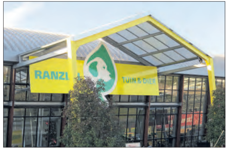
De rechter heeft op 1 november de gemeente teruggefloten om de verleende omgevingsvergunning aan Ranzijn.