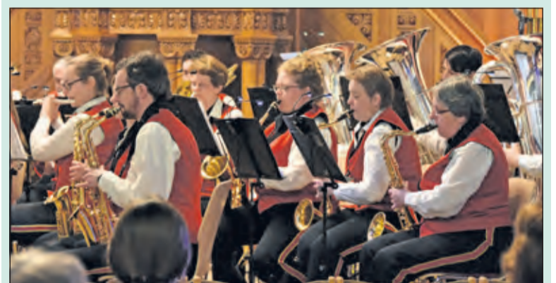
De Brandweerharmonie verzorgt op 16 december een Kerstconcert in de OLV te Bilthoven.

Vrijdag 16 december om 19.30 uur verzorgt de Brandweerharmonie samen met het WP-vrouwenkoor een bruisend Kerstconcert voor jong en oud. De prachtige OLV kerk (Gregoriuslaan) te Bilthoven zal als toneel dienen voor deze muzikale avond. Er valt niet alleen te genieten van de sfeervolle klanken van de blaasinstrumenten, maar deze worden afgewisseld met liederen, gezongen door het koor. Samen met het orkest zullen ook verschillende Carols verzorgd worden, waarbij uiteraard meegezongen kan worden. Na afloop van het concert is er desgewenst koffie, thee of glühwein. De opbrengst van deze muzikale avond wordt geschonken aan de kerk.