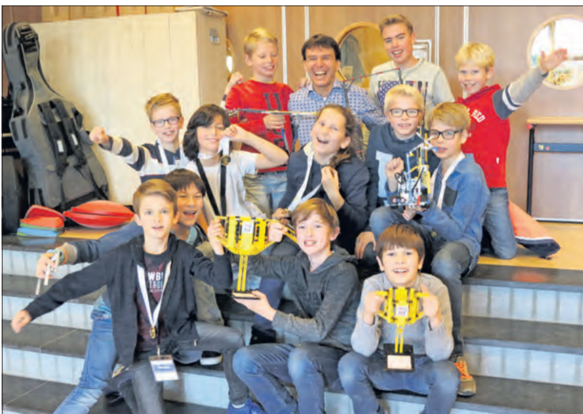
De opgetogen winnaars van de regionale Lego League 2016-2017.

De Julianaschool in Bilthoven, die met 14 leerlingen van groep 8 meedeed, veroverde er twee.