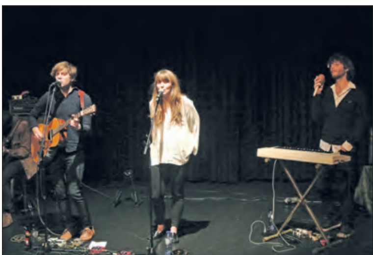
The Wild Raspberries brengen heerlijke luistermuziek voor enthousiaste publiek.