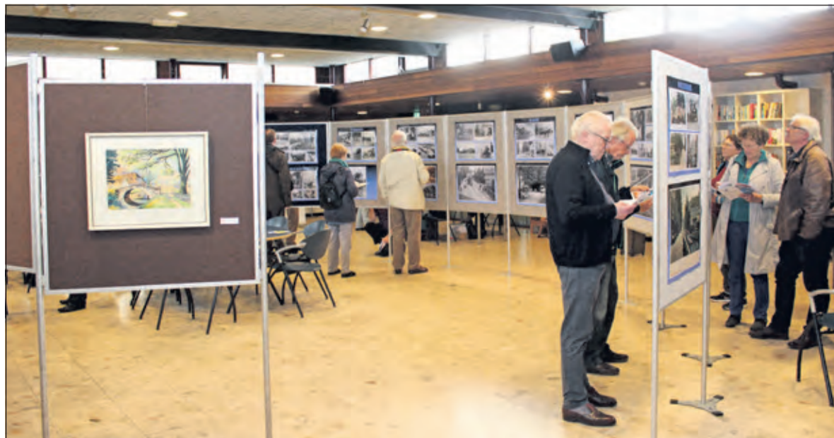
De tentoonstelling was o.a. al eerder te zien bij WVT aan de Talinglaan te Bilthoven.

De nieuwe fietstunnel zorgt ervoor dat fietsers veilig onder de Amersfoortseweg (N237) door