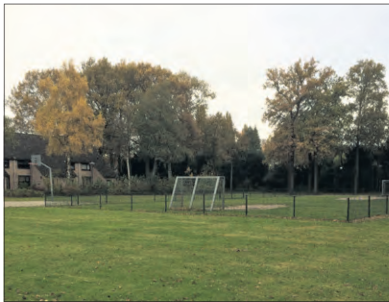
Liever geen antenmast voor telecommunicatie op een speelveldje zegt Beter De Bilt.