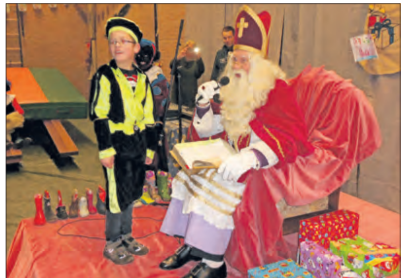
De Sint leest uit zijn grote boek.