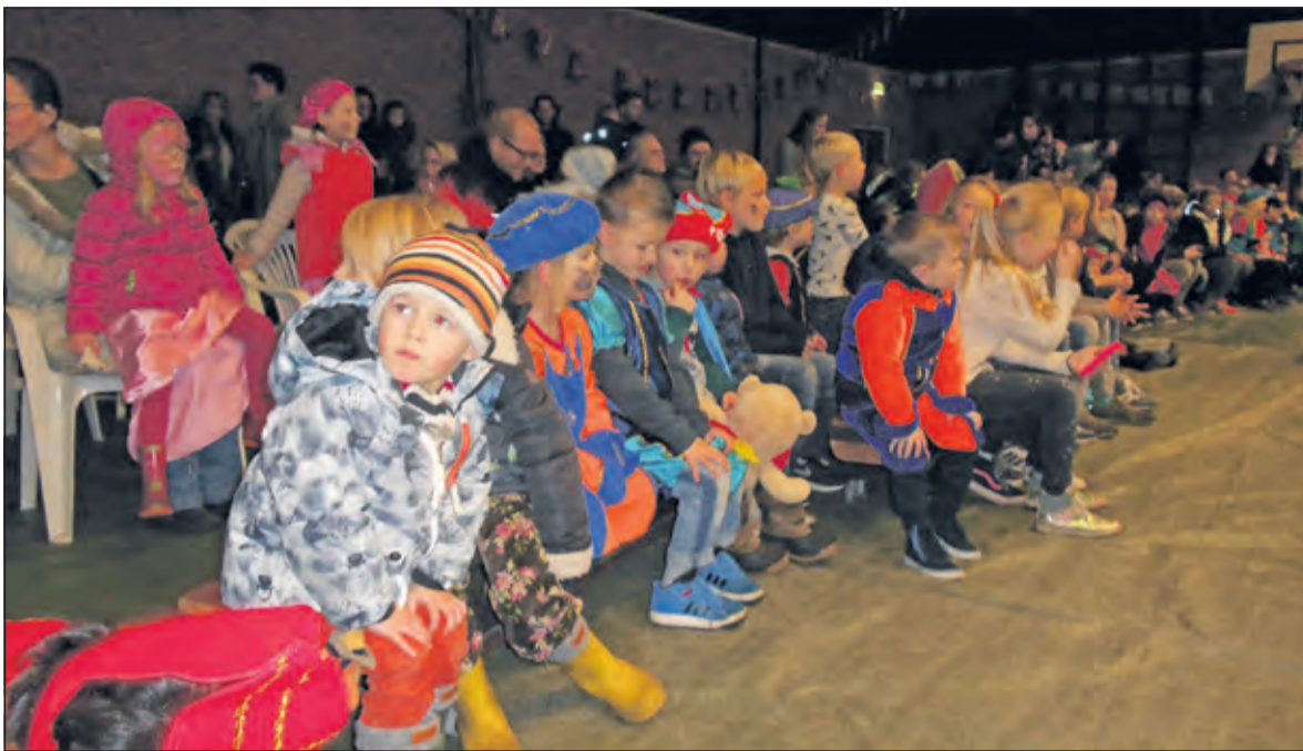
De kinderen wachten in spanning de komst van Sinterklaas af.

Honderd kinderen waren getuige van de aankomst van Sinterklaas in Groenekan. Voorafgegaan door een