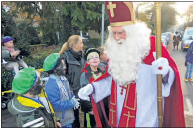
Sint in gesprek met enkele hulppietjes.

rijtuig. Hij werd vergezeld door een groot aantal zwarte pieten. Gedurende de tocht haakten vele ouders aan met hun kinderen. Het resultaat was een vol dorpshuis in een heerlijke sinterklaasfeer.