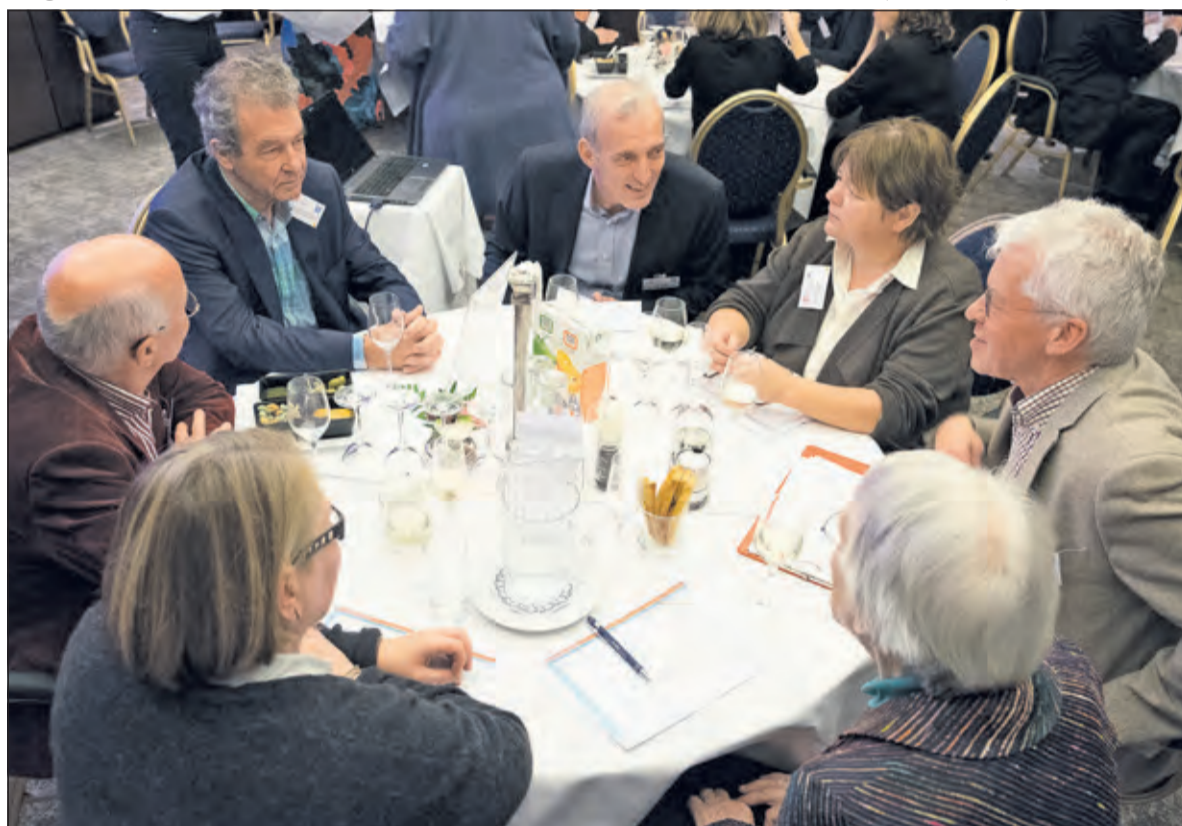
Bedrijven en maatschappelijke organisaties vinden elkaar aan tafel bij het eerste maatschappelijke diner.