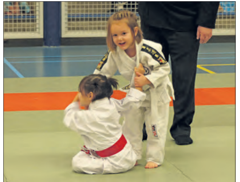
Ook de jongste Judoka's vinden elkaar op de mat.