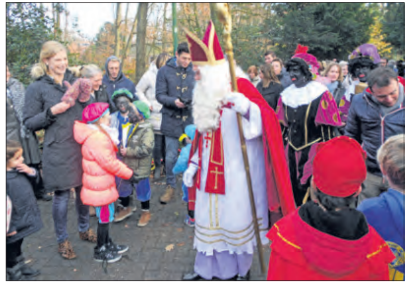
Grote drukte bij dorpshuis De Groene Daan.

Het sinterklaasfeest in Groenekan bestond uit twee activiteiten. De vrijdagavond voorafgaand aan de intocht van Sinterklaas konden de kinderen in dorpshuis De Groene Daan hun schoen zetten met daarin een briefje met naam en leeftijd en mogelijk een speciale wens. Onder leiding van de Verhaaltjespiet en de Boekenpiet konden de kinderen taaipoppen versieren met zoet en lekkers. Alle kinderen mochten hun versierde taaipop mee naar huis nemen.