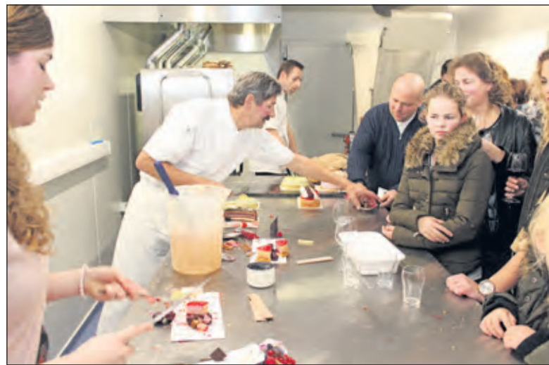
In de nieuwe patisserie-afdeling vergaapt het publiek zich aan de prachtigste creaties.