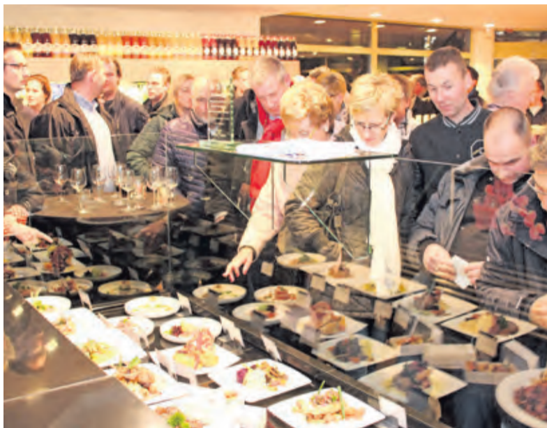
Dringen voor de toonbank met de kerstgerechten.

zameld bij horecagelegenheden en dit transporteert naar de kwekerij. Ongeveer zeven weken later zijn er duurzame, eerlijke maar vooral erg lekkere oesterzwammen gegroeid.