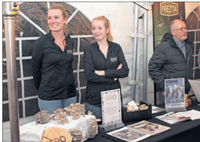
Oesterzwammen gekweekt op koffiedik.