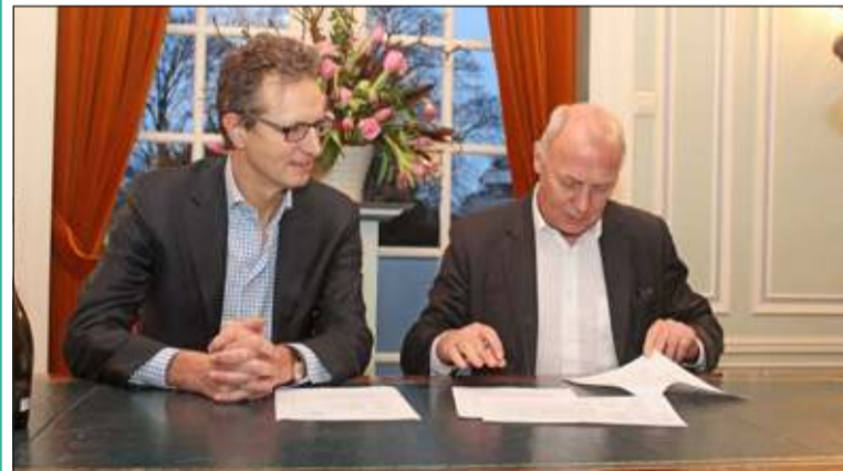
De feestelijke ondertekening was afgelopen maandag.

Door lid te worden van BENG! wil de gemeente inwoners stimuleren om ook deel te nemen aan de lokale energiecoöperatie en werk te maken van Duurzaamheid. BENG! staat voor Biltse Energie Neutrale Gemeenschap in 2030. In de gemeentelijk toekomstvisie 2030, het zogeheten Bilts Manifest, is het doel vastgelegd dat alle gebouwen in 2030 energieneutraal zijn. Dit betekent dat alle energie die nodig is voor de verwarming en elektriciteit van een gebouw, op of rond dat gebouw wordt opgewekt. BENG! wil ook mobiliteit energieneutraal maken. Samen met burgers en bedrijven werkt BENG! zo aan een duurzame energieneutrale gemeenschap in 2030.