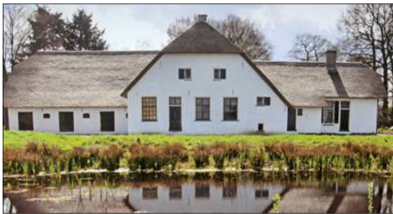
In 2013 werd boerderij Het Gagelgat, behorend bij De Paardenkamp (rusthuis voor oude paarden en pony's) in Soest onderscheiden.

De Boerderijen Stichting Utrecht en Landschap Erfgoed Utrecht streven naar het behoud van de karakteristieke Utrechtse boerderijen en hun erven. Boerderijbewoners kunnen bij ons terecht voor adviezen over verbouwing, restauratie, subsidiemogelijkheden of de inrichting van erf en tuin. Ook staat er veel informatie voor boerderijbezitters op de