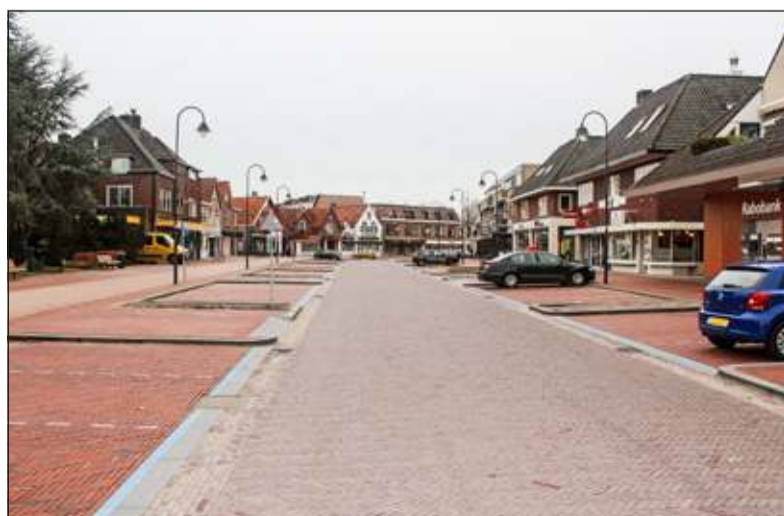
Het zebrapad bij Bakkerij Krijger wordt in juni aan het eind van de werkzaamheden aangelegd.