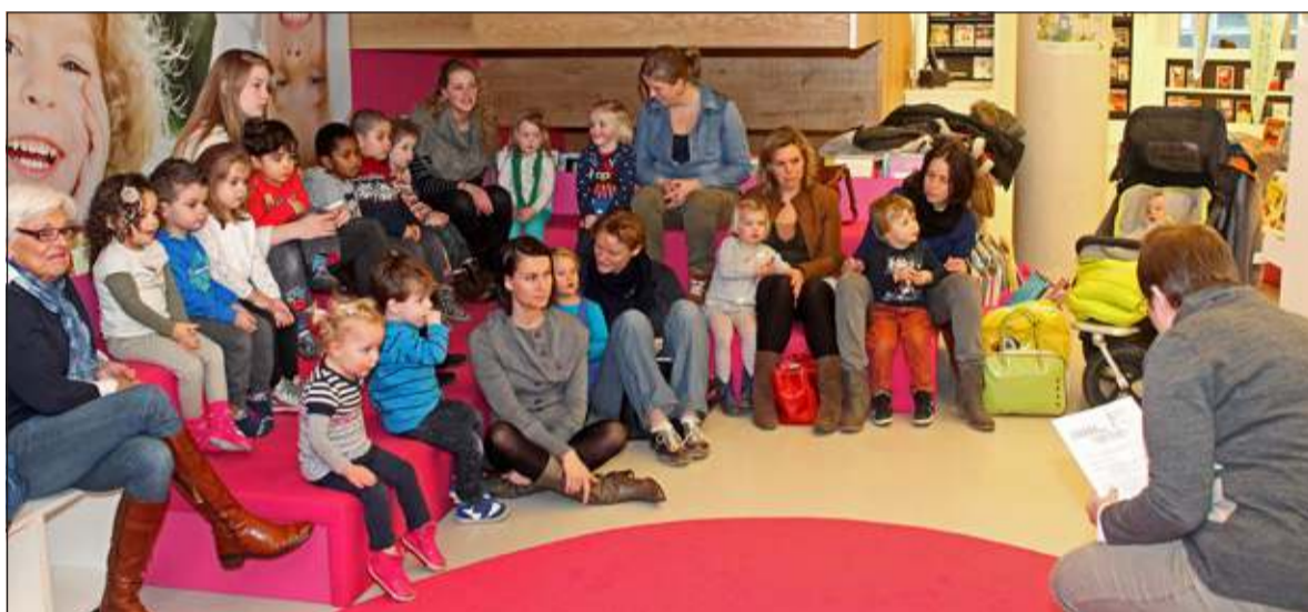
De bibliotheek kijkt terug op een geslaagd voorleesfeestje voor peuters. Woensdagochtend 22 januari kwamen zo'n 15 kinderen naar de bibliotheek.

langrijk. Van Veen: 'Ook bij jonge kinderen die nog niet kunnen lezen is voorlezen heel effectief. Ze leren er veel nieuwe woordjes door. Kinderen snappen hoe het verloop van een verhaal werkt en gaan begrijpen hoe de wereld in elkaar zit. Daarnaast zijn die verhaaltjes ook heel goed voor hun sociale en emotionele ontwikkeling.'