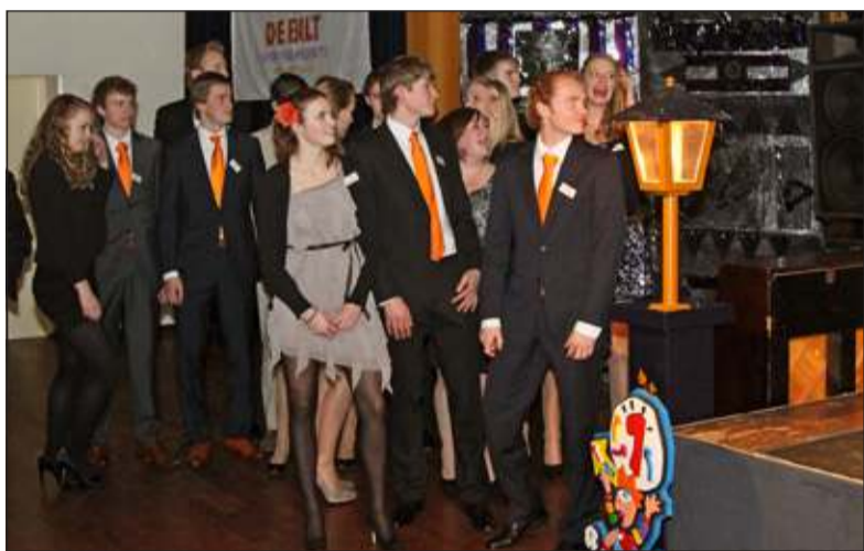
Als er ook een prijs voor de best geklede sportploeg zou zijn, had het genomineerde team A1-junioren van korfbalclub Tweemaal Zes uit Maartensdijk die in 2011 vast gewonnen.