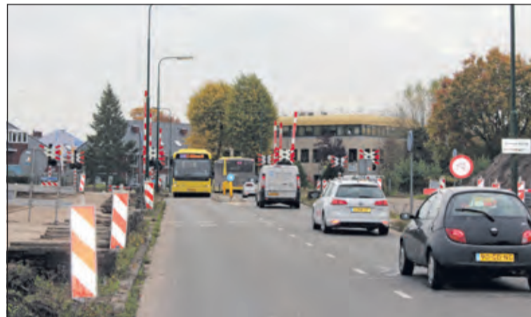
Na 22 november is de spoorovergang bij de Leijen afgesloten.

In verband met de werkzaamheden, die ongeveer 1,5 jaar in beslag nemen, zal ook de spoorwegovergang aan beide zijden vanaf maandag 23 november worden afgesloten. Gedurende de werkzaamheden zal de wijk De Leijen niet bereikbaar zijn via de Leijenseweg. Om er voor te zorgen dat de wijk tijdens de werkzaamheden goed en op een veilige manier bereikbaar blijft, heeft de gemeente een tijdelijk verkeerscirculatieplan (VCP) opgesteld. Dit plan is zorgvuldig afgestemd met een werkgroep van bewoners. Eind mei/begin juni zijn het plan en de omleidingsroute in de praktijk getest. Meer informatie: www.debilt.nl/leijenseweg