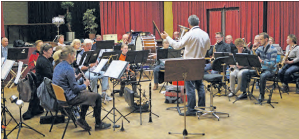
Het voltallige orkest in actie op de voorspeelavond

De jaarlijkse voorspeelavond van de Maartensdijkse muziekvereniging Kunst en Genoegen in De Vierstee viel weer in goede aarde bij het toegestroomde publiek en met de aanmelding van zeker vijf nieuwe leden en nog twee aspirantleden die erover denken om lid te worden van de muziekvereniging, kan gesproken worden van een groot succes.