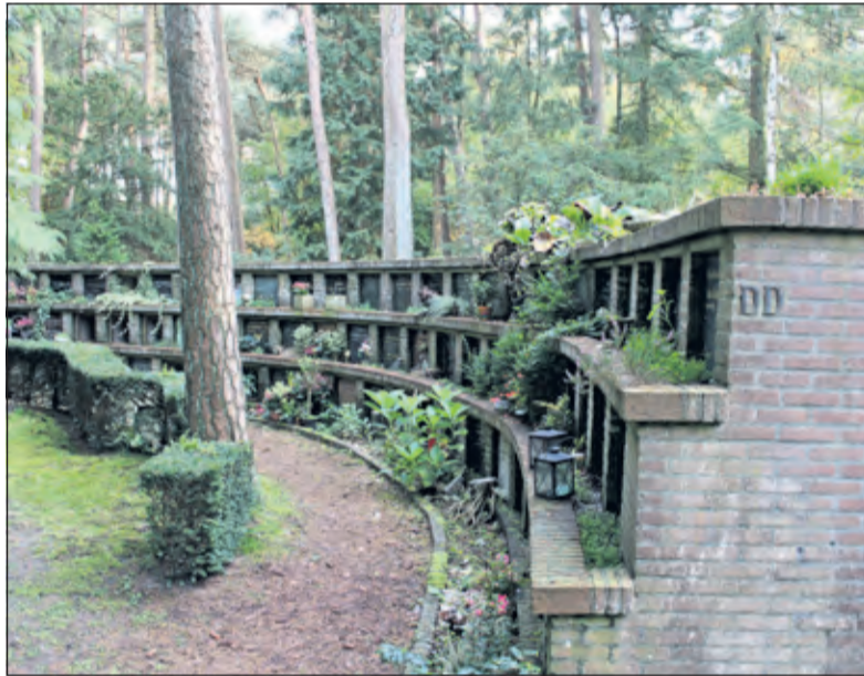
De urnenmuur op Den en Rust.