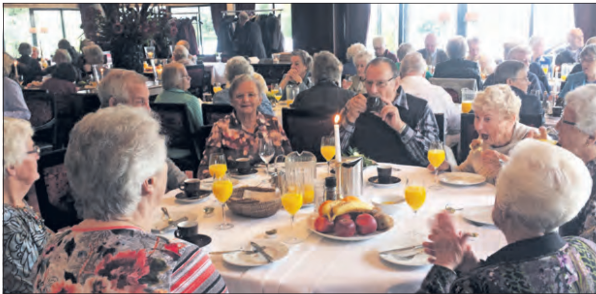
Zonnebloemgasten genieten van een overvloedige lunch bij Van der Valk.

Dat de beursvloer mooie matches op kan leveren bleek afgelopen woensdag nog weer eens. Tijdens de laatste beursvloer leverde een match met Klaas van der Valk een uitgebreide lunch op voor de gasten van de Zonnebloem.