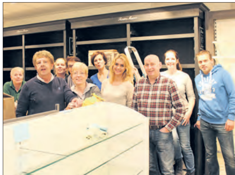
Een grote ploeg staat klaar om de winkel opnieuw in te richten.

Om klanten naar de winkel te trekken is nog veel meer veranderd. Het winkelend publiek wil zoveel mogelijk zijn of haar gang gaan. Daarom staat zelfbediening hoog in het vaandel bij Van Rossum. Zij vertelt verder: 'Klanten willen ook meer beleving in de winkel. Daar proberen wij op in te spelen, bijvoorbeeld door koffie aan te bieden. Ook de uitbreiding van ons huidige assortiment aan geuren, wij geven ook een geurenfolder uit, en babyproducten wil ik hierbij graag vermelden. In onze winkel kunnen klanten ook terecht bij de schoonheids- en pedicuresalon en zij kunnen hier gelnagellak en gelnagels laten aanbrengen. Daarnaast willen wij workshops aanbieden over manicure en huidverzorging.