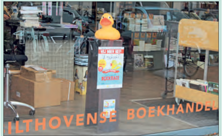
De etalage van de Bilthovense Boekhandel is opgesierd met een grote badende in verband met deelname aan een benefietactie.