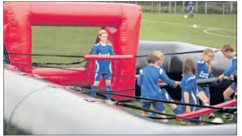
Het levend tafelvoetbal

Veel is te danken aan een groot aantal moeders van SVM deelnemers. Zij hebben vier dagen lang de catering van de lunches verzorgd. Daarnaast heeft SVM een aantal jeugdtrainers geleverd en zijn ook spelers vanuit