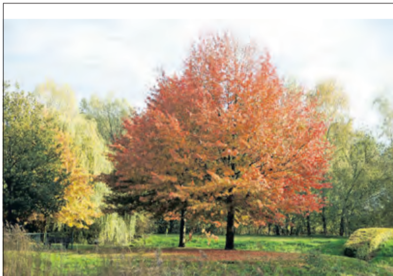
De Amerikaanse eik staat bekend om zijn prachtige herfstkleuren.