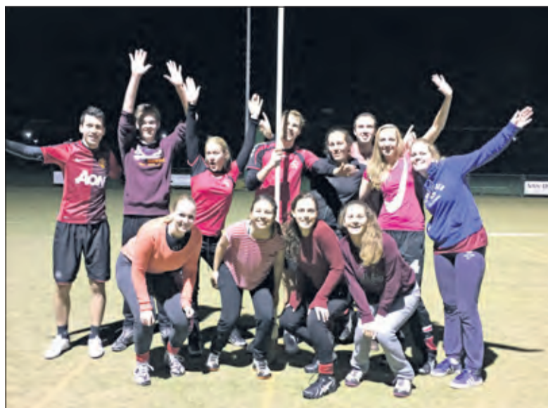
Één van de deelnemende teams om 2.00 uur 's nachts.

Totaal deden er ruim 2.500 deelnemers mee aan de Wintertijd Challenge van stichting Spieren voor Spieren. Er waren zo'n 150 verschillende initiatieven verdeeld over Nederland. Het eindbedrag dat is opgehaald is nog niet bekend