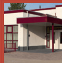
PCB UTRECHT Donaudreef 25 3561 EL Utrecht [030] 262 2244