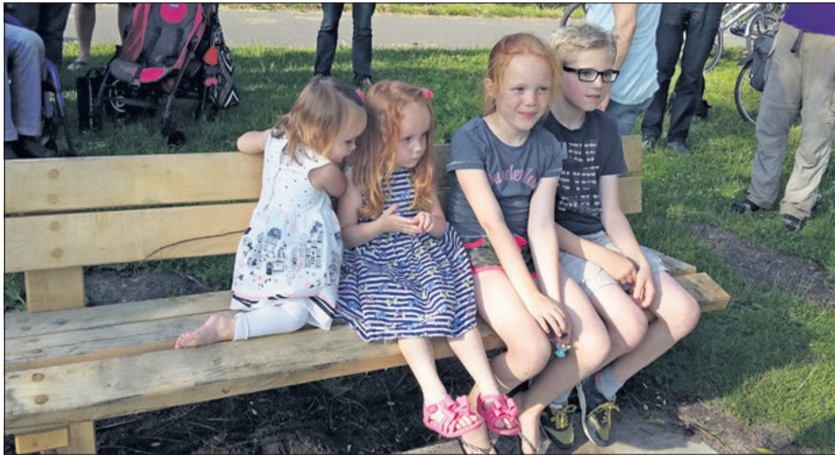
De vier kleinkinderen nemen de bank in gebruik.