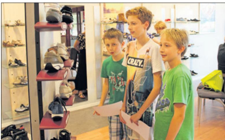
Jongens kiezen jongensschoenen.