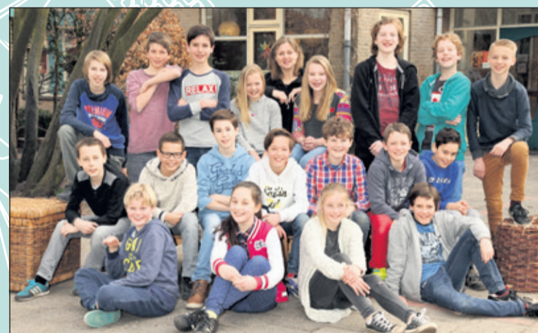
Groep 8 - Het Zonnewiel