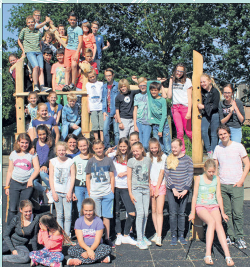
Groep 8 - Martin Luther Kingschool