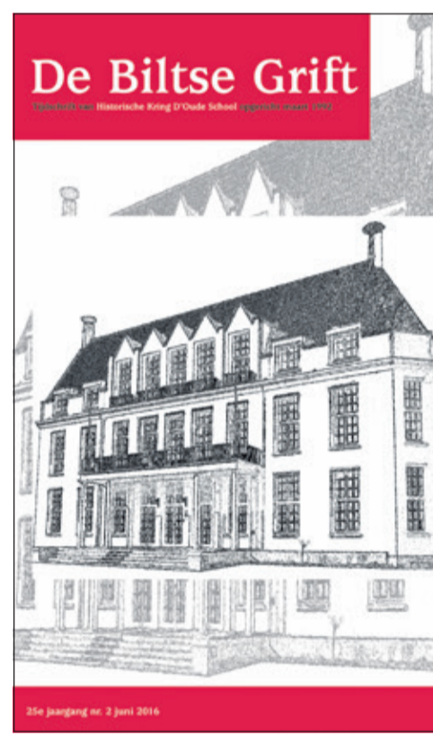
Op het omslag prijkt een schets van Jagtlust.