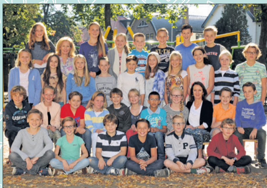
Groep 8 - Van Dijkschool