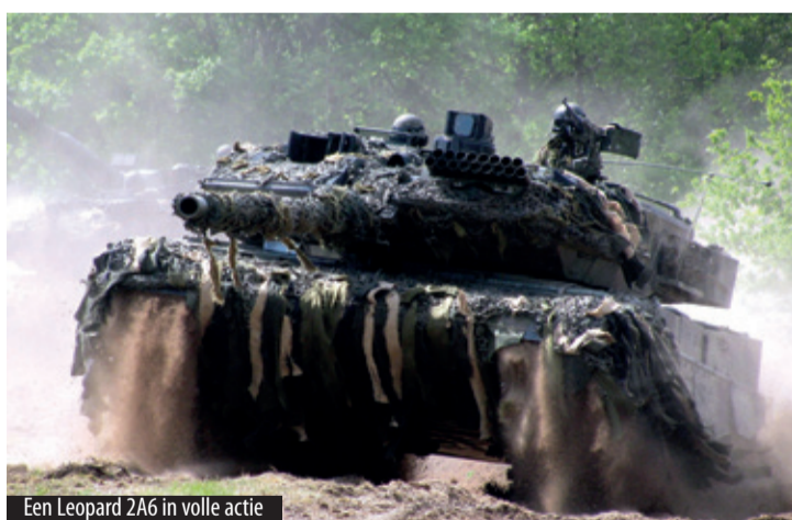
Een Leopard 2A6 in volle actie

Ook dit jaar organiseert het NMM weer een spannende bootcamp en survival voor kinderen vanaf 8 jaar, van zater-