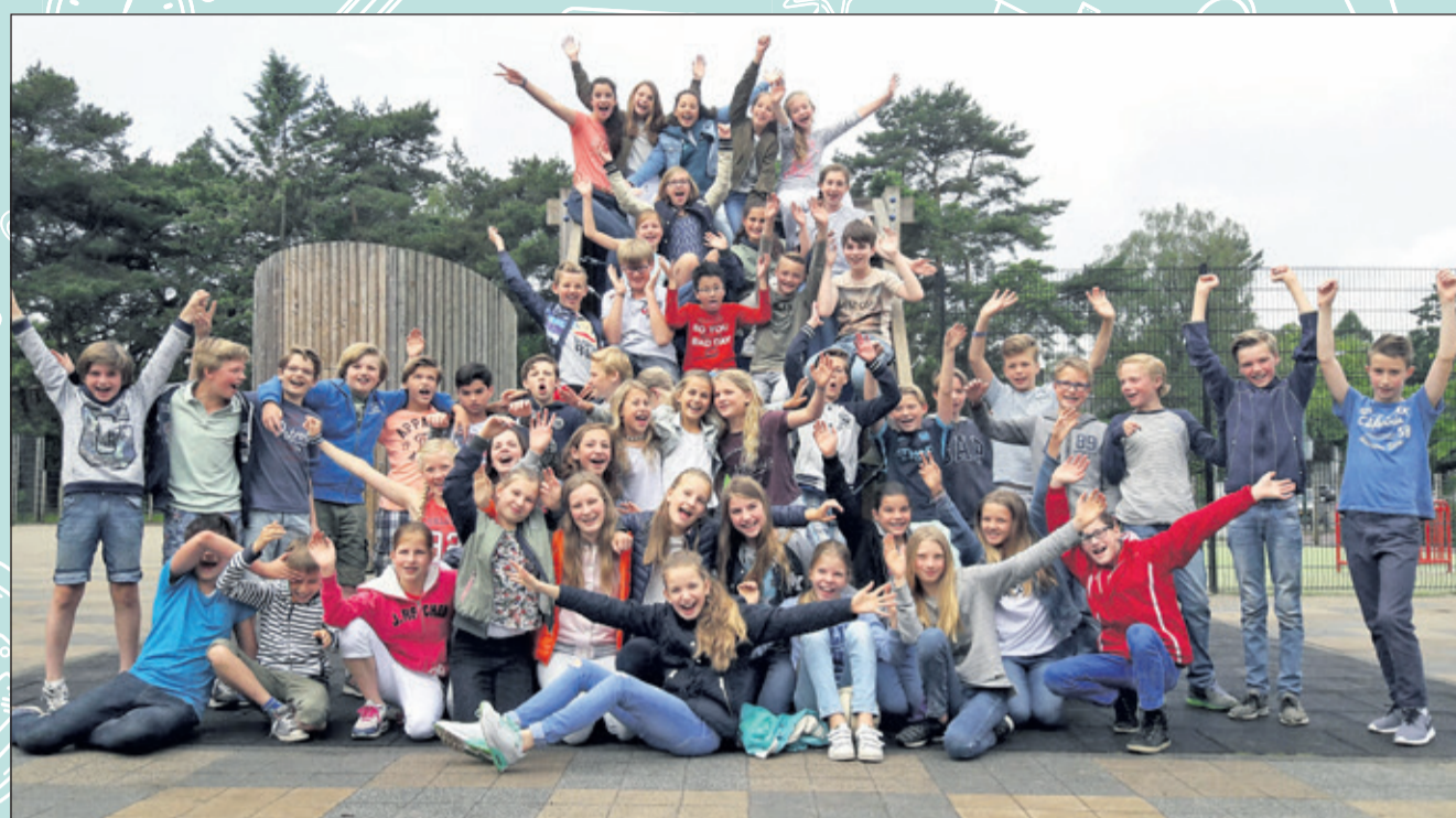
Groep 8A en 8B - St. Theresiaschool