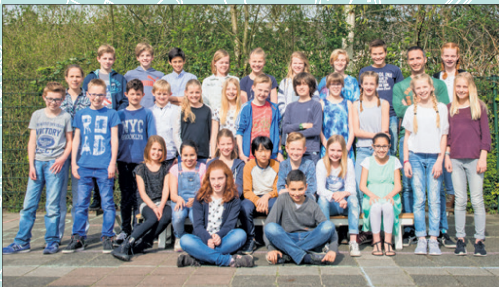
Groep 8 - De Regenboog