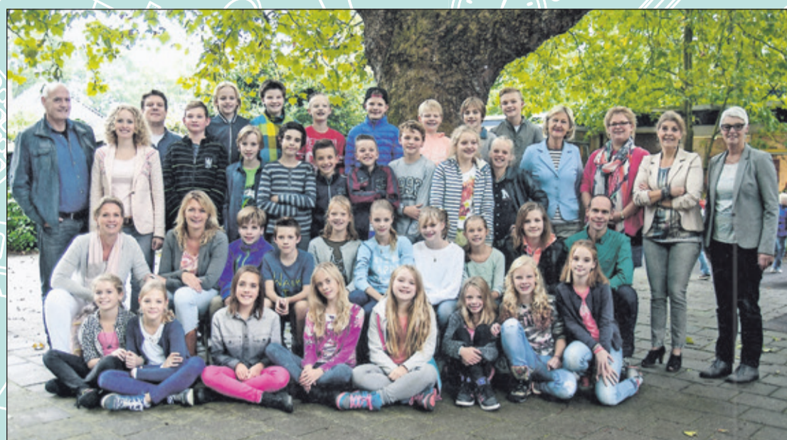
Groep 8 - Nijepoort