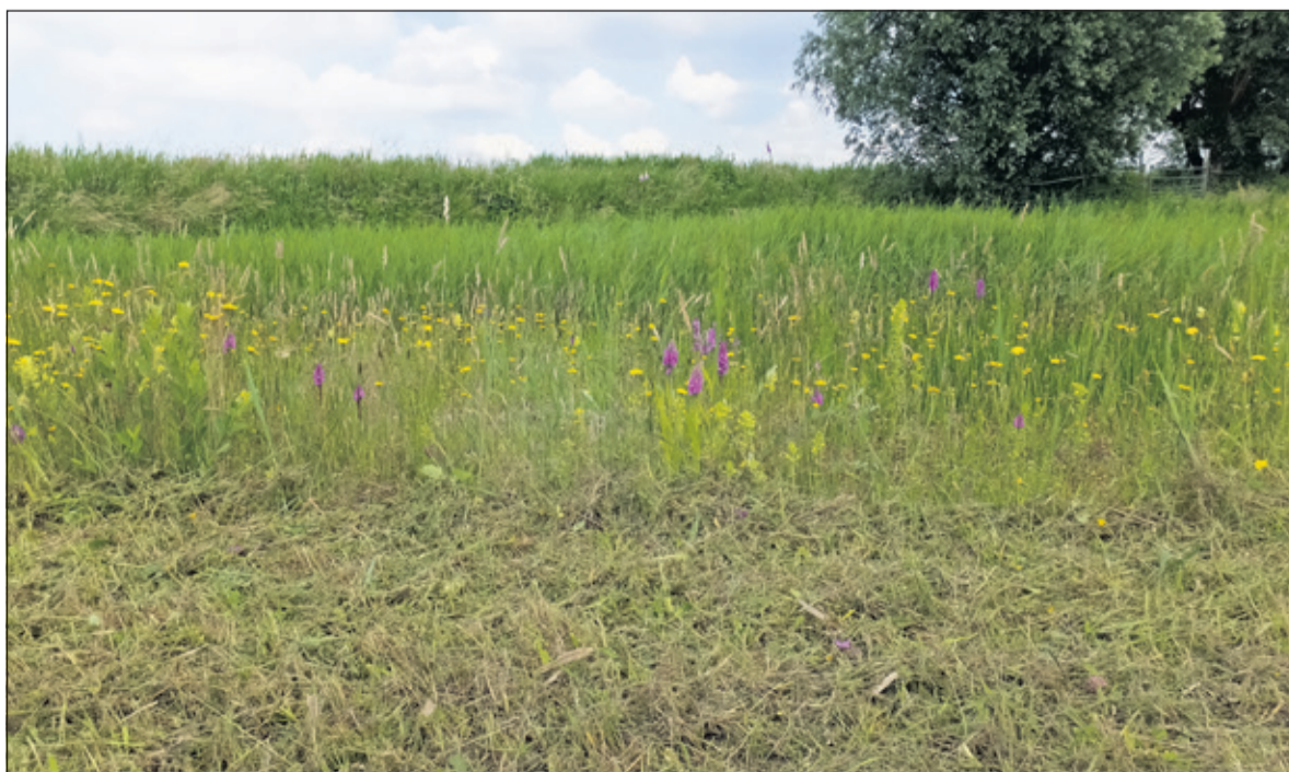
Orchideeën (paars) in volle pracht na de maaibeurt van vorig jaar. Ze waren toen zorgvuldig gespaard