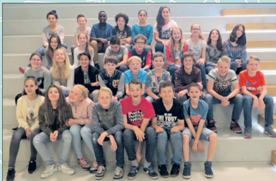
Groep 8 - Wereldwijs