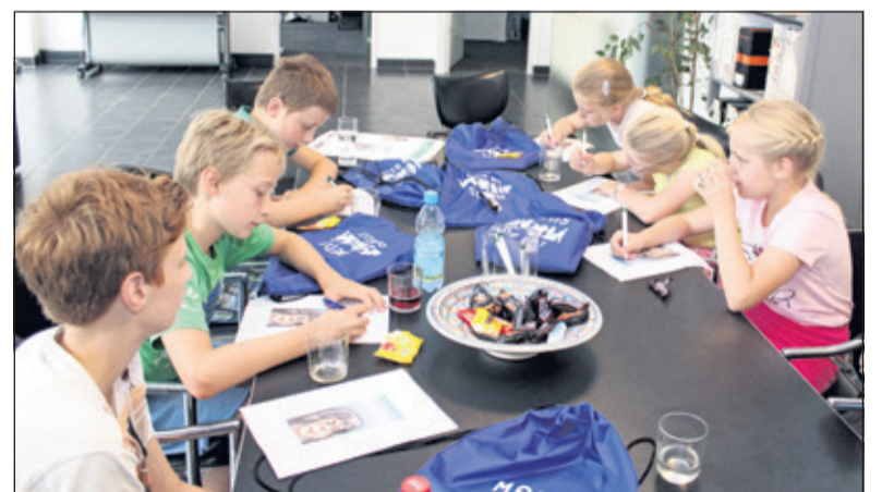
De Moppers worden van tekst voorzien.