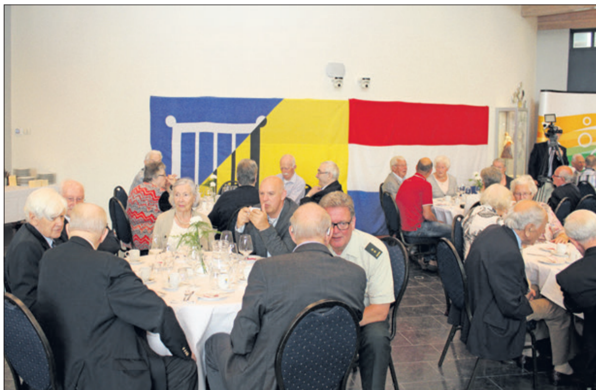
Volop gelegenheid voor ontmoeting.