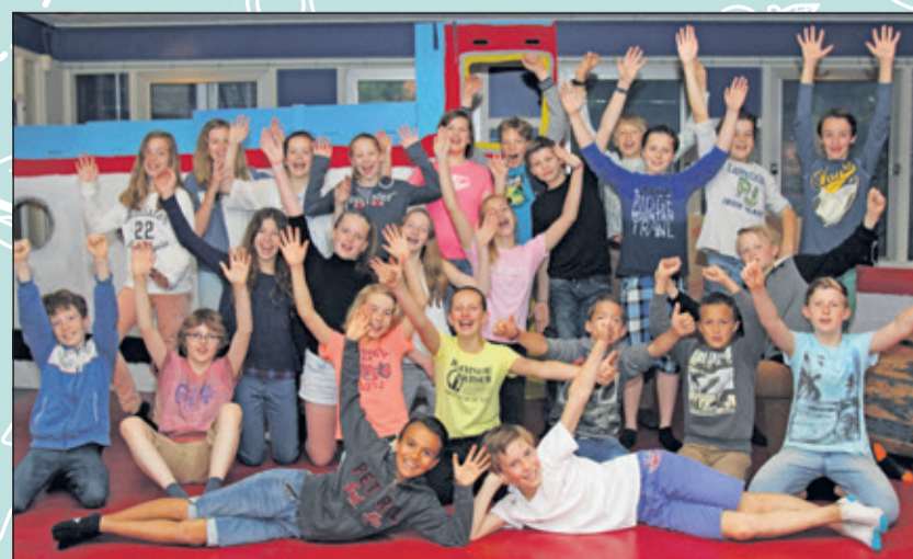
Groep 8 - Montessorischool