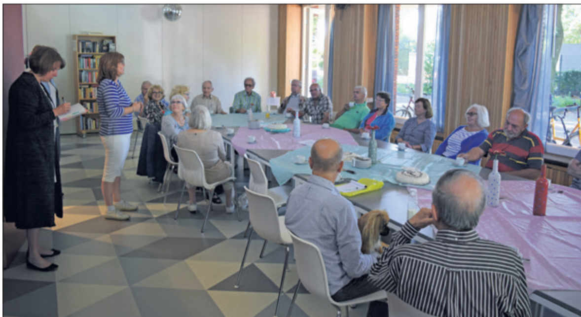
Gasten en vrijwilligers vieren het éénjarig jubileum met koffie en taart.

Over twee weken stopt Lage Venterink met het wekelijks bakken van taarten. Maar niet getreurd. Veel vrijwilligers staan, volgens rooster, alweer te popelen om de gasten van hún taarten te laten proeven. En dat is nog niet alles. Lage Venterink: 'Wij hebben gemerkt dat er veel animo is voor deze vaste woensdagochtend in Hollandsche Rading. Daarom willen wij aansluiten bij Repair-Café. Dus elke twee maanden is er sowieso een extra zaterdag om elkaar te ontmoeten bij Leut'. Iedereen is van harte welkom om ook eens koffie te komen drinken bij Leut: elke woensdagochtend van 10.00 uur tot 12.30 uur, in het Dorpshuis in Hollandsche Rading.