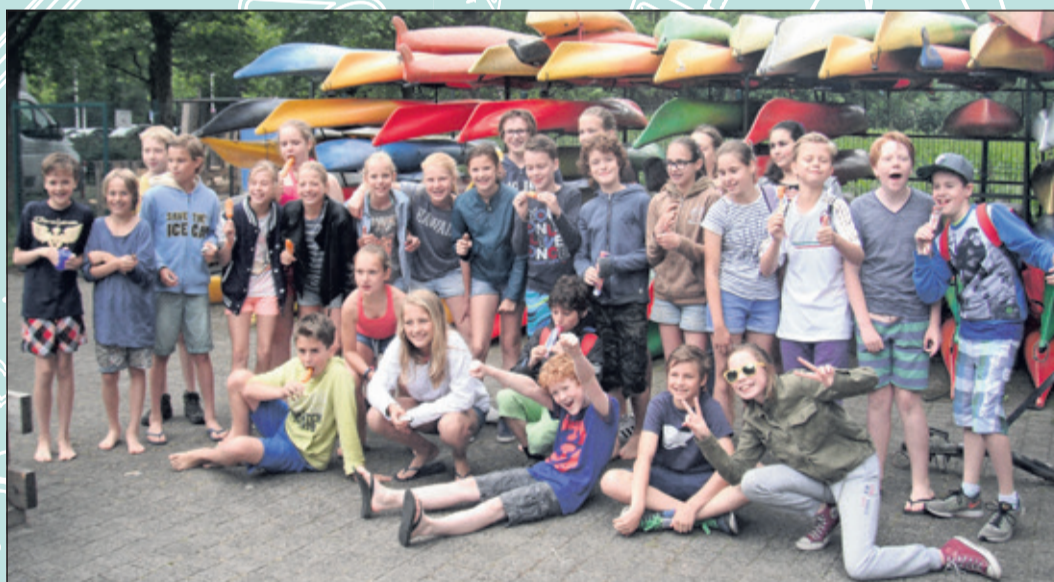
Groep 8 - Patioschool