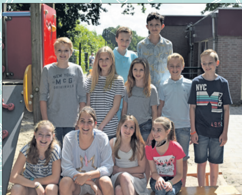
Groep 8 - Bosbergschool