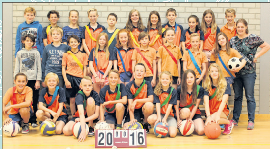
Groep 8C - Julianaschool