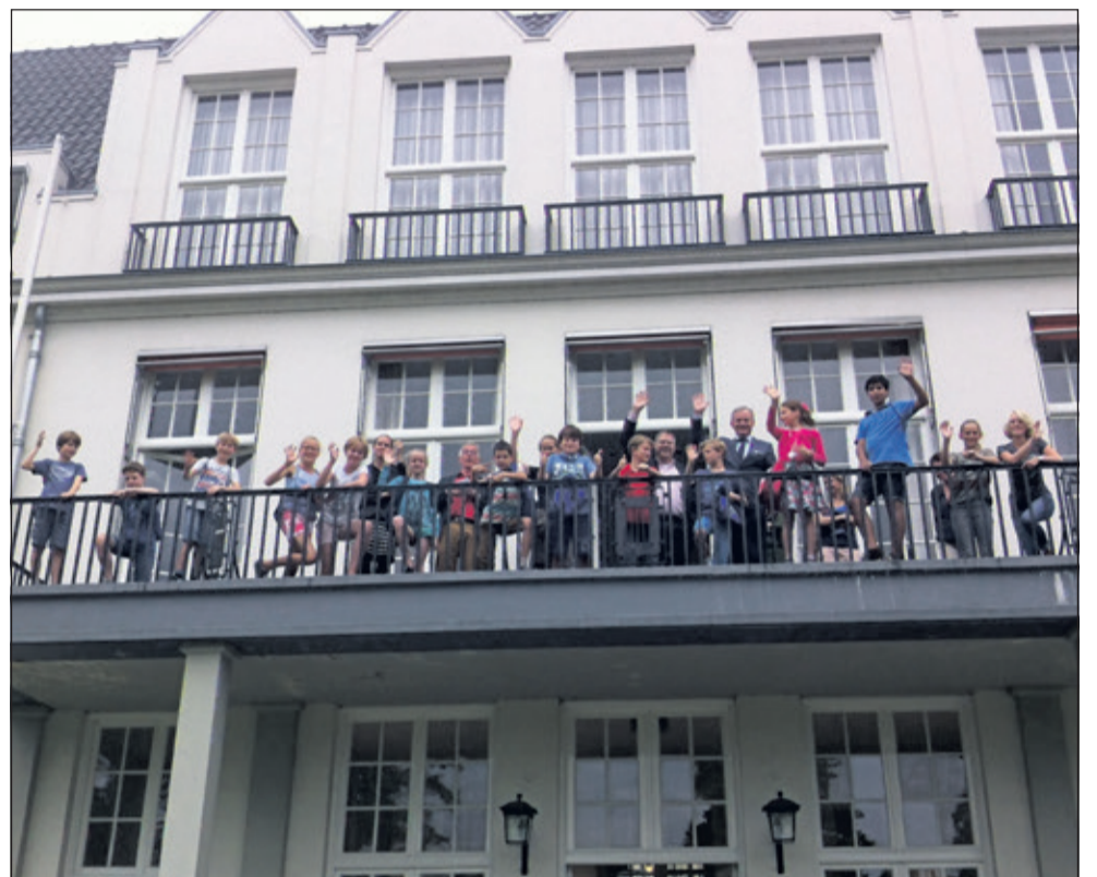
Kinderen, griffiers, raadsleden én burgemeester op het bordes van Jagtlust tijdens de Roefeldag van de gemeenteraad