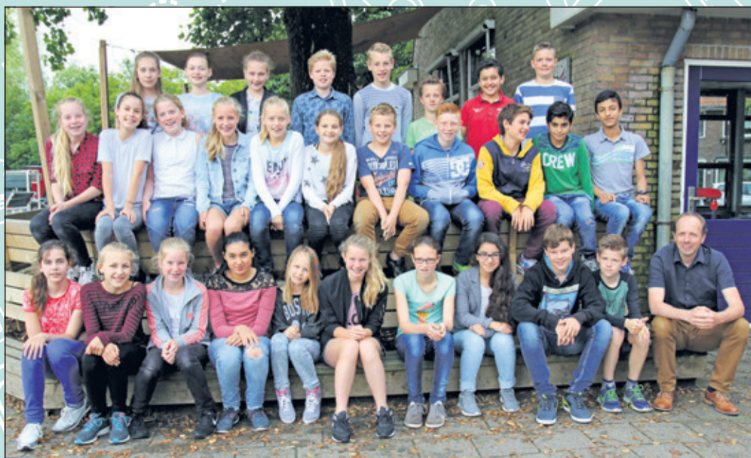
Groep 8 - Groen van Prinstererschool