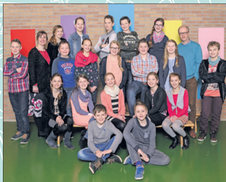
Groep 8 - School met de Bijbel