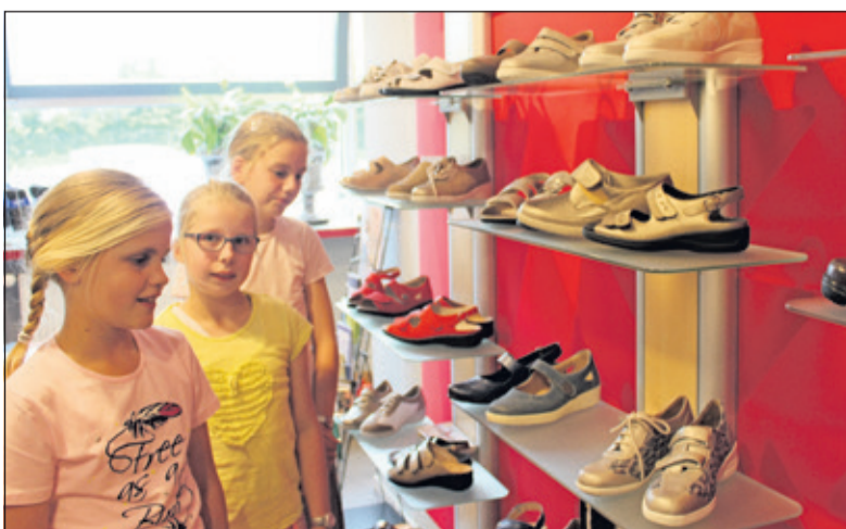
Meisjes kiezen meisjesschoenen.