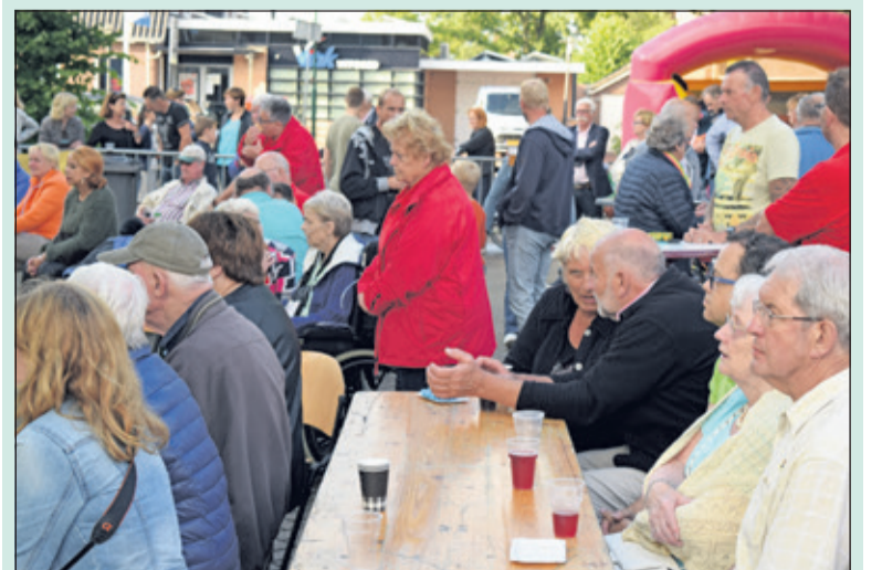
Als afsluiting van het seizoen vond zaterdag 25 juni een gezellig dorpsfeest plaats op het dorpsplein in Westbroek.

Het pleinfeest wordt georganiseerd door Muziekvereniging Vriendenkring uit Westbroek en er waren gastoptredens van het ZfunC, de Sint Anthony Pipe Band en Fanfare Ons Genoegen. ZfunC is dé feestband uit Zuilen met blazers en percussie, de Sint Anthony Pipe Band wordt gevormd door doedelzakspelers in Schotse kilt uit Wijk bij Duurstede en Fanfare Ons Genoegen kwam met een flink aantal blazers uit Montfoort. Vanzelfsprekend verzorgde ook de Westbroekse Vriendenkring, met haar vele jeugdleden, een swingend optreden op het plein.