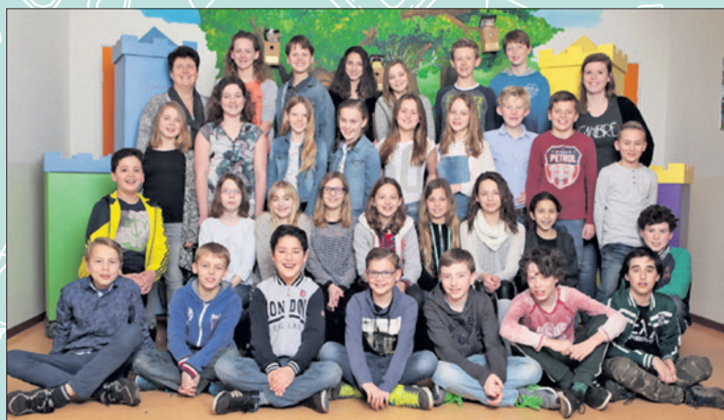
Groep 8 - De Rietakker