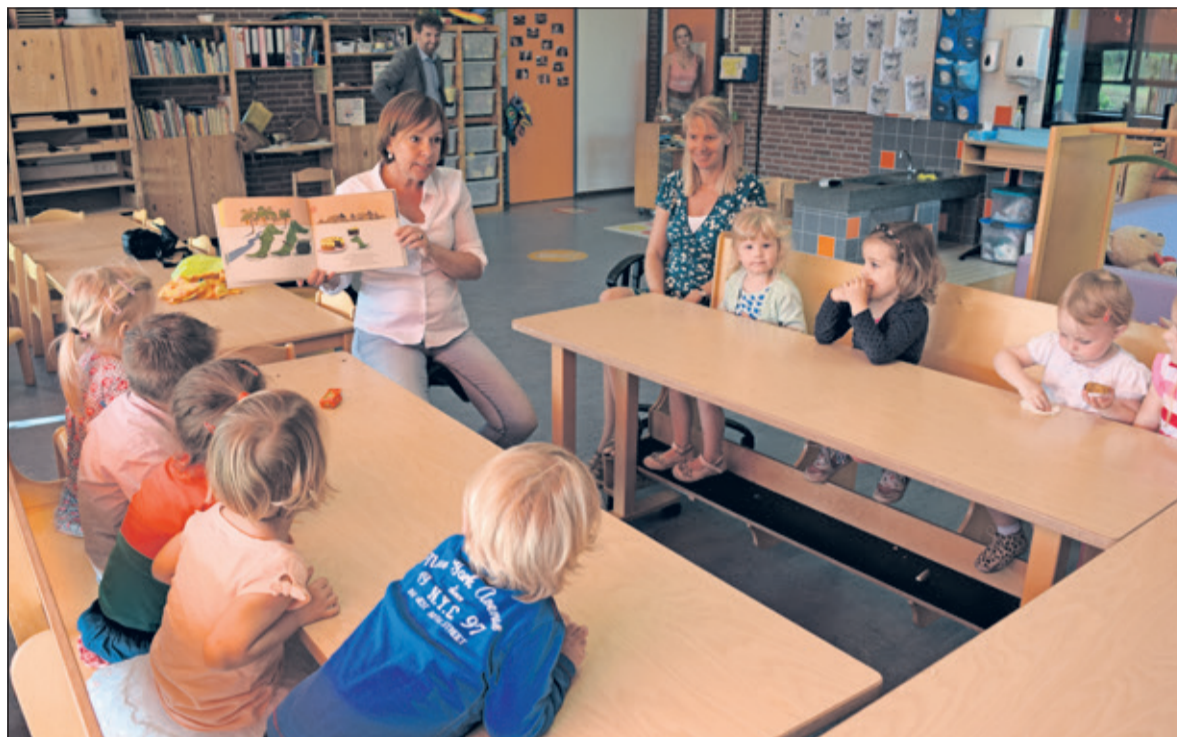
Vol spanning luisteren de kinderen naar het verhaal over de krokodil.

ben altijd in voor veranderingen. Zo wil ik meer invulling geven aan de ruimte van de klas, meer afgebakende ruimtes, zodat de kinderen naast elkaar kunnen spelen. Dit bevordert namelijk hun zelfstandigheid. Ook wil ik hen in contact brengen met andere culturen, bijvoor-