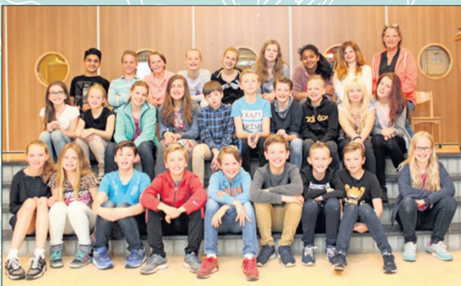
Groep 8A - Julianaschool