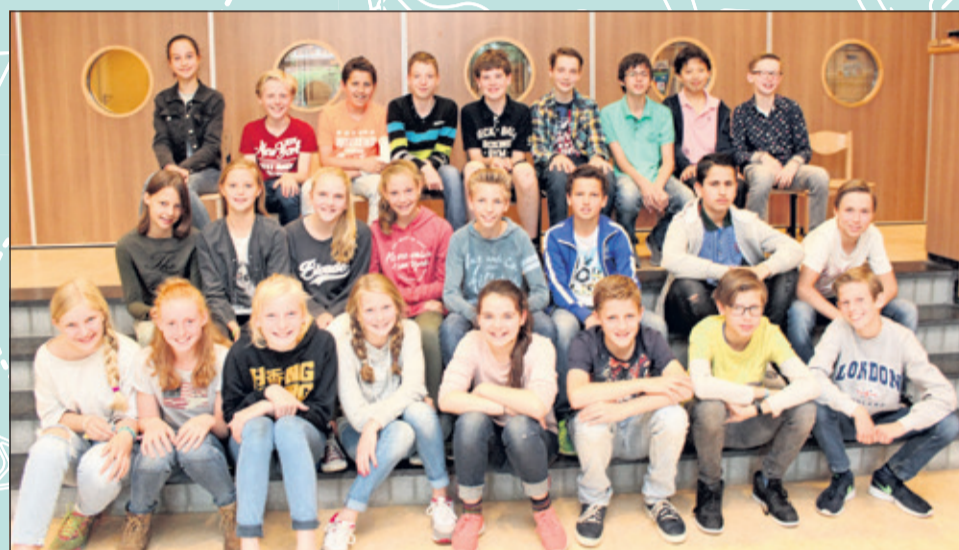
Groep 8B - Julianaschool