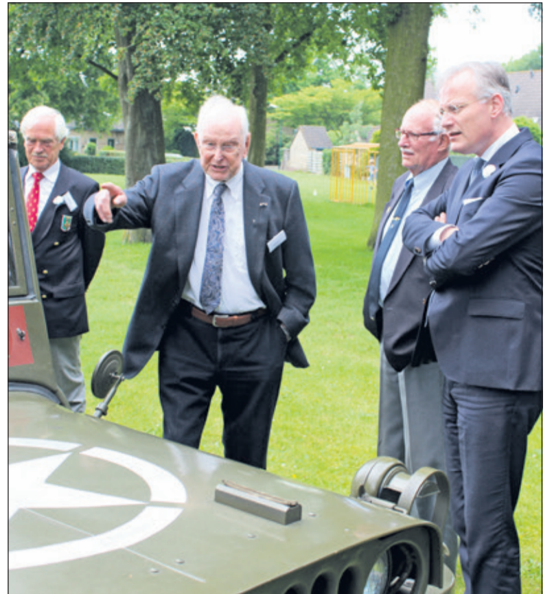
Voorafgaand aan een ritje is er uitleg over de oude voertuigen.