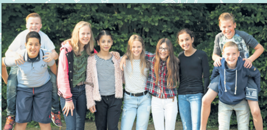
Groep 8 - Kievitschool