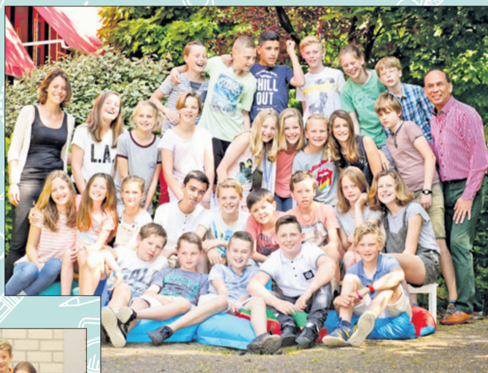
Groep 8 - Michaëlschool