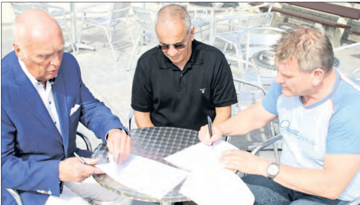
SVM en Beltona bekrachtigen de samenwerking met het tekenen van een overeenkomst.

kiest er opnieuw voor de kleding bij Beltona aan te schaffen en daarna zelf aan haar leden te leveren. Dit is voor de club een aanzienlijke, structurele inkomstenbron gebleken.