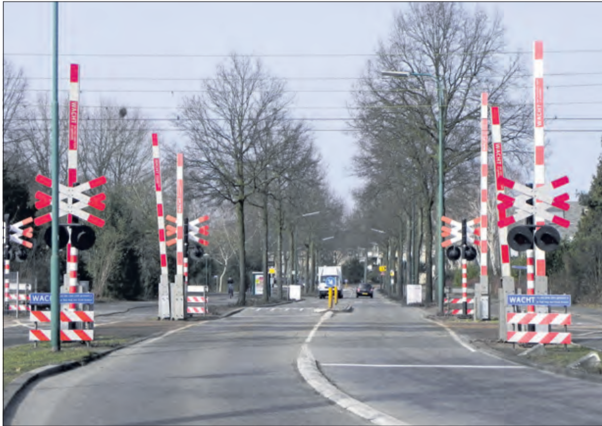
Tijdens de ondertunnelingswerkzaamheden zal het verkeer gedurende anderhalf jaar om moeten rijden om de Leijen te bereiken.

Tijdens de eerste week bleek dat de aangepaste situatie niet voor iedereen even duidelijk was. Met name borden en routeaanwijzingen kunnen verder verduidelijkt worden. De doorstroming in de ochtendspits verliep op een aantal plekken moeizaam waardoor het verkeer last had van langere