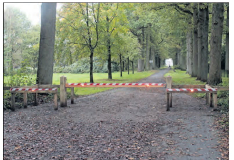
De afzetting ter hoogte van Meijerink op de 'Oude Gezichtslaam' vormt een obstakel voor alles met meer dan 2 wielen..