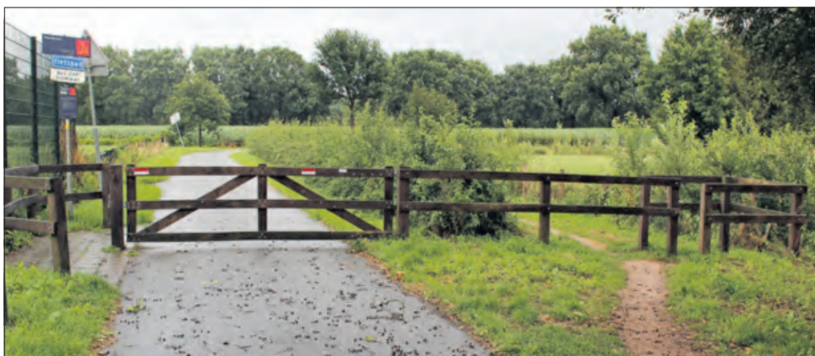
Het landhek heeft een snelheid-remmende functie zodat gebruikers van het Waadpad veilig het fietspad kunnen oversteken.

Ook het obstakel op het Vuurse Pad (Maartensdijk - Hollandsche Rading) wordt genoemd: 'Wij hebben gehoord, dat het hek wandelaars zou moeten beschermen, die daar kunnen oversteken. Nou fietsen we daar héél vaak en wij hebben er nog nooit