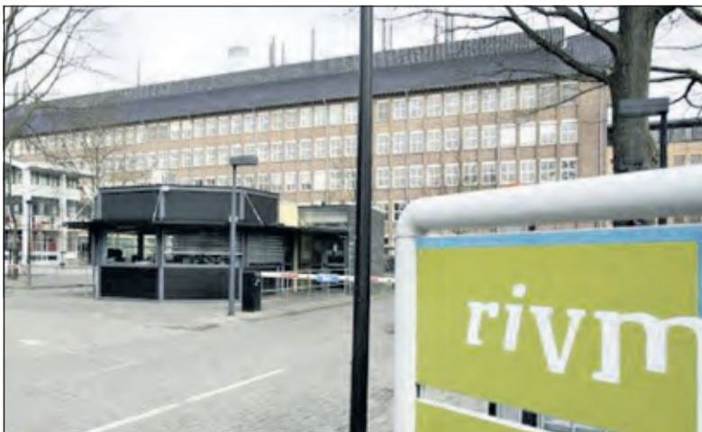
Tot aan de verhuizing naar de Uithof huurt het RIVM de gebouwen terug van de nieuwe eigenaar.

het terrein overeengekomen. In 2014 werd het gehele terrein verkocht aan Bilthoven Biologicals. Daarmee is langdurige leegstand op dit bedrijventerrein voorkomen en is werkgelegenheid behouden gebleven.