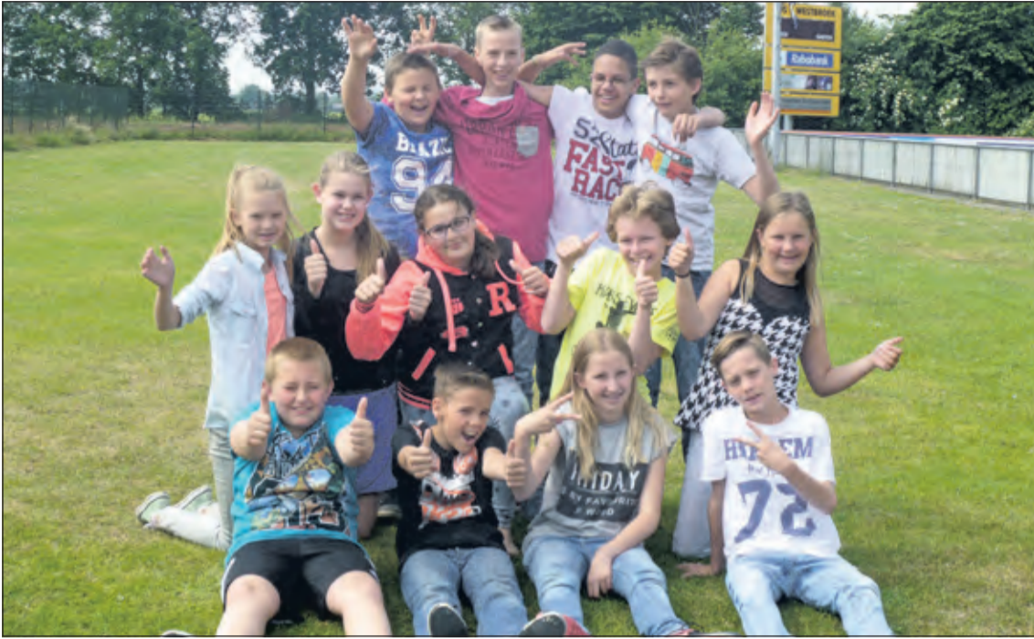
Groep 8 - Het Kompas

In verband met plaatsgebrek hebben we een aantal foto's van de groep 8-ers die hun basisschool verlaten eerder niet kunnen plaatsen. Bij deze alsnog. Ook deze leerlingen wensen we veel geluk op hun nieuwe school.