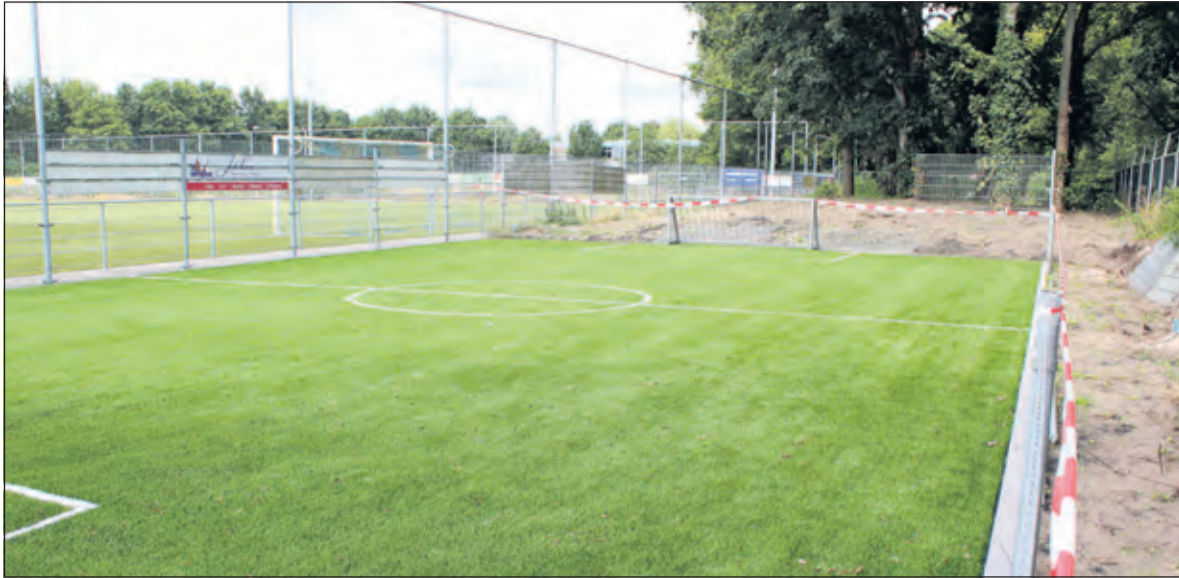
Achter het hoofveld van SVM wordt een Pannaveld aangelegd.