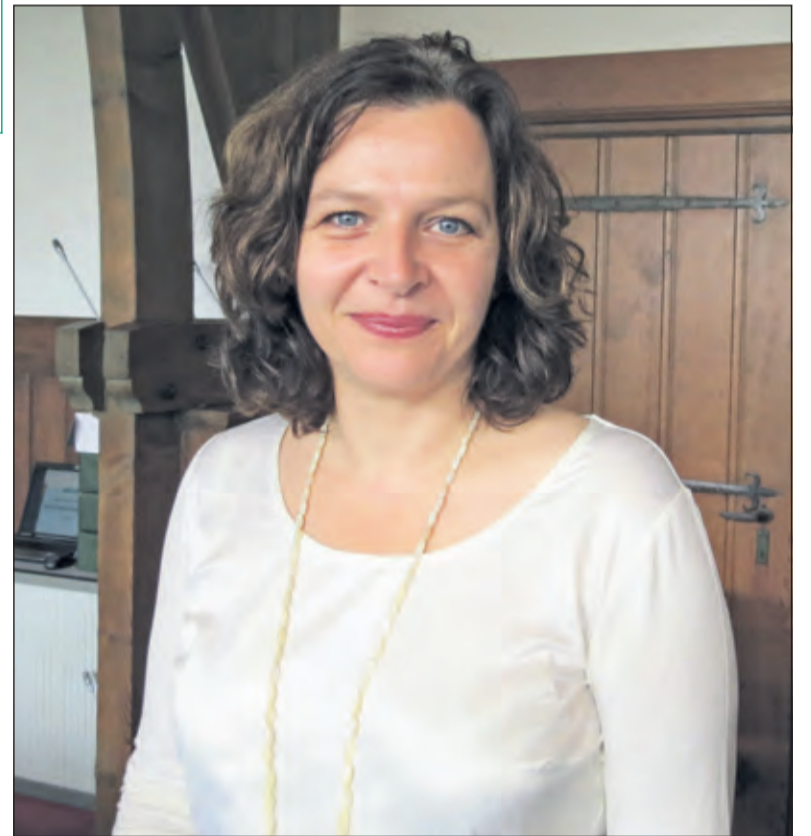
Minister Edith Schippers van Volksgezondheid, Welzijn en Sport in Jagtlust.

Er werd een scenario uitgewerkt om het Antonie van Leeuwenhoekterrein af te stoten en te herontwikkelen voor woningbouw. Door het besluit om de productieactiviteiten van het Nederlands Vaccin Instituut te verkopen is het scenario herontwikkeling voor woningbouw verlaten. Voor de nieuwe huisvesting van het RIVM is indertijd een uitgebreide businesscase gemaakt. In 2010 is berekend dat de exploitatielasten voor nieuwbouw 7 miljoen euro per jaar lager uit zou vallen dan het kostenniveau van 2010. Bij de verkoop van de productiefaciliteiten van het voormalig Nederlands Vaccin Instituut is met Bilthoven Biologicals een optie op koop van ruim de helft van