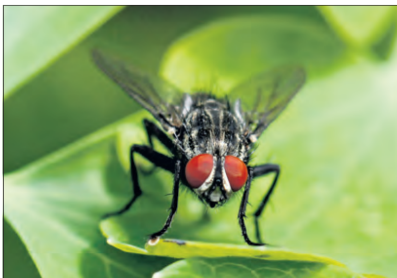
Uitvergroet zie je prachtige details.

Alle roofvliegen hebben 3 bijogen tussen hun 2 facetogen, sterke spinachtige poten, en een borstelsnor. Met hun korte sterke zuig-snuut steken ze hun prooi en spuiten Neurotoxische en Proteolytische enzymen naar binnen. De prooi wordt verlamd en hun ingewanden verteren, de roofvlieg zuigt dan de vloeibare inhoud op.