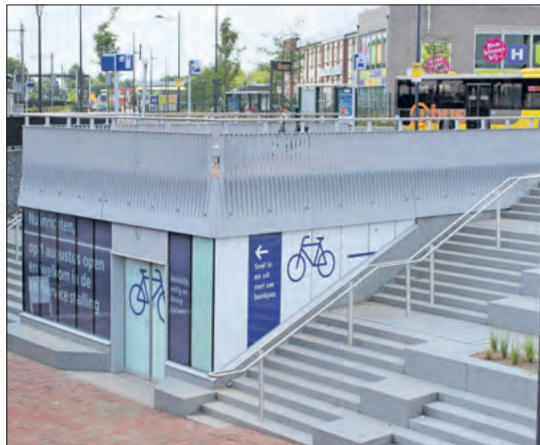
Vanaf 1 augustus is de nieuwe fietsenstalling bij het station operationeel.

Daarnaast kun je in de stalling persoonlijk contact opnemen met een klantenservicemedewerker via een intercomverbinding, is er camera-toezicht en is er een noodknop voor spoedhulp. Ook voor OV-fietsen kun je er terecht. De fietsenrekken hebben uitschuifgoten waardoor het ook boven gemakkelijk stallen is. Er is plek voor 470 fietsen'.