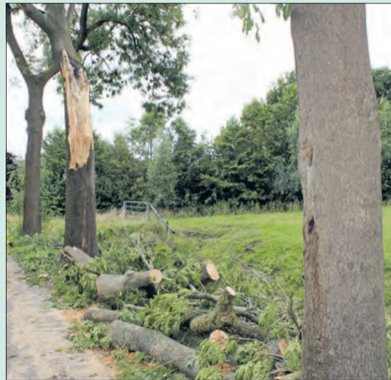
Ook langs de Voordorpsedijk in Groenekan ter hoogte van het fietspad langs de Hooge Kampse plas richtte de zwaarste zomerstorm sinds 1901 afgelopen zaterdag onherstelbare schade aan. Een dag later was de weg weer vrij gemaakt, waren de eerste stukken gezaagd en stapten vooral de fietsers af om één en ander goed te bekijken.