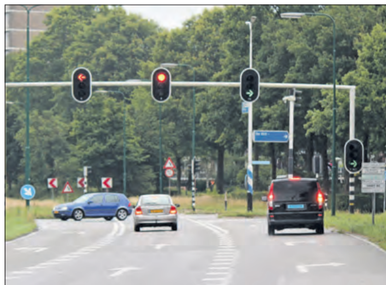
De verkeerslichten bij de kruising met de Biltse Rading worden aangepast.

De route van buslijn 77 (Nieuwegein-Utrecht CS-Bilthoven) is gedurende deze periode gewijzigd. De haltes op de Sarteweg en de Veemarkt in Utrecht en de Alfred Nobellaan, Hessenweg, Looydijk en het Dr. Letteplein komen te vervallen; vervangende haltes zijn: Oorsprongpark in Utrecht en Groenekansweg en Bilthovenseweg in De Bilt. Op verzoek stopt de chauffeur bij de halte Kerklaan op de Utrechtseweg in De Bilt.