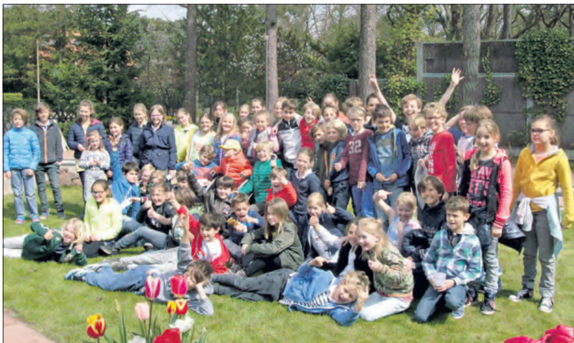
De proefkonijnen van de Therasiaschool.

Als alternatief voor de Koningsspelen waren op vrijdag 22 april ruim 275 kinderen (10 groepen) van de Theresia-basisschool te gast op de midgetgolfbaan te Bilthoven, waar zij van 9.00 uur en 14.30 uur gebruik konden maken van de midgetgolfbaan.