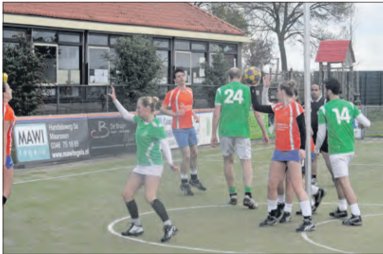
DOS beslist de wedstrijd met een ruime 25-9 overwinning.

De tweede helft begon nog goed, maar al snel zorgden hagelbuien ervoor dat het afronden minder werd. Wel had coach Steven Brink in de pauze zijn achtal er op gewezen dat er verdedigend consequenter