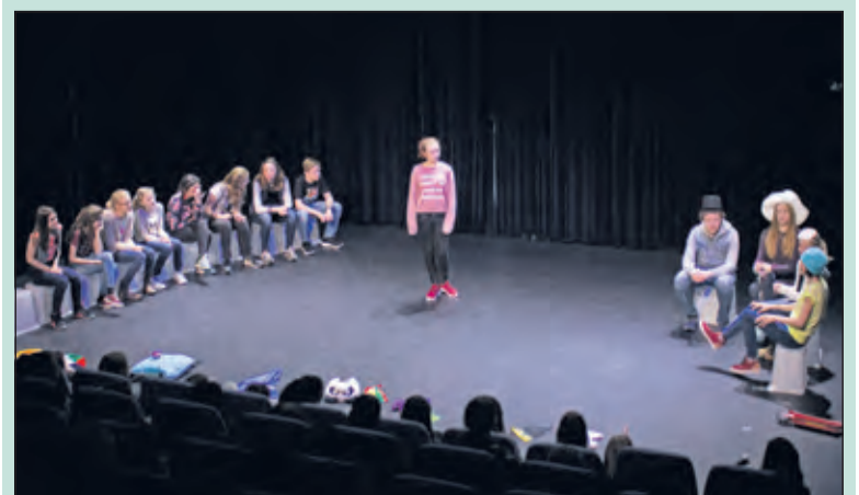
Productieklas 1 van Maquerade op het toneel.

De leerlingen van productieklas 1 van Theaterschool Masquerade speelden op 16 april de voorstelling Achtste groepers huilen niet! (naar het gelijknamige boek van Jaques Vriens) voor een uitverkochte zaal. Het is een ontroerende voorstelling waarin het verhaal van Akkie en haar groep 8 wordt verteld. De voorstelling gaat in reprise tijdens het theaterfestivalweekend Together op 3, 4 en 5 juni. (Corinne Weeda)