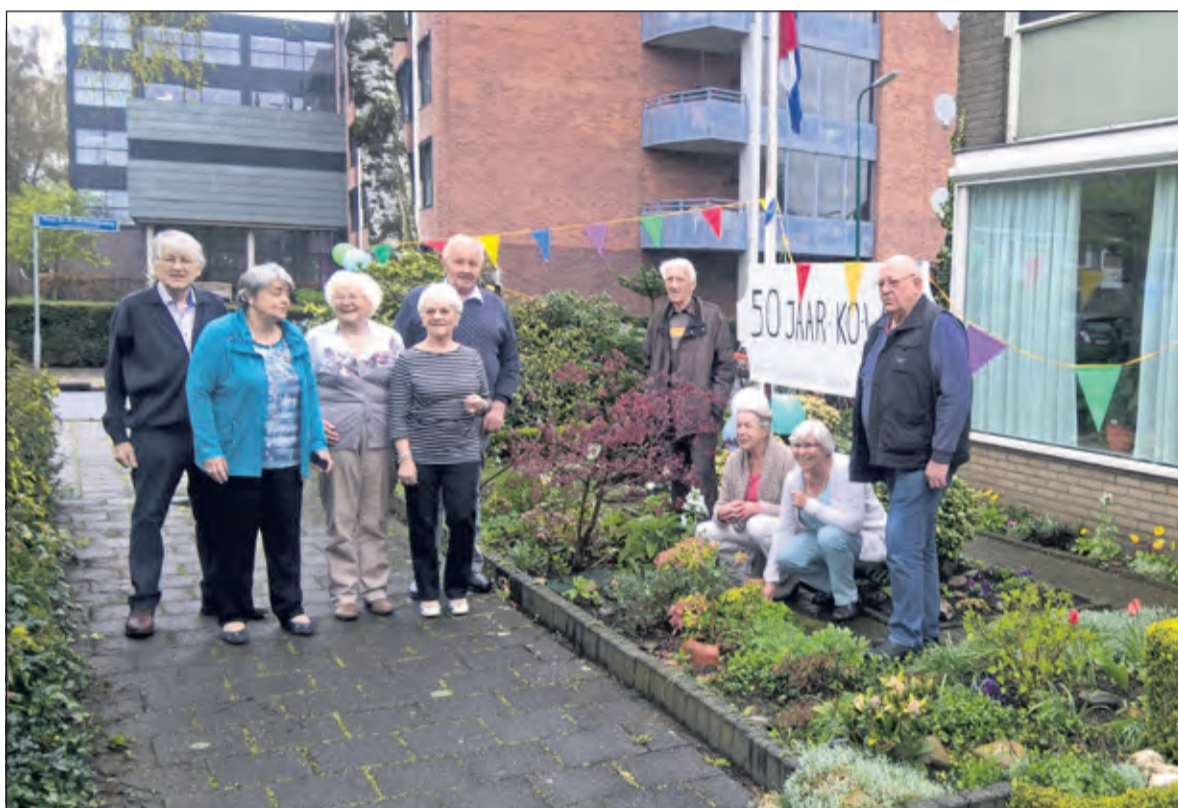
De Biltse bouwbuurs vieren hun jubileum.

Nu dus 50 jaar geleden, in april 1966, kon ieder zijn huis betrekken maar waren er nog veel klussen te doen die wij gezamenlijk uitgevoerd werden. De groep woont nog steeds met veel plezier in de rustige, groene en zonnige straat en is nog steeds blij met elkaar als burens.