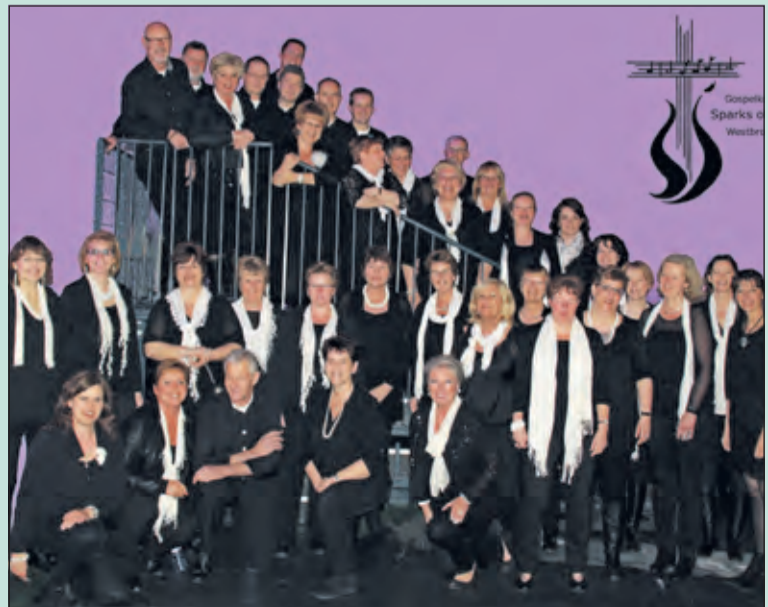
Gospelkoor Sparks of Joy in concert.

De avond wordt georganiseerd in het kader van de actie Vierstee 2.0 om geld in te zamelen voor de (ver-)nieuwe Vierstee. Kaarten bestellen en afhalen via: Primera Maartensdijk, De Vierklank, en tuincentrum Karel Hendriksen in Hollandsche Rading. Toegangsprijs € 7,50. E-mail: evt@ebbevanontingingen.com, tel. 06 53225908.