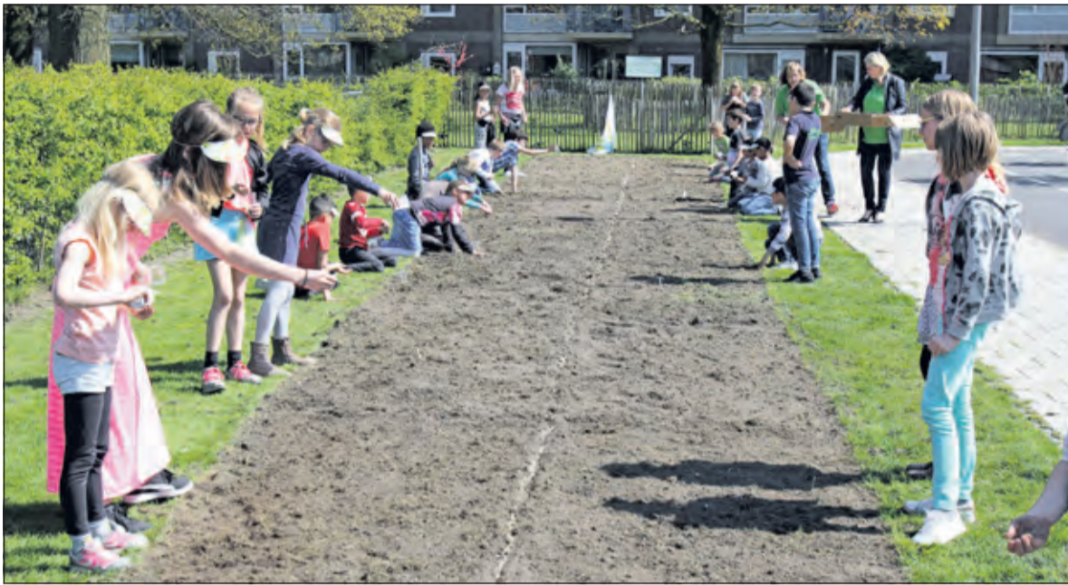
Donderdag 21 april zaaiden leerlingen van Wereldwijs de eerste veldbloemen in een berm achter de kinderboerderij in Bilthoven.