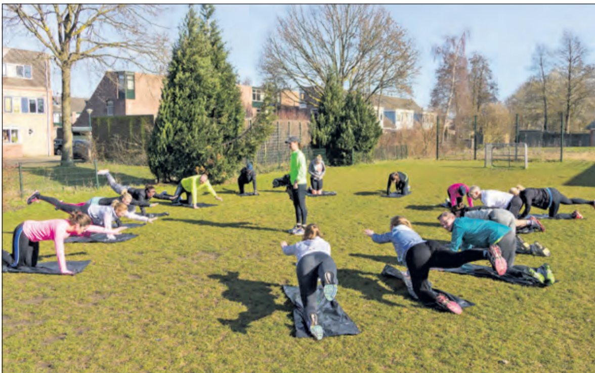
Training voor de 40ste polderloop op vrijdag 29 april om 18.30 uur in Westbroek.

Om in het jubileumjaar een extra groot deelnemersveld te creëren is in aanloop naar de polderloop een hardloopclinic georganiseerd. De belangstelling was zo groot dat