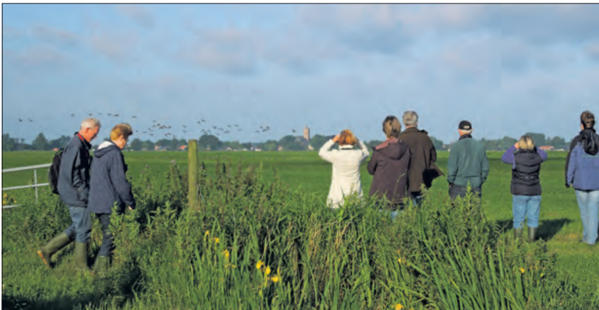
Vroege vogels spotten vroege vogels.