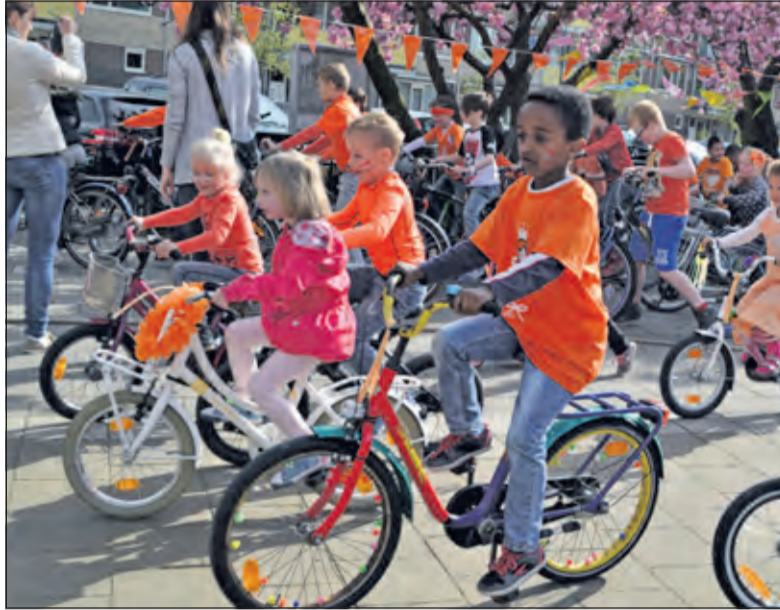
Start van de fietssponsortocht op de Rietakker.