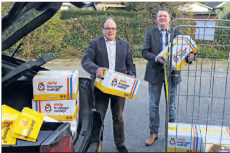
Men in totaal 45 pakketten in onze winkel ophalen.

bijt kunnen wij de leerlingen laten ervaren hoe leuk en gezond het is om samen te ontbijten om vervolgens lekker te bewegen', aldus Jelle Farenhorst.