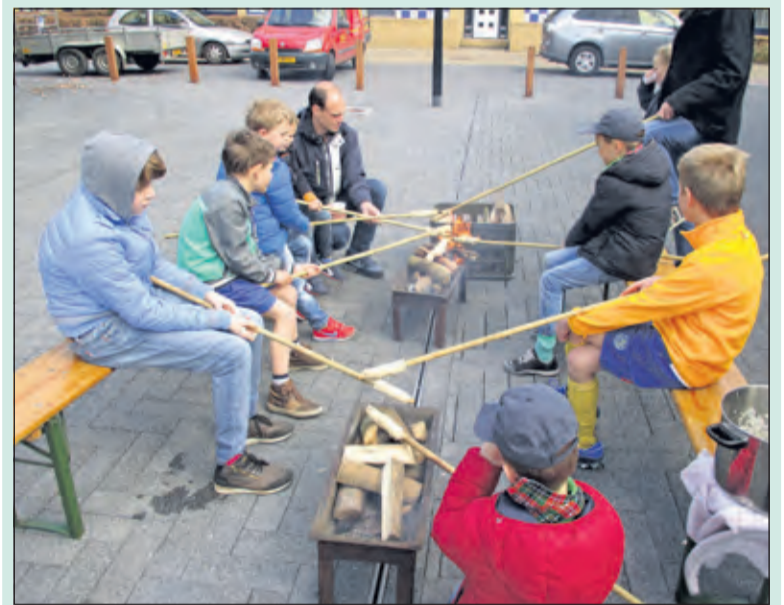
Broodjes bakken boven een vuurtje heeft grote aantrekkingskracht.