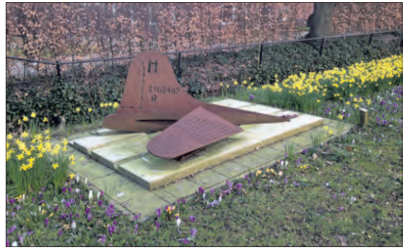
Herdenking in Groenekan vindt plaats bij het B17 monument.

De symbolische twee minuten stilte maakt altijd veel indruk. Niet alleen is het twee minuten stil op de radio en televisie, ook het openbaar vervoer komt tot stilstand. In veel openbare gelegenheden worden de activiteiten even stilgelegd of opgeschort tot na 20.15 uur. Veel mensen hechten zeer aan dit moment van stilte en bezinning. Eén persoon kan de stilte van honderden anderen verstoren.