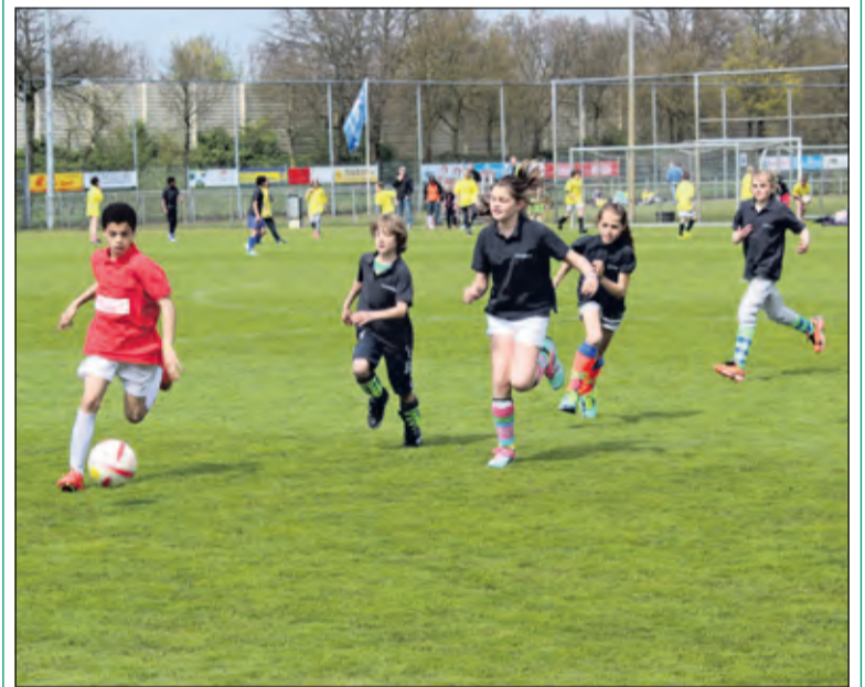
Speler van OBS de Kievit breekt door