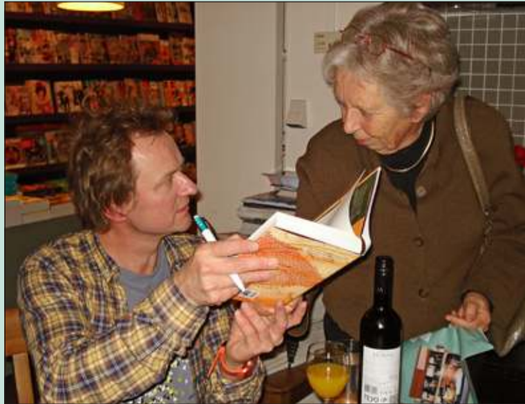
Eerder al schreef Westerman 'De Graanrepubliek', 'Ingenieurs van de ziel', 'El negro en ik', 'Ararat' en 'Dier, bovendien'.

Schrijver Frank Westerman was gefascineerd door dit Reutersbericht. Vijftientig jaar later ontrafelt hij in zijn boek 'Stikvallei' dit mysterie. Op 20 november was deze rasverteller te gast bij de Bilthovense Boekhandel. Zo'n tachtig aanwezigen luisterden ademloos naar zijn verhaal. Met drie verschillende blikken kijkt hij naar de daverende knal in het Kameroense meer en de giftige gassen: vanuit de ruziënde vulkanologen, vanuit de paters en vanuit het bijgeloof van de bewoners. Dat geeft een waaier aan verhalen. Frank Westerman: 'Ik wil de vorming van verhalen en mythes op de staart trappen.' Hij heeft een rijke bron aangeboord.