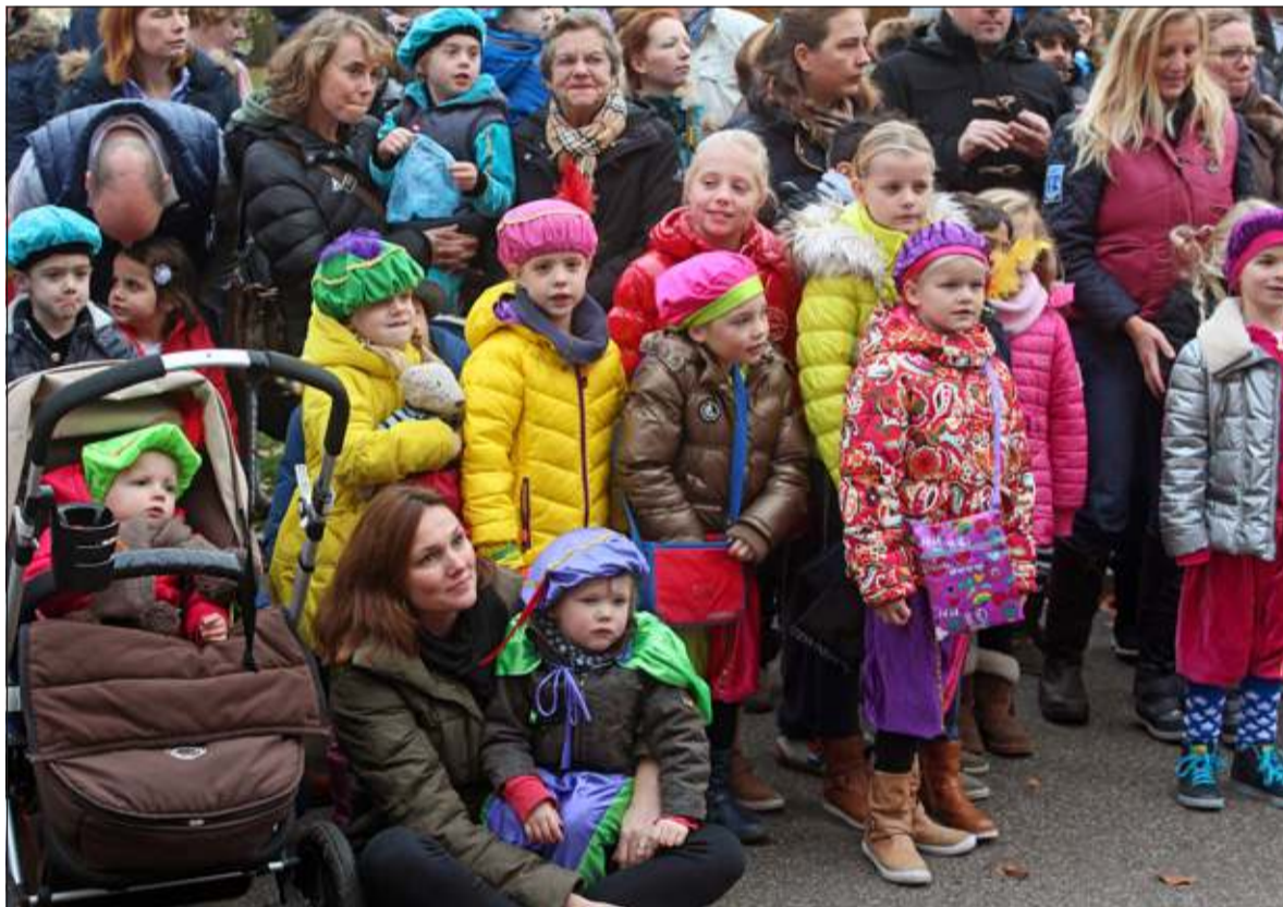
Gespannen en aandachtig wacht de kinderschare op wat er allemaal gaat gebeuren (op Jagtlust).