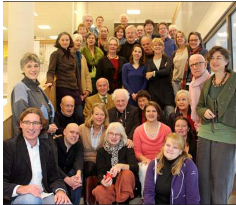
Ongeveer 35 Biltse schrijvers waren op 23 november bijeen op de schrijversmarkt tijdens de open dag van de bibliotheek op de nieuwe locatie in Het Lichtruim.