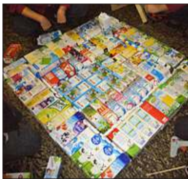
Het vlot in aanbouw.

het vlot in het water lag bleef het drijven en kon er één volwassen persoon op. De foto is van de bouw van het vlot, op het moment dat we er tape om heen hebben gedaan en een plaat om te voorkomen dat alle pakken los in het water terecht zouden komen. Dan kun je de pakken niet meer goed zien. Het was een leuke ervaring om met 'waardeloos' materiaal dit te maken. Het thema van die avond was de 'melkweg' (sterren kijken en info), dat was een leuke combi'.