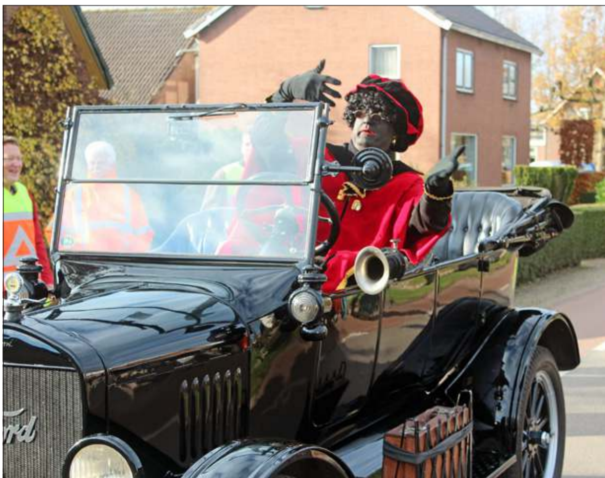
In Westbroek kwamen de Pieten zelfstandig in mooie oude auto's aangereden.