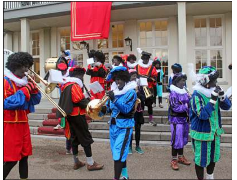
Bij de aankomst zaterdagochtend op Jagtlust zorgde een heus Pietenorkest voor de juiste stemming.