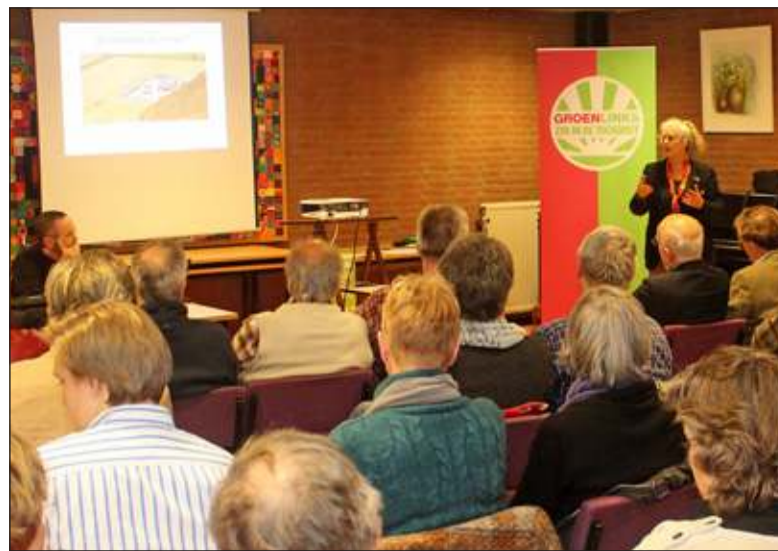
Er was grote belangstelling voor de bijeenkomst met als thema 'Schaliegas'.

De politiek zit niet stil. Minister Kamp heeft in september 2013 besloten eerst zelf onderzoek te doen naar mogelijke locaties voor proefboringen, in plaats van dit aan de gasindustrie over te laten. Dit gaat een jaar tot anderhalf jaar duren. Er is dus geen sprake van afstel van boringen naar schaliegas. Een onderzoek naar milieu en veiligheidsaspecten uit 2013 was niet overtuigend ten opzichte van de veiligheid van schaliegaswinning voor het milieu. De gemeenteraad van de Bilt is er nog niet uit. In Bilthoven Noord is een kleine plek waar schaliegas in de bodem kan worden aangetroffen. Mogelijk dat dit de gemeenteraad aanleiding gaat geven De Bilt tot een schaliegasvrije gemeente uit te roepen.