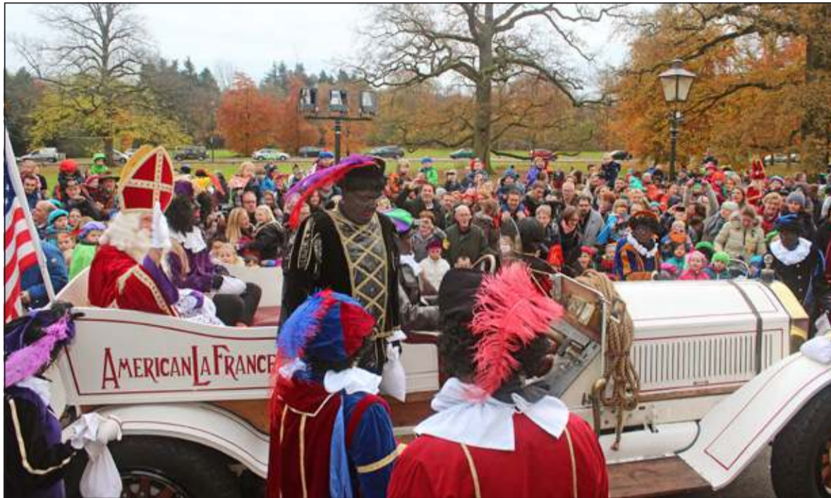
Terwijl op de Soestdijkseweg de auto's nog stapvoets rijden is de hoofdpersoon zelf op Jagtlust gearriveerd.

Sint Nicolaas werd jl. zaterdag in De Bilt en Bilthoven, Westbroek en Maartensdijk verwelkomt. De bevolking was massaal uitgelopen en de goedheiligman liet zich ook niet onbetuigd door ruim de tijd te nemen bij het bezoek aan respectievelijk Toutenburg en Dijkstate in Maartensdijk.