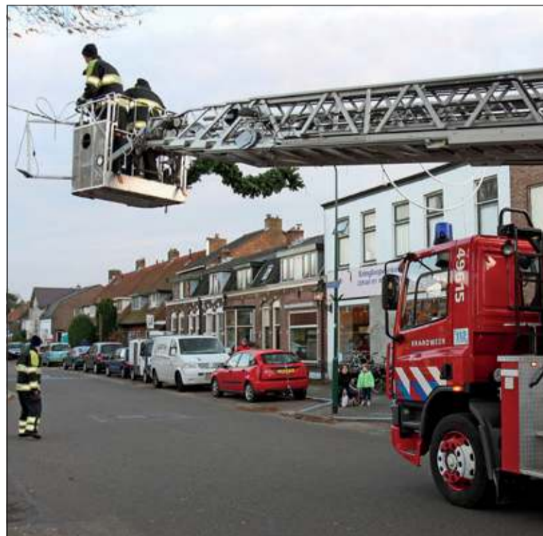
Op de Looydijk in De Bilt was zaterdag de verlichtingskabel boven de straat stuk gereden door een vrachtauto. De Biltse brandweer rukte uit om de beschadigde verlichting waar mogelijk te repareren.