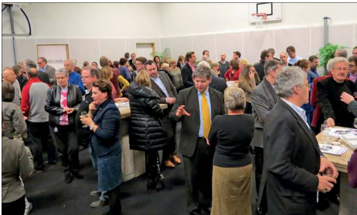
De genodigden in de als feestlokaal ingerichte sporthal.

De openingshandeling vond buiten plaats met een spectaculaire lichtshow.