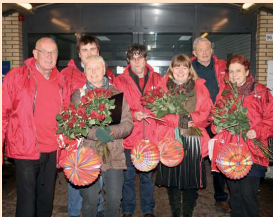
De PvdA voert het hele jaar door campagne, hier in Maartensdijk.

De bewoners zullen de PvdA tijdens de campagne vooral tegenkomen in buurten en wijken. Landelijke PvdA kopstukken hebben laten weten graag naar De Bilt te komen. 'Dat zal dus zeker gebeuren', aldus Slot. 'Bij de verkiezingen voor de Tweede Kamer in 2012 haalde de PvdA in De Bilt ruim twintig procent van de stemmen. We hebben de ambitie om daar weer net even boven te komen. Dat is belangrijk, want met vier of vijf zetels heb je veel meer mogelijkheden om je plannen waar te maken.' [GG]