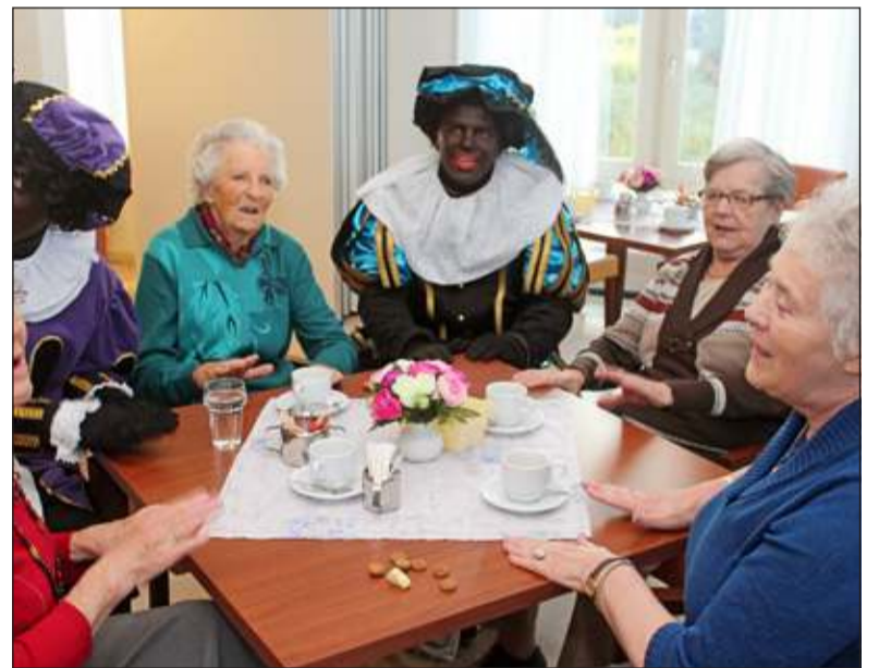
In Toutenburg in Maartensdijk vermaakten Pieten de aanwezigen met een cursus 'klappen op muziek'.