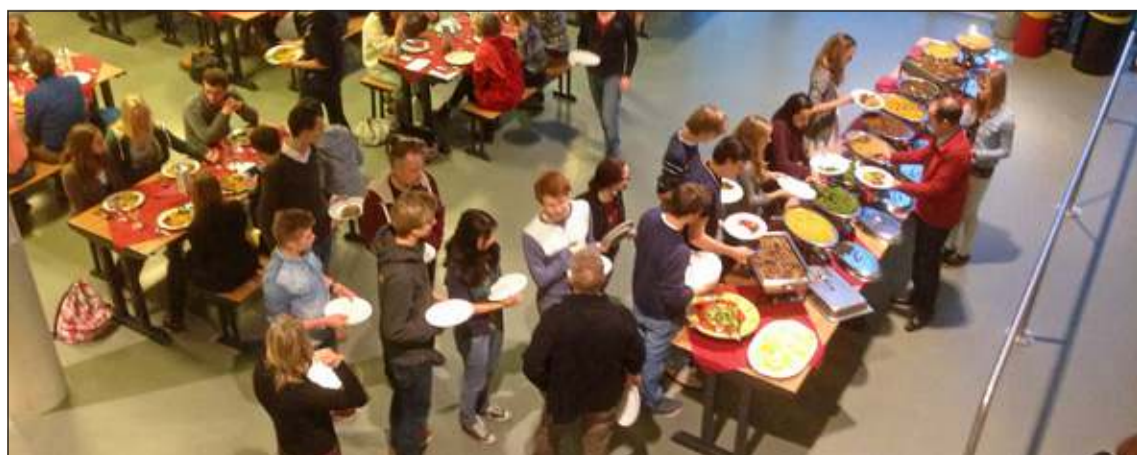
Tijdens het symposium was er ook tijd voor de inwendige mens.