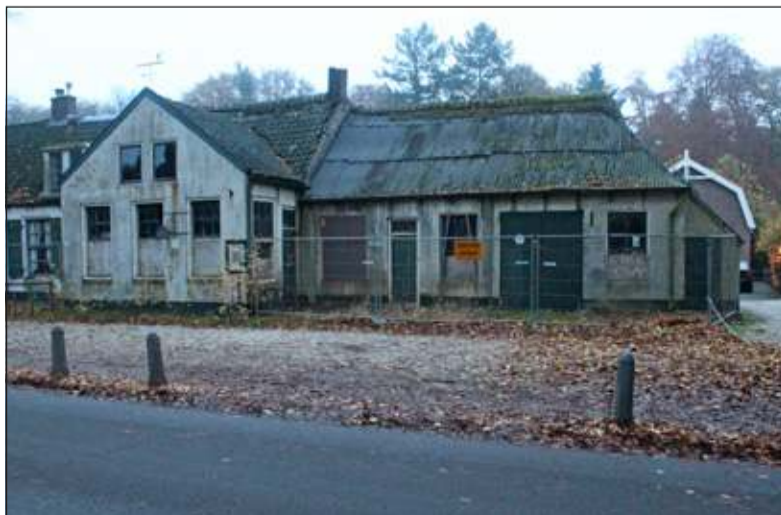
Niet te missen valt het op instorten staande monument aan de Dorpsstraat.