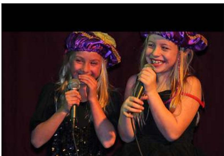
Sterren in de dop bij Nijepoort's got Talent.

de toegangskaartjes en de baropbrengst. Ook sponsors als Spot & Speaker BV, Bladt Onroerend Goed BV, Naast de Buren, Albert Heijn, Coop en Dirk vd Broek gaven gul. De Groene Daan werd geheel kosteloos ter beschikking gesteld en Firma van der Neut maakte een gulle gift over.