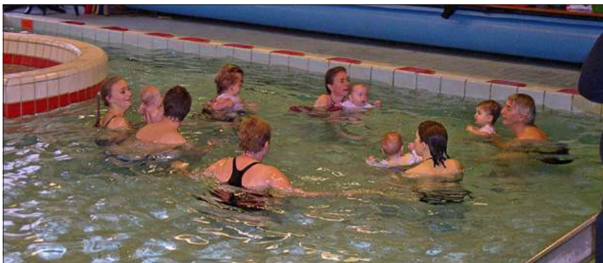
In het bijzijn van familie laten de peuters hun vorderingen zien en bevestigen dat ze niet bang zijn voor het water.

Na afloop was er nog vertier op de bubblebank, met de eendjes of balletjes en gleeed men van de glijbaan.