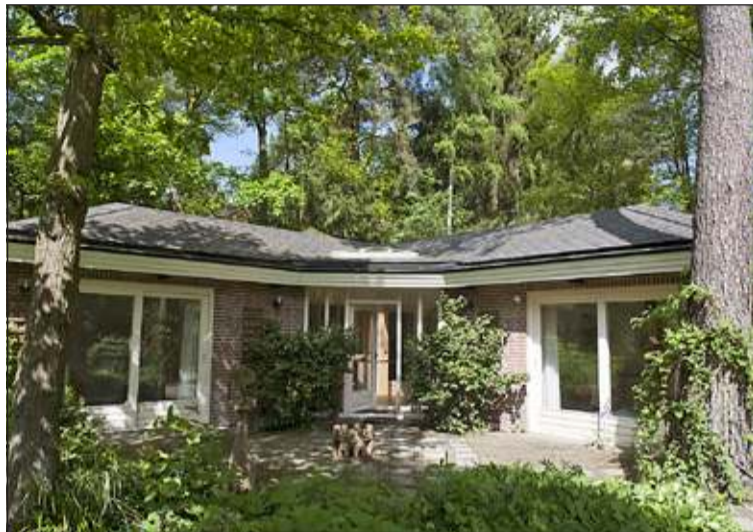
Gezondheidscentrum Botanica, Gerard Doulaan 25, 3723 GW Bilthoven, www.gezondheidscentrumbotanica.nl