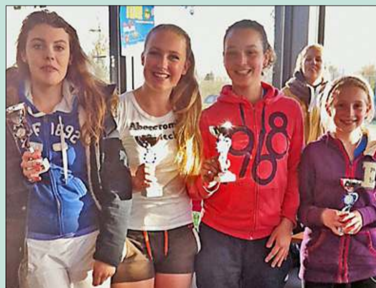
De winnende Maartensdijk/Hollandsche Rading-combinatie van de Meisjes dubbel t/m 14 jaar.

Onder prachtig lenteweer is de afgelopen tijd het Open Jeugd Tennis-toernooi van TV Tautenburg in Maartensdijk gespeeld. Naast veel jeugdleden van Tautenburg hadden heel veel verenigingen uit de regio deelnemers ingeschreven. Dat het niveau in Maartensdijk zeer goed is bleek uit het grote aantal finalisten van deze club. De jeugdige organisatie van het toernooi had het onder de bezielende leiding van een aantal ervaren krachten prima voor elkaar en mede door het prachtige weer werd het een mooi toernooi.