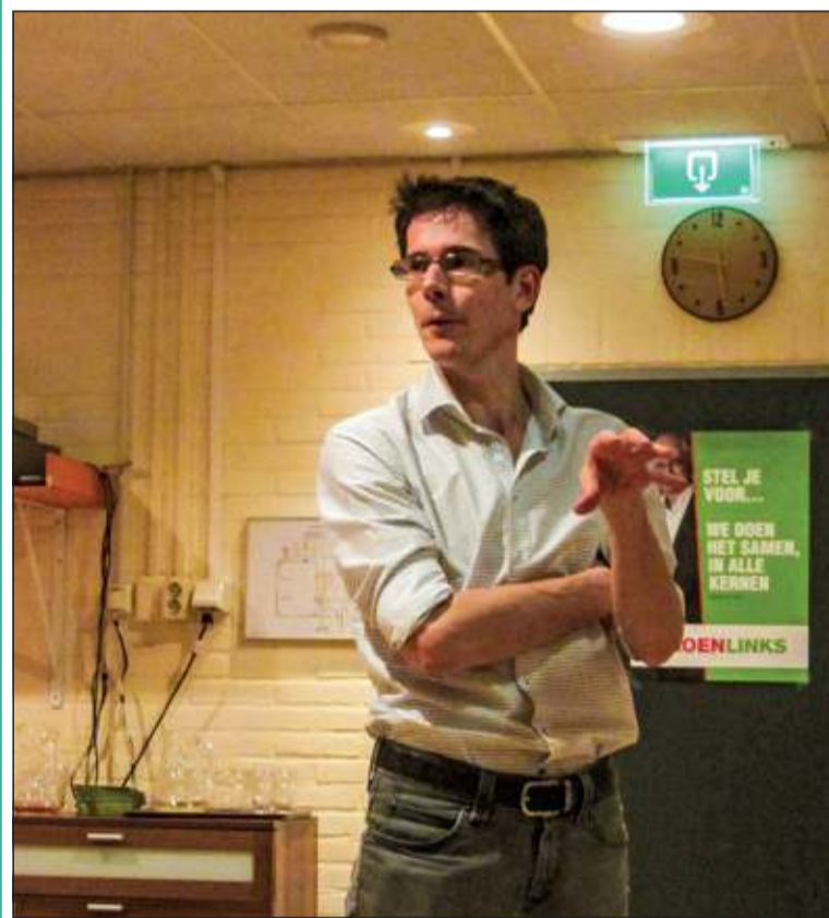
Bas Eickhout beantwoordde veel vragen van de bijna veertig bezoekers.