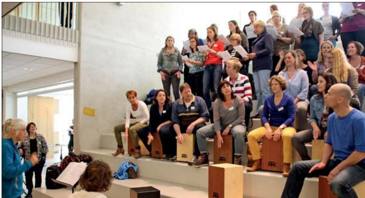
Deltamedewerkers in Het Lichtruim.

Ruim 2600 leerlingen krijgen onderwijs op de negen scholen van Stichting Delta De Bilt. De leerkrachten die dit verzorgen, stemmen hun werk steeds beter af. Dat gebeurt binnen de scholen, maar door de goede samenwerking tussen deze scholen gebeurt dit in toenemende mate tussen leerkrachten van meerdere scholen.