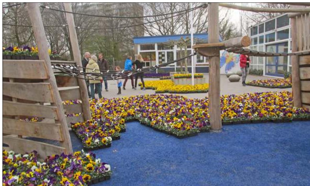
De geslaagde violenactie zorgde tijdelijk voor een fleurig tapijt bij school.

1.750 euro naar stichting Vrienden van het Wilhelmina Kinderziekenhuis WKZ gaat. De resterende 1.500 euro is bestemd voor nieuw buitenspel materiaal van de school.