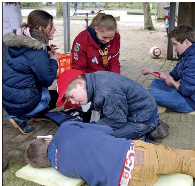
Oefenochtend Jeugd Rode Kruis en Agger Martinigroep.