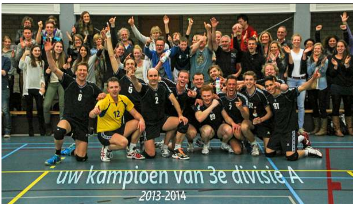
De kampioen van de 3de divisie A met de via social media opgetrommelde supporters

Hij zal het stokje nu gaan overdragen aan een andere trainer die verder aan de ontwikkeling van het team gaat werken om ook in de 2e divisie mee te kunnen spelen om de titel. Als speler zal hij een rol gaan vervullen in een lager team, waardoor er nu een vacature open staat voor een ambitieuze spelverdeler. (Wouter van Gilst)