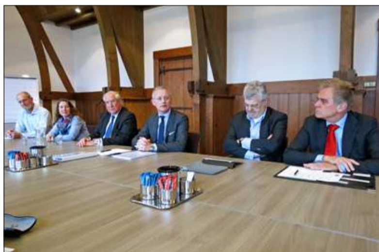
Het hoofdstembureau stelde op 21 maart de officiële uitslag vast.