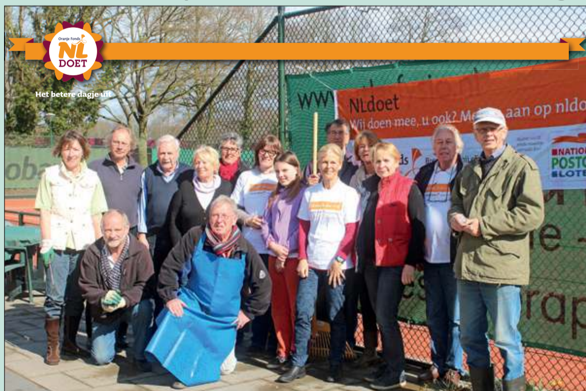
Tennisvereniging Hollandsche Rading doet al jaren mee aan NLdoet. Vrijwilligers en leden maakten zaterdag 22 maart in gezamenlijkheid alles klaar voor het zomerseizoen.