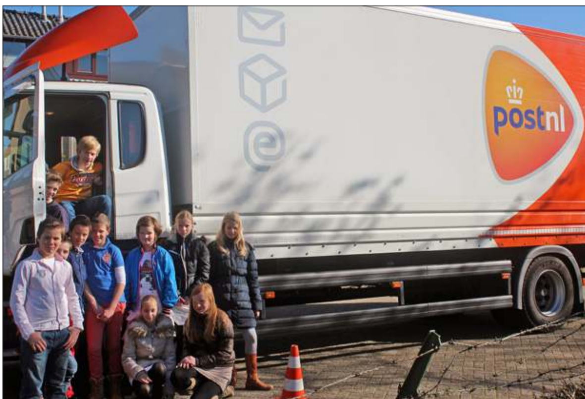
Omstreeks 9.00 uur begon VVN samen met logistiek dienstverlener DHL en postbedrijf Post NL aan deze les (binnen en buiten) met delen van de basisschoolgroepen 7 en 8.

schillende voorgestelde situaties naspelen. Voorafgaand aan deze lessenserie verzorgde de school zelf ook al een theorieles en een bijbehorende quiz. (Harry Prozman)