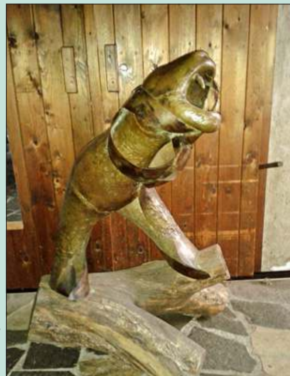
Zijn favoriete beeld 'De Leeuwenfiguur' waar zij zich mee vereenzelvigde.

Op 16 februari is Dré van Berkel in zijn atelier aan de Hessenweg overleden. De ziekte die hem al een groot aantal jaren niet meer los liet is hem te veel geworden. Een kleurrijk mens die door zijn bijzondere levensstijl, zijn kunstwerken en juwelen nog lang herinnerd zal worden