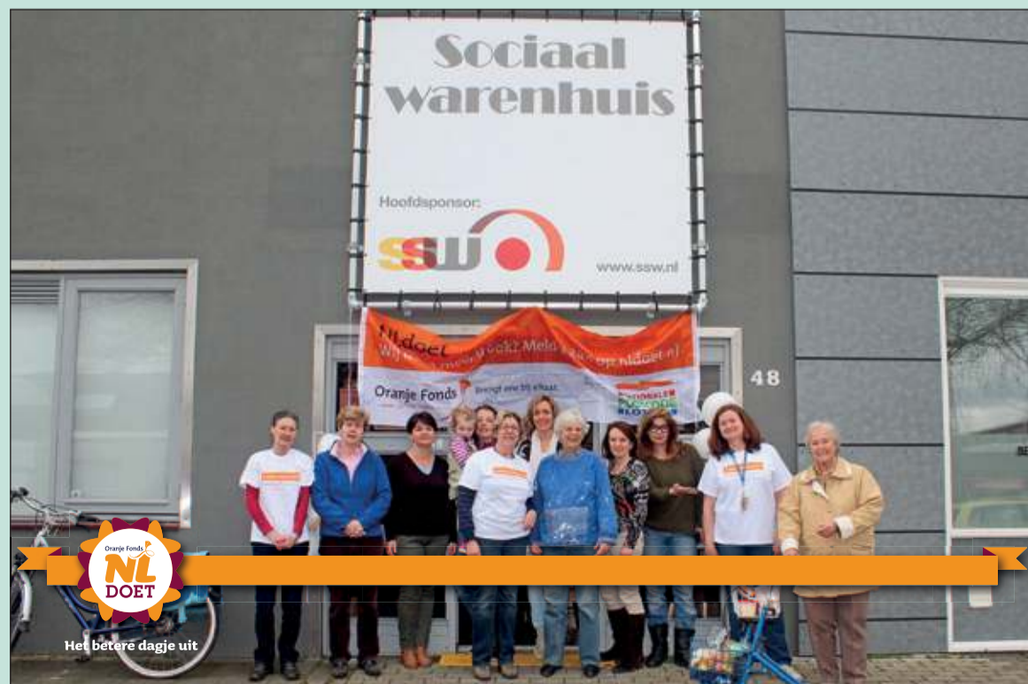
Voedselbank De Bilt meldde in het kader van NLdoet de klus 'Het moet schoon, het moet schoon' aan. Om de klus te klaren meldden zich totaal 15 vrijwilligers, waaronder leden van Ladies Circle, een serviceclub voor vrouwen tot 45 jaar. [HvdB]