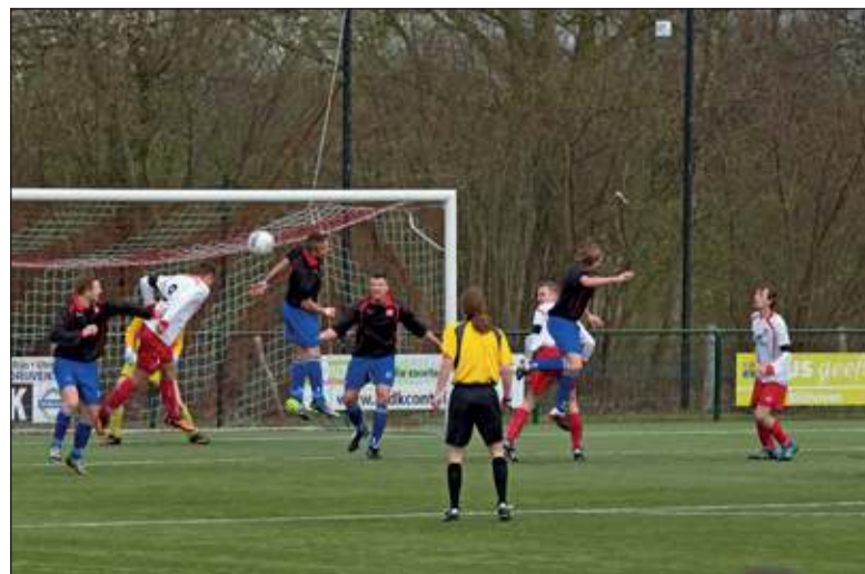
Elinkwijk speelde in de zwarte reservetenu van FC De Bilt.

Het talrijke publiek zag niet direct een mooie wedstrijd, maar heeft kunnen genieten van een spannende pot en van een team dat tegen een stootje kan. Toen later de resultaten van de andere wedstrijden uit 3D bekend werden bleek FC De Bilt de koppositie flink te hebben verstevigd. Het tweede won met 1-9 en kan volgende week thuis kampioen worden!