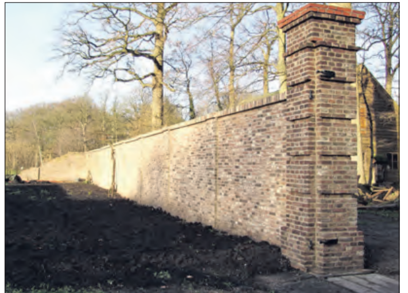
Eind 2006 was de tuinmuur compleet gerestaureerd.

Tuinder Luuk Schouten: 'Vroeger hadden bijna alle landgoederen een moestuin waarin groenten en fruit voor eigen gebruik en soms ook voor de verkoop werden geteeld. De moestuin van landhuis Eyckenstein lag oorspronkelijk achter het landhuis. In 1879 begon de toenmalig eigenaar van Eyckenstein, Willem Carel van Boetzelaer, met de verbouwing van het landhuis