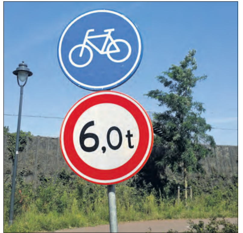
Welk zwaar verkeer valt er op het fietspad bij de Spoorlaan in Bilthoven te verwachten?

Indra stoort zich ook aan de vreemde en verwarrende fietsroutes: 'Op de Julianalaan eindigt het fietspad met een rare bocht. Zoek het verder maar zelf uit. En hoe kom je van de Nachtegaallaan bij de Kwinkelier?' Een belangrijke oorzaak van veel problemen ziet ze in het verkeerde beeld dat beleidsmakers hebben van de fietser. Die zien de fietser als een lichamelijk topfit persoon. Hij fietst toch immers...? 'Voor veel