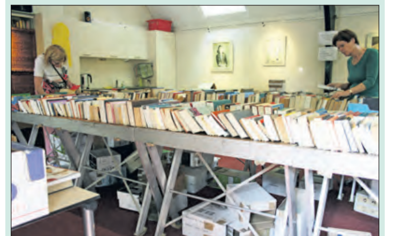
Ruim 2.000 boeken wachten op een nieuwe eigenaar.