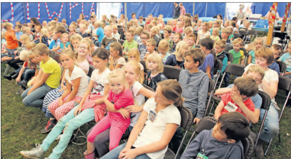
Het VakantieBijbelFeest in Westbroek kende dit jaar een recordaantal van plm. 150 deelnemers.