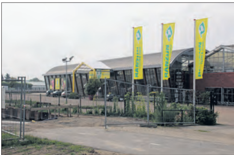
De vestiging van Ranzijn aan de Utrechtseweg houdt de gemoederen bezig.

De gemeente De Bilt gaf de volgende reactie op het advies van de Commissie: 'In algemene zin kan het college een advies van de bezwaarschriftencommissie, mits beargumenteerd, naast zich neerleggen. Het is dus geen bindend advies. De formele reactie van de gemeente is de zogenaamde Beslissing op bezwaar. Deze moet in dit geval nog door het college worden vastgesteld, dus daarover treden we nu inhoudelijk verder nog niet naar buiten.'