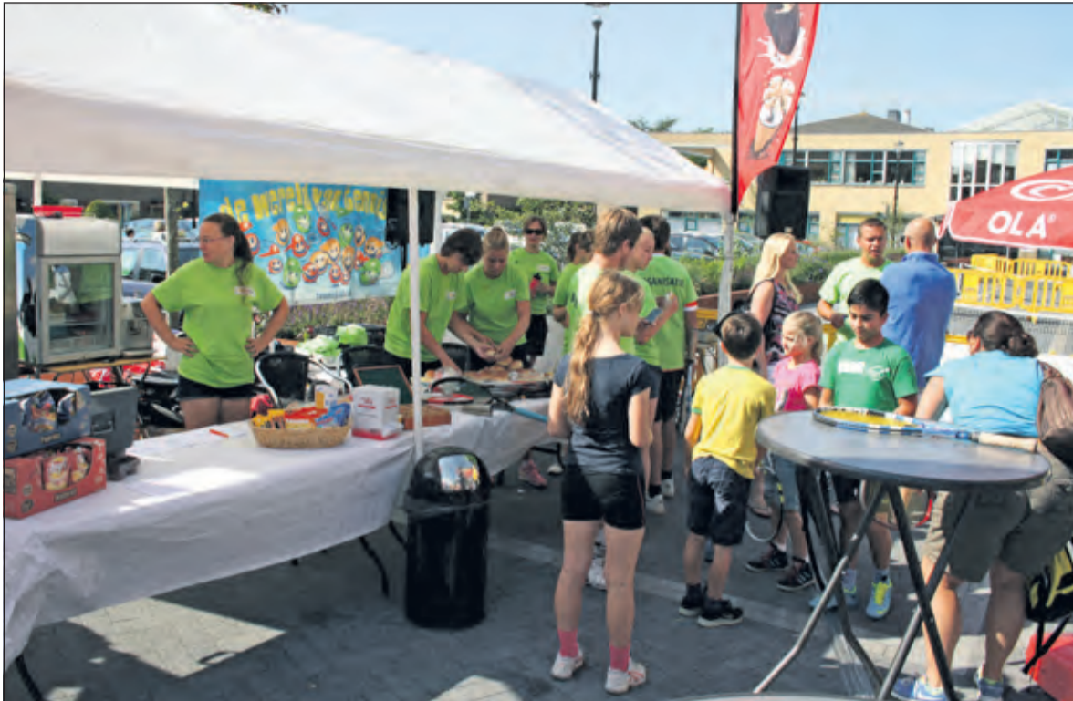
Drukte bij het aanmeldpunt.

Zaterdag 22 augustus organiseerde Tennisvereniging Tautenburg uit Maartensdijk een gezellig tennisevenement voor jongeren op het Maertensplein.