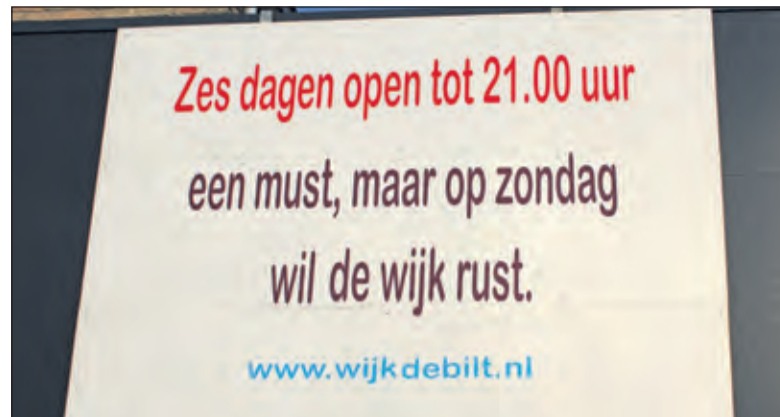
Duidelijk standpunt van de wijkbewoners tegenover de ingang van AH.