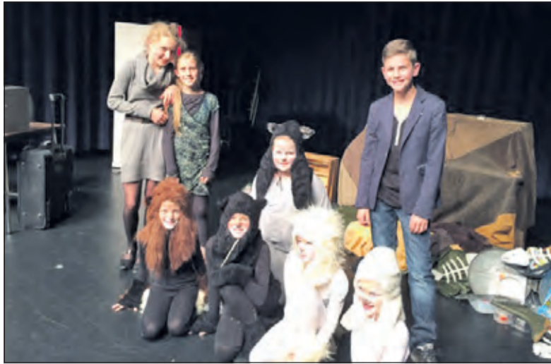
Afgelopen seizoen speelden de kinderen met veel plezier een bewerking van Minoes van Annie M.G. Schmidt.

De cursus bestaat uit twee delen. In het eerste deel wordt er gewerkt aan stemvorming: ademhaling, houding, eenvoudige zangoefeningen en samenzang. Daarnaast worden er spelopdrachten en improvisaties gedaan, waardoor de kinderen zich bewust worden van hoe ze zich op het toneel kunnen bewegen en hoe ze zich aan het publiek kunnen presenteren. In het tweede deel wordt er gewerkt worden aan een voorstelling, die in mei 2016 twee keer gespeeld zal worden. Dat kan een bestaand stuk zijn of een zelf ge-