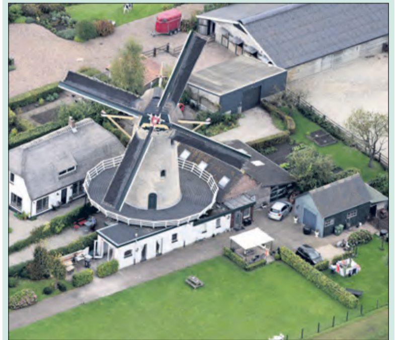
Molen Geesina is te bezichtigen tijdens open monumentendag.

Hoewel het geen monument is, is een bijzonder programmaonderdeel van de dag ook de rondleiding en bezichtiging van de historiserende renovatie van het Heemstrakwartier in De Bilt. Voor alle relevante informatie over de Open Monumentendag De Bilt 2015, waaronder het programma van de dag en de fietsroute, zie www.monumentendebilt.nl .