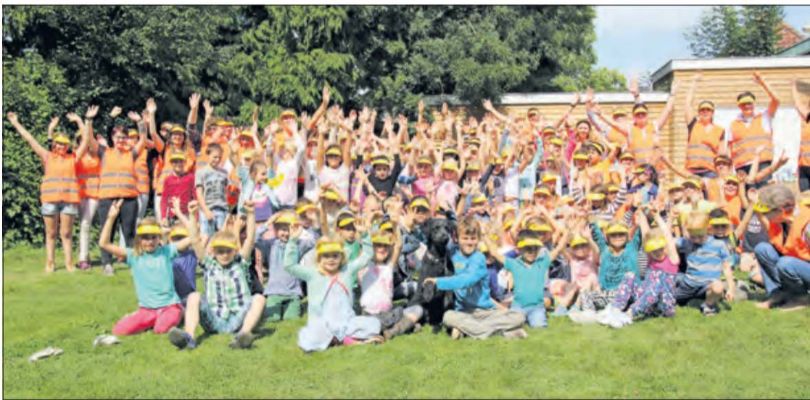
Ruim honderd kinderen beleefden twee superdagen tijdens het VakantieBijbelFeest bij de Hervormde Wijkgemeente Dorpskerk De Bilt.