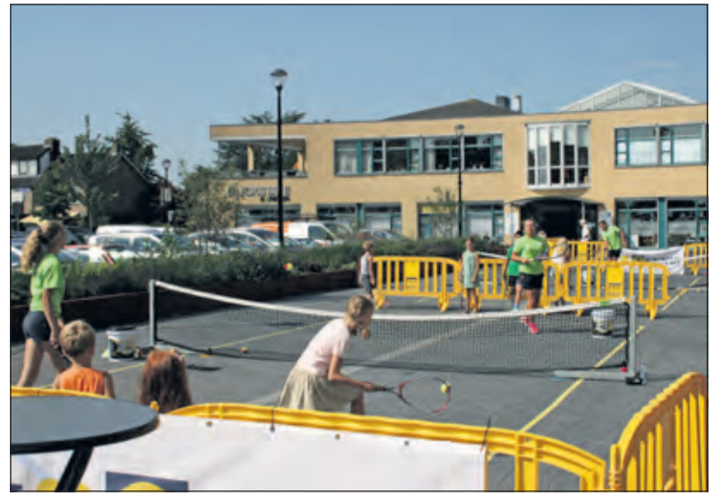
Onder begeleiding maken de kinderen kennis met tennis.

Natuurlijk zijn de clinics wel vaker georganiseerd door de tennisvereni-