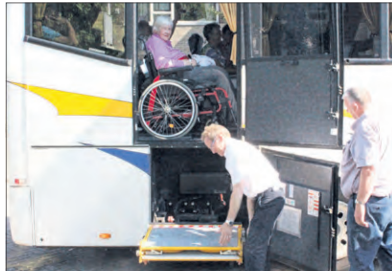
Zonder problemen met de rolstoel de bus in.

Om 10.00 uur vertrok een aantal gasten vanuit Toutenburg in Maartensdijk met de touringcar naar het