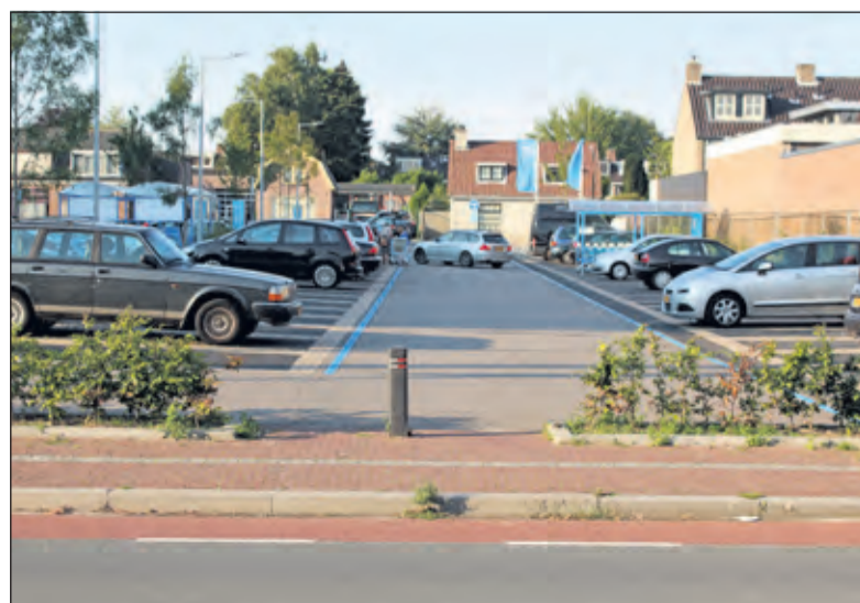
Er is ooit gedacht aan een tweede uitrit van het Herenplein richting de Looydijk.

Al in november 2013 sprak de gemeenteraad over de afwikkeling van het verkeer op de Herenweg. Met de komst van de nieuwe Albert Heijn, Hema en Gall & Gall zou