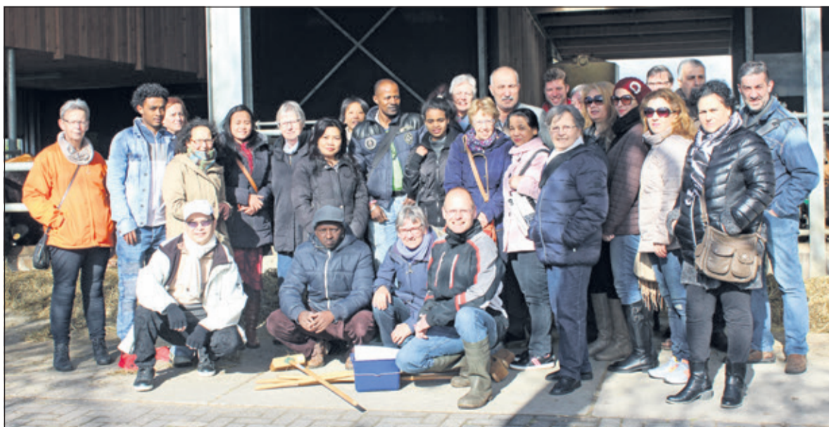
Om de woordenschat uit te breiden voor 'hun' deelnemers bracht Mens De Bilt dinsdag 18 april een bezoek aan zorgboerderij Nieuw Toutenburg in Maartensdijk zodat zij onze taal nog beter leren beheersen.

De groep deelnemers die Mens De Bilt begeleidt, bestaat uit 18 à 19 nationaliteiten. Zij komen niet alleen uit Syrië, Irak of Iran, maar ook uit China, Japan en allerlei Afrikaanse landen. 'Eén vrouw van 84 komt uit Duitsland, zij heeft daar nu geen familie meer en wil dus graag terug naar Nederland, en wij hebben ook nog iemand uit Bosnië, die is 'met de liefde meegekomen', zoals wij dat noemen. Zoals je ziet helpen wij dus niet alleen deelnemers uit het Midden-Oosten en Afrika, maar ook uit Europese landen als Bosnië en Duitsland'.