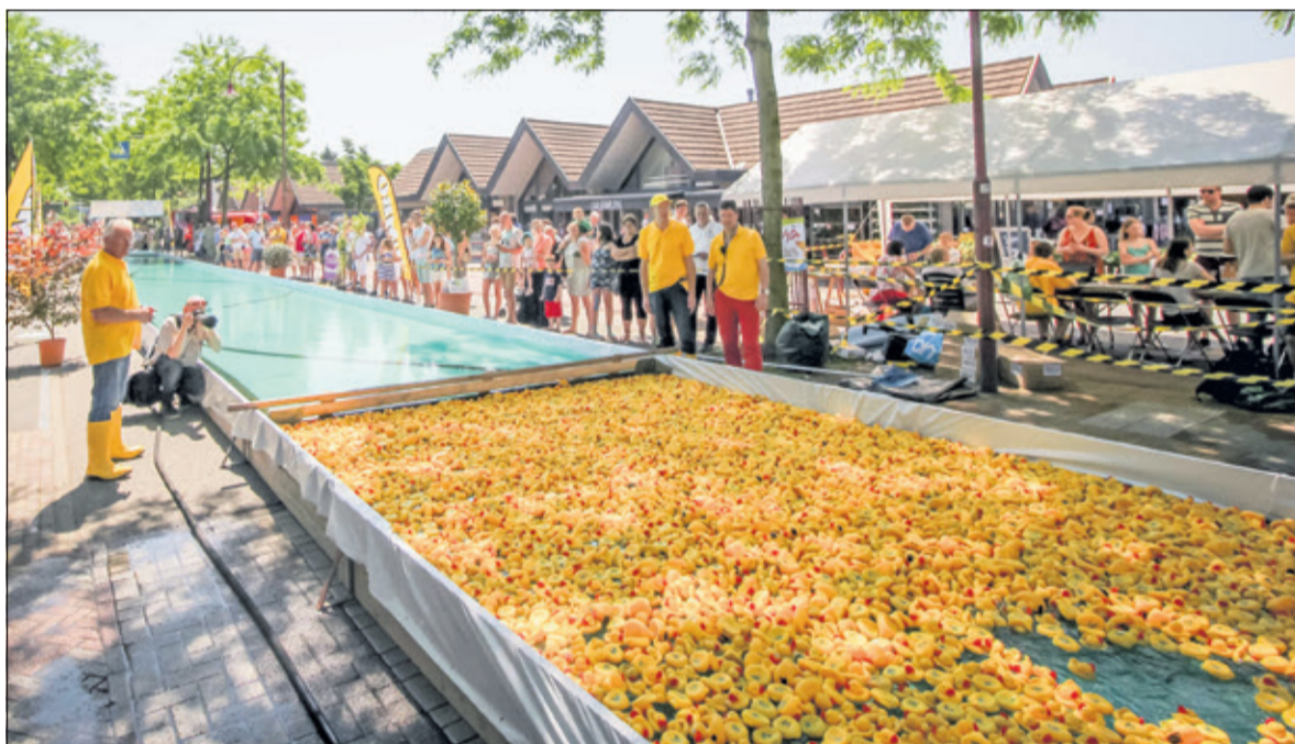
Op 1 juli zullen 4000 badeenden de strijd aanbinden in een 40 meter lang waterbassin op het Maartensplein in Maartensdijk.