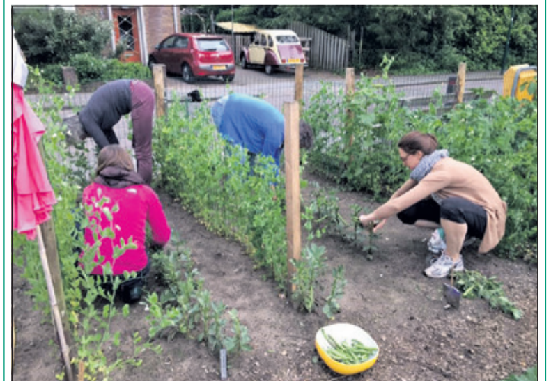
Bewoners aan het werk in de Moestuin De Raasdonders aan de Zephyrusweg in De Bilt.

Bloeit er in uw buurt ook iets moois? Neem contact op met: info@hallobuur.nl