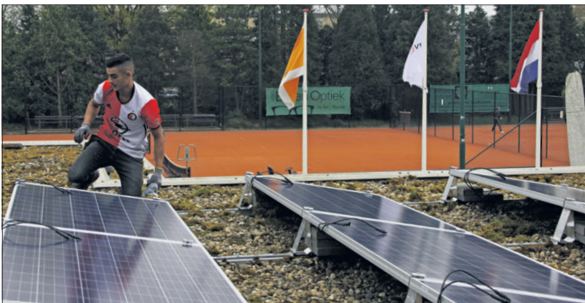
Op het dak van het clubgebouw zijn zonnepanelen geplaatst.