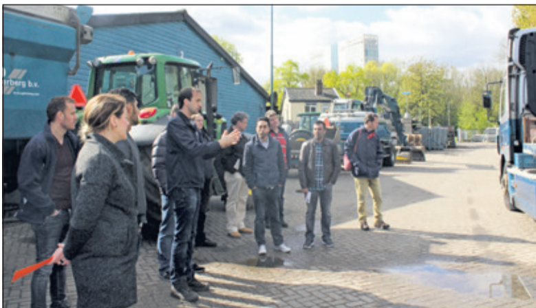
Bij het Biltse bedrijf Agterberg kreeg zaterdag een groep van 25 werkzoekenden de kans om kennis te maken met mogelijkheden die een werkgever hen kan bieden.

Door aansluiting bij 'De Bilt Verbindt' kunnen Biltse bedrijven en ondernemers deel uitmaken van een netwerk van maatschappelijk betrokken ondernemers die graag hun ervaringen delen. Werkgevers die mee willen doen kunnen hiervoor contact opnemen met Tanja Vis, accountmanager bedrijven van de gemeente De Bilt via t.vis@debilt.nl of 030 - 228 95 19, of Bibiana Drent van het Werkgeversservicepunt van de RSD via bibiana.drent@rsdkrh.nl of 06 13 21 75 72. Meer informatie is ook te vinden op http://debilt.nl/ondernemen/de-bilt-verbinding en www.wgspkrh.nl .