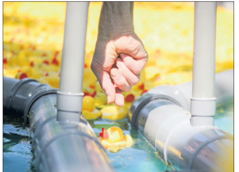
Elk half uur is er een spannende Lukkie Duck Race met winnaars van één van de vele mooie prijzen.

lot kopen en dit op www.lukkie-duckrace2017.nl activeren. Het lot wordt dan gekoppeld aan een raceeend. Pas dan race je mee met je eigen Lukkie Duck. Per lot krijg je er een gratis badeendje bij. Er zijn zes verschillende soorten badeendjes zodat je voor een setje kunt sparen. Wie een lot heeft gekocht, maakt kans op onder meer een e-bike ter waarde van 1750,- euro, gesponsord door de Rabobank en voor een aanzienlijk deel aangeboden door Bikeshop Loosdrecht, 25 boodschappenpakketten, elk ter waarde van 25,- euro en beschikbaar gesteld door de Jumbo in Maartensdijk, en twee volgroeide bomen, ter beschikking gesteld door Copijn uit Groenekan.