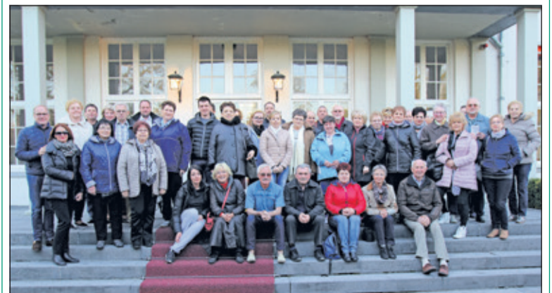
De Poolse gasten samen met Stichting Razem op het bordes van Jagtlust.

Joke vervolgt: 'Donderdag, Koningsdag, gaat de groep wandelen over de Hessenweg in De Bilt, waar de kindervrijmarkt is en de KBH en de Brandweharmonie hun muzikale rondgang doen. Daarna bezoeken we het feest bij Jagtlust met de spelletjes en het Oranjeconcours. Er is ons vrij entree en een parkeerplek voor de bus aangeboden. Vrijdagochtend nemen we al weer afscheid van onze gasten'.