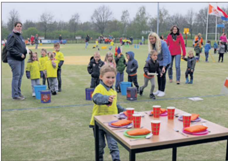
Tafeldekken voor de Koning op de velden van TZ.

Vrijdag 21 april waren er in Maartensdijk op de korfbalvelden van Tweemaal Zes de Koningsspelen. Dit jaarlijks terugkerend festijn is er voor de alle basisschoolkinderen door het hele land.