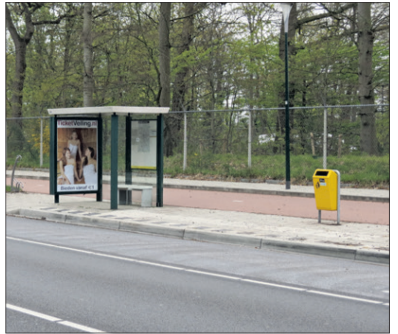
De bushalte metabri en invoegstrook nabij het RIVM die de raad bij het gemeentehuis niet wil.

De wethouder stelt dat op toekomstige verkeersstromen wordt geanticipeerd door nu maatregelen voor te stellen waarbij de life science-as een rol speelt. Hij geeft aan dat hij de amendementen van de SP eerder als onuitvoerbaar heeft bestempeld. De wethouder zegt deze amendementen mee terug te nemen naar het college en dat hij terugkomt naar de raad met wat het college besluit. Hij sluit niet uit dat hij blijft bij de conclusie dat het onuitvoerbaar is.