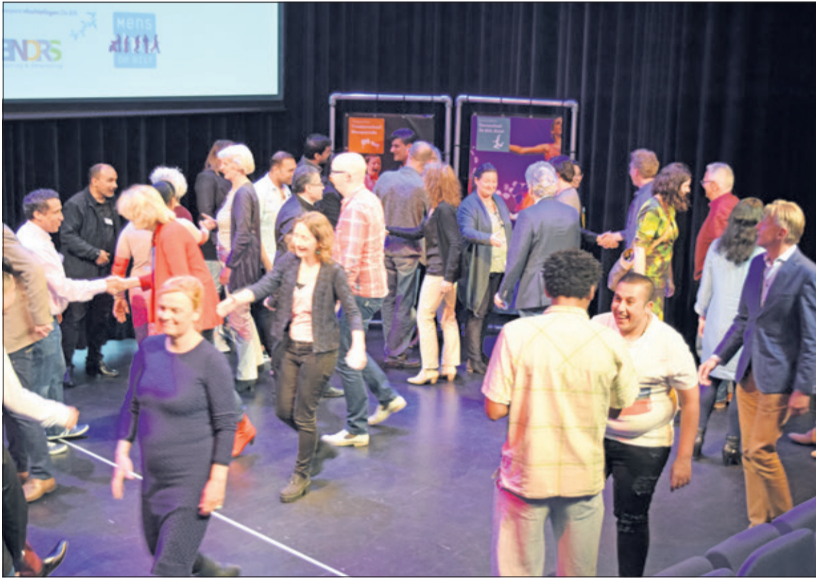
Alle betrokkenen maken kennis met elkaar.

Donderdag 20 april organiseerde WeMatch in het Lichtruim in Bilthoven een speeddate voor statushouders (voormalig vluchtelingen) binnen gemeente De Bilt. Doel van de speeddates was om hen te matchen aan een bedrijf en aan de slag te kunnen. Gedurende tien weken werden zij voorbereid op een gesprek met diverse Biltse bedrijven.