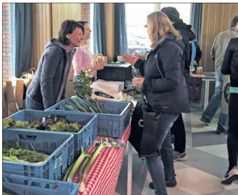
Boeren en Buren ontmoeten elkaar in Hollandsche Rading.

De opening op 21 april was geslaagd. Veel Buren kwamen langs om hun bestelling op te halen en een praatje met de Boeren te maken. Ook Buren, die deze keer geen bestelling hadden gedaan kwamen een kijkje nemen en waren erg enthousiast. De boeren hebben het ook enorm naar hun zin gehad. Naast de voordelen voor de duurzaamheid en bewustwording over voedsel, biedt de Buurderij sinds lange tijd weer de mogelijkheid boodschappen te doen in het eigen dorp; in dit geval Hollandsche Rading. Al jaren zijn er geen winkels meer in Hollandsche Rading, waardoor de bewoners altijd het dorp moeten verlaten om boodschappen te doen. Inschrijven voor Boeren & Buren kost niets en is geheel vrijblijvend.