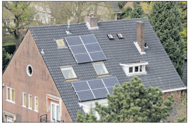
Zonnepanelen gaan helpen de doelstelling te bereiken.