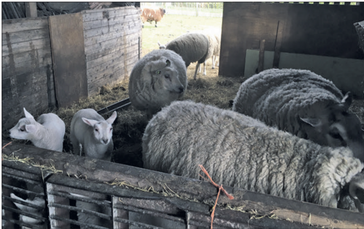
Op de lentemarkt valt er uiteraard jongvee te bewonderen.

lijke beperking of psychische problemen, waarbij huiselijkheid en gezelligheid voorop staan. De zorgboerderij richt zich vooral op groenteteelt, teelt van zacht fruit en veehouderij. De cliënten van de zorgboerderij bakken echte 'kniepertjes' (zoete, dunne wafel). Ook worden er o.a. verse roombroodjes verkocht en zijn er broodjes