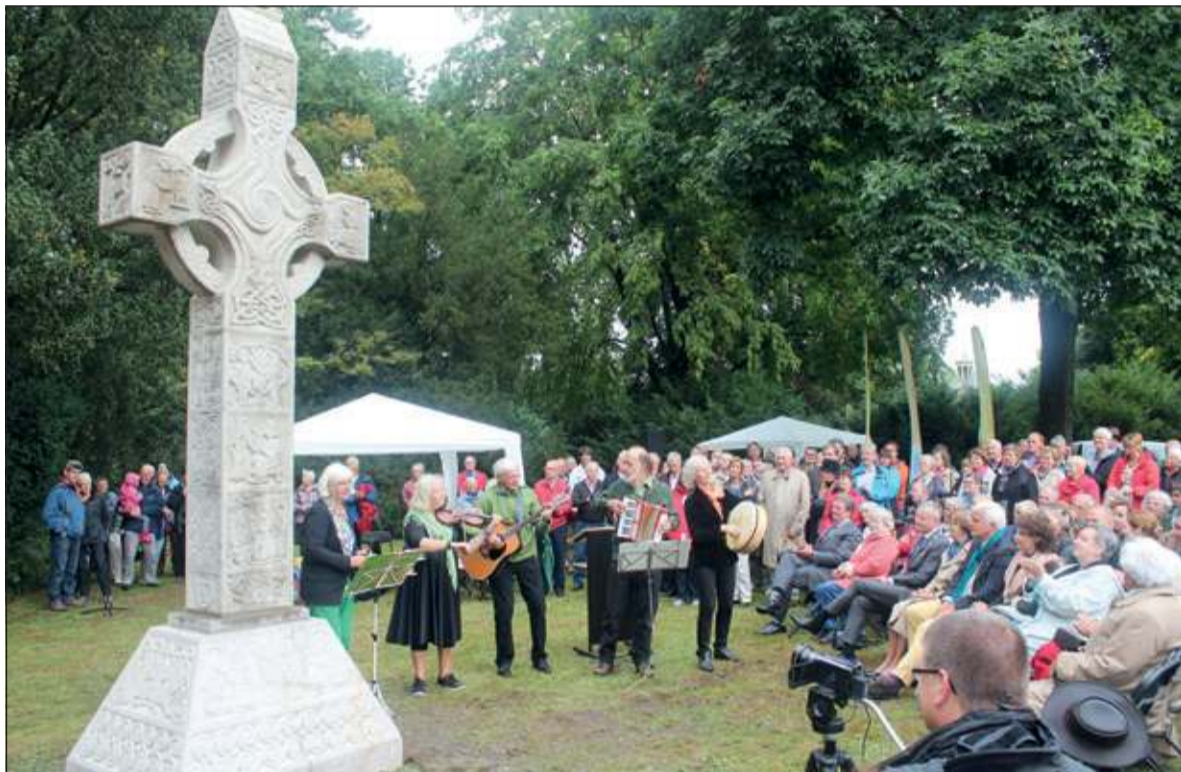
Het kruis is onthuld en dan is er muziek. De Bilthovense folkband Fiddler's Green zorgde met vrolijke folksongs voor een 'Iers sfeertje' rond de onthulling.