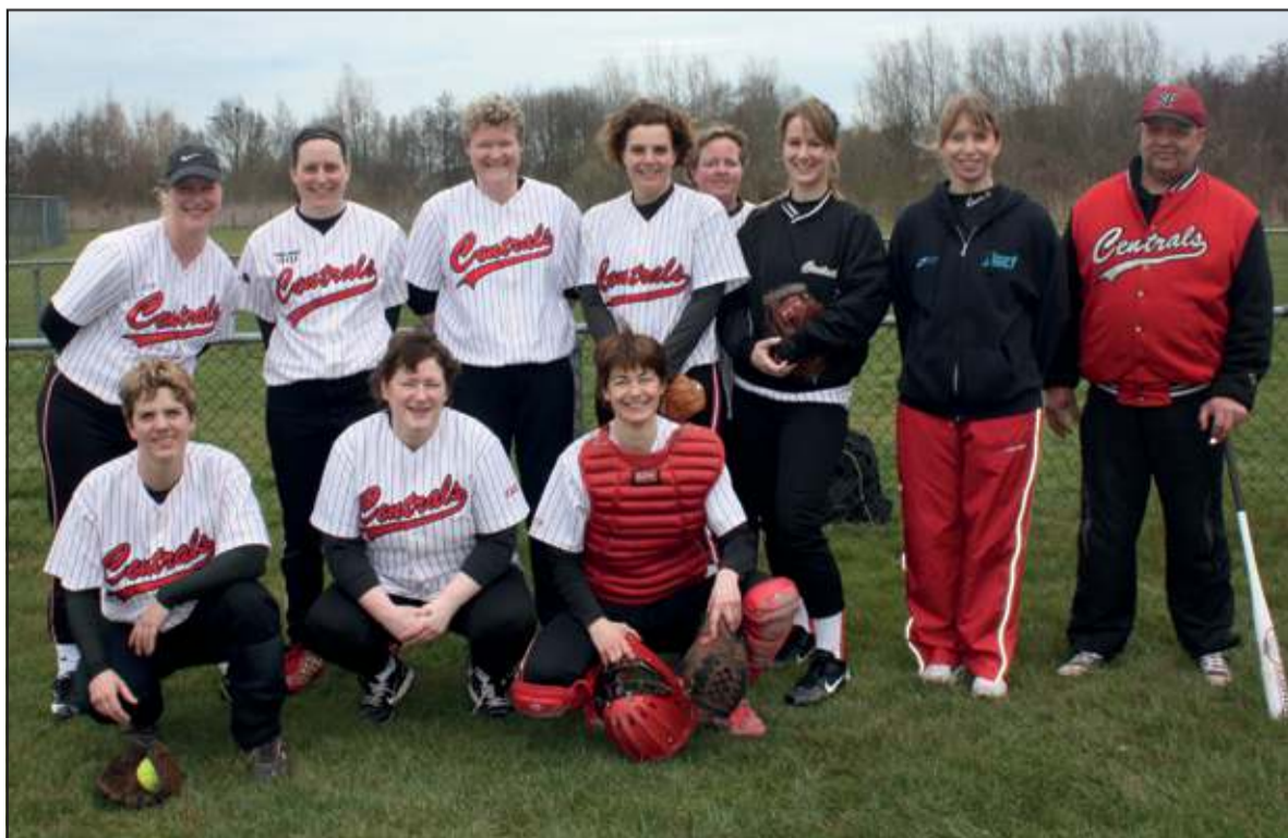
Het 3e damesteam van Centrals.