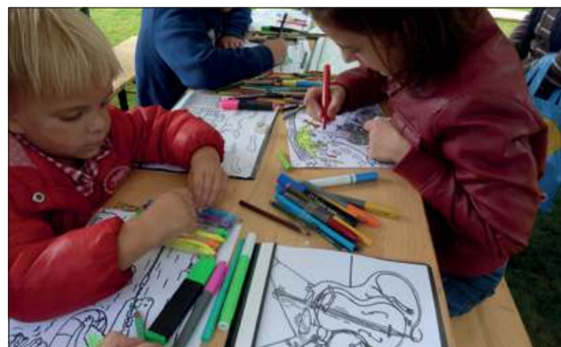
Kleuren met Kleurplaten Koos.

De volledige opbrengst gaat zoals gebruikelijk naar een goed doel. Dit jaar ontvangen Hillcrest Aidscenter Trust in Zuid-Afrika en het Morgenster Ziekenhuis (aidsremmers) in Zimbabwe elk een bedrag van 9.500 euro uit De Bilt.