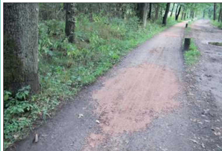
Er is geen geld beschikbaar voor gehele vernieuwing van deze paden dus wordt er 'globaal' hersteld.

In opdracht van het recreatieschap De Stichtse Groenlanden werd begin juli met het onderhoud gestart aan de paden langs o.a. de Eikensteeg, de Karnemelksweg en het Loosdrechts Spoor. Toen werd bestaande verharding gefreesd en daarna geëgaliseerd. Vervolgens werd er op de Eikensteeg een nieuwe laag aangebracht van Grauwacke; een zandsteenvariant, die uit diverse mineralen bestaat. Grauwacke split heeft een prachtige bruingrijs genuanceerde kleur met rode en gele tinten. Deze week werd er nog enige ruimte gevonden de werkzaamheden te vervolgen en af te ronden. Nu betrof het de Karnemelksweg en het Loosdrechts Spoor. [HvdB]