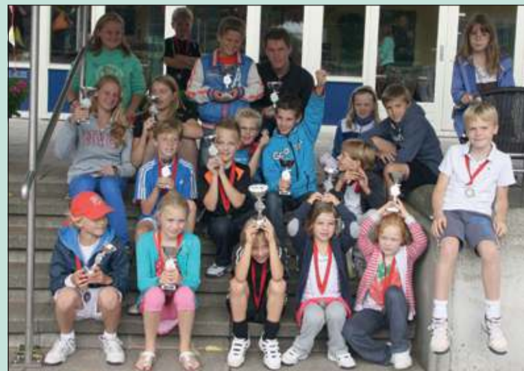
Clubkampioenen Jeugd 2013.

De Clubkampioenschappen Jeugd bij TV FAK zijn weer voorbij. In een week waarin het weer niet altijd meezat, werd er toch weer enthousiast en goed door de jongere en oudere jeugd getennist.