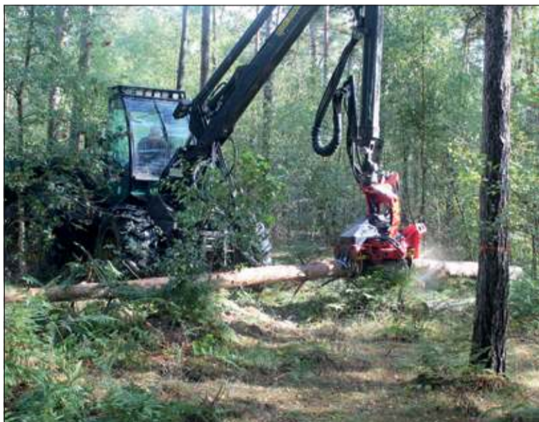
Met grote machines wordt een aantal bomen geveld om meer daglicht door te laten.

Verspreid door het gebied is ook een aantal plekken met lint afgezet. Daarmee worden bijzondere na-