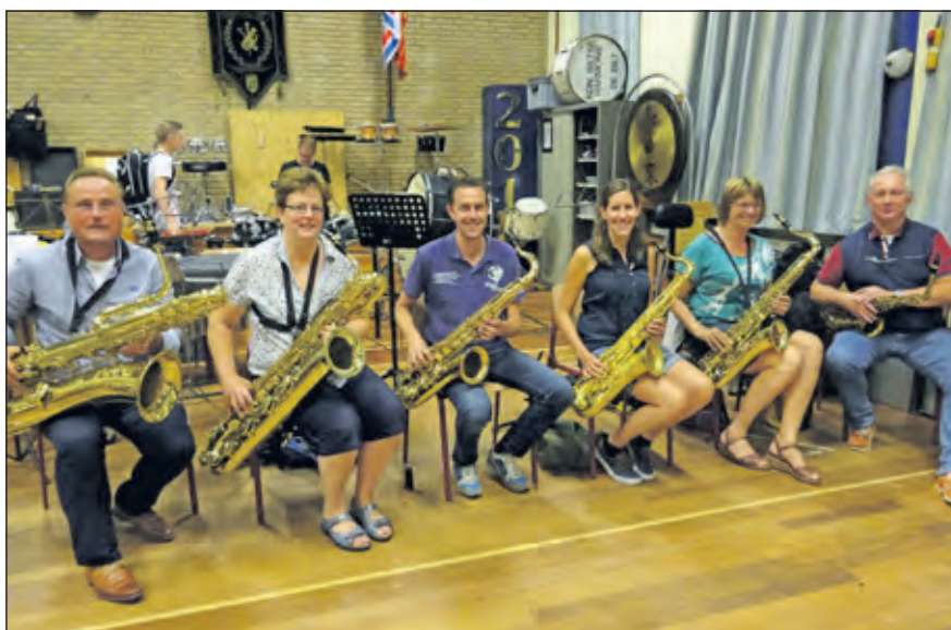
Enkele saxofonisten van het ensemble van de KBH.

te bestellen via de ticketservice van het theater het Lichtruim.