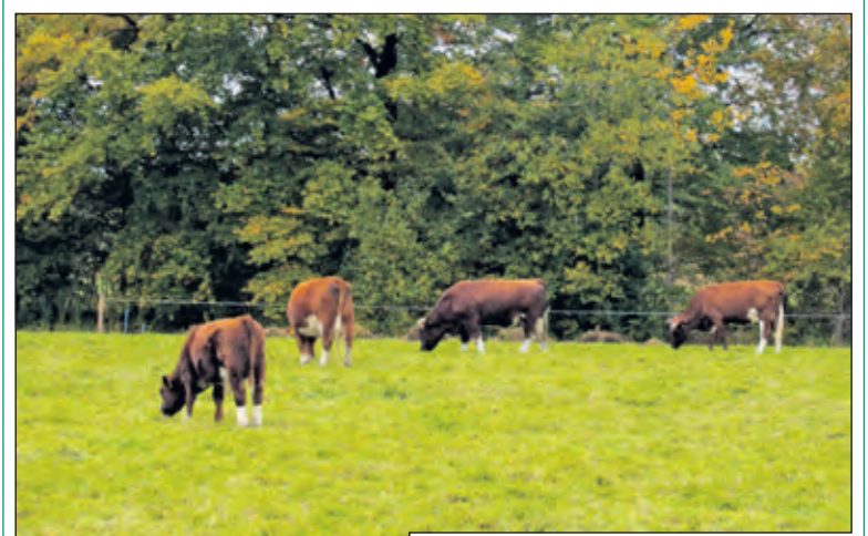
De brandrode runderen op Sandwijken verhogen de herfst sfeer.

Op zondag 30 oktober organiseert de Werkgroep Sandwijken samen met Het Utrechts Landschap een rondleiding over het landgoed Sandwijken. Op het landgoed staan veel boomsoorten met ieder hun eigen herfstkleur. Grote kans dus dat er op 30 oktober een rijk palet aan kleuren te zien is. De wandeling begint om 14.00 uur (wintertijd!) en duurt ongeveer twee uur. Het verzamelpunt is de parkeerplaats op Sandwijken: aan de Utrechtseweg 301, recht tegenover het Van Boetzelaerpark. Als het vochtig weer is, zijn laarzen of hoge schoenen nodig. De rondleiding is gratis. Honden zijn (ook aangelijnd) niet toegestaan op Sandwijken.