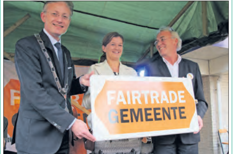
In 2011 kreeg gemeente De Bilt het predicaat Fairtradegemeente.

In Het Lichtruim wordt zaterdag 5 november het eerste lustrum van De Bilt Fairtrade gevierd. In 2000 begon in Nederland de campagne om gemeenten te stimuleren Fairtrade te worden. In 2011 ontving De Bilt de titel Fairtrade Gemeente, wat samenviel met het tienjarig bestaan van Wereldwinkel De Bilt, een belangrijke partner van de Fairtrade Werkgroep.