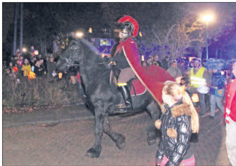
Sint Maarten gaat te paard evenals in 2015 weer voorop.

door om aan te bellen bij de huizen, liedjes te zingen en snoep te verzamelen.