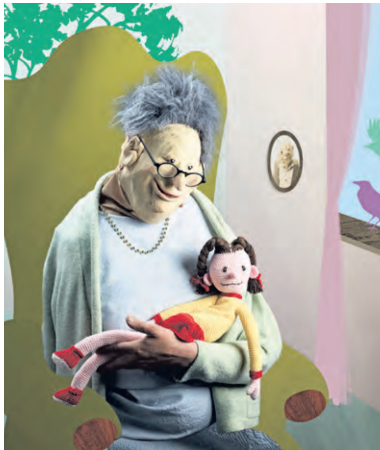
foto Erik Franssen (winnaar van de Nikon Theaterfotografieprijs 2016 met zijn fotoreeks van Oma, mag ik mijn pop terug)

Er is een beperkt aantal gratis combikaarten beschikbaar (één kind met één vader, moeder, opa of oma) voor lezers van De Vierklank. Stuur een mail naar info@vierklank.nl om hier kans op te maken.