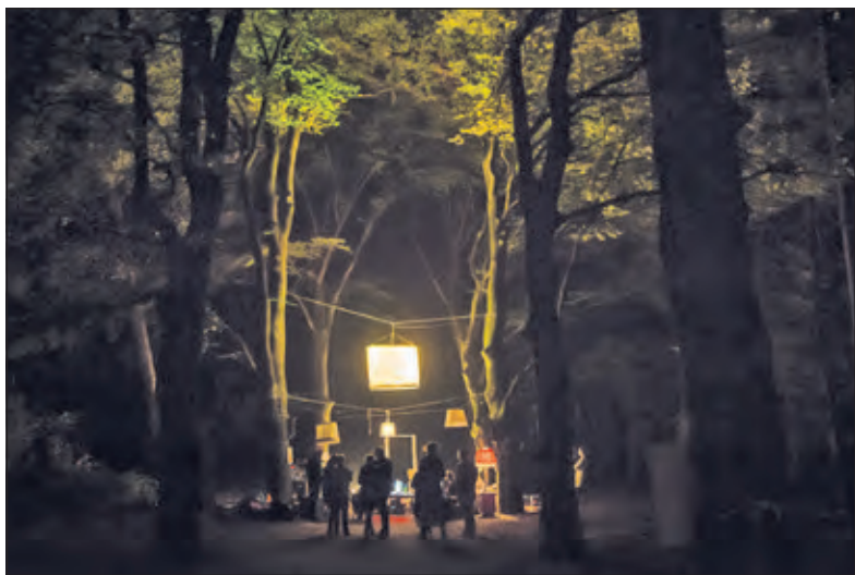
Licht in de duisternis tijdens de Nacht van de Nacht.

Ook voor dieren en planten is het belangrijk dat de nachten duister blijven. Een overdaad aan licht verstoort het bioritme van allerlei organismen en kan een heel ecosysteem ontwrichten. Om de schoonheid van de nacht te benadrukken en aandacht te vragen voor de gevolgen van lichthinder, organiseren de Natuur- en Milieufederaties jaarlijks de Nacht van de Nacht.