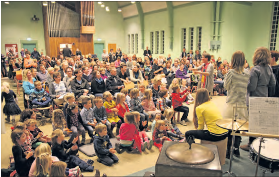
Aan het einde van het concert doen alle bezoekers mee met het muzikale feest.