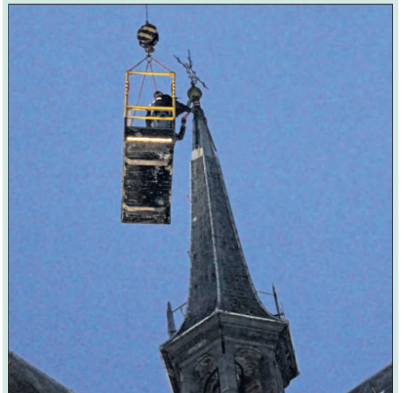
De torenschaan wordt van zijn stekkie verwijderd.

Vroeger was het onderhoud van de kerktoren een gemeentelijke aangelegenheid, maar de gemeente Baarn heeft dit overgedragen aan de hervormde gemeente. Het restaureren gaat in totaal 16.000 euro kosten en voor de kerkelijke gemeente is dit een (te) groot bedrag. Daarom wordt – met name aan de inwoners van Lage Vuursche – maar ook aan hen van 'buiten' gevraagd om een gift. Bij de hervormde gemeente informeert men u graag hoe u deze restauratiegift daarvoor kunt afdragen. Voor ieder bedrag is men dankbaar.