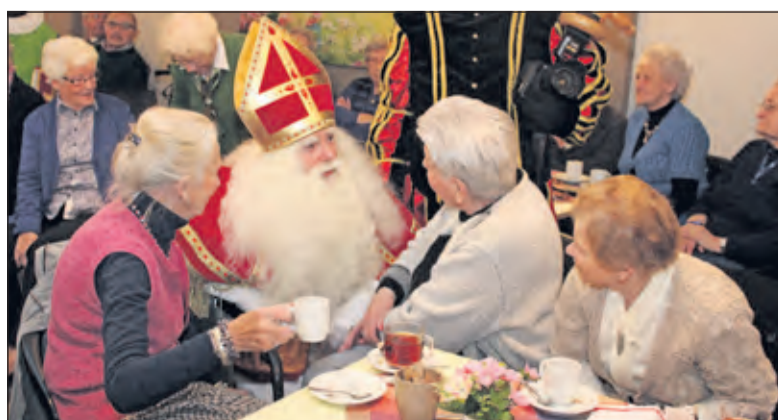
Sinterklaas voert in Dijkstate gesprekken op niveau.

Donderdag 3 december wordt in de foyer van appartementencomplex De Akker Soestdijkseweg-zuid 87 een Sinterklaas-Bingo georganiseerd van 14.00 tot 16.30 uur. De foyer is open vanaf 13.30 uur. Mooie prijzen en iedereen is welkom.