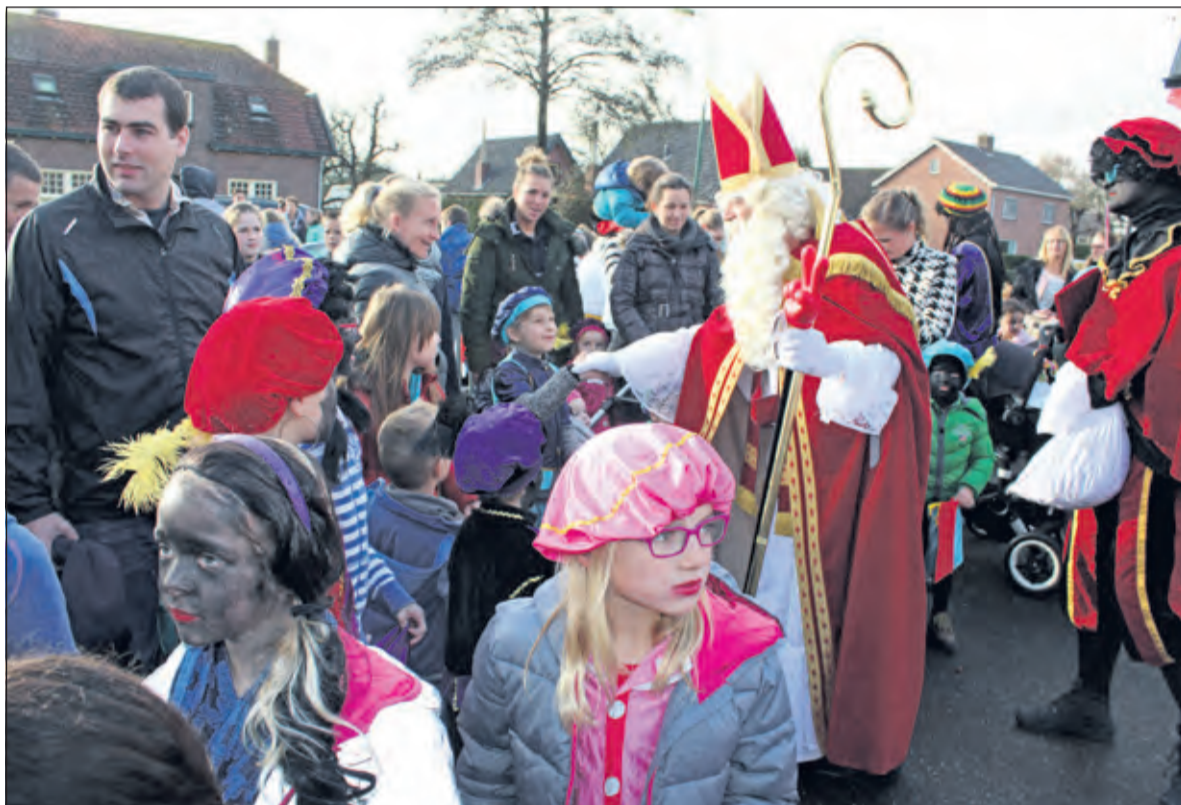
Voordat iedereen nog het Westbroekse Dorpshuis vertrok was er eerst een wederzijds warm welkom aan de Kerkdijk in Westbroek.

Zaterdag 21 november 'deed' Sint Nicolaas ook Westbroek aan. Rond 13.00 uur arriveerde de Goed Heiligman traditiegetrouw weer bij de fa. van Keulen op de Kerkdijk, opgewacht door heel veel kinderen, muzikanten en een bataljon van verkeerregelaars, die de grote kindervriend en zijn trouwe secondanten veilig naar het Westbroekse Dorpshuis moesten brengen.