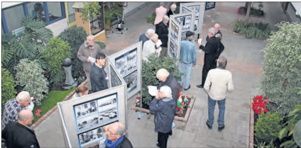
In de binnentuin van Dijkstate komt de langgerekte tentoonstelling van de Utrechtseweg prima tot z'n recht.

de bisschopsstad Utrecht verbindingen met Duitsland in de middeleeuwen van groot belang waren. In Aken was de keizer van het Heilige Roomse Rijk gezeteld en regelmatig trokken hij en zijn gezelschap naar de lage landen. Utrecht was als religieus centrum een van de belangrijkste steden. Na het afdammen van de Rijn in 1122 vonden er grootscheepse ontginningen plaats, zowel in het zuiden van De Bilt als in Maartensdijk en Westbroek.