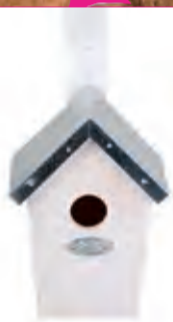
Voor Karel Vogelhuisje 12,99