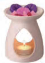
Voor Ilonka Creations 9,99

Sint koopt de leukste cadeautjes voor het hele gezin bij