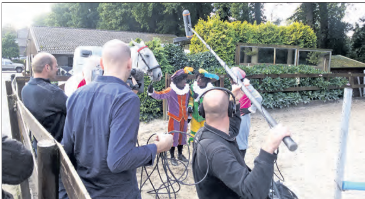
Pieten maken zich druk bij stal Arends in Maartensdijk om het paard van Sinterklaas in goede conditie te houden. Het Sinterklaasjournaal was erbij.