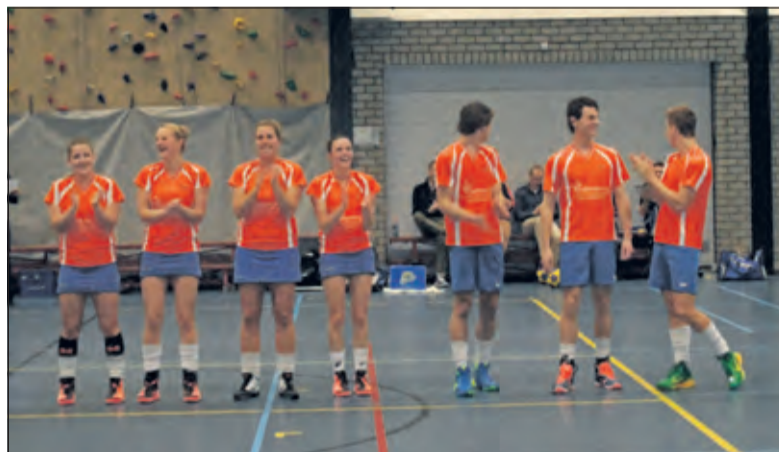
Vooraf tijdens het voorstellen van de teams was de stemming al opperbest.

voorsprong van twee punten op haar naaste achtervolgsters. Aanstaande zaterdag speelt DOS thuis in De Vierstee om 20.40 tegen Tiel.