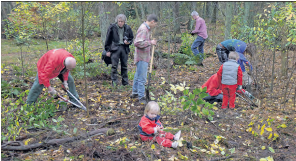
Zaterdag 7 november staken ook de bestuursleden van 'De Vrienden' de handen uit de mouwen.

De Vrienden van de Biltse Duinen is een bewonersvereniging die zich inzet voor het behoud van de Biltse Duinen. Dinsdag 1 december om 20.00 uur houdt de vereniging haar jaarvergadering in de Julianaschool, Julianalaan 52 te Bilthoven.