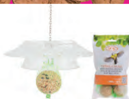
Voor tante Fenna Vogelschaal met voer 8,99 + 2,49