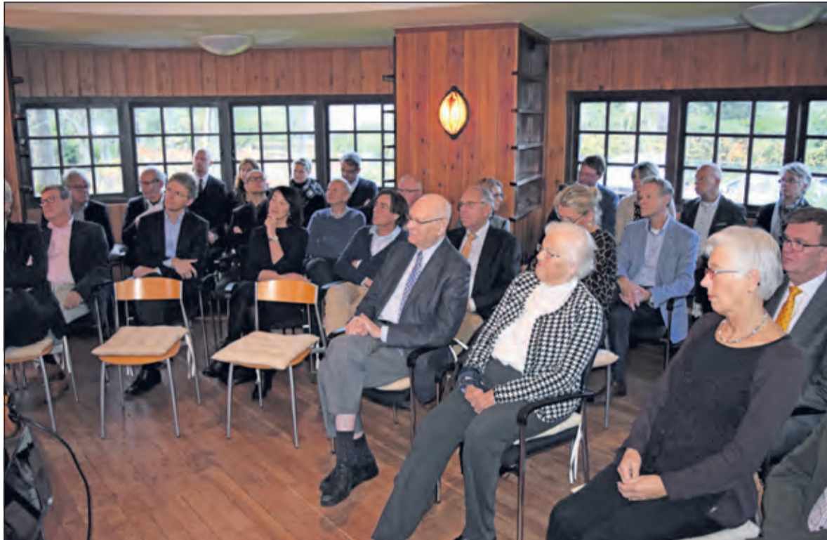
Het 10-jarig jubileum van de Stichting werd gevierd in het sfeervolle Walter Maashuis

Het Utrechts Landschap hoopt ook het 400 hectare grote gebied op Vliegbasis Soesterberg aan te kunnen kopen, zodat zij, samen met De Biltse Duinen, een groot aaneengesloten gebied verkrijgt. Hoorneman: 'De afgelopen tien jaar heeft onze Stichting ruim 350.000 euro aan ondersteuning gedoneerd aan diverse maatschappelijke organisaties en initiatieven vanuit de samenleving. Omdat niet alle aanvragen door de overheid kunnen worden gesubsidieerd, hoopt onze Stichting een steentje te kunnen bijdragen aan de Biltse samenleving. Op naar het volgende lustrum'.