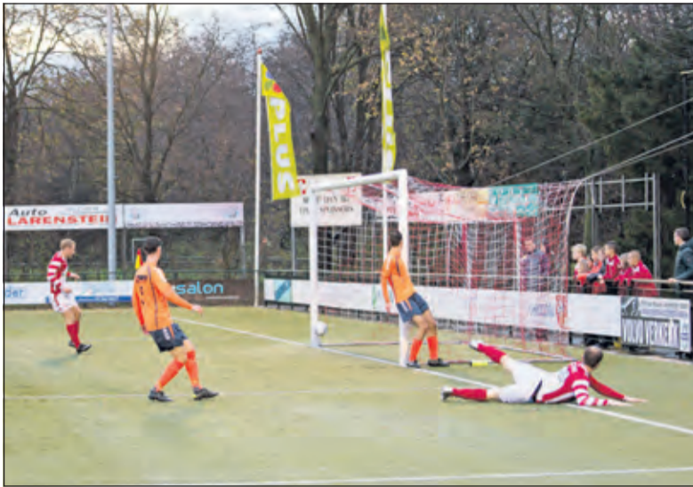
FC De Bilt en SVL zetten een mooie bekerwedstrijd neer.

Na Nieuw Utrecht schakelt FC De Bilt ook hoofdklasser SVL uit in de districtsbeke. In een heerlijke bekerwedstrijd trok de Ploeg van Gerrit Plomp de wedstrijd in de laatste 10 minuten naar zich toe.