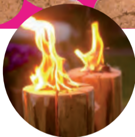
Voor Robin Zweedse fakkeltje 4,99