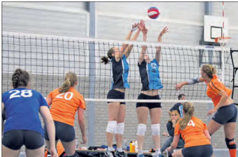
De meiden van Irene weten bijna alle ballen van de grond te houden.

Met Esmee Priem in plaats van Pleun Ypma zette Irene de tegenstander vanaf het begin onder druk. Het beweeglijke Irene weet, tot frustratie van de tegenstander, bijna alle Haagse aanvallen van de grond te houden en wint gemakkelijk de eerste set. (25-18). In de spannende tweede set, die eindigt in winst voor Irene, (25-19) is er een bijzondere rol voor Pleun Ypma als ze tijdelijk spelverdeelster Fuerra Everaert vervangt. In de derde set begint het snelle aanvalsspel van Irene weer te lopen en breekt men de tegenstand