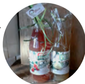
Voor Sander Biologisch sapje 1,95