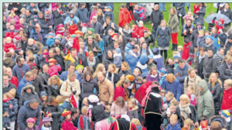
Heel veel fraai uitgedoste kinderen kwamen de Sint luidkeels begroeten.