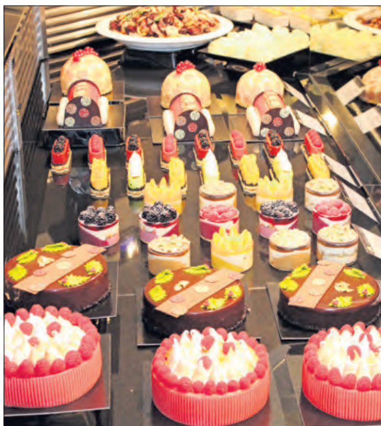
Laat u onder andere verrassen door de prachtige desserts.

Het culinaire team van Landwaart zal - evenals andere jaren - uw vragen graag beantwoorden en uw keuzes graag noteren. [HvdB]