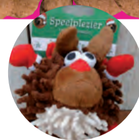
Voor hond Juul Speelkameraadje 4,99