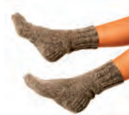
Voor Sophie Noorse sokken 7,99

Sint koopt de leukste cadeautjes voor het hele gezin bij