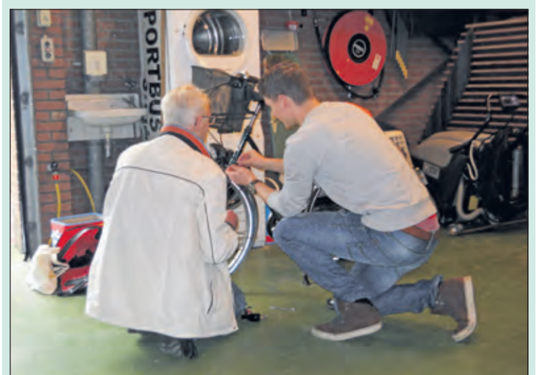
Samenwerking tussen Fietsersbond en Repair Café.

Op zaterdag 14 november was het druk bij WVT. Bezoekers kwamen zowel voor het Repair Café als voor de Fietsersbond. Reparateurs van Fietsersbond afd. De Bilt vervingen gratis kapotte voor- en achterlichten, een actie in het kader van 'Laat je zien'. De samenwerking met Repair Cafe is zeer goed bevallen. De Fietsersbond zet zich in voor veilig, snel en plezierig fietsen. Mocht u tips of opmerkingen hebben, meld deze dan bij de.bilt@fietsersbond.nl