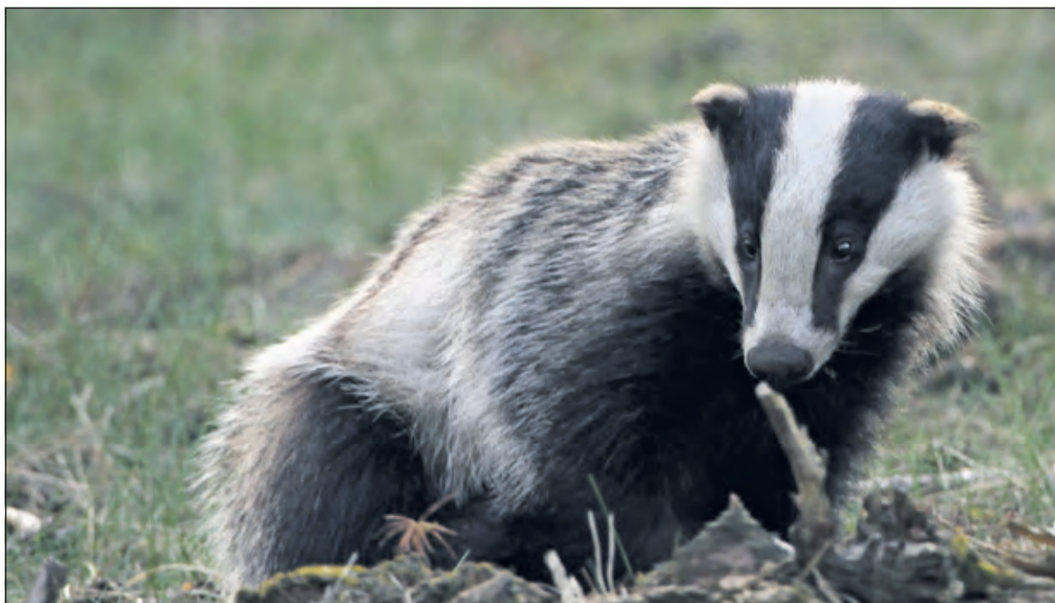
De dassen komen dichterbij.