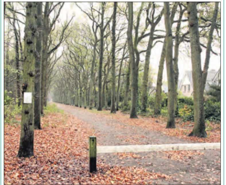
Op een natte dinsdag was men nog niet veel verder dan mensen attenderen op de komende werkzaamheden.

Begin week 48 worden de te verwijderen bomen gemerkt met verf, waardoor vermoedelijk eind van die week 'zichtbaar' zal zijn welke bomen gekapt zullen worden. Voorafgaand aan de latere werkzaamheden wordt het bos geïnventariseerd op bijzondere natuurwaarden, zodat deze bij de boswerkzaamheden ontzien kunnen worden. De daadwerkelijke zaagwerkzaamheden vinden plaats in de winter. Gedurende de werkzaamheden blijft men van harte welkom om de Leijen te bezoeken. Wel kan het zijn dat men enige (geluids-)overlast ervaart of dat sommige paden slecht toegankelijk of tijdelijk afgesloten zijn. Na afloop van de werkzaamheden zullen alle paden weer hersteld worden.