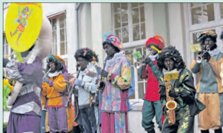
De muziekietten zorgden weer voor een feestelijke stemming.