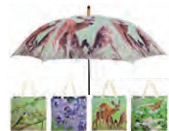
Voor oma Wil Tas + paraplu 2,99 + 8,99