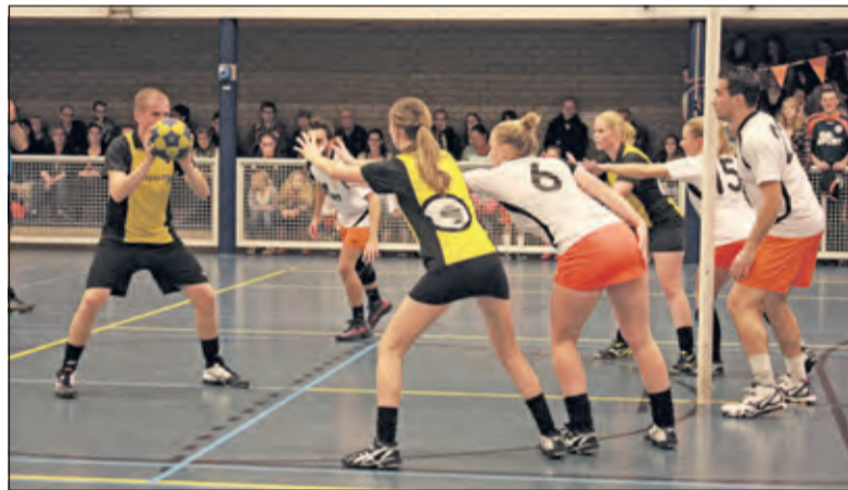
Onder grote publieke belangstelling werkt TZ naar de overwinning toe.

De start van de tweede helft was weer meer dan prima. Tweemaal