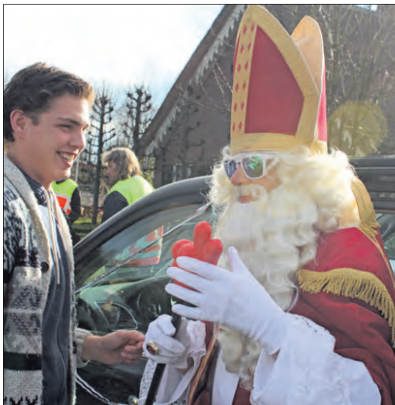
Sint maakte zijn jaarlijkse entree als een idool, een echte superster; compleet met zonnebril.