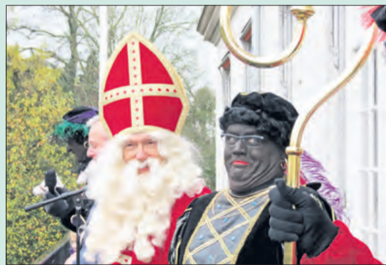
Sinterklaas kijkt vanaf het balkon van het gemeentehuis glunderend naar de vele enthousiaste kinderen.