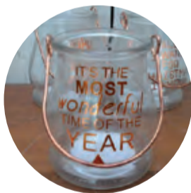
Voor Judith Windlichtje 3,19