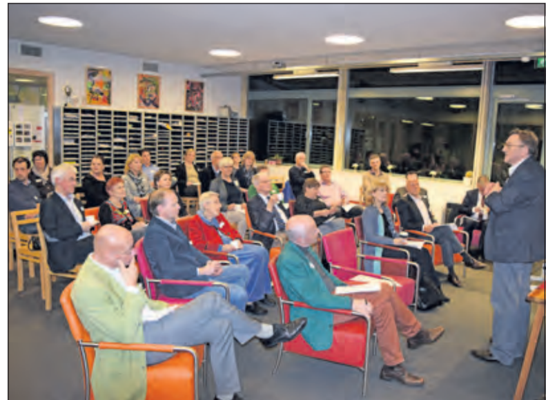
Discussie over opvang van vluchtelingen in De Bilt.