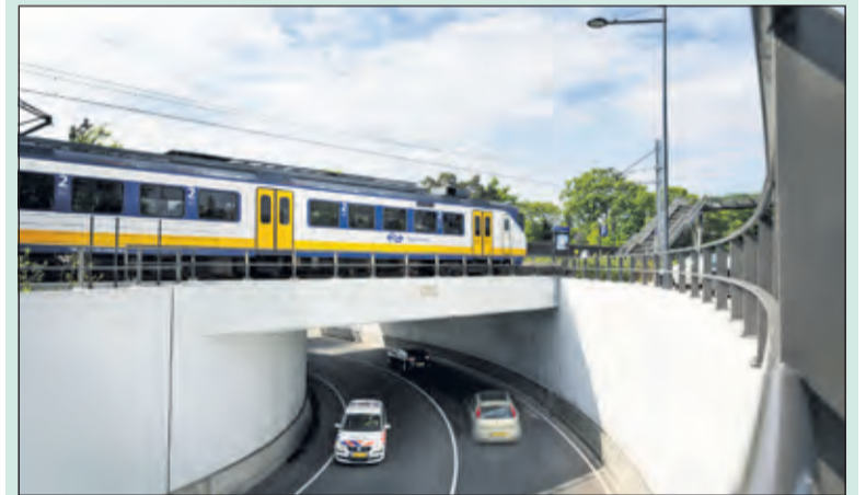
Treinen, auto's - en aan de andere kant fietsers en voetgangers - passeren elkaar tegenwoordig zonder moeite.

De jury complimenteerde het project Soestdijkseweg/spoorwegovergang voor de grote aandacht, die voorafgaand en tijdens de uitvoering is geschonken aan de omgeving en voor het realiseren van het mooie en beeldbepalend stuk infra, dat is gerealiseerd in een zeer complexe en dynamische, spoorse omgeving. Bij het project zijn twee onderdoorgangen gerealiseerd in het stationsgebied Bilthoven.