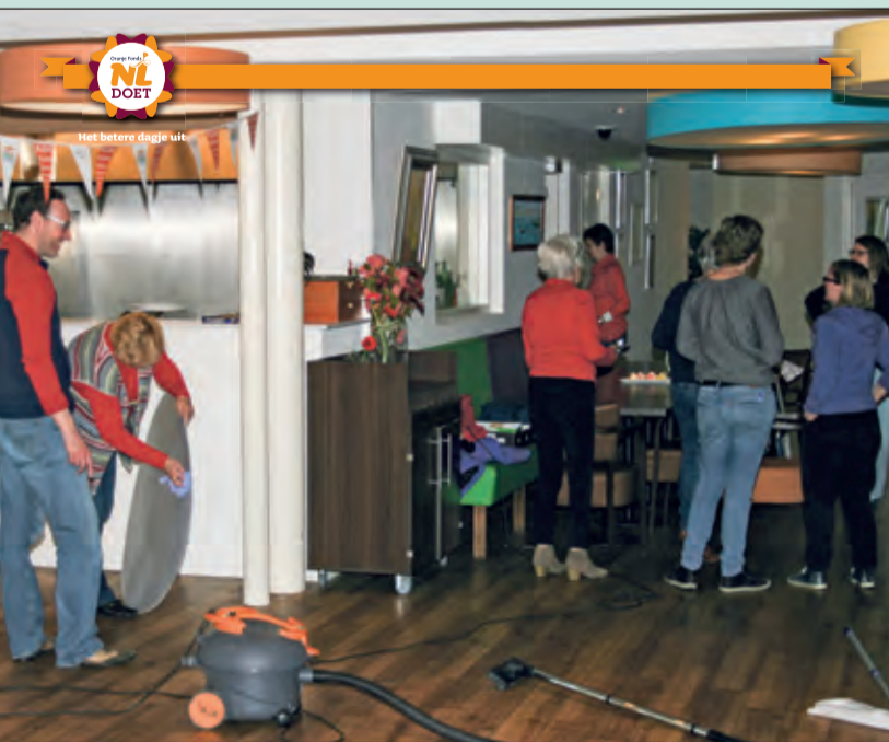
Wijkrestaurant Bij de Tijd in De Bilt greep de landelijke vrijwilligersactie NLdoet aan om de singles van gemeente De Bilt bij elkaar te brengen. Tijdens NLdoet was een vrijwilligersactie opgezet speciaal voor deze doelgroep. Iedereen was welkom in Bij de Tijd om samen het wijkrestaurant zomer-klaar te maken. Er was ruimte voor schoonmaken, sport en spel. [WE].