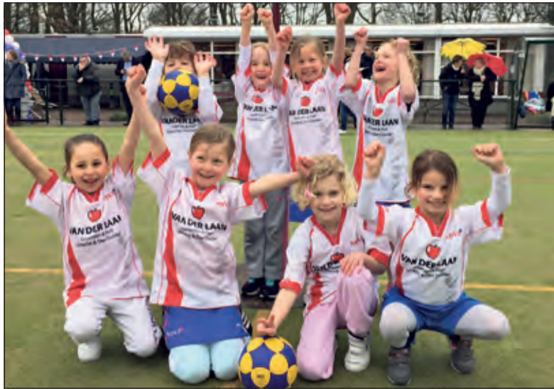
Nog een feestelijk moment: De F1 speelde hun allereerste korfbalwedstrijd.

Spelende leden stroomden binnen om bij te dragen aan de sfeer en hun oefenwedstrijden vol passie te spelen. Een extra bijzondere dag was het ook voor de jonge spelers van NOVA F1 die hun allereerste wedstrijd speelden. Al deze wedstrijden lieten het publiek goed warm draaien voor toch wel het spannendste moment van de dag: de kampioenswedstrijd NOVA 1 - Tiel 1. Deze wed-