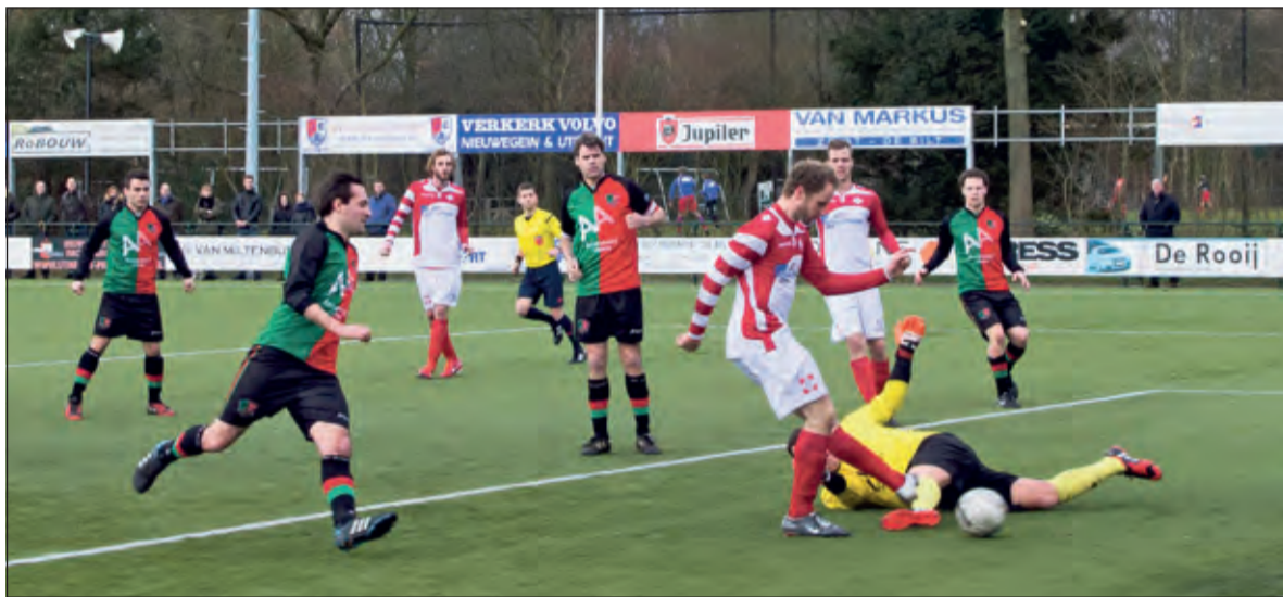
Een spelmoment uit de zes-punten-wedstrijd.

FC De Bilt deed dus goede zaken door een naaste concurrent te verslaan, maar het was zelfs nog beter, want de nummer vijf verloor en de nummer vier speelde gelijk, waardoor de verschillen klein zijn geworden. Met nog zeven wedstrijden te gaan is er nog van veel mogelijk.