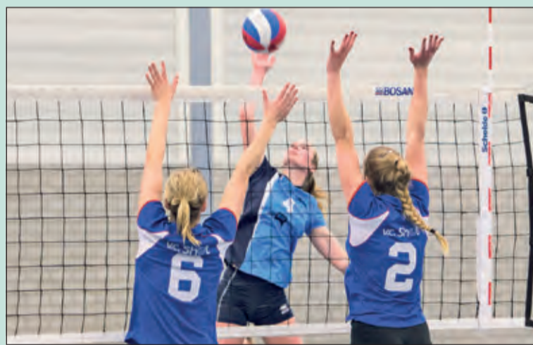
Ondanks maximale inzet een 4-0 nederlaag.

Irene Volleybal dames 1 uit Bilthoven speelde afgelopen zaterdag tegen Shot dames 1 uit Culemborg. De Irene-dames startten redelijk, maar door de vele servicefouten konden ze de set niet naar zich toe trekken en verloren ze met 18-25. In de tweede set letten de dames beter op de service, maar toch verloor Irene deze set met 13-25. Ook in de derde set speelden de dames met vlagen goed, maar dit leidde net niet tot winst (23-25). Ook in de laatste set kon Irene de tegenstander niet de baas, ze verloren deze vierde set met 18-25. Einduitslag: 0-4.