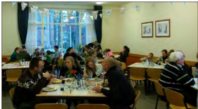
Bij de actie 't Gave pannenkoekenhuis van jongeren in Westbroek zijn ruim 1500 pannenkoeken verkocht. De actie heeft als eindresultaat ruim 3200 euro opgebracht. [RK]