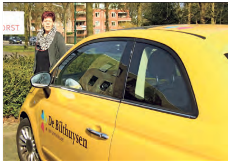
De Bilthuysen en Cordaan weten nog niet exact aan hoeveel mensen zij huishoudelijke hulp kunnen blijven leveren na 1 april 2015.