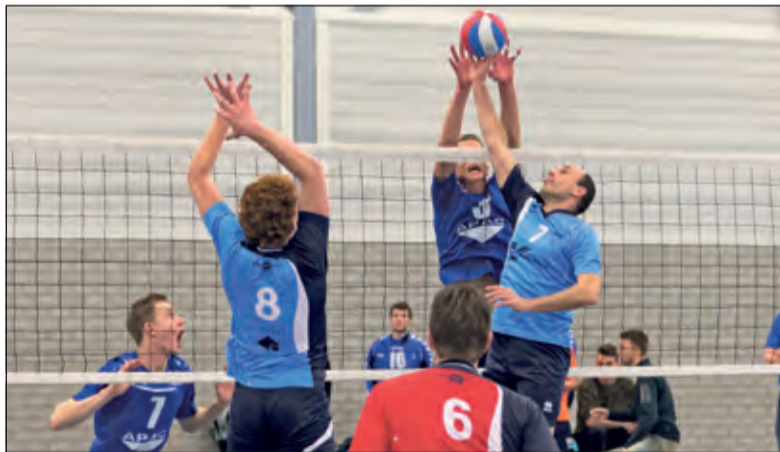
Menig robbertje werd aan het net uitgevochten.