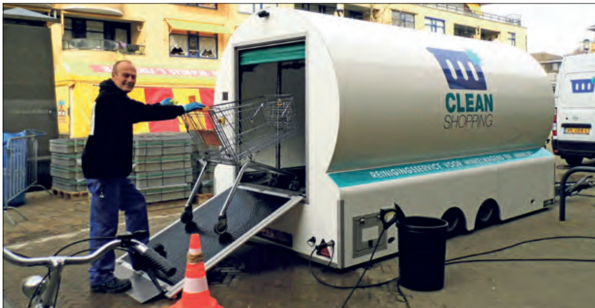
De mobiele self-supporting' wasstraat van CleanShopping stond bij Jumbo Maartensdijk voor de deur.

lervaring bieden. Schone karren en mandjes leveren hier een belangrijke bijdrage aan. Jumbo Maartensdijk is een van de eerste supermarkten, die ook op dit gebied aan de wensen van de klanten voldoet. Het gaat overigens niet uitsluitend om optische vervuiling. Uit onderzoek blijkt dat winkelmandjes gemiddeld meer bacteriën bevatten dan een WC-bril. Dit wordt veroorzaakt door o.m. groenteresten, kinderschoentjes, vieze luiers, huidschilfers en haren.