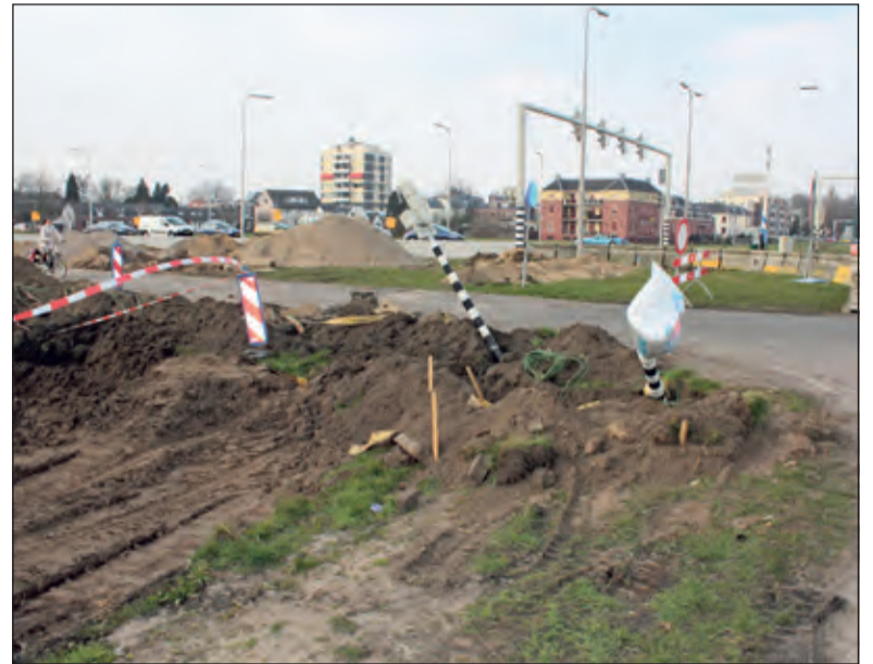
Maandag ging direct al flink de schop erin.

Fietsers op de zuidelijke parallelweg van de Utrechtseweg kunnen gedurende de bouwwerkzaamheden de Universiteitsweg niet meer oversteken. Daarom wordt het fietsverkeer omgeleid naar de fietsroute ten noorden van de Utrechtseweg. Deze omleidingsroute staat met borden aangegeven. Het aanleggen van de fietstunnel en met name het frezen van het asfalt en het aanbrengen van damwanden en tunneldelen kan geluidsoverlast veroorzaken. Voor het overige verkeer en het openbaar vervoer zijn er drie periodes met extra verkeershinder: