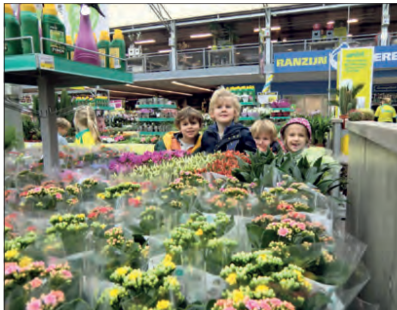
Kinderen van de Van Dijckschool op onderzoek in het tuincentrum.

Vorige week mochten alle kinderen op bezoek komen bij een nieuw tuincentrum. Omdat het tuincentrum pas geopend is boden de kinderen