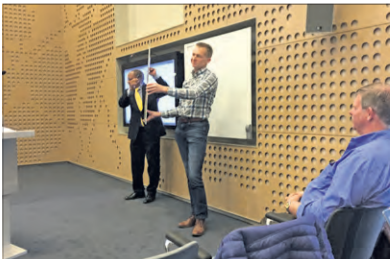
Beantwoording, toelichting en uitleg door aanwonenden van de Nieuwe Weteringseweg bij de Raad van State.