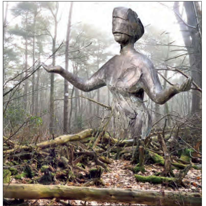
Het is voorlopig even afwachten in hoeverre Vrouwe Justitia oog zal hebben voor de zo bekritiseerde houtwallen.

Alle belangstellenden ontvangen daarvoor binnenkort een uitnodiging. De Biltse NodM-pilot maakt deel uit van een landelijk project 'Stroomversnelling Koopwoningen' in het kader van het Energieakkoord. Hieraan wordt meegewerkt door gemeenten, bouwbedrijven en verschillende lokale organisaties. BENG! verwacht dat het realiseren van deze pilotwoningen ertoe zal leiden dat in de nabije toekomst meer woningen op deze manier zullen worden gerenoveerd.