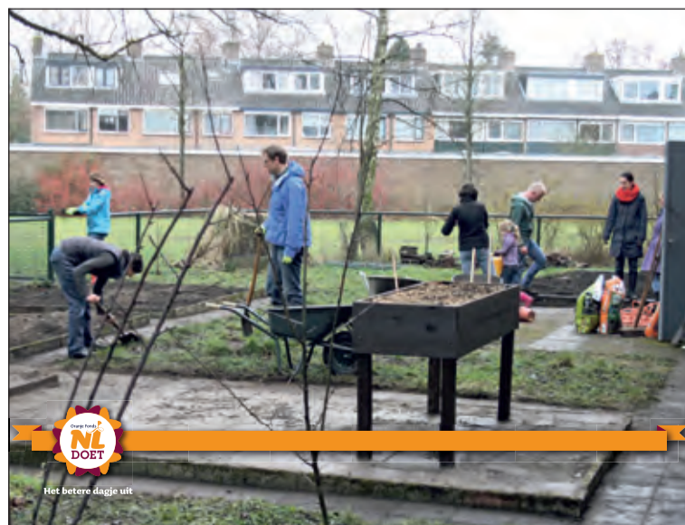
Tijdens NL Doet werd op Basis- en Daltonschool De Rietakker in De Bilt de moestuin lente-klaar gemaakt. Ouders, team en leerlingen klaarden in gezamenlijkheid de klus. [WE]