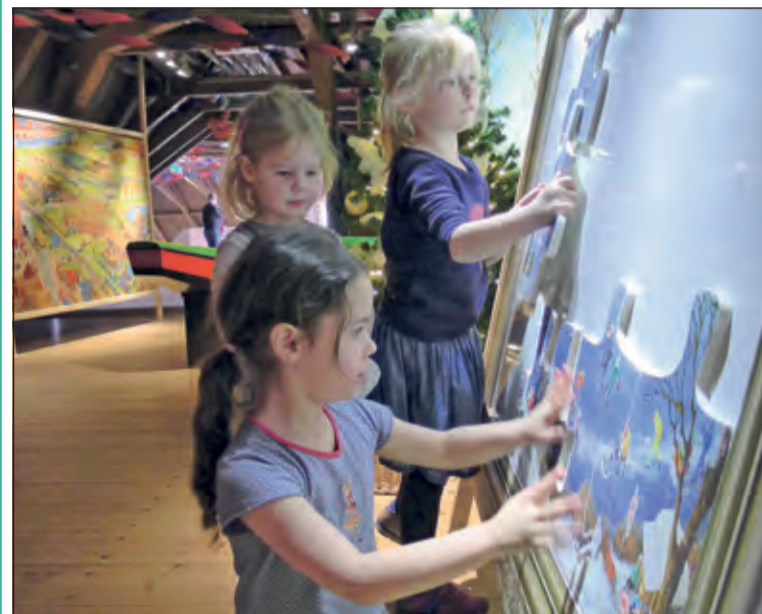
XL puzzelen in Kasteel Groeneveld.

Afgelopen week zijn de kleuters van de Montessorischool naar de zolder van Kasteel Groeneveld gegaan. Deze zolder is tot eind 2016 omgetoverd tot één grote speelplaats waar uitvergrote prenten uit het boek 'Nederland' van Charlotte Dematons het middelpunt vormen. De kleuters keken hun ogen uit en speelden twister in Den Haag, vingen dieren op de Veluwe, gingen racen in de Kameleon en zongen liedjes uit de oude doos in de gele camper. De zolder bood een mooie gelegenheid om vele gebruiken, bezienswaardigheden en historische verhalen van Nederland te leren kennen: van Madurodam tot het Anne Frank Huis en van Koningsdag tot bollenvelden. (Vicky Pronk)