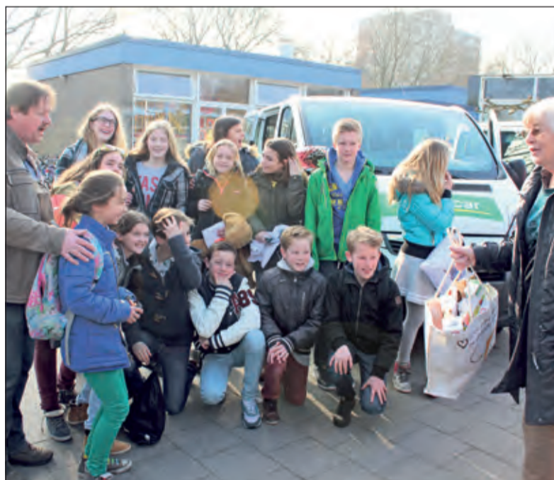
De Werkgroep Fairtrade De Bilt ondersteunt dit initiatief van harte en geeft een mandje Fairtrade lekkers mee.

Deze maand zijn er in alle groepen Fairtrade lessen gegeven. De lessen in groep 8 werden verzorgd door 2 stagiaires van het Herman Jordan Lyceum: Bram Sloezarwij en Floor van Dam. Floor is zelf oud-leerling van de Patioschool. Zij hebben een presentatie gemaakt in het Nederlands en in het Duits die meegaat naar Coesfeld.