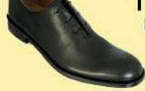
The Bird Extra smal