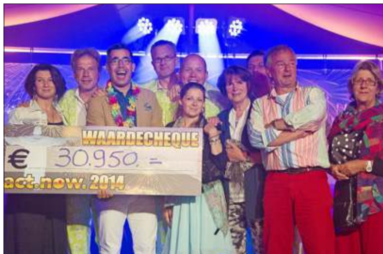
Overhandiging cheque, door de mannen van de Rotary aan vertegenwoordigers van de vier Biltse organisaties.

Het geldbedrag is bijeengebracht door 320 betalende gasten van het feest. Tevens was er een veiling en een loterij. Het feest is mede mogelijk gemaakt door zeventig bedrijven die een bedrag hebben gedoneerd. Hoofdsponsors waren ING Private Banking, Luzac en Baas Wijnen. De feestavond in Braziliaanse sfeer werd gepresenteerd door Rick Brandsteder. Er waren optredens van Ola Don, een Utrechtse sambafornatie van zeventien man, het trio Two Man Sound en een ballet onder leiding