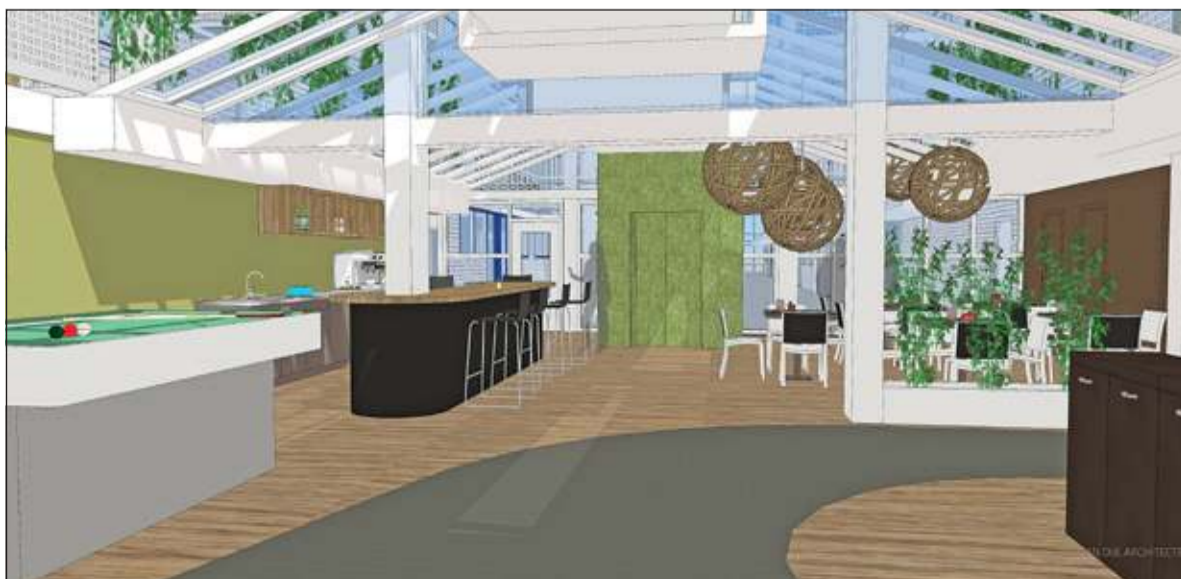
Een impressie van de ‘Ontmoetingsruimte’ in het verbouwde Dijkstate. De inrichting is een suggestie van de architect. Stichting Mens De Bilt wordt als huurder verantwoordelijk voor de keuze van de inrichting.

onderzoeken naar een proeverij en de inzet van een cateraar, die het liefst zo vaak mogelijk per week een maaltijd verstrekt, zonder de inzet van (extra) betaald personeel. Voor het onderdeel mobiliteit wordt alles in het werk gesteld om de groep ‘minst mobiele’ in Dijkstate te houden. Voor anderen wordt gekeken naar eventuele mogelijkheden elders (bijv. het Sojosgebouw aan de Dorpsweg, dat vaak leeg staat). Ook de groep koersbalspelers wil graag in Dijkstate blijven. Van de avond is een verslag gemaakt. Dit zal na een week bij Cordaan ter inzage liggen. Ook zal het verslag geplaatst worden op de website van Stichting Mens De Bilt. ( www.mensdebilt.nl ).