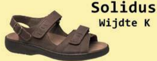
Solidus Wijdte K