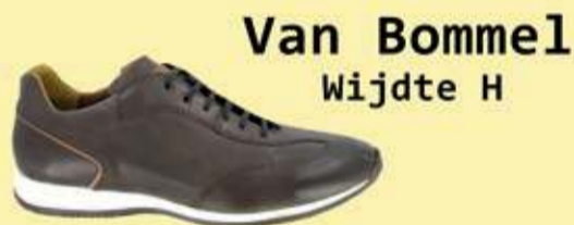
Van Bommel Wijdte H