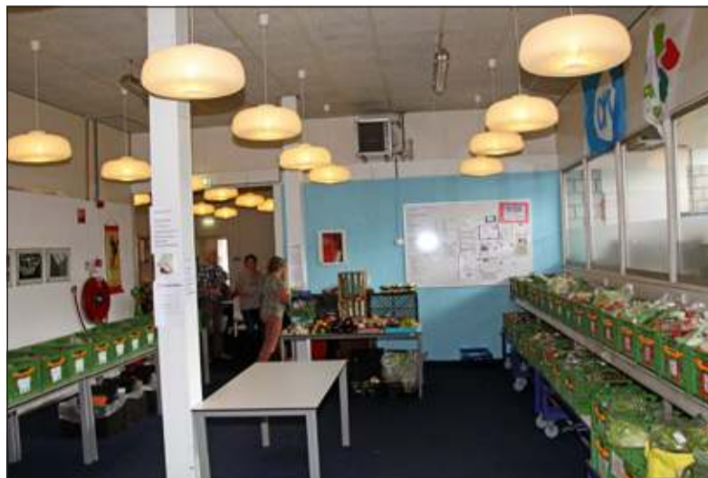
Een kijkje in de keuken van de voedselbank.

De huur stijgt elk jaar en de energiekosten met een heel gezin zijn fors hoezeer we ook proberen daarop te bezuinigen. Door creatief met geld om te gaan, kon ik alle rekeningen nog betalen. Ik heb nooit in de schuldsanering gezeten. De kinderen leven heel zuinig. We hebben nergens rekeningen uitstaan bij postorderbedrijven. Ik heb een oud gsm-toestel waar ik de voicemail nooit van af luister, want dat kost geld. Dat levert wel eens scheven ogen op bij mensen die verwachten dat ik wel berichten af luister, maar de meesten weten inmiddels wel waarom ik dat nooit doe. Familie of bekenden nodigen ons soms uit om bij hen te eten. We gaan als gezin nooit naar een pretpark, maar wel met bekenden naar een park in de buurt waar we dan allemaal iets