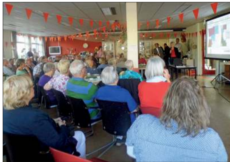
Een kleine honderd mensen luisterde aandachtig naar de toekomstplannen voor Dijkstate.