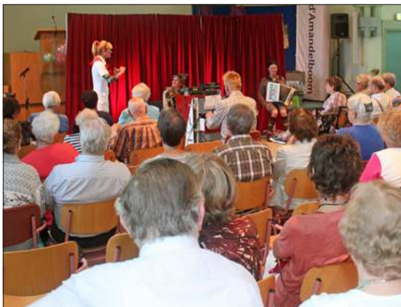
Het Pleegtheater Amsterdam maakte de gewenste verandering op theaterlijke wijze kenbaar bij de betrokkenen van d'Amandelboom.

Op 23 juni waren cliënten, mantelzorgers, vrijwilligers en overige belanghebbenden uit de regio uitgenodigd. De bijeenkomst in de Immanuelkerk begon om 16.30 uur en ging door tot 21.30 uur. Tussendoor was er een maaltijd.