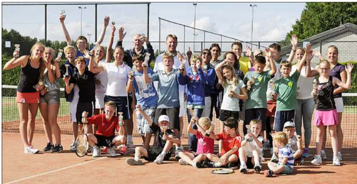
De clubkampioenen van TV Tautenburg.