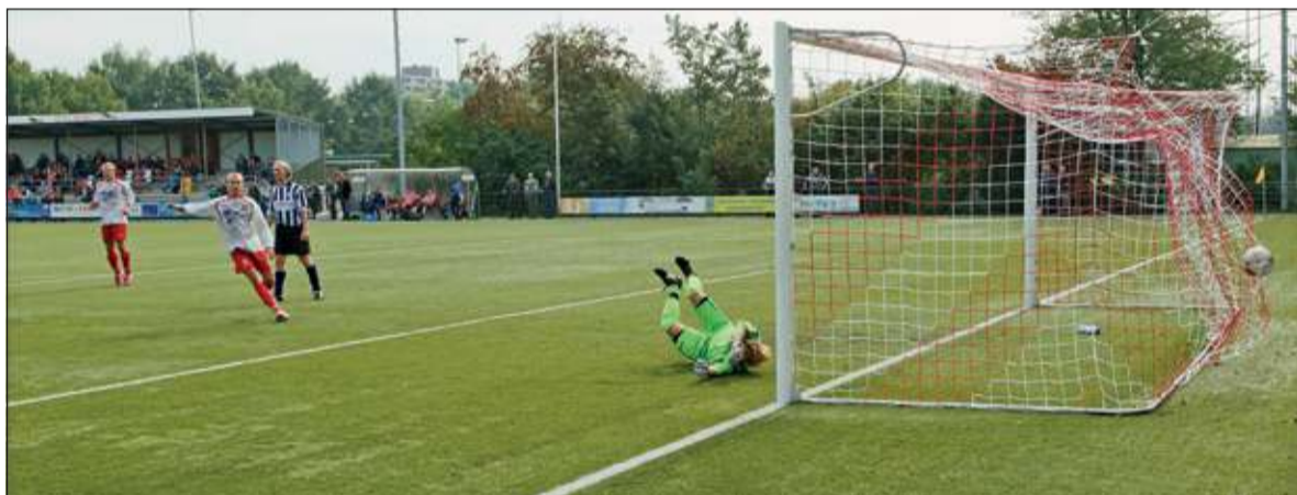
Een van de trefzekere doelpunten van FC De Bilt.