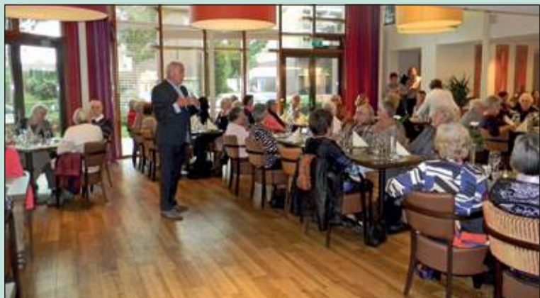
Er was donderdag 19 september in wijkrestaurant 'Bij de Tijd' bij de eerste editie van 'Captains Diner' grote belangstelling. Niet minder dan 65 personen hadden zich aangemeld.

Dit bijzondere samenzijn maakt onderdeel uit van de vrijwilligersactiviteiten van de gemeente De Bilt. De bediening en het gastheerschap was tijdens de eerste editie dan ook in handen van medewerkers van de gemeente. Doel van deze vrijwilligersactiviteit is om (nieuwe) gasten op een ongedwongen manier kennis te laten maken met het restaurant, maar ook om variatie te bieden, onderscheidend te zijn en meer bekendheid te genereren. Het is de bedoeling dat wijkrestaurant 'Bij de Tijd' na deze eerste editie op eigen kracht invulling blijft geven aan dit concept. [HvdB]