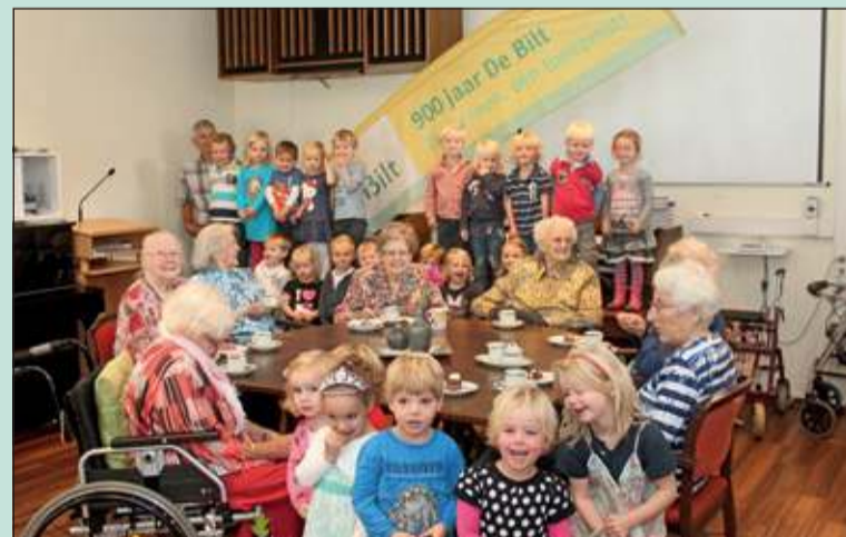
Kinderen van Kinderopvang 't Mereltje bezochten ouderen van verzorgingshuis d'Amandelboom. (boven)

De doelstelling van de Stichting 900 jaar De Bilt is om alle generaties iets te laten meebeleven van 900 jaar De Bilt. Deze week is de aandacht gericht op de allerjongsten en de ouderen. De peuters van verschillende peuterspeelzalen en kinderdagverblijven gaan op bezoek bij enkele zorgcentra. [HvdB]