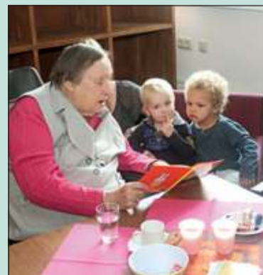
Kinderen van Peuterspeelzaal Juliaantje waren te gast bij woon- en zorgcentrum De Koperwiek, waar een vijftal bewoners hen graag voorlas. (links)