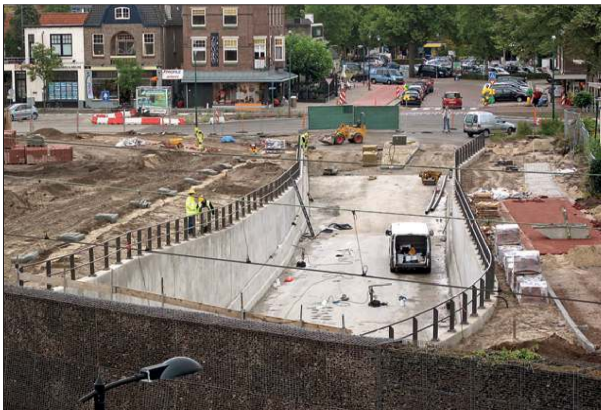
Toegang tunnel zuidzijde.

Dinsdag 17 september luistert een goed gevulde zaal in Het Nieuw Lyceum naar de presentatie van Prorail en het bouwteam Bilthoven. Nadat het Chinees Restaurant Fong Cheng vorige maand is afgebroken wordt er druk gewerkt aan de afwerking van de autotunnel, de herbestrating aan de zijde van de Spoorlaan, de bushaltes aan de noordkant, en de inrichting van een tijdelijke fietsenstalling