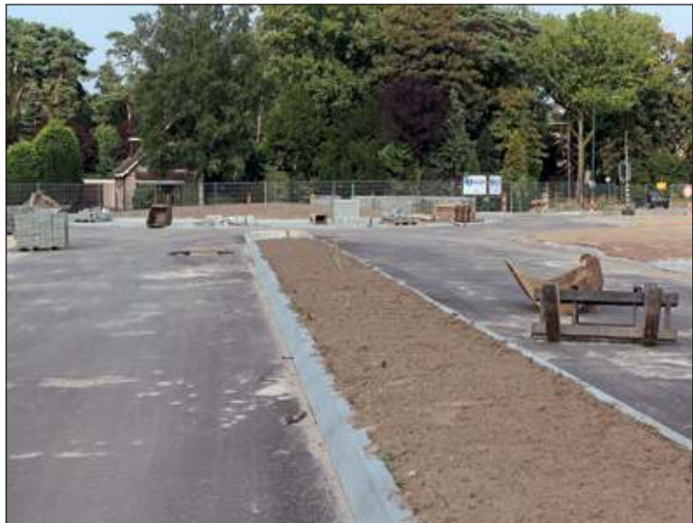
Naar het noorden kan men straks langs Kiss & Ride via de rotonde Jan Steenlaan de Soestdijkseweg Noord op.