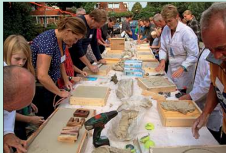
De Looydijkers kleien gebroederlijk aan de verbinding.