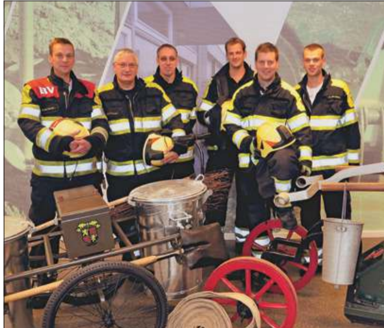
De Groenekanners zijn vice-landskampioen.

Een van de werknemers kon de kelder niet meer verlaten, zijn collega wel, en hij kwam met een in brand staande arm naar buiten op het mo-