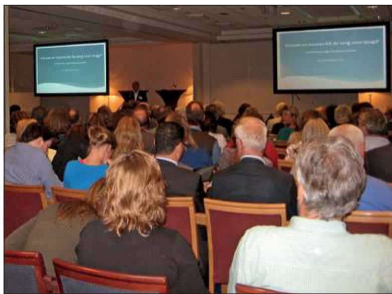
De werkconferentie Jeugdzorg leverde een goed gevulde zaal op.

gemeente De Bilt zijn dat in eerste instantie de samenwerking tussen de huisarts, het Centrum voor Jeugd en Gezin, de Stichting Mens en Jeugdhulp op Maat (Lijn 5, De Rading en Internetzo). [MD]