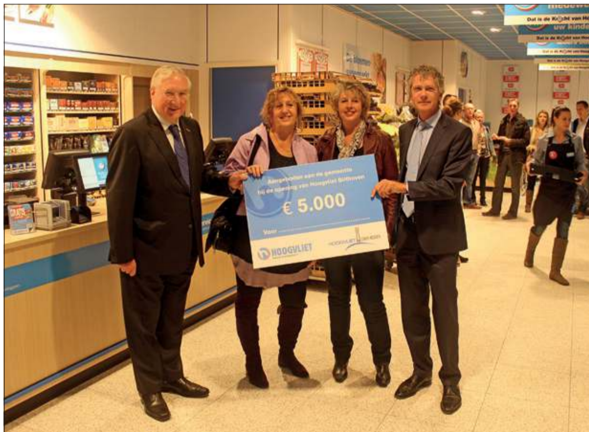
Vertegenwoordigers van Stichting Stoute Schoenen nemen de cheque in ontvangst.

Ter gelegenheid van de opening van Hoogvliet doneerde de supermarkt een cheque ter waarde van 5000 euro als vrij besteedbaar bedrag voor een door de gemeente te bepalen goed doel. Wethouder