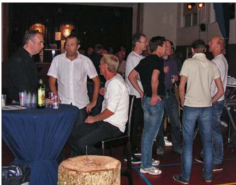
Een beeld van de Westbroekse mannenavond in 2013.

hieraan deel te nemen en waar te maken of zij inderdaad het verschil tussen al die biersoorten kunnen proeven. De dresscode dit jaar is casual, ongeschoren maar stropdas wel verplicht. Twee Turkse barbiers zullen de Westbroekse ongeschoren koppens zo zacht maken als babybiljetjes, zo beloven de organisatoren. Ze verwijderen met veel flair en passant ook de overvloedige neus- en oorbearing.