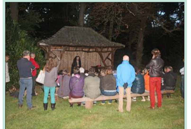
Er was grote belangstelling voor de voordrachten.