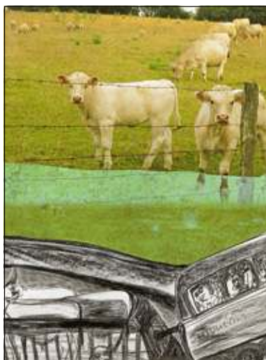
Een deel van een triptiek, gemaakt in 2012, 'Infrastructure'.

Op zondag 21 september om 15.00 uur wordt de expositie van Jacqueline de Jong geopend door schrijfster Mensje van Keulen. De expositie is te bezichtigen t/m 11 november 2014. Van jongs af aan was Jacqueline de Jong (1939) een in alle opzichten geëngageerd kunstenaar. Jacqueline de Jong schildert en tekent niet alleen, zij maakt ook objecten. Zo heeft zij van langzaam (langdurig) gedroogde aardappels en hun uitschietende spruiten zogenoemde 'Pommes de Jong' sieraden gemaakt door die te laten vergulden en te platinieren. Ook deze 'Pommes de Jong' zullen in Bilthoven te zien zijn.