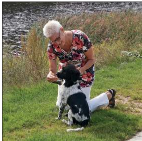
De Friese Stabij Vlinder is momenteel in opleiding en gaat ook een steentje bijdragen in de praktijk.

In mijn praktijk begeleid ik kinderen, jongeren en ouders om hun verlies een plaats te geven zodat ze verder kunnen. Hierbij maak ik onderscheid in het begeleiden van kinderen en jongeren en van gezinnen. Bij het begeleiden van gezinnen werk ik bij de mensen thuis.