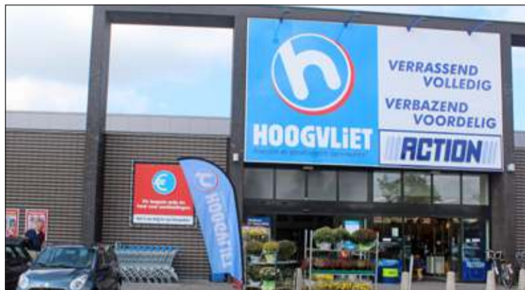
Hoogvliet heeft de bloemetjes al een jaar buitengezet.

Supermarkt Hoogvliet was een jaar geleden een compleet nieuw gezicht in Bilthoven. Het assortiment is er ruim, met veel aandacht voor verse producten. Er is tevens een afhaalpunt voor boodschappen die online zijn besteld via www.hoogvliet.com .