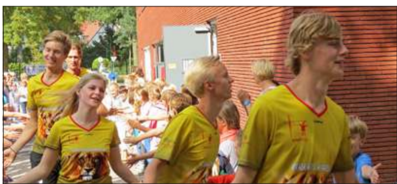
De aankomst van de estafetteploegers bij de Julianaschool.

De loop werd gehouden om aandacht te vestigen op het project Kerk Kids Kaapstad. Eind februari 2015 gaan 22 jongeren tussen de 16 en 20 jaar vanuit de Protestantse Gemeente Bilthoven naar Zuid-Afrika om mee te helpen aan de bouw van een kinderopvang in een sloppenwijk in Kaapstad. Voor de bouw en de bouwmaterialen van het kinderdagverblijf is geld nodig. Kerk Kids Kaapstad probeert met fundraising 50.000 euro bijeen te brengen op zeer uiteenlopende manieren. 'Dat doen wij niet alleen; ook veel vrijwilligers, leerlingen van de Julianaschool en zelfstandig ondernemers helpen ons hierbij.' [GG]