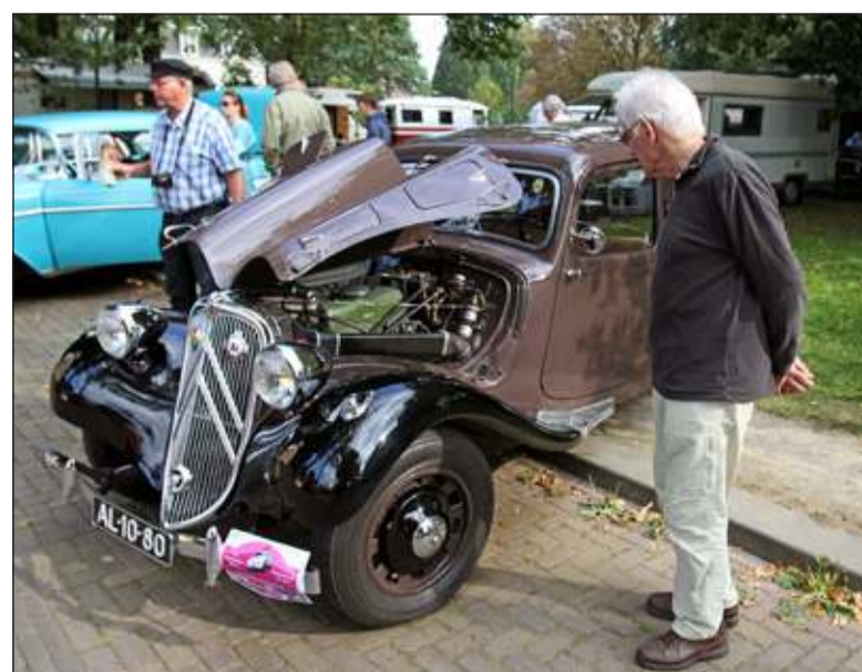
Onderdeel van De Marktdag was ook in 2014 de Oldtimerdag.