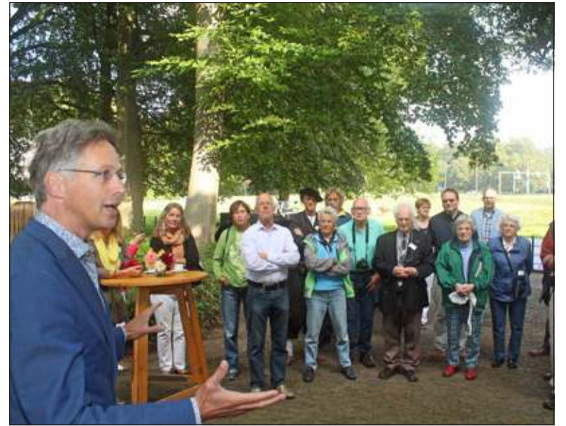
'Door De Bilt is heel wat afgereisd'.