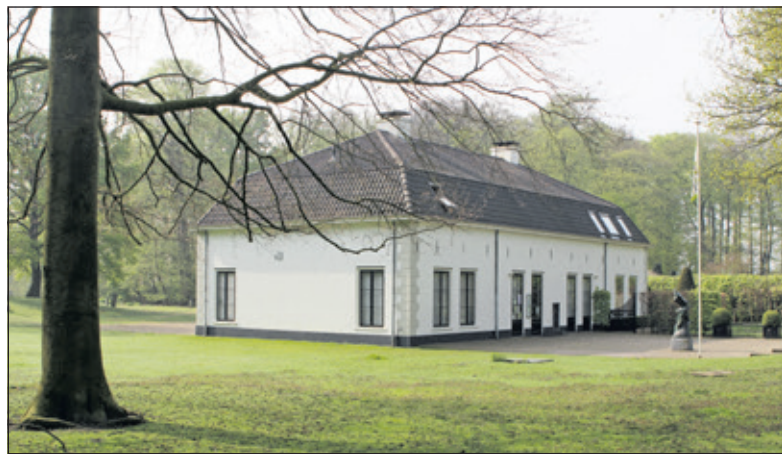
Paviljoen Beerschoten.