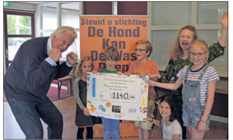
Totaal haalden de kids 1140 euro op voor het goede doel.

Hulphonden kunnen voor diverse activiteiten worden ingezet. Niet alleen zijn er de bekende blindegeleidehonden, maar ook zogenaamde ADL-honden (Algemene Dagelijkse Levensverrichtingen), die worden ingezet om alles aan te geven/ op te rapen; hulphonden voor kinderen helpen bij het aan- en uitkleden, of het aanreiken van gevallen voorwerpen; de signaalhond waarschuwt mensen met een