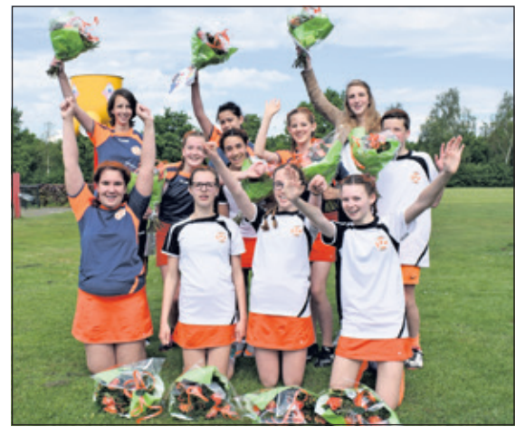
Er was taart en bloemen voor de kampioenen van TZ.

Zaterdag 20 mei op de vroege morgen moest Tweemaal Zes C3 hun kampioenswedstrijd spelen tegen HKC. Er diende gewonnen te worden. Haartjes gevlochten en oranje gestrepen, begon het team fel aan de wedstrijd. Er ontstond een kleine achterstand, maar al gauw kwamen ze weer voor met 2-1. Met 3-1 ging men naar de thee. Tot in de laatste minuten heeft de C3 gestreden voor de winst.