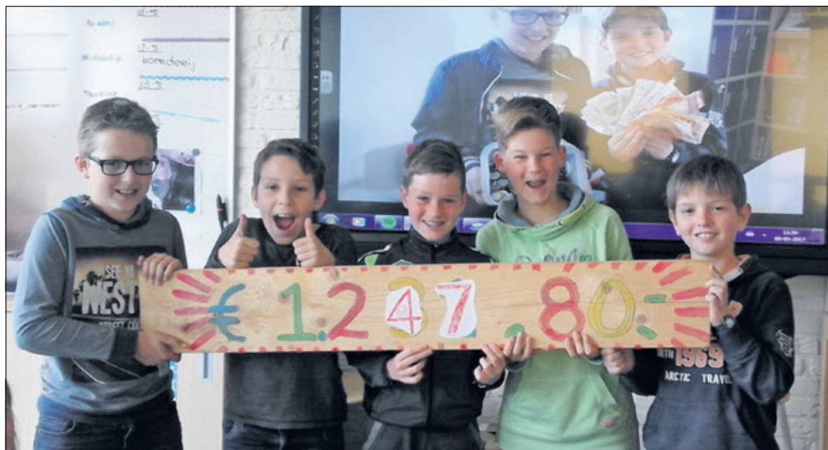
Leerlingen van groep 7/8 tonen trots hun bijdrage.

als het aan de kinderen ligt, komt dat kamp er nog steeds. Overigens was het niet alleen in groep 7/8 dat er hard werd gewerkt. Ook in de andere groepen deden kinderen ontzettend hun best om zoveel mogelijk geld te verdienen. In de onderbouw werden volop lege flessen verzameld en in groep 5/6 werden er door de kinderen veel klusjes gedaan. In totaal werd er op school een prachtbedrag van 1853,07 euro opgehaald, dat inmiddels is overgemaakt aan het christelijk noodhulpcluster.