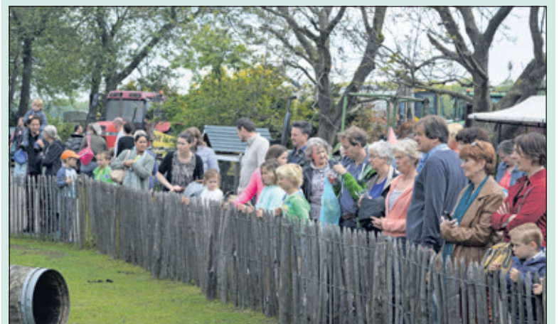
Zaterdag 13 mei vond de Lentemarkt plaats, gecombineerd met de open dag van zorgboerderij Nieuw Toutenburg in Maartensdijk. De activiteiten zoals het schapen scheren leverden veel toeschouwers op. De organisatie heeft genoten van een mooie en gezellige dag die goed verliep. De opbrengst van de Lentemarkt is 4608,47 euro en gaat naar mensen in grote armoede, weeskinderen en gehandicapte kinderen in Bacau, Roemenië. (Jan Vonk Noordegraaf)