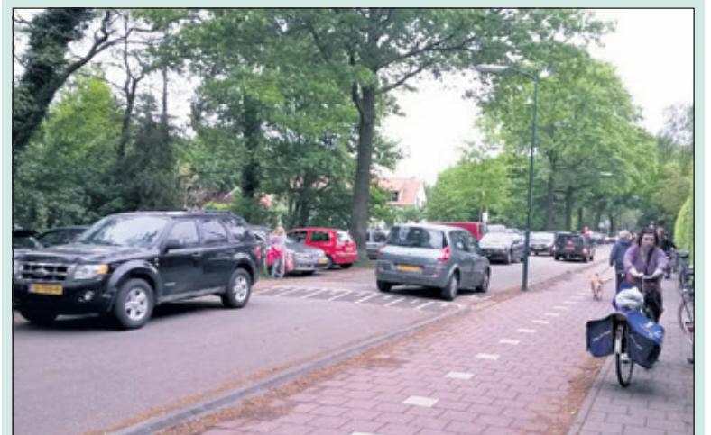
De drukte op Weltevreden rond de scholen.

Schlamilch heeft deze kwestie aan de orde gesteld in de raadscommissie openbare ruimte, maar wethouder Rost van Tonningen wilde niet vertellen of hij het rapport had gelezen en wat hij ervan vond. 'Ik kreeg de indruk dat de Wethouder het rapport in het geheel niet kende,' aldus Schlamilch. Ik zal in de komende gemeenteraadsvergadering het college in een motie vragen het rapport zsm. te delen met de scholen en hun om reactie te vragen. Daarna moet het in de raad worden besproken en moeten de schoolomgevingen zo nodig verkeersveilig worden gemaakt. Forza roept iedereen op om gevaarlijke schoolomgevingen te melden via info@forzadebilt.nl