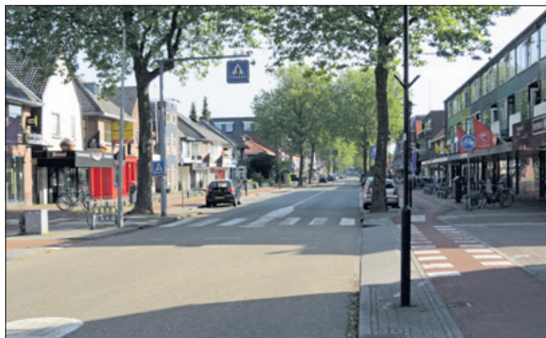
De Hessenweg in De Bilt op zondagmorgen.