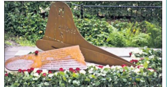
Een eerdere bloemenhulde bij het B-17-monument in Groenekan

In de namiddag van 28 mei 1944 maakte een brandende Amerikaanse B-17 bommenwerper een noodlanding in het weiland achter de Veldhoeve aan de Groenekansegweg. Drie bemanningsleden kwamen om, de overige zeven raakten in Duitse krijgsgevangenschap en overleefden de oorlog. Uit dankbaarheid voor het offer dat deze bemanning bracht voor onze vrijheid werd in 2014 in Groenekan een monument opgericht.