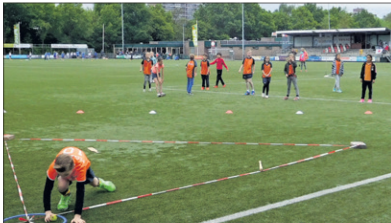
Ook dit jaar was het terrein van FC De Bilt weer decor voor de Biltse Schoolsportdagen.