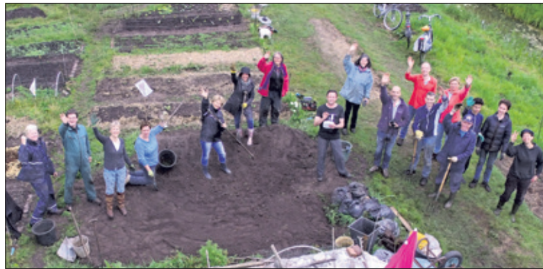
Prima sfeertje in De Biltse Biet.

op het gebied van maatschappelijk betrokken ondernemen, verspreid over de kernen. De activiteiten variëren van klusprojecten tot taalondersteuning. Het programma wordt dit jaar weer georganiseerd in samenwerking met Mens De Bilt onder het motto 'We doen mee!'.