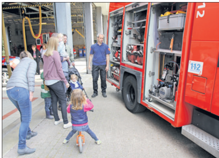
Dit jaar deed ook de brandweer Bilthoven mee aan de dag van de bouw; ook bij de brandweerkazerne aan de Leijenseweg waren er diverse activiteiten.