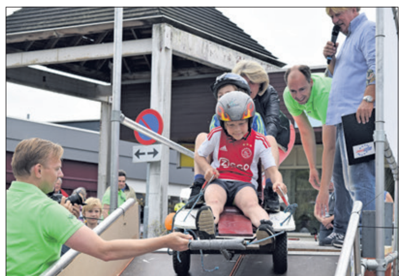
Met man, vrouw en macht ging men in 2016 de helling af.