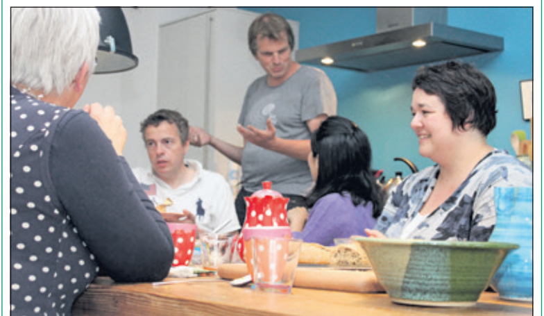
Eet mee! In je buurt: buurtbewoners samen aan tafel.

Ook organisaties kunnen hun buurtgenoten met elkaar in contact brengen. Zo heeft De Werkplaats vorig jaar de mensen die aan de zogenaamde 'snoeproute' wonen een high tea aangeboden, geserveerd door de leerlingen. De school wilde iets terugdoen voor de overlast die de jonge snoepkopers soms geven (denk aan afval en drukte). Met dit gebaar zorgde de school voor een leuke middag waarbij buurtbewoners met elkaar aan tafel zaten en nader kennis met elkaar konden maken. Iets voor jou of voor jouw organisatie? Op www.eetmee.nl vind je meer informatie en kun je de kaarten bestellen.