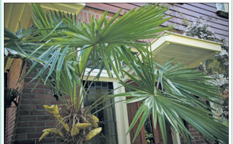
De palmboom draagt 5 grote gele bloemen, vol met pitten.

Deze palmboom, een boom die eigenlijk groeit aan de Cote d'Azur, is 17 jaar geleden geplant tegen de muur van het huis aan de Overboslaan 60 in Bithoven en is door weer, wind en vrieskoude blijven groeien. Nu, na al die jaren liefdevolle verzorging en leunend tegen een warme muur, is de boom tot grote verrassing van de familie Bekkers zelfs uitbundig gaan bloeien.