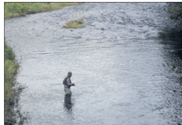
Vliegvisen bij Lenne in het Sauerland

De Locatie is: Grote Geer, Snoeksloot 62, Houten (rondweg Houten, afslag De Sloot) op zaterdag 27 mei om 10.00 uur. Er zijn geen kosten aan verbonden. Aanmelden via e-mail hsvdebilt@gmail.com . Na aanmelding wordt iedereen verder geïnformeerd door middel van een persoonlijke uitnodiging.