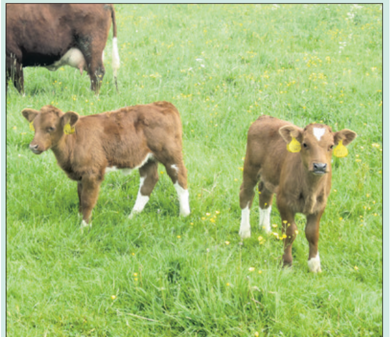
Brandrode runderen op Sandwijck. Een lust voor het oog.