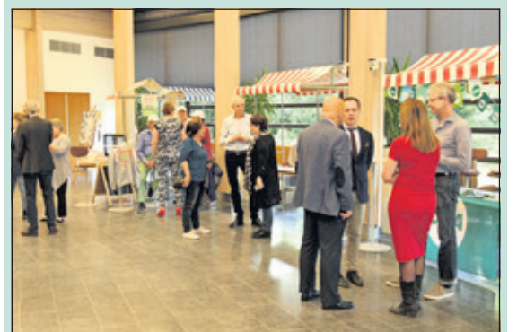
Een deel van de markt met de opstellingen van D66, Beter De Bilt en het CDA.

De Politieke Markt van alle in de gemeente actieve politieke partijen was een manier om alvast kennis te maken met de standpunten voor de Gemeenteraadsverkiezingen 2018. Men kon zaterdag 20 mei de markt bezoeken tussen 11.00 en 15.00 uur in het Gemeentehuis in Bilthoven en trof daar naast burgemeester Sjoerd Potters kramen met raadsleden, commissieleden en andere vertegenwoordigers van de fracties en politieke partijen in de gemeenteraad van De Bilt. Doel van de markt was om inwoners op informele wijze te laten kennismaken met de ideeën van de verschillende partijen, met de mogelijkheden om zelf actief te worden in de lokale politiek en met hoe die lokale politiek nu eigenlijk werkt. Helaas viel de opkomst tegen. Dit hield waarschijnlijk verband met de vele andere activiteiten en evenementen die deze zaterdag werden georganiseerd in gemeente De Bilt.