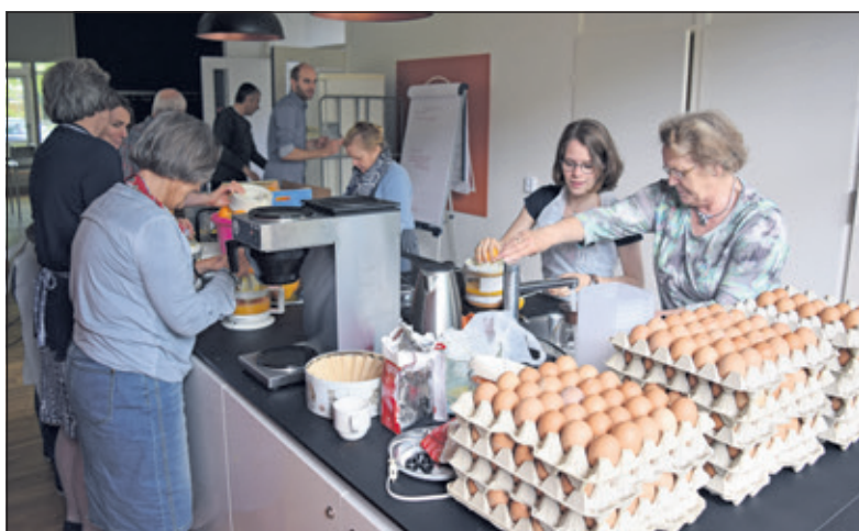
Er werden meer dan 1100 sinaasappelen geperst en 350 eieren gekookt.

Tot drie weken voor de ontbijtactie kon nog worden besteld. Daarna werd gekeken hoeveel bestellingen binnen waren en hoeveel fruit, brood en dergelijke moest worden besteld. Er werd contact opgenomen met de leveranciers en werd gezocht naar extra vrijwilligers om alles in goede banen te leiden. Kortom, een gigantische klus. 'Uit de laatste cijfers die ik heb zijn 433 ontbijtjes besteld, waarvan 200 voor de voedselbank', zegt Van Vulpen. 'Met behulp van onze bestellijst worden de bezorgroutes gemaakt'. Twee dagen voor de bezorgdag werden door vrijwilligers nog een paar honderd dozen en tassen gevouwen, en op vrijdag 1100 sinaasappelen geperst en alvast in de dozen gestopt, maar ook toen was de klus nog niet geklaard. Op de dag van bezorging werden ook nog even bijna 350 eieren gekookt. Om 5.00 uur 's ochtends stond iedereen alweer klaar, moesten zij alle eieren koken, broodjes ophalen bij de bakker en de laatste producten in de doosjes stoppen. Om 7.15 uur werden de ontbijtjes opgehaald door de chauffeurs en bij de adressen afgeleverd.