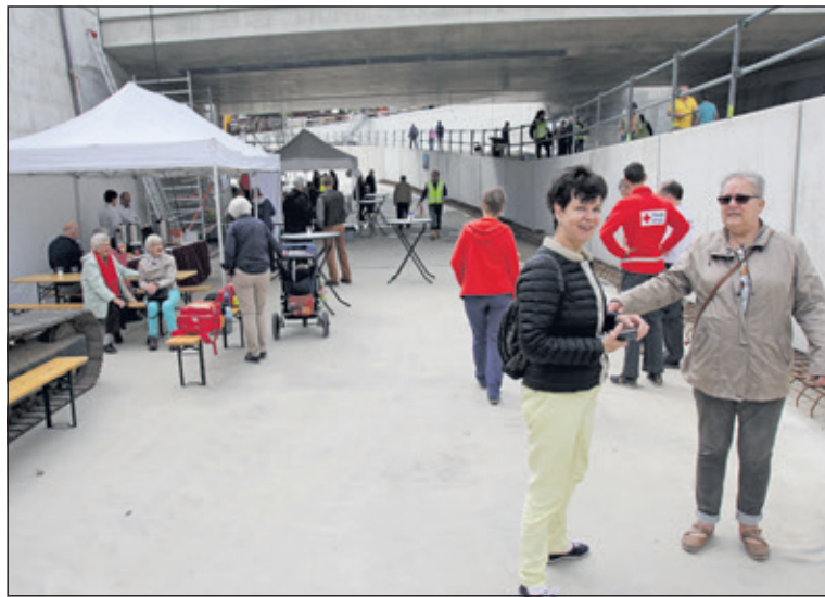
Men kon niet alleen zien hoe ver de bouw gevorderd is, maar kreeg ook uitleg over hoe de bouw in z'n werk gaat. De toegang was gratis en er viel een hoop te beleven voor jong en oud.

Iedereen kon een kijkje nemen achter de schermen bij de Onderdoorgang Leijenseweg in Bilthoven. Normaal is de toegang verboden, maar zaterdag van 10.00 tot 16.00 uur was de bouwplaats van Hegeman-Mobilis open voor publiek tijdens de Dag van de Bouw 2017.