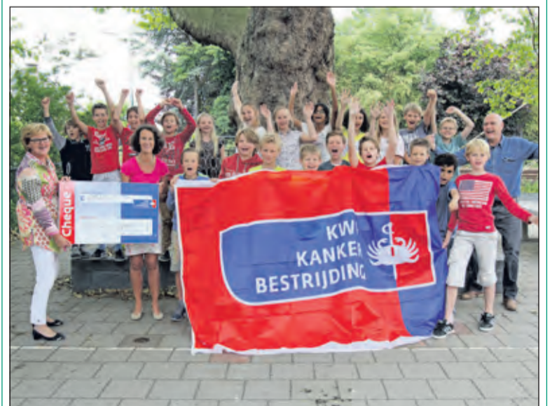
Iet en Nel bedankten de kinderen hartelijk voor deze grote inspanning met fantastisch resultaat en gaven de kinderen als dank ieder een KWF pen. De school ontving de KWF-vlag om op te hangen in de collectieweek van 7 t/m 12 september.