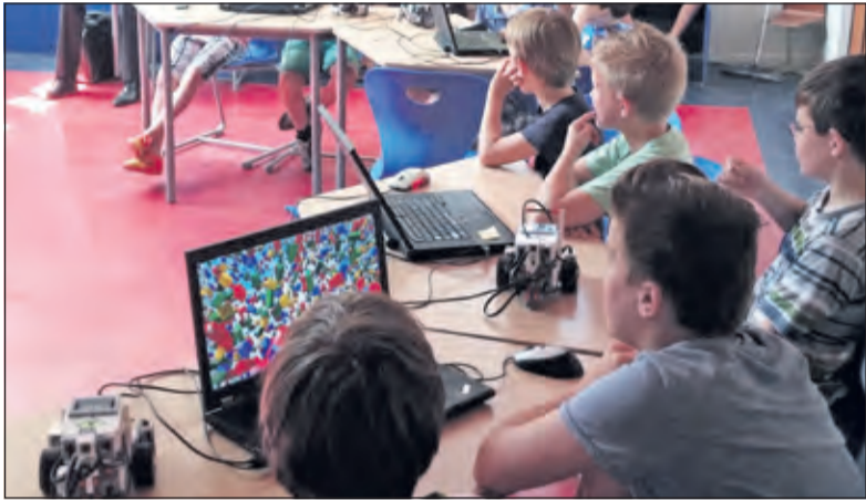
Leerlingen programmeren de LEGO robots.