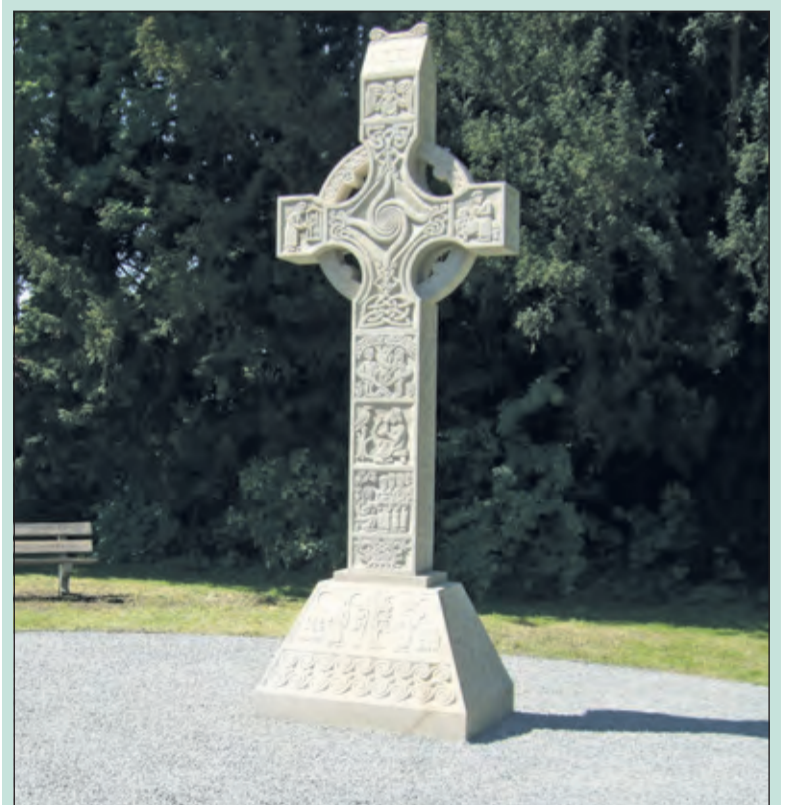
Zondag 5 juli wordt uitgebreid over de vele afbeeldingen op het hoogkruis verteld.

De uitleg bij het kruis in het Van Boetzelaerpark in De Bilt is van 15.30 tot 16.15 uur. Er wordt verzameld bij de Maria Christinakerk te Den Dolder (Dolderseweg 123), waar om 15.00 uur, per fiets naar het Bilts Hoogkruis wordt vertrokken. Voorkeur voor een andere wijze van vervoer: bel 06 44022190 of mail predikant@kerkdendolder.nl. Meer informatie is te vinden op www.kerkdendolder.nl.