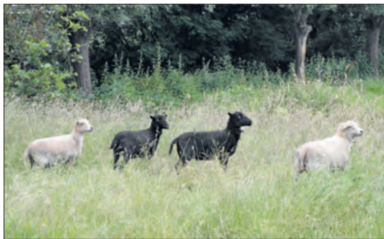
Flora en fauna in het zoddengebied vertedert, verbaast er verrast.

Westbroek [achter de praktijk van huisarts Mientjes]. Kosten: ANV leden: gratis, niet-leden betalen: € 2,50. Na afloop van de wandeling krijgt men koffie/thee aangeboden. Laarzen zijn tijdens de wandeling gewenst (Charlotte Kuijsten)