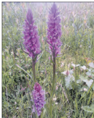
Tijdens de belevingsgericht zomerwandeling leer je met al je zintuigen van de zomer te genieten.