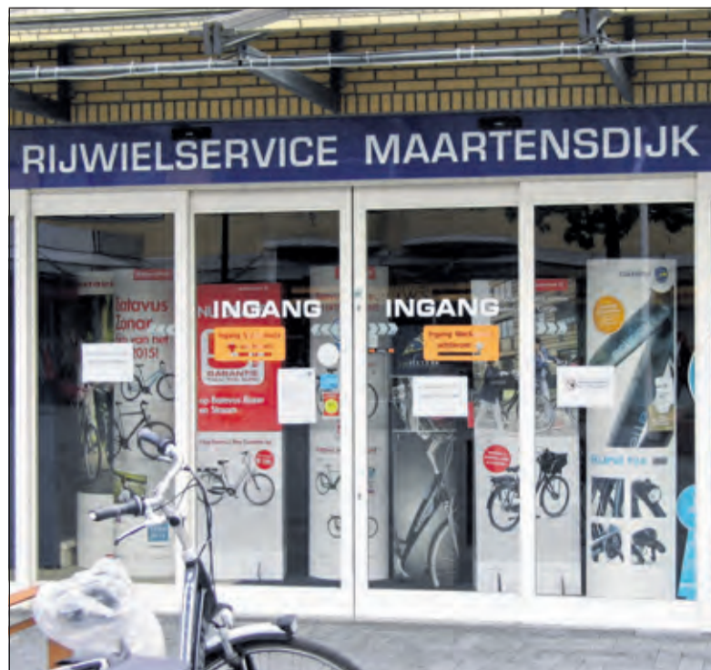
De deuren van de Rijwielservice Maartensdijk zijn definitief gesloten

op KvK-nummer 32158737 om de naam van de curator te achterhalen waarna verdere actie mogelijk zou moeten zijn. Ook de curator zal actie gaan ondernemen maar wellicht duurt dat langer dan wanneer men zelf contact zoekt.