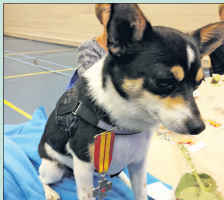
Ook Whisky heeft zich vier avonden prima vermaakt.

De avondvierdaagse 2015 in Maartensdijk zit er weer op. Er waren 519 inschrijvingen. Behoudens een enkeling, die niet gestart is, is iedereen weer behouden thuisgekomen. Het evenement kende uitstekend wandelweer met een enkele druppel op de woensdagavond en kan gekenmerkt worden als een geslaagd evenement voor Maartensdijk en omgeving.