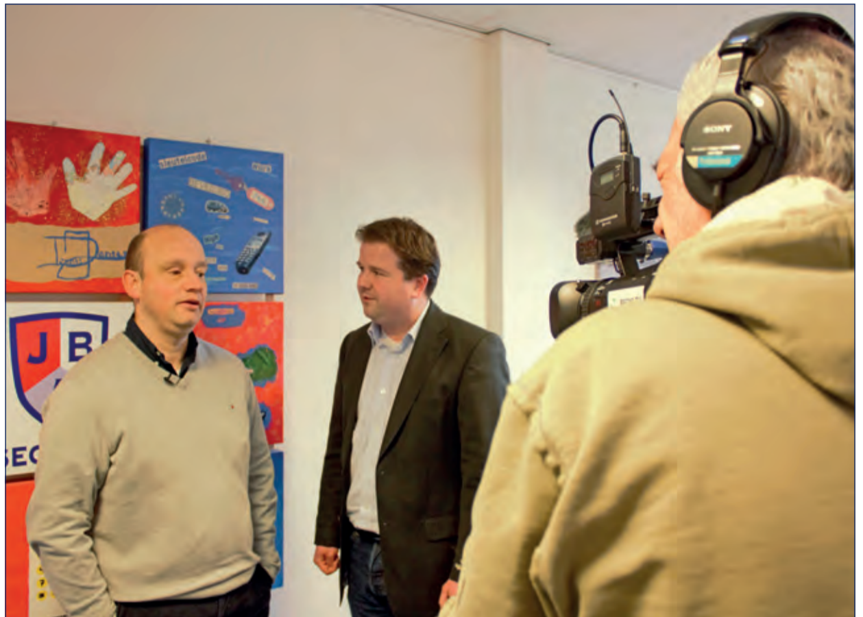
Komende vrijdag 26 juni start de 1ste aflevering van In de Kijker. Deze aflevering gaat over Innovatie bij JBA Security in Den Dolder. Een week later op 3 juli nemen we een kijkje bij de Chocolaterie van Top's Edelgebak. De uitzendingen starten op vrijdagavond vanaf 19u en worden een week lang elk uur uitgezonden.

Volgens recent onderzoek gaat 73% van de volwassen consumenten eerder tot aankoop over na het zien van een online video met een beschrijving van een product of dienst. Deelnemers aan het televisieprogramma 'In de Kijker' ontvangen een digitale kopie. Door deze op de bedrijfswebsite te plaatsen zal uw klant eerder geneigd zijn zaken met u te doen. Bovendien draagt een video op de bedrijfswebsite bij om uw vindbaarheid in Google substantieel te verbeteren, aldus Sander de Vos, producent van het programma.