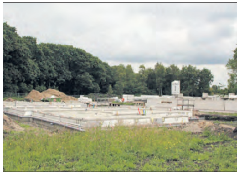
Op 20 mei startte de bouw van 12 woningen Bosrijck, De Leijen Zuid te Bilthoven.

Het ingediende beroep ging in op twaalf punten. Op elf punten is de gemeente in het gelijk gesteld. Op één punt is naar mening van de Raad van State de motivering nog onvoldoende onderbouwd. Het gaat dan om het aantonen van een regionale behoefte aan de woningen die gebouwd worden, zodat vraag en aanbod op de woningmarkt goed op elkaar aansluiten. Het bestemmingsplan is wel van kracht. De gemeente gaat de motivering aanvullen. Naar verwachting wordt dit begin oktober gepubliceerd. Als de Raad van State een positieve eindspraak doet, is het plan onherroepelijk.