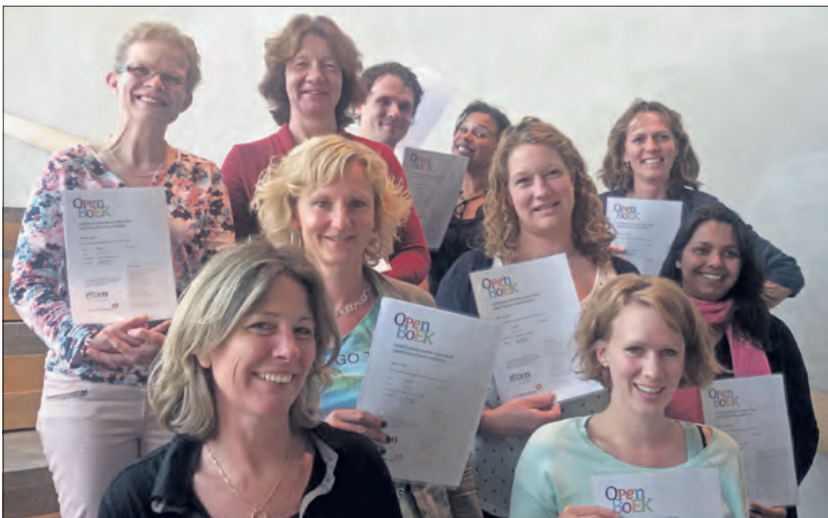
De leescoördinatoren blijven elkaar in een leesbevorderingsnetwerk onder leiding van Bibliotheek Idea ontmoeten. Zo wisselen ze met regelmaat kennis en ervaring uit over de aanpak van leesbevordering in het onderwijs.