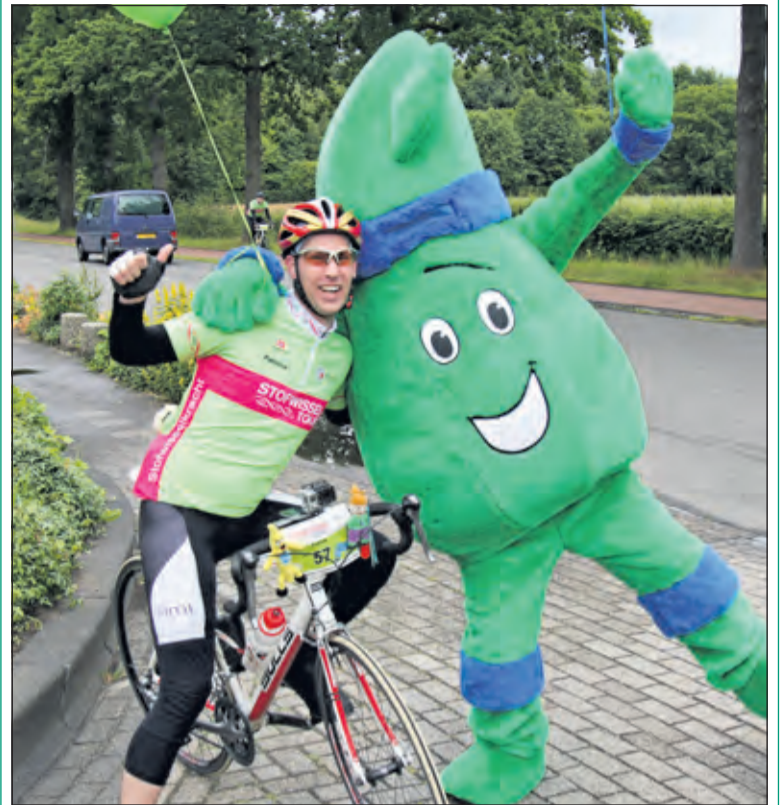
De Stofwisseltour deed zaterdag 20 juni De Bilt aan. Er was een korte tussenstop bij de Biltse Hoek met ballonnen voor kinderen en muziek. Vanzelfsprekend was de mascotte Victor van het stripverhaal er ook.