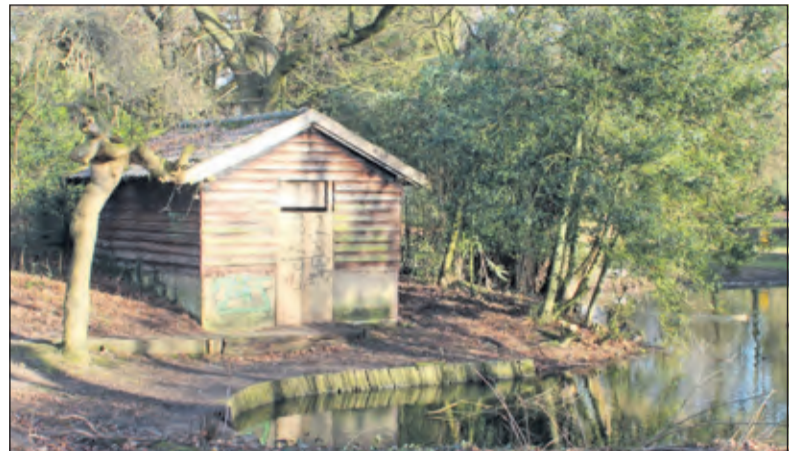
Na de ontmanteling kwam de voormalige gemeenteschuur tevoorschijn.