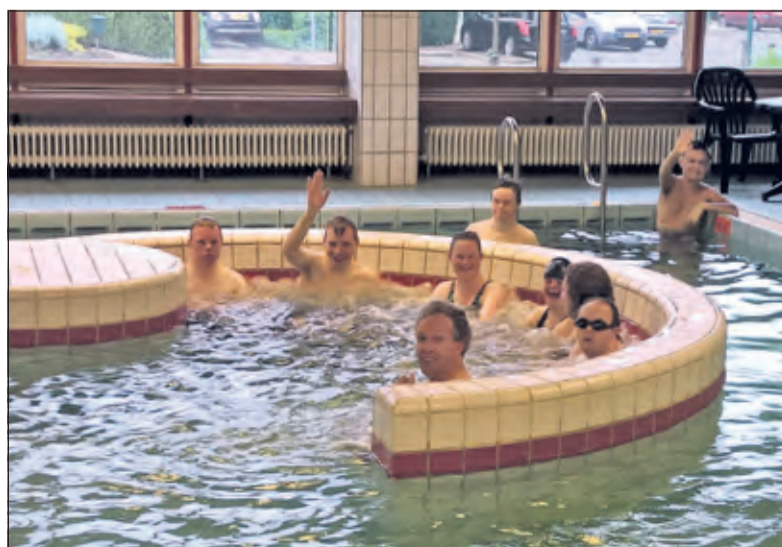
Sportstichting Samen Verder pleit voor een warm-water-bad.