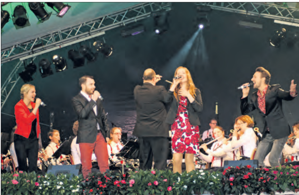
De jublieumviering van de KBH mondt uit in een waar feestje.

Het publiek genoot zichtbaar van de musicalsterren en het orkest op deze sfeervolle (maar soms wat natte) avond. Het orkest was deze avond ook bijzonder feestelijk gekleed met rode stropdas en bretels. Het publiek had ook zelf nog mee kunnen zingen met de aanwezige songteksten, maar was waarschijnlijk te druk bezig met luisteren naar de solisten. Het was een geweldig muzikaal verjaardagsfeest van de KBH. (Nynke Brouwer)