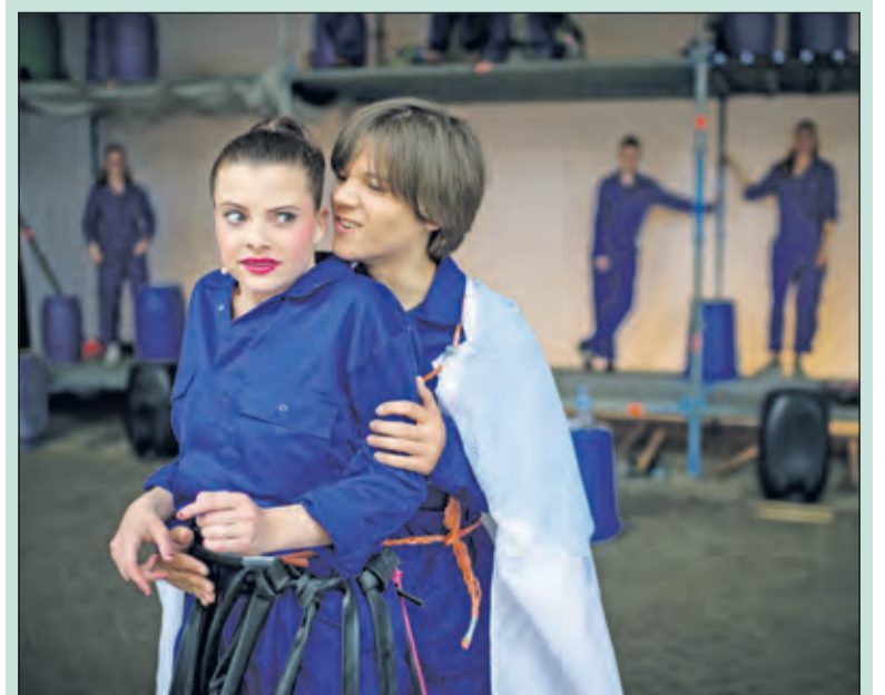
Jongeren van Theaterschool Masquerade spelen de voorstelling Richard Wie? op de Milieustraat in De Bilt.

In het stuk proberen 17 jongeren grip te krijgen op de oude tekst van Shakespeare. Af en toe stappen de spelers als zichzelf uit de voorstelling en leveren commentaar. Wat vertelt het oude verhaal ons in het hier en nu? De locatie, een loods op het afvalscheidingsstation en de afwisseling tussen modern taalgebruik en oude Shakespearetaal dragen bij aan de sfeer van het stuk. In deze bijzondere voorstelling werd een combinatie gemaakt van spel en dans en waren de kostuums en het decor geïnspireerd door de omgeving en dus gemaakt van afval. (Corinne Weeda, Kunstenhuis)