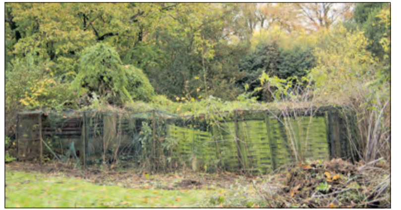
Volledig verscholen en nauwelijks zichtbaar de schuur in de oude eendenkooi.