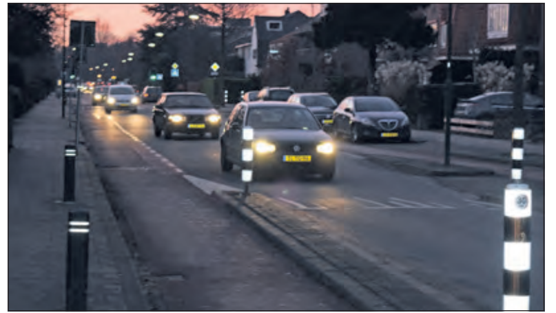
Thonissen: 'Automobilisten proberen nog even snel door die verkeerssluis te glippen, met vaak scheldpartijen als gevolg'.

de Zuid-ring. Met als gevolg dat ook dit verkeer hun route rijdt door de Dorpsstraat, Burgemeester de Withstraat en de Blauwkapelseweg.