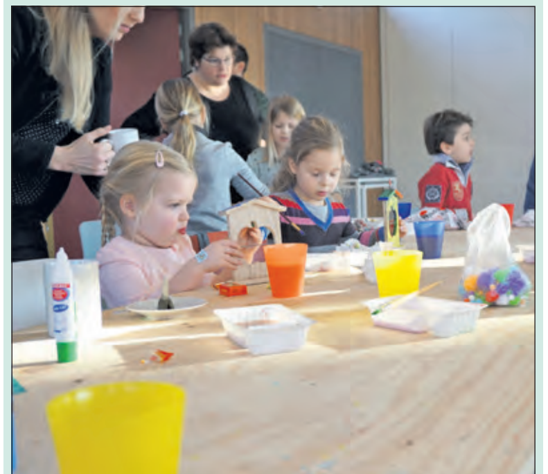
In opperste concentratie wordt er voor de vogels gewerkt.

Het Jeugd- en Jongerenwerk Hollandsche Rading organiseerde zaterdag jl. een gezellige creatieve ochtend voor kinderen van 3 tot 15 jaar. Er werd van half elf tot half een van alles voor de vogels gemaakt. Vogels, die nu het koud is, het wat moeilijk hebben. Zo werden er appelhuisjes versierd en beschilderd, popcorn geregen, dennenappels met vogelzaad gemaakt, poppetjes met vogelzaad gemaakt. Zo'n ruim vijftien kinderen deden er enthousiast aan mee. Na afloop gingen ze nog met z'n allen spelen op het ijs. [RK]