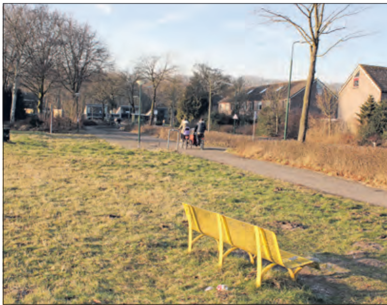
Op dit terrein aan de Berlagelaan (Bilthoven) tegenover het Kromhoutkwartier naast de fietstunnel naar de Noorderkroon staan 12 tijdelijke woningen gepland.