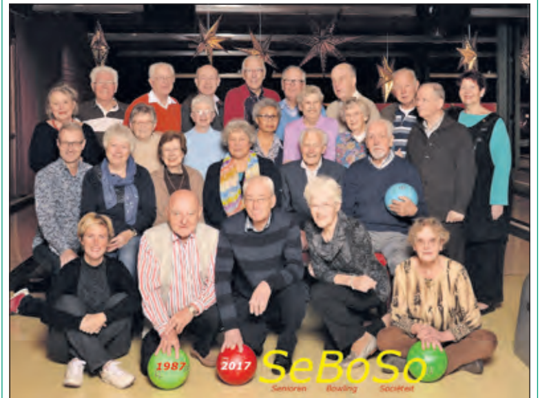
SeBoSo bowlt iedere donderdag aan de rand van De Bilt.

Uiteindelijk werd een nieuw onderkomen gevonden bij de Mitbanen van Hotel Mitland in Utrecht. Elke donderdagochtend van 10.00 tot 12.30 uur is alles voor SeBoSo gereserveerd: gratis parkeren, deuren geopend, koffie, thee of fris gereed en van 10.30 tot 12.30 uur bowlen. Ga gerust eens een keer kennismaken. Er zijn nog enkele plaatsen vrij. Voor meer informatie: secretaris J. van den Berg, tel. 030 6955206. of 06 19808007.