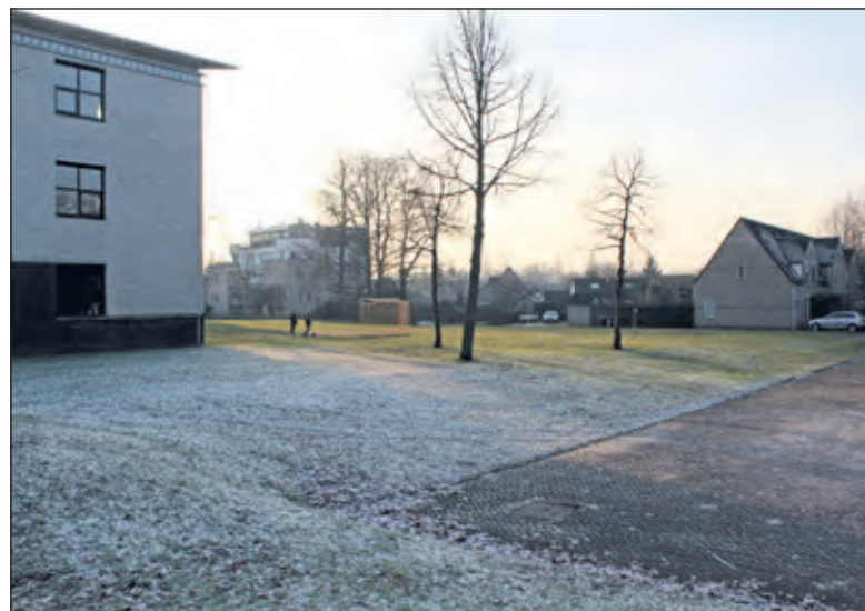
Zes tijdelijke woningen staan gepland aan de rand van het Burgemeester Fabiuspark in de achtertuin van het administratiekantoor van gemeentehuis Jagtlust in Bilthoven.

Op het voornemen van het college tot het aanwijzen van 7 locaties zijn bijna 200 reacties binnengekomen. De gemeente is blij met de grote inbreng van ideeën en suggesties en de respectvolle wijze waarop met elkaar in gesprek is gegaan. Het college van burgemeester en wethouders heeft een samenvatting ontvangen van de reacties, die zijn binnengekomen. Op 17 januari 2017 heeft het college mede op basis hiervan haar voornemen aangepast. Na definitieve besluitvorming door het college worden werksessies georganiseerd met omwonenden over de invulling van de locaties. Omwonenden kunnen zich aanmelden voor deze werksessies, zie www.debilt.nl/tijdelijkewoningen voor meer informatie.