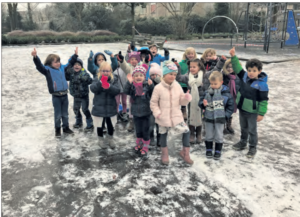
Kinderen van groep 1 en 2 op de veilige ijsvloer.

Op initiatief van een aantal ouders in Hollandsche Rading werd het basketbalpleintje aan de Adri Piecklaan begin vorige week onder water gezet. Zo ontstond er een prachtig ijsvloertje waar de kinderen veilig en naar hartenlust konden genieten. [RK]