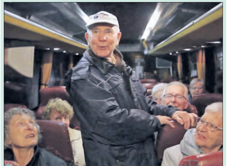
Tivoli maakt een uitje nog toegankelijker met de speciale Uit & Thuis bus voor senioren.

Het eerstvolgende concert met deze extra service is op zondag 5 februari om 15.00 uur. Het Orchestre des Champs-Élysées o.l.v. Philippe Herreweghe speelt dan de Achtste en Negende Symfonie van Beethoven. Voor meer informatie: www.uwuitenthuis.nl