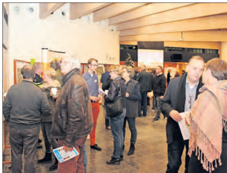
De eerste informatieavond in december werd goed bezocht.