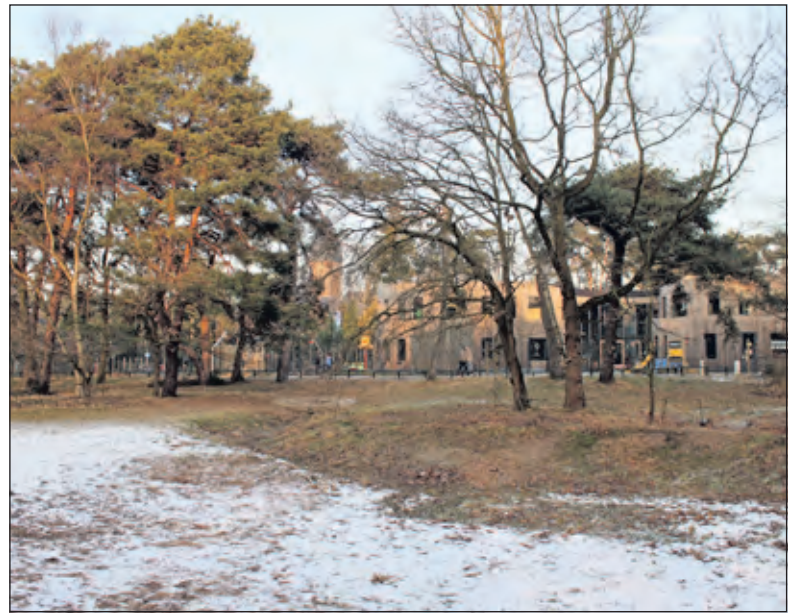
Bij het voormalig Biltsch Meertje wil het College 6 tijdelijke woningen plaatsen. De OLV-kerk en de Theresia-basisschool vormen een prachtige achtergrond.

Menno Boer namens de SP: 'Bezuinigen of luisteren? Het is wel heel toevallig dat de twee kleinste (en dus duurste!) locaties ineens