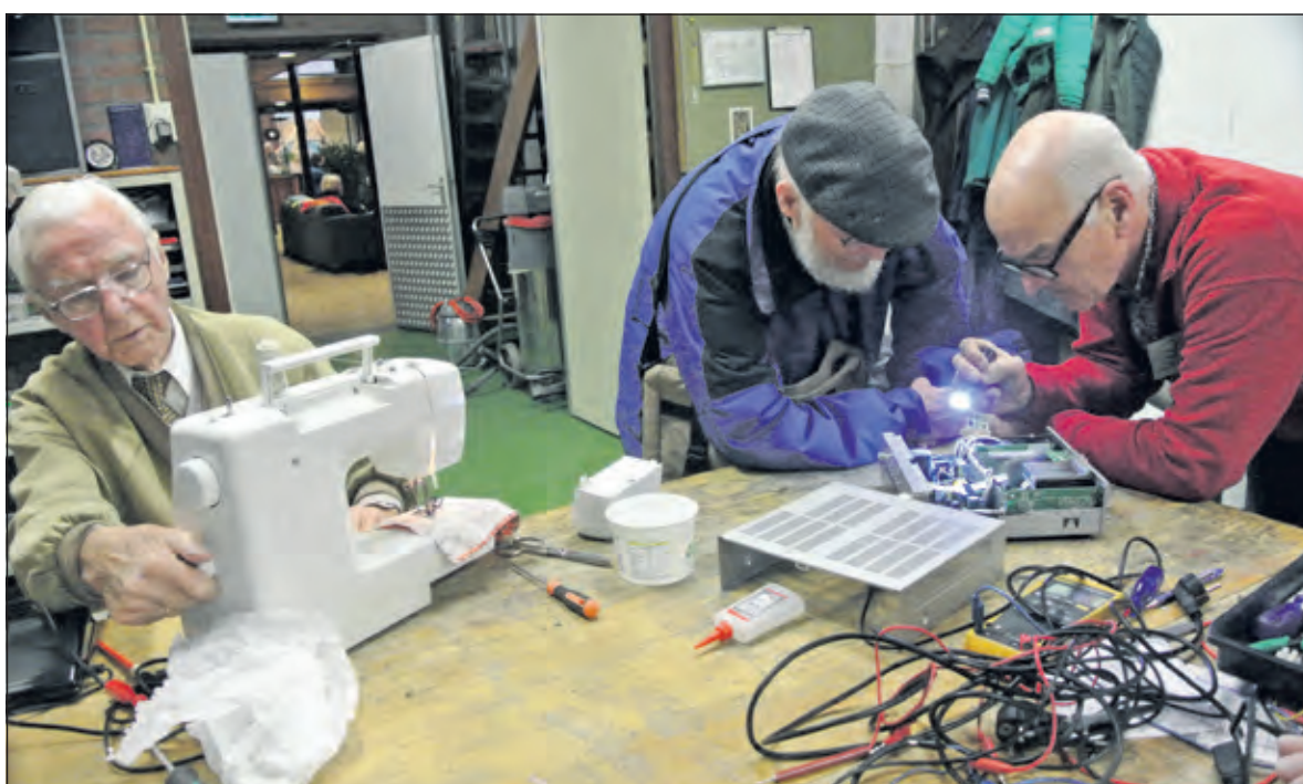
Kapotte spullen krijgen een tweede leven in het Repair Cafe.

Meer informatie op: repaircafebilthoven.wordpress.com/