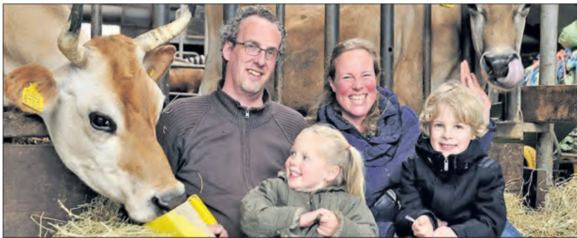
De nieuwe bewoners van boerderij De Tolboom.

gedeeltelijk ingeklemd tussen Hollandsche Rading en Lage Vuursche. Eyckenstein wil de belasting van de natuur door intensief landbouwverkeer dwars door natuurgebied zo veel mogelijk beperken. Grote machines veroorzaken onrust in het gebied en kruisen fiets- en wandelpaden, waardoor bezoekers van het landgoed hinder ondervinden. De smalle strook tussen Lage Vuursche en Hollandsche Rading vormt de natuurverbinding tussen Utrechtse Heuvelrug en Goois Natuurreservaat. Hierin ligt ook nog 12 ha landbouwgrond. Om een robuustere verbinding te realiseren voor fauna zou deze landbouwgrond omgevormd moeten worden naar natuur. Landgoed Eyckenstein getuigt zich veel inspanningen en kosten, zodat bezoekers ongestoord van natuur kunnen genieten en tot rust komen en dat ook de natuur zelf zich voldoende kan ontwikkelen. Hierbij is het van belang dat Eyckenstein toekomstbestendig is. Onlangs heeft de provincie ingestemd om deels bij te dragen aan de plannen. Om het gehele natuurbeheerplan ook financieel uitvoerbaar en sluitend te krijgen, wordt met gemeente De Bilt overlegd over de realisatie van Boomhutten. Ultieme natuurbeleving