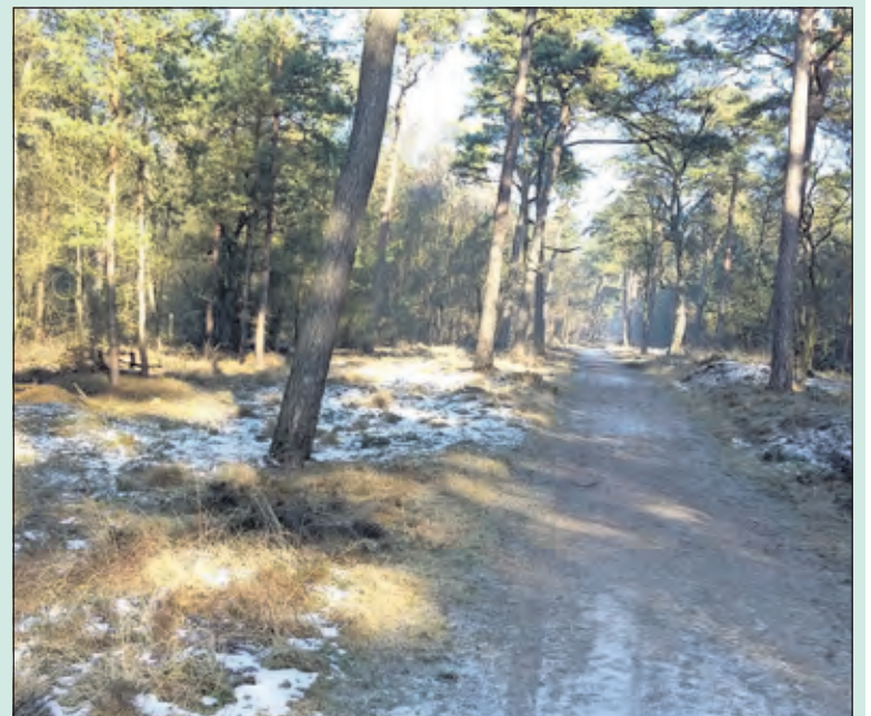
Winterse schoonheid in de bossen bij Hollandsche Rading.

Bewoners van woonwijk De Leijen zullen wat langer om moeten rijden de tunnelopening liep eerst flink uit gelukkig klinkt nu een ander geluid zo gaat dat soms bij grote karweien