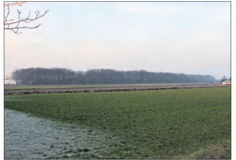
Het Dassenbosje, gezien vanaf de Tolakkerweg, met rechts de kassen van de Orchideeën-kwekerij Wubben.

Boomhutten aan de Eikensteeg moeten gaan zorgen voor een rijke ervaring voor mensen die de natuur heel intensief willen beleven. De boomhutten met douche, maar zonder keuken zijn geschikt voor 2 tot 4 personen en bieden midden in het bos een ultieme natuurbeleving. Voor de bezoekers van het landgoed een nieuwe mogelijkheid om de schoonheid van de Maartens-