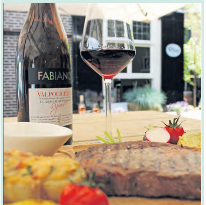
Bij Amis weten ze je op culinair gebied altijd te verrassen.

Een borrel met garnituur. Een wijntje met kleine gerechtjes. En als je meer trek hebt, serveren ze meer gerechtjes. Niets is onmogelijk, alles kan. Bij Amis stap je in een warme en stijlvolle huiskamersfeer en geniet je van een heerlijke lunch of diner. Of kies je voor de heerlijke specialiteiten om samen te delen met je Amis onder het genot van een glas wijn of Utrechts bier. De medewerkers van Amis halen alles uit de kast om je comfortabel te laten genieten van culinaire gerechten. Buiten de kaart om serveren zij altijd wisselende seizoensgerechten. Amis is één van de deelnemers aan het kortingsbonnenboekje dat de bezorgers als eindejaarsgroet huis-aan-huis verspreid hebben en tegen inlevering van de bon ontvang je maar liefst € 10,- korting op de rekening (vanaf € 50,- en geldig t/m 1 maart). U vindt restaurant Amis op de Dorpsstraat 81-83 in De Bilt.