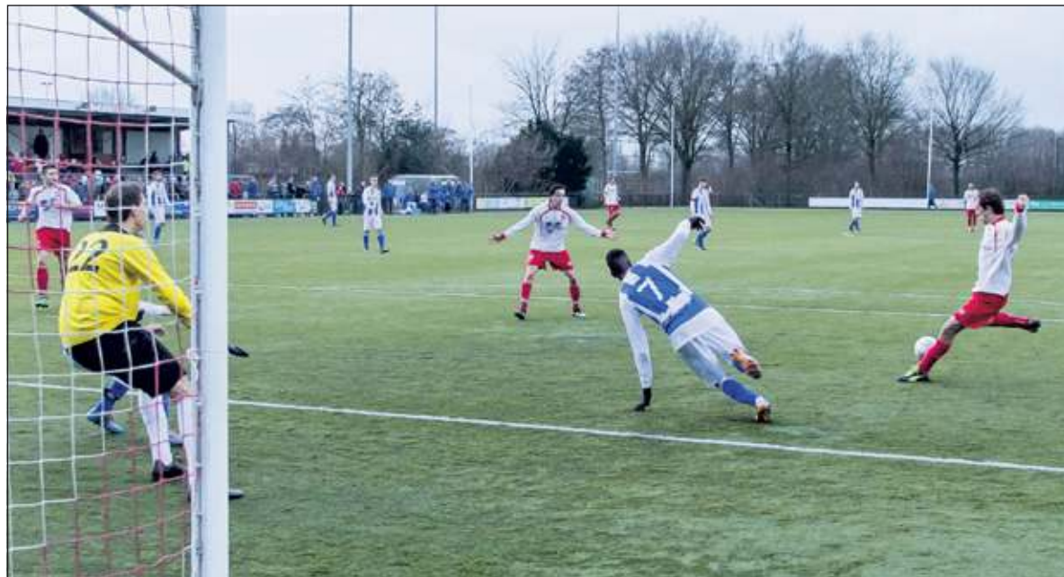
FC De Bilt werkt hard om 3 punten mee naar huis te kunnen nemen.

Kort na rust kreeg FC De Bilt enkele echte kansen. Tot de 66e mi-