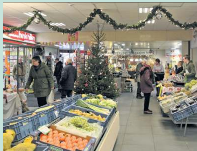
In veel winkelcentra in de gemeente was het afgelopen weekend ouderwets gezellig. Zo ook in het overdekte winkelcentrum De Planetenbaan, waar de winkeliers een Kerstmarkt organiseerden.