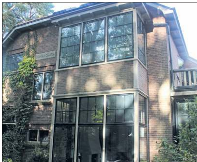
Langs de Lassuslaan zijn zowel de gevel als de gedenkplaat van perceel 93 grotendeels aan het zicht onttrokken.

Marijke Bertrams: 'In een rustig tempo hebben we de noodzakelijke restauratie uitgevoerd, met zoveel mogelijk handhaving van het oorspronkelijke karakter. We voelen ons erg gelukkig in dit huis en de grote tuin die we zo lang het kan zelf onderhouden'.