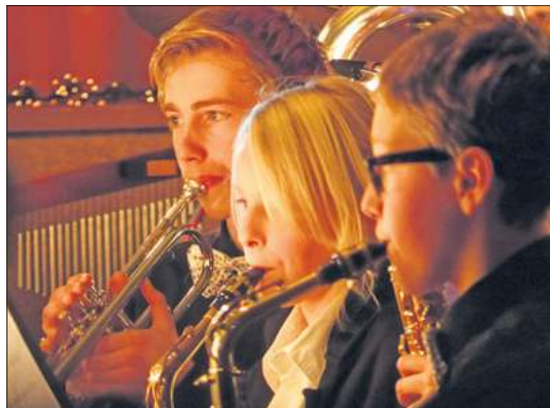
Jonge leden van Vriendenkring geconcentreerd aan het werk.

met elkaar een mooie avond. Ook de Kerstzangdienst in de NH kerk komende zaterdag zal Vrienden- en aansluitend de Kerstborrel in het kring medewerking verlenen aan dorpshuis.