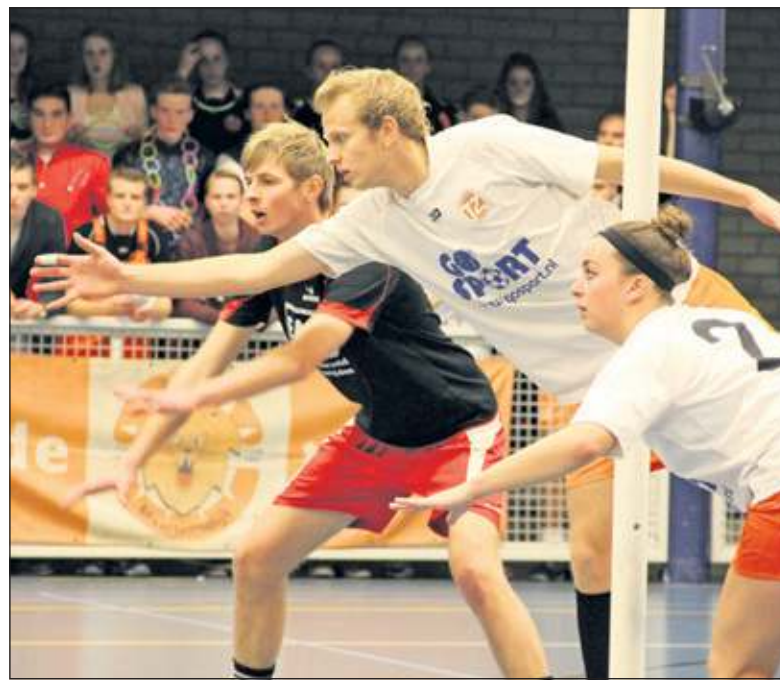
Tweemaal Zes. Duel om de aangeefpositie

De uiteindelijke 15-23 uitslag was veelzeggend en terecht. De zeperd kan zonder gevolgen blijven, TZ kan in februari 2015 revanche halen bij de return in Zeeland. Maar dan zal de ploeg wel uit een ander vaatje moeten tappen, want met het niveau van zaterdag wordt het ook komende week bij outsider Oost Arnhem nog lastig.