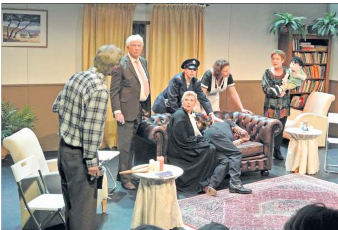
Het toneelgezelschap Steeds Beter voerde vrijdag en zaterdag het blijspel 'De Rechter en de Linker' op. Beide avonden was de zaal goed gevuld met publiek dat zich vermaakte aan het kolderieke stuk, waarin ook spannende scènes zaten. De acteurs speelden hun rol op een levensechte manier en hielden daardoor de hele avond de aandacht van het publiek vast. Het langdurige applaus was dik verdiend. (Frans Poot)