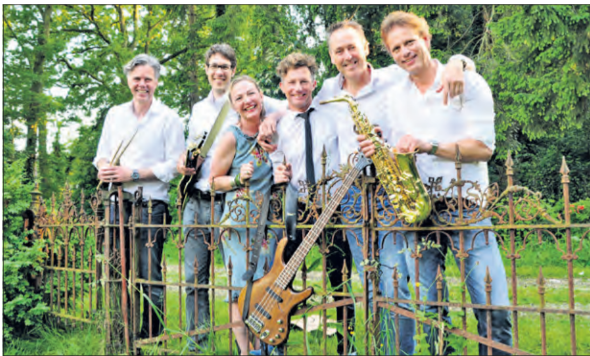
ChespaJazz uit De Bilt weet heerlijke ritmes te raken.

Bij slecht weer wordt het concert verplaatst naar de Immanuëlkerk, Soestdijkseweg Zuid 49, 3732 HD De Bilt. De beslissing hierover valt 's-ochtend rond 12.00 uur. Het laatste concert van dit seizoen is op zondag 18 september. Voor inlichtingen of aanmelding voor optredens: 06-51229733 of www.zomerconcertendebilt.nl .