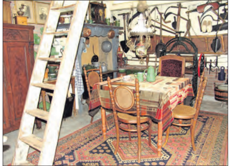
Interieur met de steektrap naar zolder in het museum.