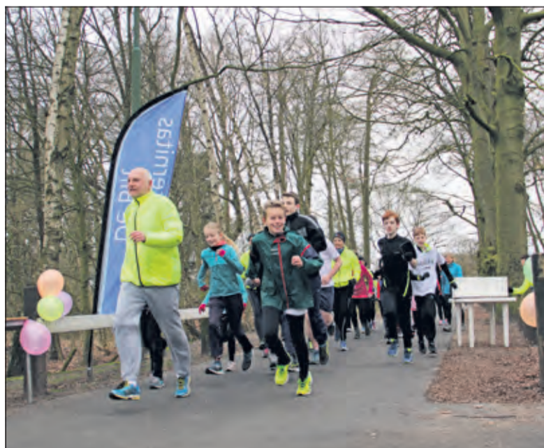
Fraternitas rent het jubileumjaar tegemoet.

Wellicht ben je gemotiveerd door de Olympische Spelen door sporters als Sanne Wevers, Epke Zonderland of Dafne Schippers. Dit geldt voor jeugd, maar ook voor volwassenen die de draad van het turnen, hardlopen of wandelen in clubverband (weer) willen oppakken in een aansprekende en gezellige omgeving.