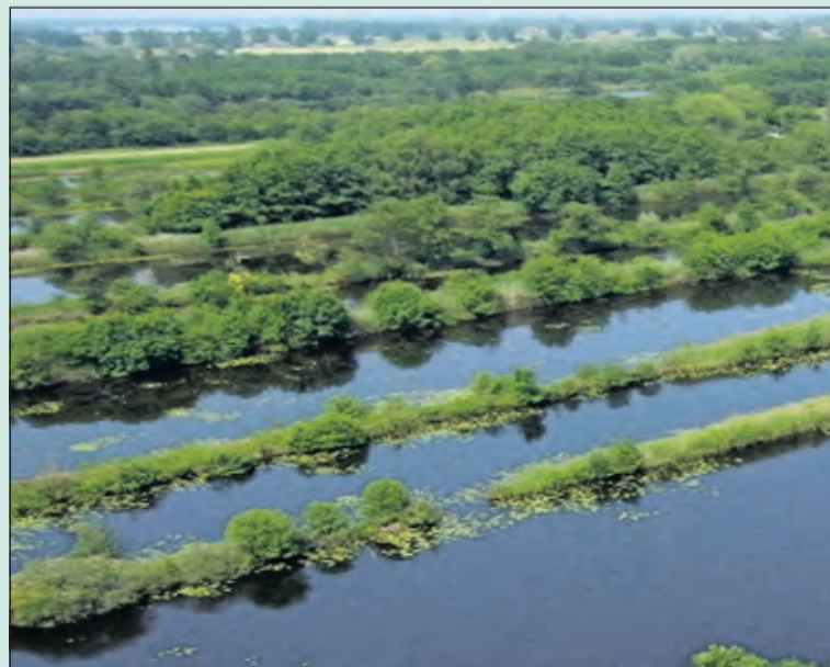
Op een fluisterboot door de Molenpolder trekt een bijzonder landschap voorbij.

Op 24 augustus organiseert Staatsbosbeheer vaartochten door de Molenpolder, een kleinschalig natuurgebied vlak boven Utrecht. In een stille fluisterboot kom je tot rust, en geniet je van het uitzicht over de petgaten en legakkers van dit oude veenlandschap. Samen met de gids naar de dieren in dit gebied, zoals ringslang en purperreiger, en maak een tussenstop bij het trilveen: ervaar hoe dit 'drijvend land' loopt. Aanvangstijd 10.00 uur. Meer info en reserveren via www.staatsbosbeheer.nl . Met je eigen groep een vaartocht doen? Informeer via utrechtwest@staatsbosbeheer.nl .