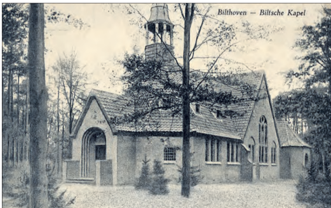
De Biltsche Kapel in 1920

Bezichtiging van het gebouw kan vanaf 10.00 uur. Er is ook een folder beschikbaar met informatie over de Zuiderkapel, PKN Bilthoven en wijkgemeente De Ark. Om 15.00 uur is er een muzikaal moment, instrumentaal en vocaal.