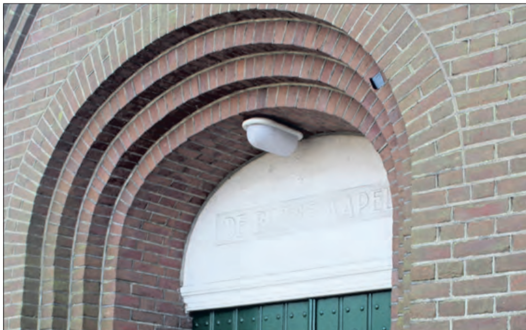
Om de oude naam niet te vergeten werd er boven de hoofdingang een steen aangebracht met de inscriptie De Biltsche Kapel.

Wil jij ook Vierklank bezorger worden? De onderstaande wijken zijn nog beschikbaar!