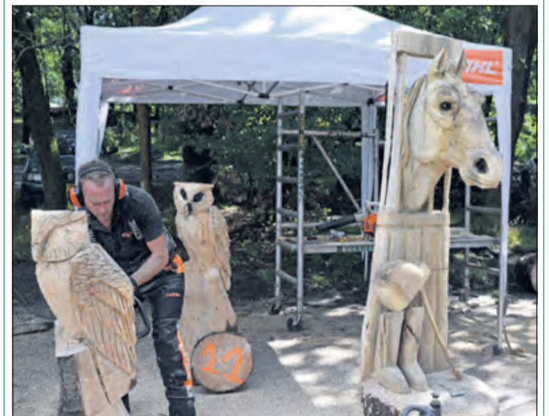
Een van de deelnemers legt de laatste hand aan zijn sculptuur.