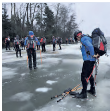
Schaatsen op natuurijs