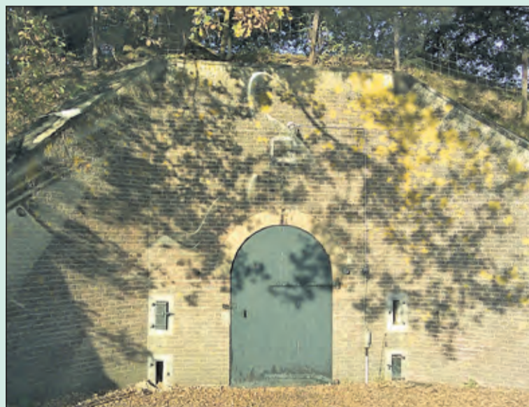
Fot Ruigenhoek is een bezoekje waard.

Fort Ruigenhoek is onlangs gerestaureerd en zeker een bezoek waard. U kunt het fort verkennen met de gids van Staatsbosbeheer en van alles te weten komen over de geschiedenis. Fort Ruigenhoek speelde vroeger een belangrijke rol bij de verdediging. U bent van harte welkom op zaterdag 27 augustus om 13.30 uur. De rondleiding duurt ca. 1.5 uur. Aanmelden hoeft niet. U kunt gewoon op de genoemde dag en tijd naar het fort gaan, waar de gids bij het hek op u wacht. Kijk voor meer info op www.staatsbosbeheer.nl/activiteiten . Wilt u met een eigen groep een rondleiding boeken, mail dan naar utrechtwest@staatsbosbeheer.nl en vraag naar de mogelijkheden. Adres: Ruigenhoekse Dijk t.o. 125a, Groenekan.