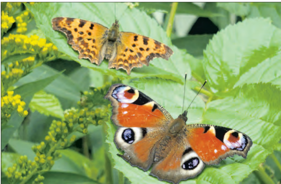
Dankzij het beheer en de verbeterde waterkwaliteit komen er op het landgoed steeds meer vlindersoorten voor.