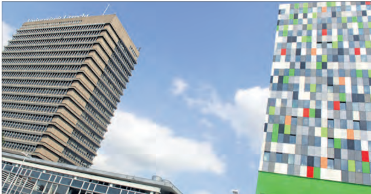
Het mooiste studentencomplex ter wereld, Casa Confetti, staat op het USP en vormt het bewijs dat hoogwaardige en betaalbare huisvesting wel degelijk kan samengaan met uitzonderlijke architectuur.