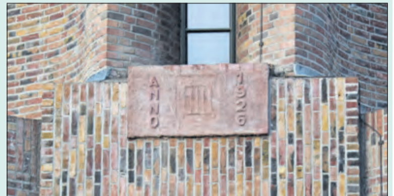
De toren is in 1926 gebouwd in opdracht van de Utrechtse Waterleiding Maatschappij getuige de fraaie gevelsteen boven de ingang.

De watertoren heeft een hoogte van 42 meter en een waterreservoir van 300 m 3 . De huidige eigenaar Waterleidingbedrijf Vitens heeft in 2006 de watertoren laten renoveren. De toren is sinds 2008 een gemeentelijk monument. Het terrein rond de watertoren is zelden toegankelijk, maar zal op de Open Monumentendag op 10 september geopend zijn van 10.00 tot 16.00u.