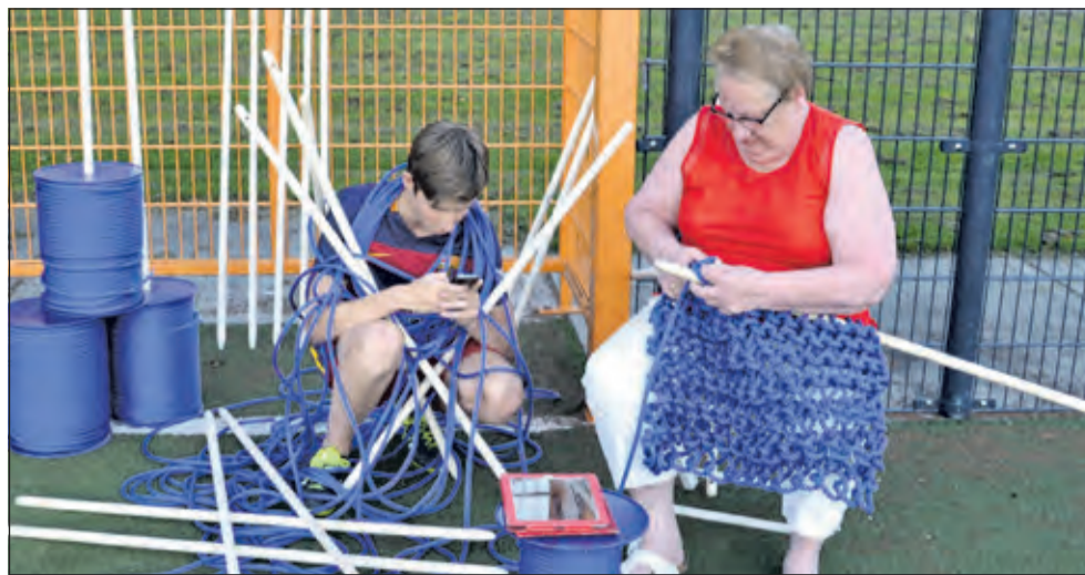
Oud leert jong breien