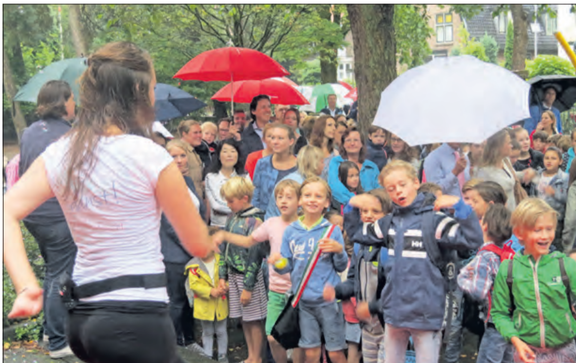
Voorafgaand aan de officiële opening wordt een warming up gehouden.