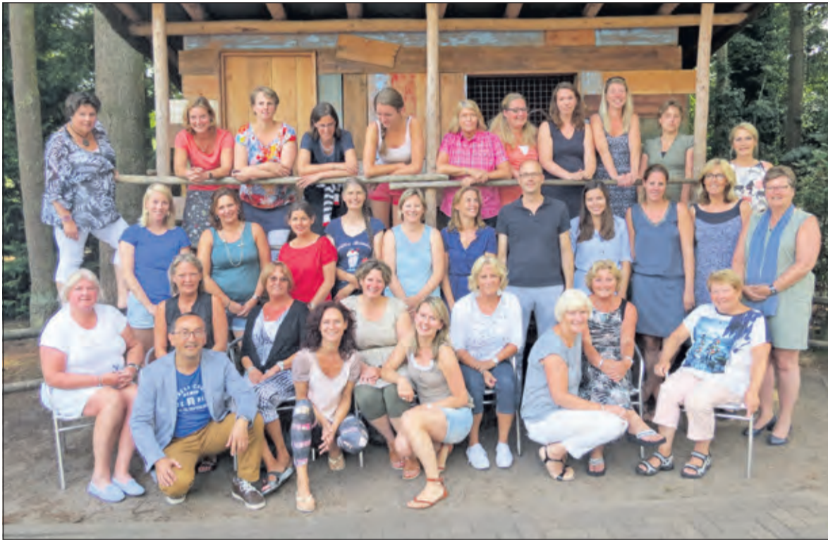
Het team van de Julianaschool begon het schooljaar in Dierenpark Amersfoort.