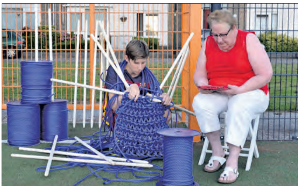
Jong maakt oud wegwijs op tablet.