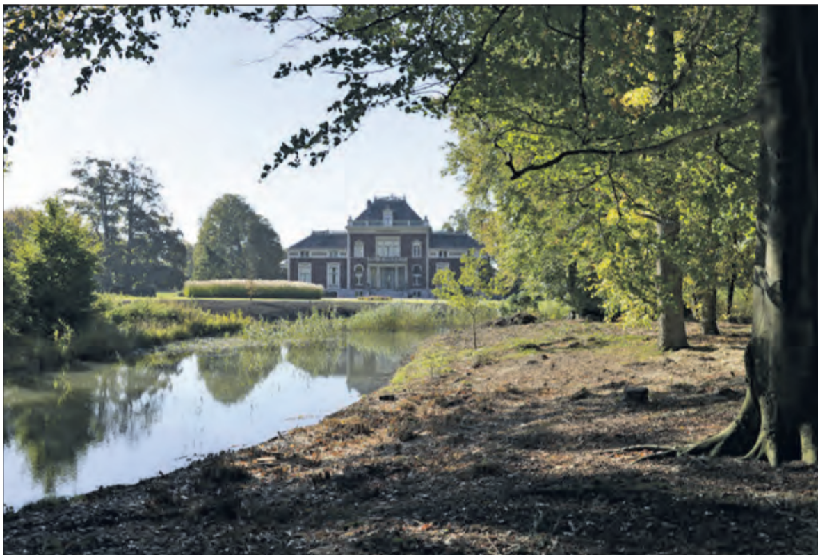
Tijdens de nacht van de buitenplaats zal het landgoed prachtig verlicht zijn.

Deze activiteit is gratis. Aanmelden is noodzakelijk en aan een maximum verbonden. Kijk voor meer informatie over het programma en om u aan te melden op: www.nachtvande-buitenplaats.nl .