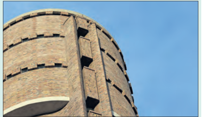
De 42 meter hoge watertoren is kokervormig en voorzien van verschillende kleuren baksteen. De golvende gevels eindigen in uitsparingen waarin kleine raampjes en verticale baksteenelementen verwerkt zijn.

De watertoren, gelegen aan de burgemeester van der Borchlaan 33 in Bilthoven is op Open Monumentendag 10 september a.s. geopend.