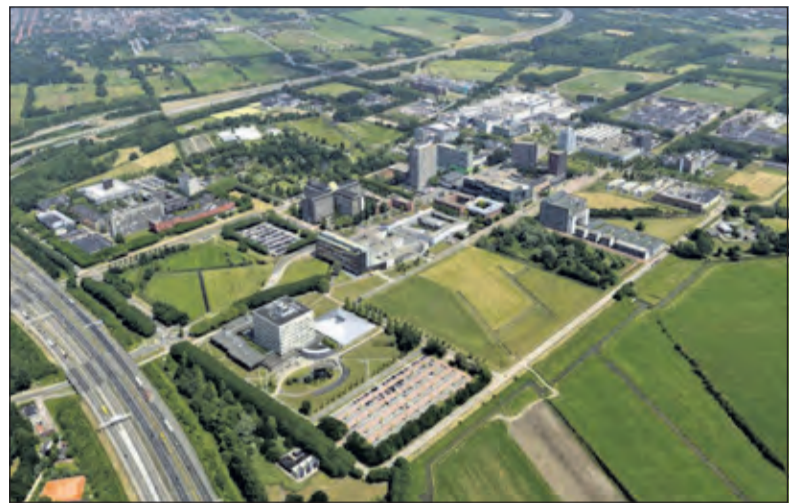
Utrecht Science Park van bovenaf.

ence Park aanwezig zijn dragen bij aan een gezonde en duurzame maatschappij en maken Utrecht tot de meest competitieve regio van Europa.