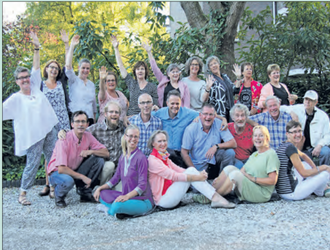
Kamerkoor De Bilt werkt met het thema liefde voor een uitvoering in mei 2017.

Kamerkoor De Bilt is een enthousiast en gezellig koor en op dit moment met name op zoek naar alten en bassen. Het repertoire van het volgende project zal onder andere bestaan uit het stuk 'Zo verliefd op elkaar' van Ad Wammes, geschreven voor koor en accordeon op een tekst van Annie M. G. Schmidt. De repetities zijn elke maandagavond van 20.00 tot 22.15 uur in de Immanuëlkerk, Soestdijkseweg 49a, De Bilt. Ga gerust een keer kijken of meezingen. Meer informatie op www.kamerkoordebilt.nl .