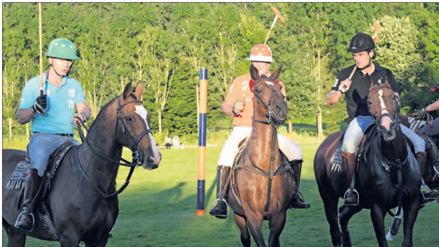
Iedere woensdagavond wordt er op de poloclub in Groenekan getraind.

Tegenover 'Naast de Buren', aan de Groenekaneweg in Groenekan is een poloveld te vinden. Een locatie met 12 hectare, een boerderij en stallen voor paarden. Iedereen die iets met paarden heeft kan hier de polospport onder de knie krijgen of gewoon leuk vrijwilligerswerk doen.