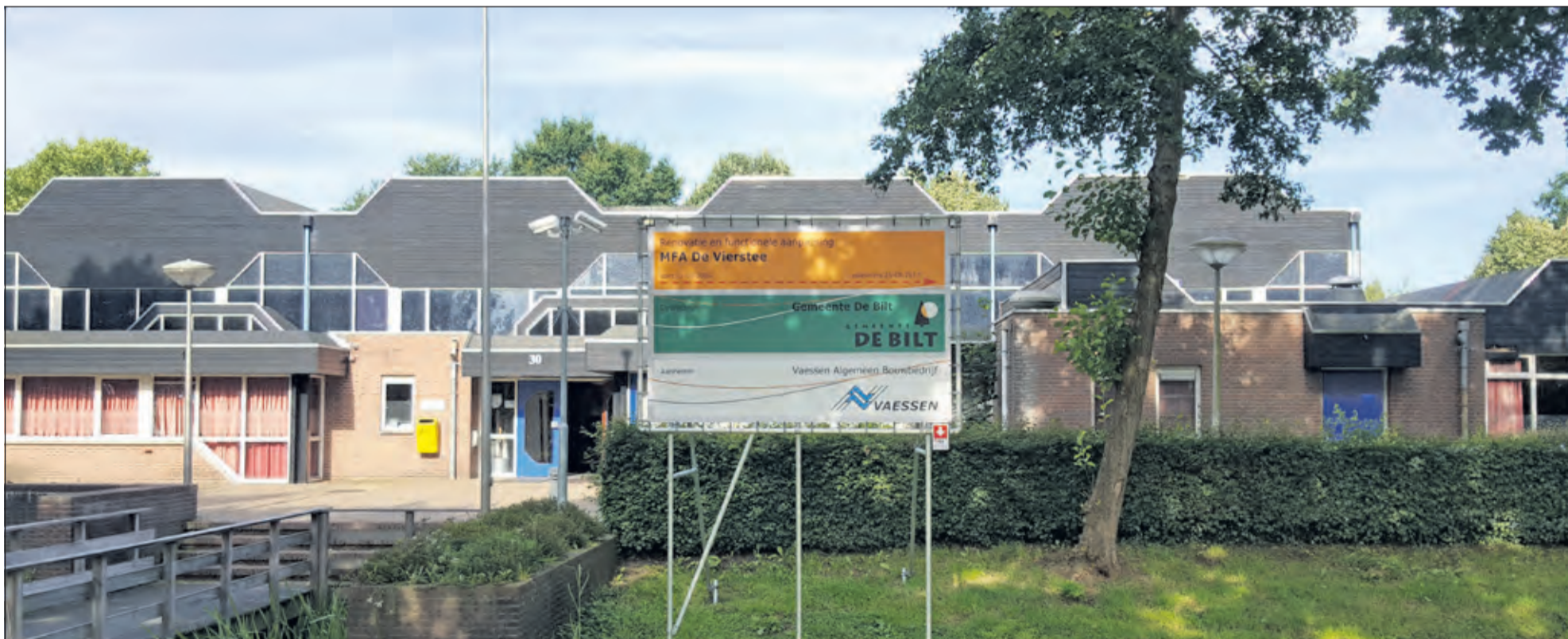
Renovatie van de Vierstee vindt nu werkelijk plaats.