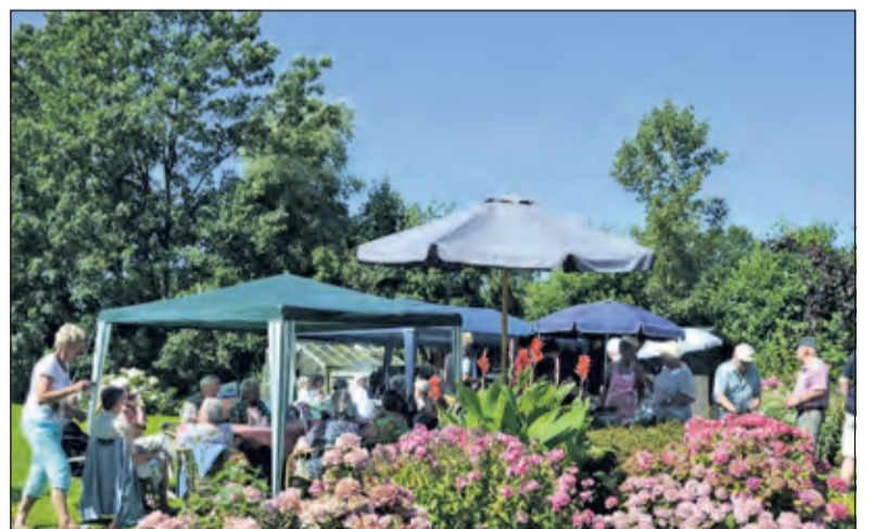
Optimale weersomstandigheden tijdens de high tea in Westbroek.

Kalisvaart en een aantal mensen van de Zonnebloem hadden de tuin prachtig ingericht met lange tafels, overdekt met parasols.