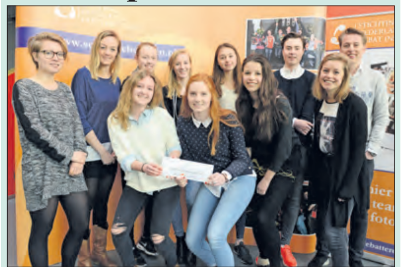
Op vrijdag 11 maart vond in Purmerend de negende editie van het landelijke VMBO Debattoernooi plaats. Na drie spannende debat rondes eindigde de Werkplaats Kindergemeenschap uit Bilthoven welverdiend op de 19e plek.