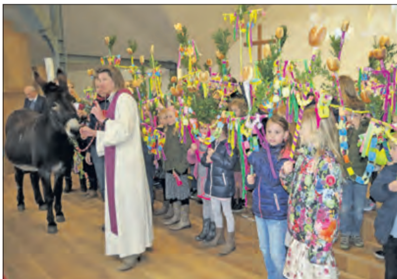
Aandachtig luisteren de kinderen naar het verhaal van de dominee.

'Maar in de hemel zagen de engelen de ezel en dachten, die is zo bescheiden en zorgt zo goed voor de mensen, die willen we wel een plekje in de hemel geven', vertelt de dominee. 'Ze nodigden de ezel uit en bij de hemelpoort gekomen duwt hij met zijn neus de deur van de poort een beetje open. Wat hij ziet is schitterend. Grazige weiden met klavertjes vier, boeken met ezelsoren en een heleboel beekjes en meertjes met ezelsbruggetjes.