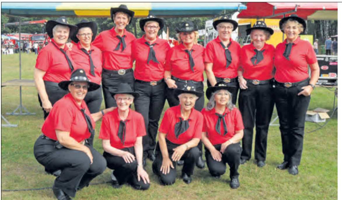
De Country Line Dancers Born Country geven regelmatig demonstraties in het land.

Country Line Dancers Born Country uit Maartensdijk houdt op zaterdag 9 april in De Vierstee te Maartensdijk een 50+ Country Line Dance dag. Er worden kleine demonstraties geven