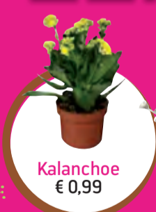
Kalanchoe € 0,99