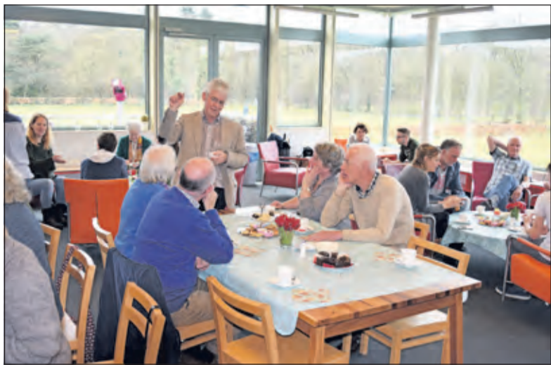
Wijkbewoners genieten van een high team op De Werkplaats in Bilthoven.

Vrijdag 18 t/m zondag 20 maart kon weer worden meegegeten bij 'onbekende bekenden'. Vele gastgezinnen nodigden mensen uit de straat of uit de buurt uit om, bij een hapje en een drankje elkaar eens beter te leren kennen. Ook de gemeente De Bilt en de Werkplaats uit Bilthoven waren van de partij.