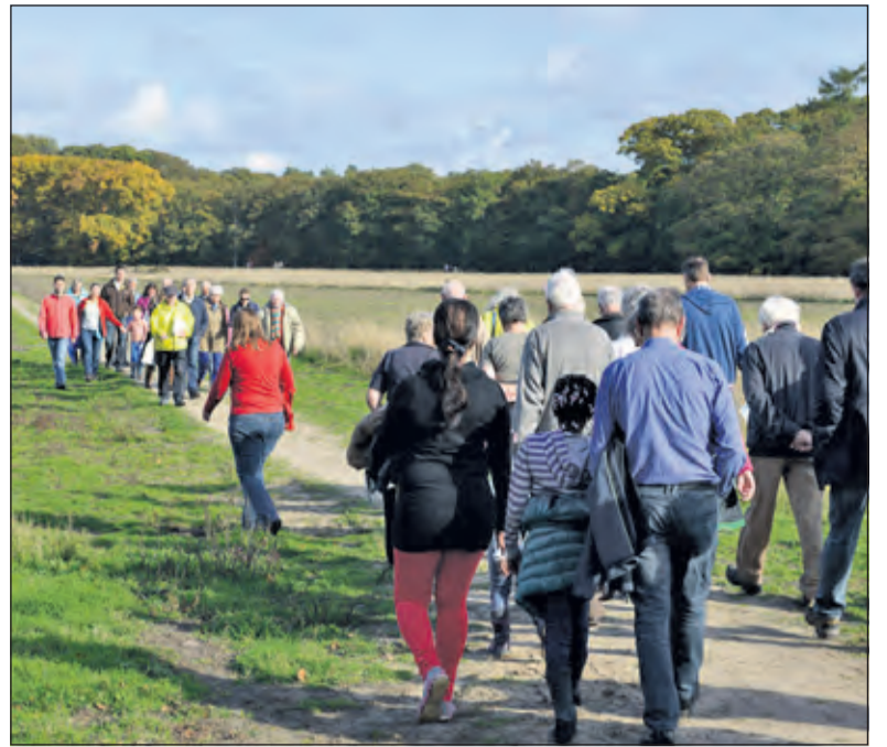
Op beide paasdagen wordt een wandelexcursie georganiseerd.

Het is lente en het blijft altijd boeien dat alles opnieuw weer gaat groeien een nieuw geluid weer alles loopt uit en in het najaar gaan we het snoeien