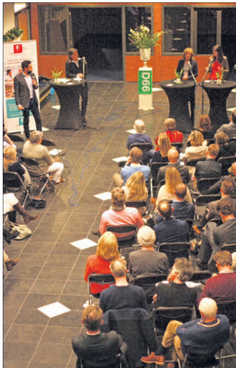
Volle zaal in gesprek over digitale zorg.

Deze bijeenkomsten hebben als doel om het contact tussen politiek en burger te stimuleren, om afstanden te verkleinen en om politici te laten weten wat er leeft, zodat ze daarnaar kunnen handelen. (Erik de Rie)