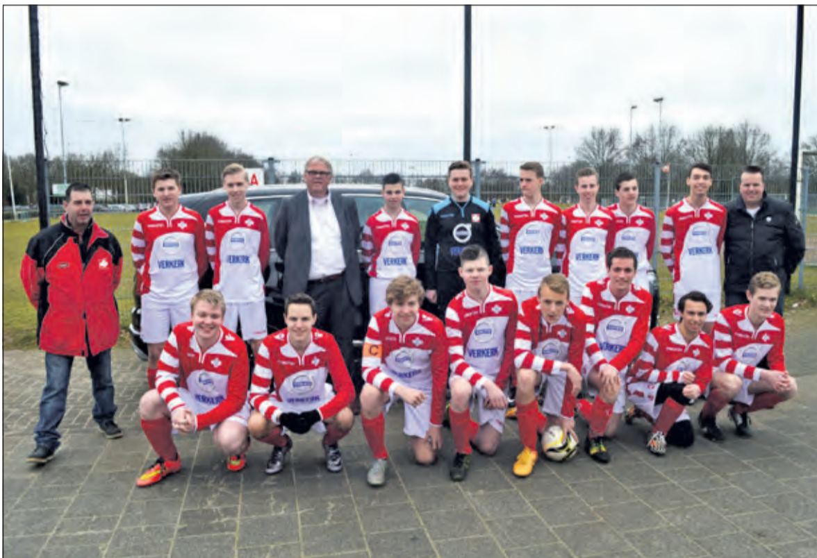
De spelers van de B4 van FC De Bilt hebben van sponsor Volvo Verkerk nieuwe voetbalshirts en trainingspakken ontvangen. Op de foto staat de heer Verkerk te midden van de voetballers en de leiding van de B4.