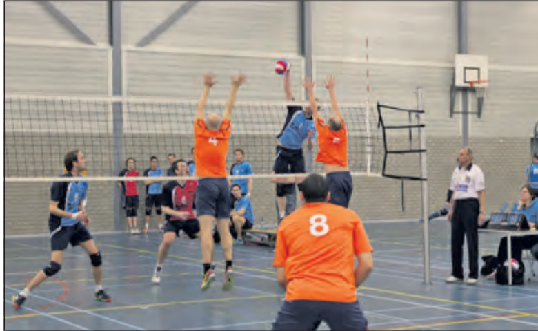
De mannen uit Bilthoven wisten tijdig het tij te keren.

Ondanks het feit dat het er fanatiek aan toe ging, keek Irene richting het einde van de vierde set toch tegen een flinke achterstand aan. Onder aanmoediging van het thuispubliek wisten de mannen uit Bilthoven door een sterke blokkering in combinatie met een tactische service het tij te keren: het werd 2-2 en er moest een beslissende vijfde set gespeeld worden. In deze set liet Irene zich van zijn beste kant zien en met de stand van 15-10 was de 3-2 winst alsnog binnen. De volgende wedstrijd op het programma is op zaterdag 2 april uit tegen VV Amsterdam HS 1. (Erik Vos de Wael).