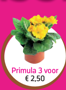
Primula 3 voor € 2,50