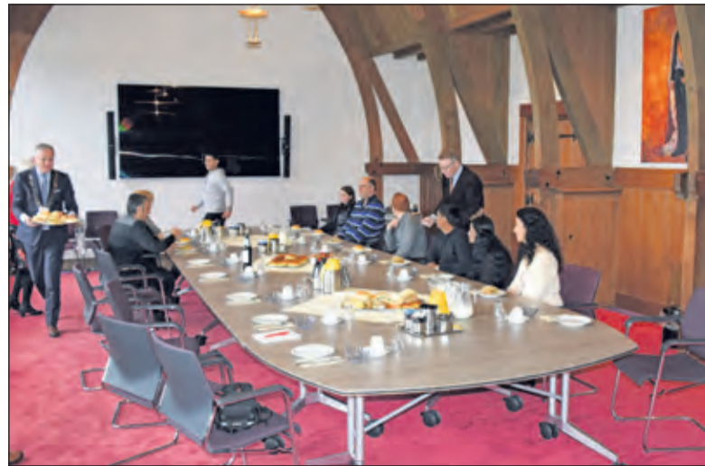
Lunch op het gemeentehuis.