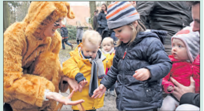
De mand van de paashaas wordt gevuld met de gevonden eitjes.

Er werd geknutseld, geschminkt, buiten gespeeld en ouders konden gezellig bijpraten met koffie, thee en natuurlijk paasstol. Ondertussen had de paashaas een heleboel eitjes verstopt in de bostuin. Enthousiast gingen de kinderen op zoek en brachten alle eitjes naar de mand van de paashaas. Zo werden alles eerlijk verdeeld en kreeg iedereen bij het naar huis gaan wat eitjes mee.