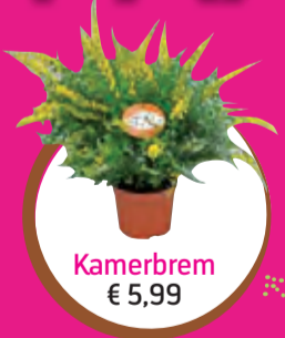
Kamerbrem € 5,99