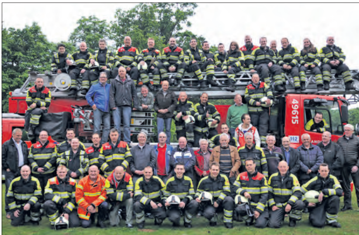
De leden van de jubilerende Biltse brandweer samen met hun oud leden.

het soms niet veel gescheeld. Om dit soms moeilijke werk in zware omstandigheden te kunnen doen moeten de leden elkaar blind kunnen vertrouwen wanneer de nood aan de man is. Hiervoor is de jubilerende Biltse brandweer vereniging al die jaren het bindende element