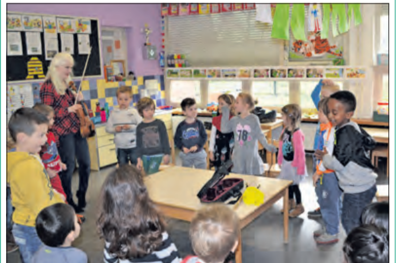
Vol aandacht voor de viool.

Op de Rietakker wordt talent en de ontwikkeling hiervan gestimuleerd. Daarom hebben ouders, opa's en oma's, vrienden of bekenden een workshop gegeven of wat verteld over hun talent, bijvoorbeeld hun beroep, over de geschiedenis, over iets wat ze kunnen maken of een leuke hobby. In elke klas kwam een gast zijn of haar talent zien. Zo werd er o.a. viool en cello gespeeld, geschaakt, gejongleerd, vertelden de postbode, de architect en de maker van video filmpjes over hun werk, kregen de kinderen les over DNA, massagetechnieken, 'van fouten maken kun je leren' en Russisch.