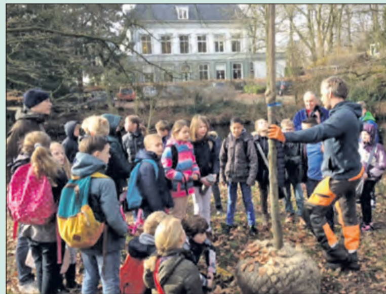
Leerlingen van de Nijepoort luisteren aandachtig voorafgaand aan het planten van de tamme kastanje.