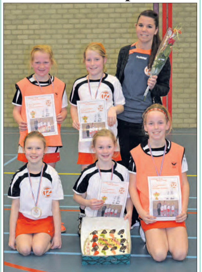
TZ E2 is een meidenteam dat er elke week voor gaat en dat resulteerde in een ongeslagen kampioenschap. Zaterdag 12 maart speelden zij tegen Synergo dat nog wel enigszins bij bleef in de eerste helft. In de tweede helft liepen de meiden echter gemakkelijk uit naar een hele mooie voorsprong waardoor het kampioenschap niet meer in gevaar kwam.