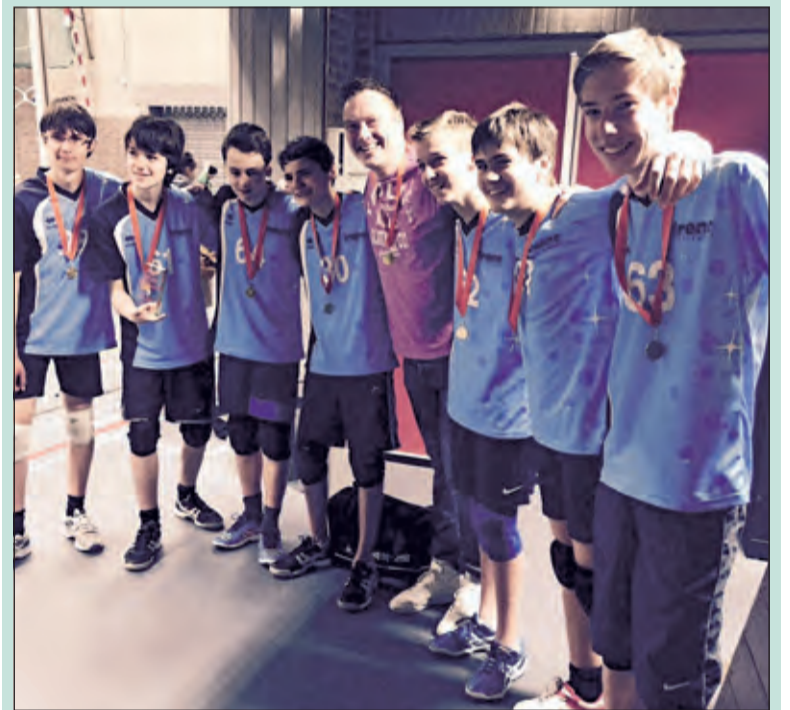
Het team werd beloond met beker, taart en promotie naar de 1e klasse.