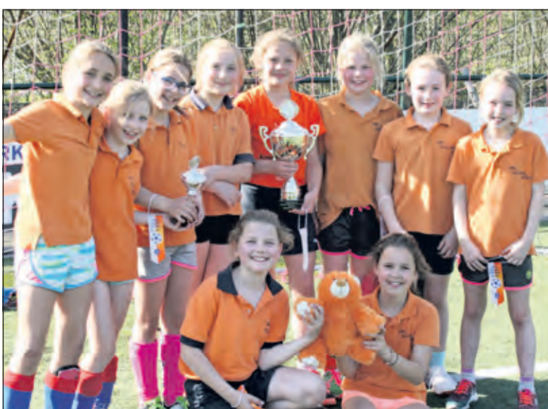
Julianaschool 4: winnaar bij de dames.

Aanvang 13.00 uur en prijsuitreiking om ongeveer 17.30 uur. Deze prijsuitreiking zal verricht worden door Joost Broerse, speler en aanvoerder van Bekerwinnaar PEC Zwolle. Toeschouwers ook nu weer van harte welkom.