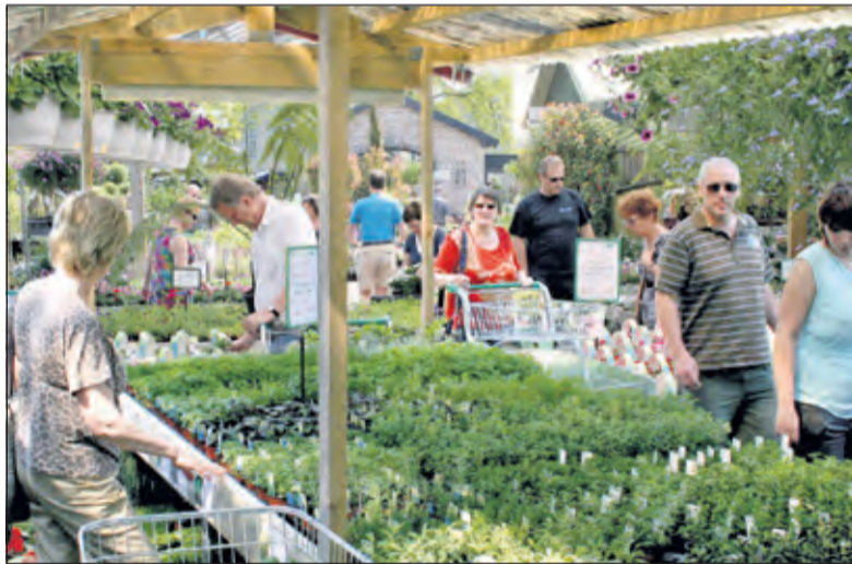
Maandag 27 april is het dubbel feest, want terwijl de druk bezochte plantenmarkt plaatsvindt zijn er op de 2e parkeerplaats van 't Vaarderhoogt de Koningsdag Kinderspelen in samenwerking met het Oranjecomité.

van start gaat krijgen alle kopers bij een bepaald bedrag één van de vier kwartetvouchers. Deze vouchers zijn later in dit jubileumjaar van grote waarde.