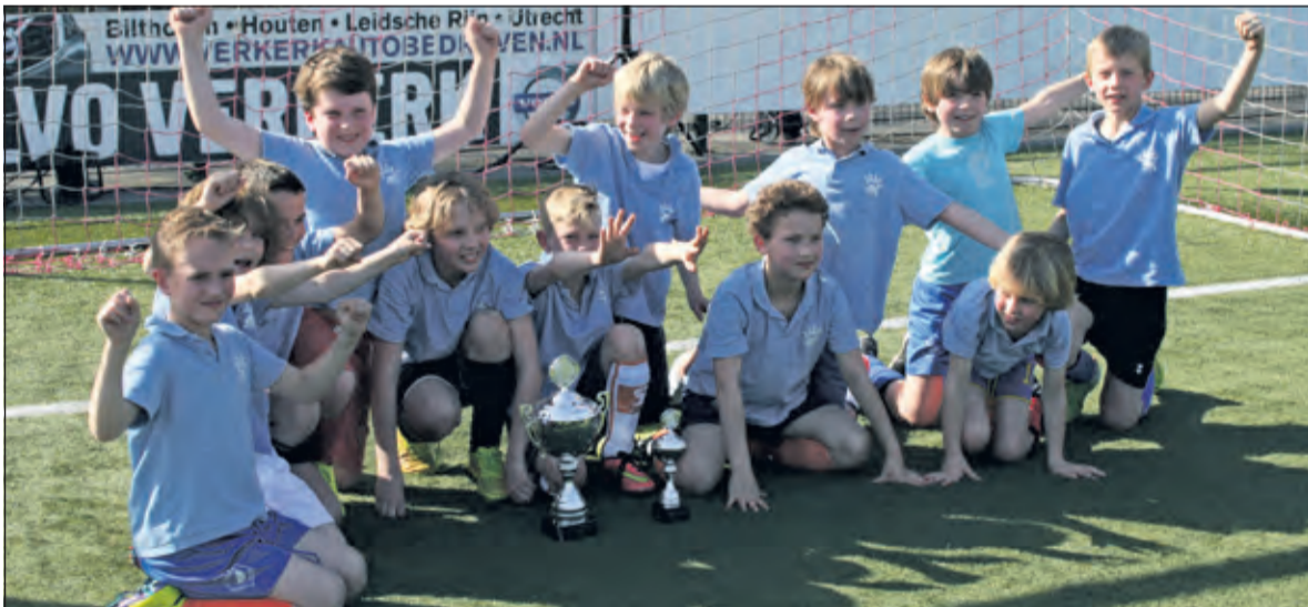
Theriaschool 2: winnaar bij de heren.

De vele toeschouwers konden genieten van leuke wedstrijden. Bij de prijsuitreiking konden zich opstellen: meisjes 1e plaats: Juliana 4, 2e plaats: Nijepoort 3 en de 3e plaats: Regenboog 2. Bij de jongens: