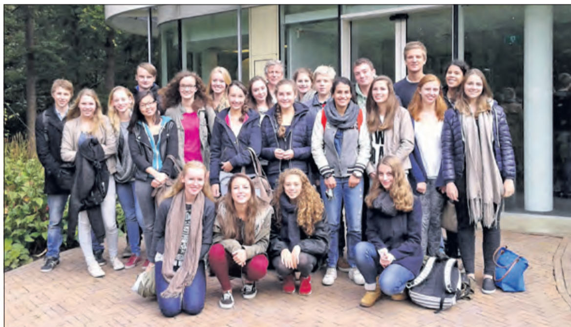
Een groep van 25 werkers zet zich actief in als ambassadeur en werkt in kleinere groepjes aan de organisatie van verschillende evenementen.

cember 2013 heeft de school een samenwerkingsverband met het HDI. Dit is al het 2e diner dat zij organiseren voor het HDI. Ook was er afgelopen december een muziekavond.