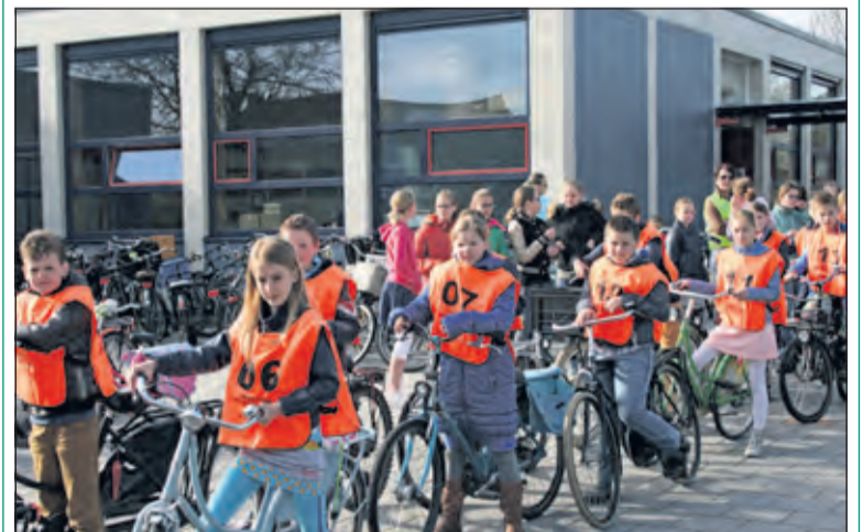
Leerlingen in spanning voor het verkeersexamen.

Ook de ouders op de controleposten hebben een training gevolgd om de langsfietzende leerlingen goed te kunnen beoordelen. Aan het eind van de fietrit ontvingen de leerlingen een appel en een pakje drinken, geleverd door resp. Landwaart en Jumbo Maartensdijk. Maandag 20 april startten 500 leerlingen van de basisscholen in Bilthoven en De Bilt vanaf het gemeentehuis.