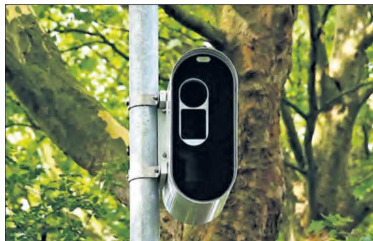
De nieuwe flitsers vergen minder politiecapaciteit omdat ze 24 uur per dag aan staan en de verwerking van boetes sneller gaat.

De digitale flitspaal controleert zowel op snelheid als op door rood licht rijden. Het Openbaar ministerie laat de komende jaren in het hele land een groot deel van de analoge flitspalen vervangen door digitale palen.