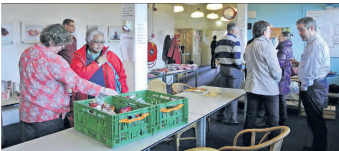
Zaterdag konden belangstellenden een kijkje nemen bij de Voedselbank aan de Molenkamp. Daar werd duidelijk hoeveel vrijwilligers zich belangeloos inzetten voor mensen met een smalle beurs.