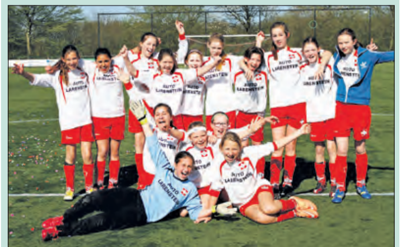
De meiden van FC De Bilt MD1 zijn blij met hun overwinning.