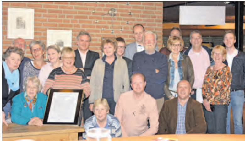
De avond straalde een grote onderlinge verbondenheid uit.

In een verklaring van de korfbalverenigingen TZ en DOS wordt gezegd, dat hun uitgangspunt is dat er een accommodatie moet komen die voor beide verenigingen 'zowel in kwalitatieve als kwantitatieve zin voldoet en bovenal ook betaalbaar is en blijft'. Beide verenigingen vinden