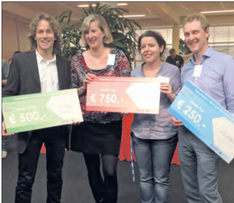
Aan de prijs is een geldbedrag van 500 euro verbonden, dat ingezet kan worden voor de verbetering van het bèta-onderwijs. Hoogstwaarschijnlijk gaat de school hiervoor een 3d-printer aanschaffen.