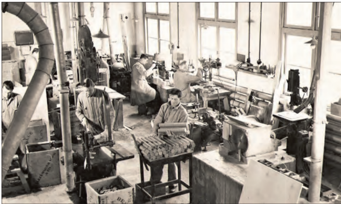
De werkplaats van arbeidstherapie voor tuberculosepatiënten.