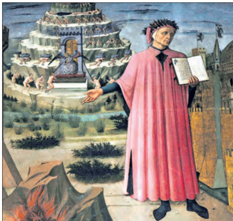
Dante met de Divina Commedia in de hand, tempera op doek (1465), Domenico di Michelino, Santa Maria del Fiore, Florence.

De lezing is op maandag 26 oktober om 20.00 uur in Huize Het Oosten, Rubenslaan 1-3, Bilthoven (hoek Jan Steenlaan). Toegangskaarten zijn aan de zaal verkrijgbaar.