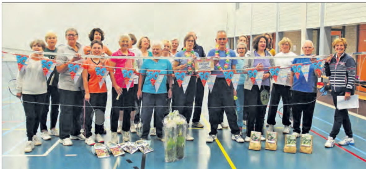
De deelnemers aan het bloembollentoernooi maken er dubbel feest van.

Ook dit jaar werd voor de donderdagmorgen-badmintonners het bloembollentoernooi gehouden. Dit keer was het een feestelijk gebeuren.