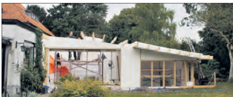
Bij dit huis aan de Overboslaan zijn diverse energiebesparende maatregelen genomen waaronder een vegetatiedak. Voor energieopwekking wordt gebruik gemaakt van zonnepanelen.