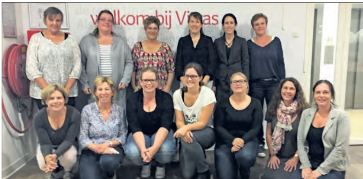
De HBO-V klas van Vitras.

Vitras biedt thuiszorg, maatschappelijk werk, jeugdgezondheidszorg en gerelateerde diensten op het gebied van zorg, hulpverlening, advies, service, ondersteuning en hulpmiddelen. Vitras biedt deze diensten in de provincie Utrecht in de gemeenten Bunnik, De Bilt, Houten, Lopik, Nieuwegein, Renswoude, Rhenen, Scherpenzeel, Utrechtse Heuvelrug, Veenendaal, Wijk bij Duurstede, IJsselstein en Zeist.