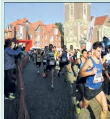
De Citylauf in Coesfeld telde slechts 4 Biltse deelnemers.

Op deze dag werd in Coesfeld de jaarlijkse Citylauf gehouden. De lopers konden kiezen uit 5 of 10 kilometer hardlopen. Vanuit De Bilt waren vier hardlopers meegereisd. Zij deden 's middags mee aan 5 kilometer hardlopen en waren uiterst tevreden over de organisatie van de loop. Volgens hen werden ze goed opgevangen en begeleid en stonden langs de kant enthousiaste mensen om ze aan te moedigen.