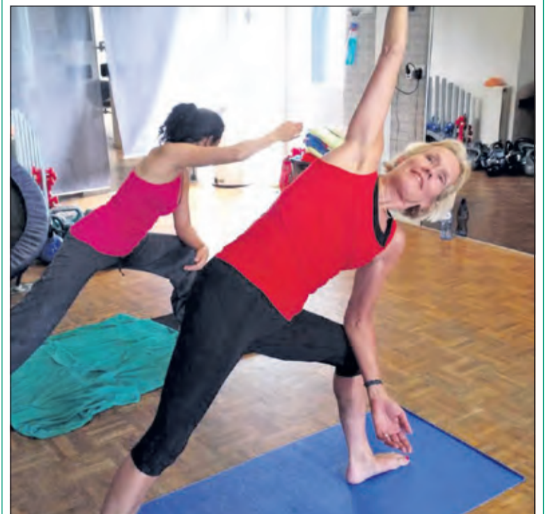
Er zijn meer yogavormen dan je denkt

Morning yoga is een les van 45 minuten waar je een heerlijk balans vindt tussen ontspanning en oefeningen die goed zijn voor je hele lichaam. Door de opbouw van de les wordt er gezorgd dat de kracht en lenigheid wordt verbeterd in het lichaam, dit allemaal op een ontspannend niveau met veel ademhalingstechnieken. Neem contact op voor een gratis proefles.