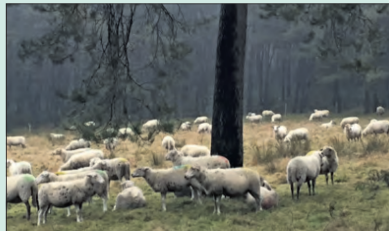
De schaapskudde van het Goois Natuurreservaat graast deze dagen op een weide direct ten noorden van Hollandsche Rading langs het fietspad naar het Wasmeer. Een oudhollands tafereel. [Rob Klaassen]