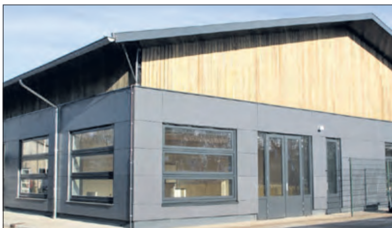
De gemeentewerf is te bezoeken. Er is daar geïnvesteerd in ventilatie, koeling en zonwering. Voor energieopwekking is gekozen voor een warmtepomp en zonnepanelen.