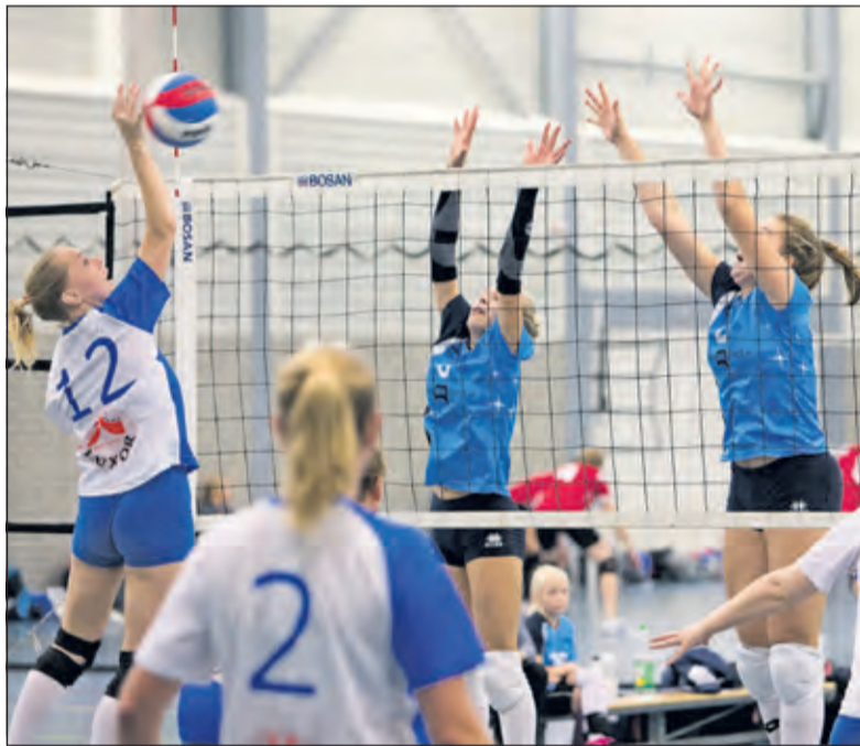
Met gevarieerd spel en druk aan het net haalt Irene de winst binnen.

Woensdag, 21 oktober (vanavond) speelt Irene D1 de eerste wedstrijd in het bekertoernooi tegen Lovoc D1 in Loosdrecht. Op zaterdag 24 oktober speelt Irene D1 in de reguliere competitie tegen de nummer 2 van de competitie Leython DC D2 in Leiderdorp. Irene staat in punten gelijk met Leython, maar heeft een wedstrijd meer gespeeld.