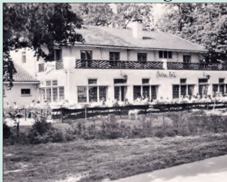
Beeldbepalend voor de Utrechtseweg, ook al in 1963. De tentoonstelling is in 2016 ook in de Biltsche Hoek te bezichtigen. (lees meer op pag. 13)