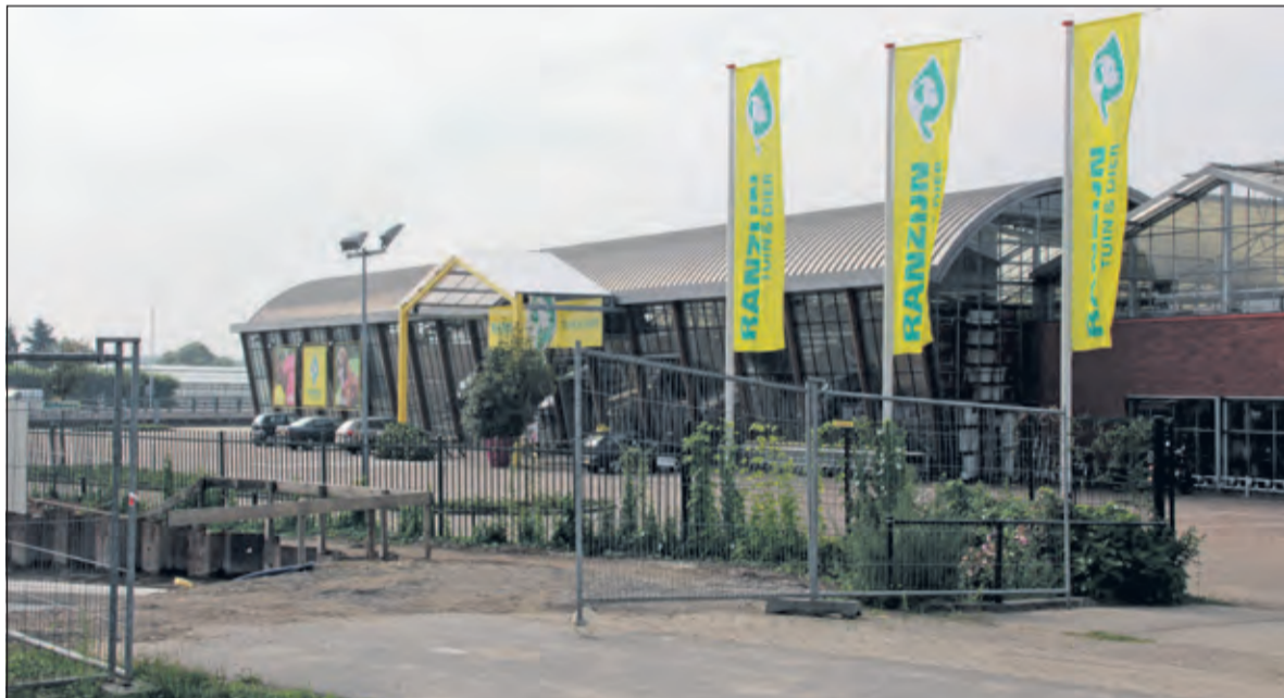
Tuincentrum, dierenbenodigdheden én dierenarts op de Universiteitsweg 2 blijft stof voor discussie.

heeft gevraagd aan welke verkeersnormen er is getoetst en noemt de economische onderbouwing onvoldoende. De opvatting van het college dat dierenactiviteiten passen in het huidige bestemmingsplan deelt de bezwarencommissie niet. 'We waren ervan overtuigd dat het begrip tuincentrum dat wel toeliet', aldus wethouder Mieras bij de beantwoording van de vragen.