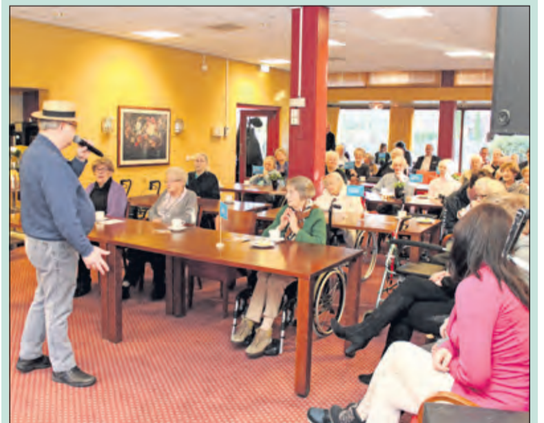
Het was zichtbaar genieten van beide kanten.