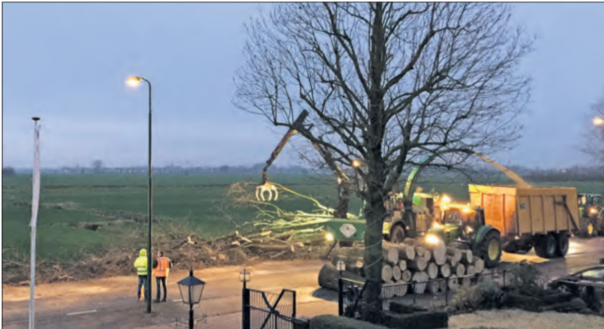
In alle vroegte was het (af-)zagen van de populieren begonnen.

Vrijdag 15 januari liet de gemeente De Bilt langs de Koningin Wilhelminaweg in Groenekan 21 populieren rooien om te vervangen door iepen. De oude populieren laten bij harde wind gemakkelijk takken vallen, met alle risico van dien voor het verkeer op deze provinciale weg.