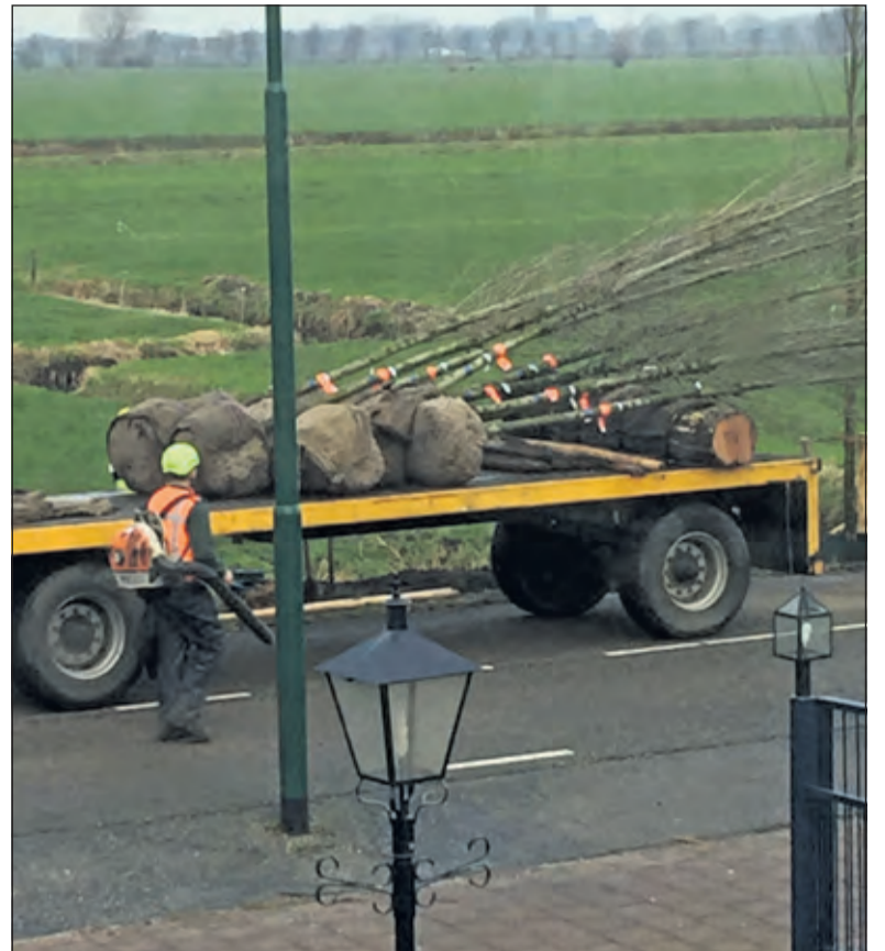
De nieuwe iepen waren eveneens in alle vroegte aangevoerd om in de een dag van tevoren gegraven gaten te worden geplant.