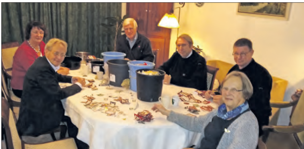
Lions nijver waardepunten tellend bijeen. De emmers waarin de diverse soorten punten worden verzameld staan op tafel.