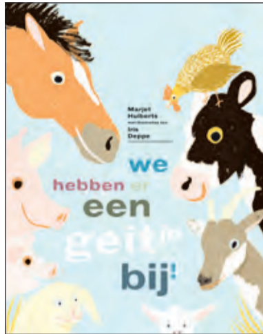
Prentenboek van het jaar.

Kinderen tot en met 6 jaar die tijdens de Nationale Voorleesdagen lid worden van de Bibliotheek,