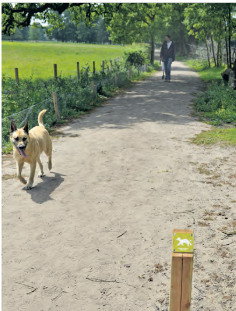
Naast fiets-, wandel en ruiterspaden voortaan ook hondenwandelpaden.

Meer over ons hondenbeleid en veel gestelde vragen daarover leest u op www.utrechtslandschap.nl/ .