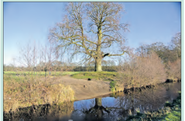
Het was zondag (al) een beetje winter in De Bilt. Bij Beerschoten kon het eerste winterse plaatje worden geschoten. Het ijs lag op sommige plaatsen nog op het water. Een voorbode van een aanstaande echte winter?