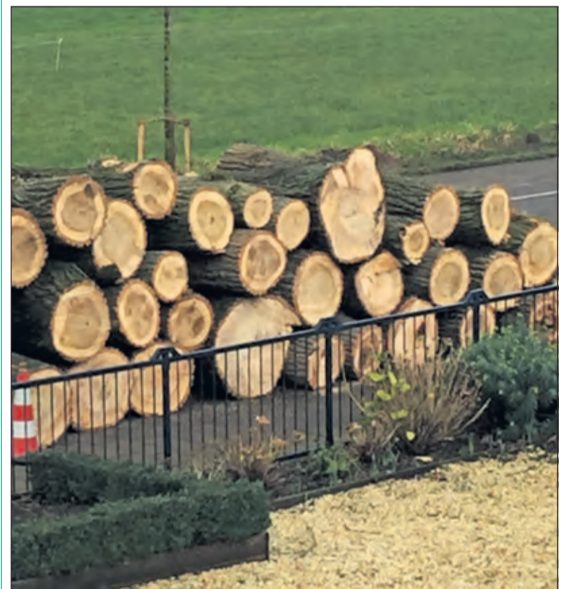
Een fraai aanzicht van de oude bomen; klaar om afgevoerd te worden.

langs een derde deel van de weg; de overige bomen (essen en iepen) zijn gespaard gebleven. Het is gelukt in één dag de bomen te rooien, de stobben (achterblijvende deel van de stam in de grond) eruit te frezen en de nieuwe bomen te planten. De Koningin Wilhelminaweg (tussen de Nieuwe Weteringseweg en de Groenekanseweg) was vrijdag tussen 6.30 en 17.00 uur afgesloten voor alle verkeer. [HvdB]