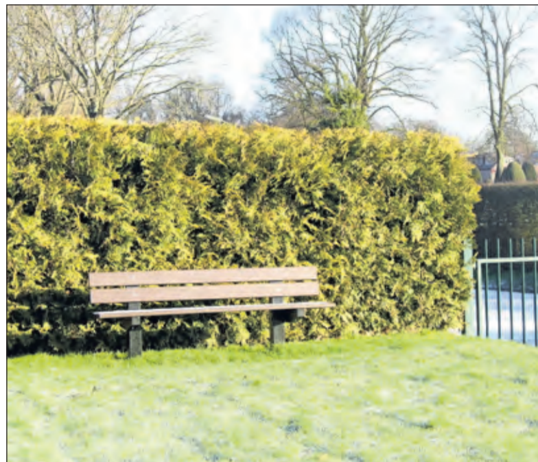
Er is een bankje geplaatst op de Algemene Begraafplaats Maartensdijk dat mogelijkheden biedt om te mijmeren en te overdenken.

maat. Het fraaie beeld van Omer Gielliet dat het middenpad afsluit heeft al velen aan het denken gezet. Omer gaf het aanvankelijk als titel - De worsteling met de engel - mee, maar in de beleving van het bestuur van de begraafplaats en vele bezoekers zegt het vooral iets over de worsteling van het leven en de worsteling met het leven zelf.