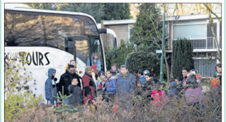
Dankzij de sponsorloop van Het Nieuwe Lyceum in oktober konden vele vluchtelingen een dag hun misère vergeten in de Efteling'

Leerlingen van Het Nieuwe Lyceum zamelden met een sponsorloop geld in om kinderen met een vluchteling-achtergrond een uitje te bezorgen. Zondag 17 januari gingen 39 kinderen + 20 volwassenen + 5 'leiding' met een bus naar de wondere wereld van de WinterEfteling. [WE]